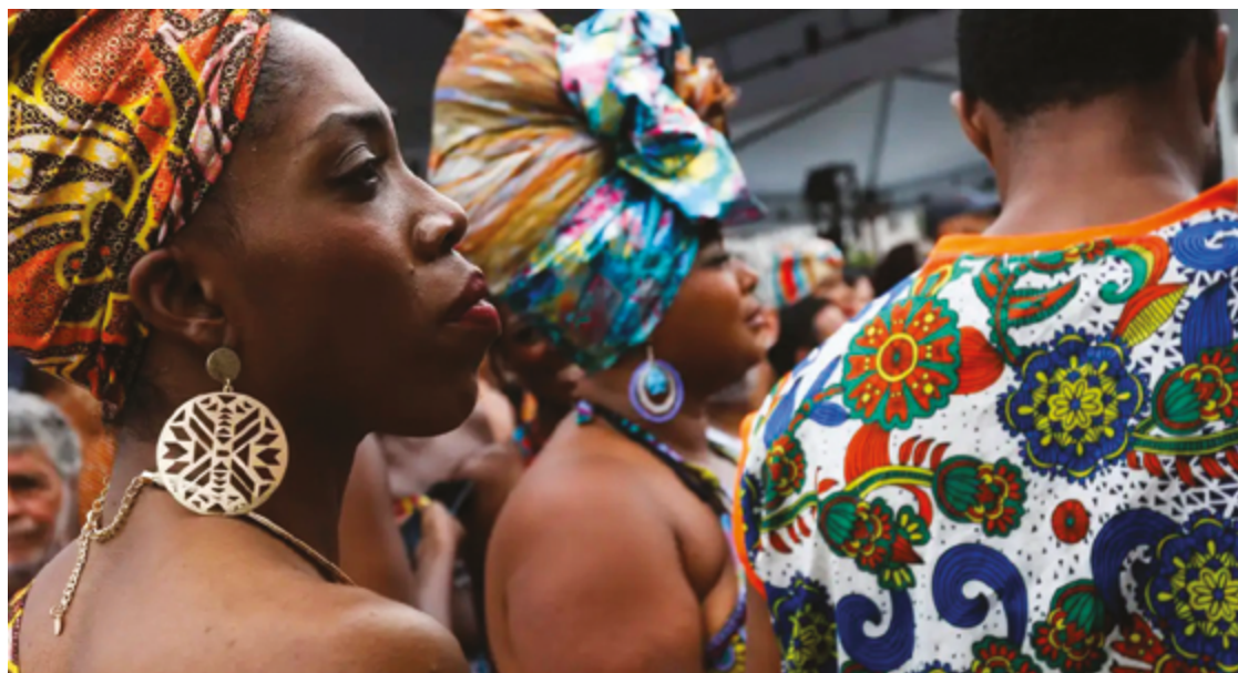
O mapeamento tem como foco principal a construção de políticas públicas mais eficazes, voltadas à inclusão produtiva e à promoção da igualdade de oportunidades no mercado

O projeto integra o Goiás Social, programa estadual que articula ações em diversas áreas com foco na inclusão social e na redução das desigualdades no estado.