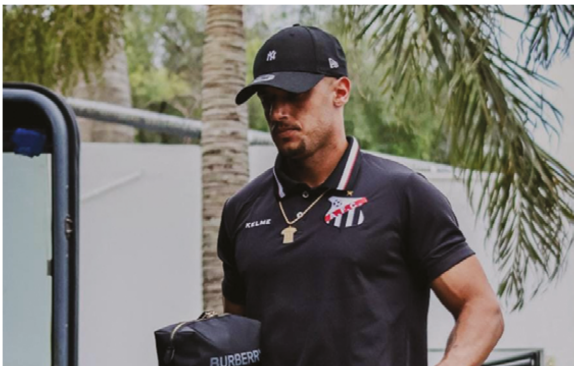
Após uma campanha consistente no Campeonato Goiano, o Tricolor da Boa Vista inicia sua jornada na Série C

Para o confronto contra o CSA, a provável escalação do