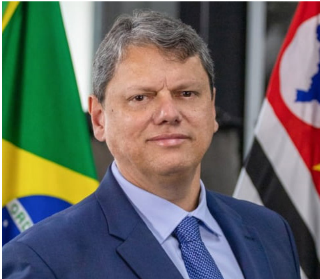
Tarcísio Freitas lidera a corrida sucessória para o governo de São Paulo com 41%

No cenário com Márcio França (PSB), ministro do Empreendedorismo e também ex-governador,