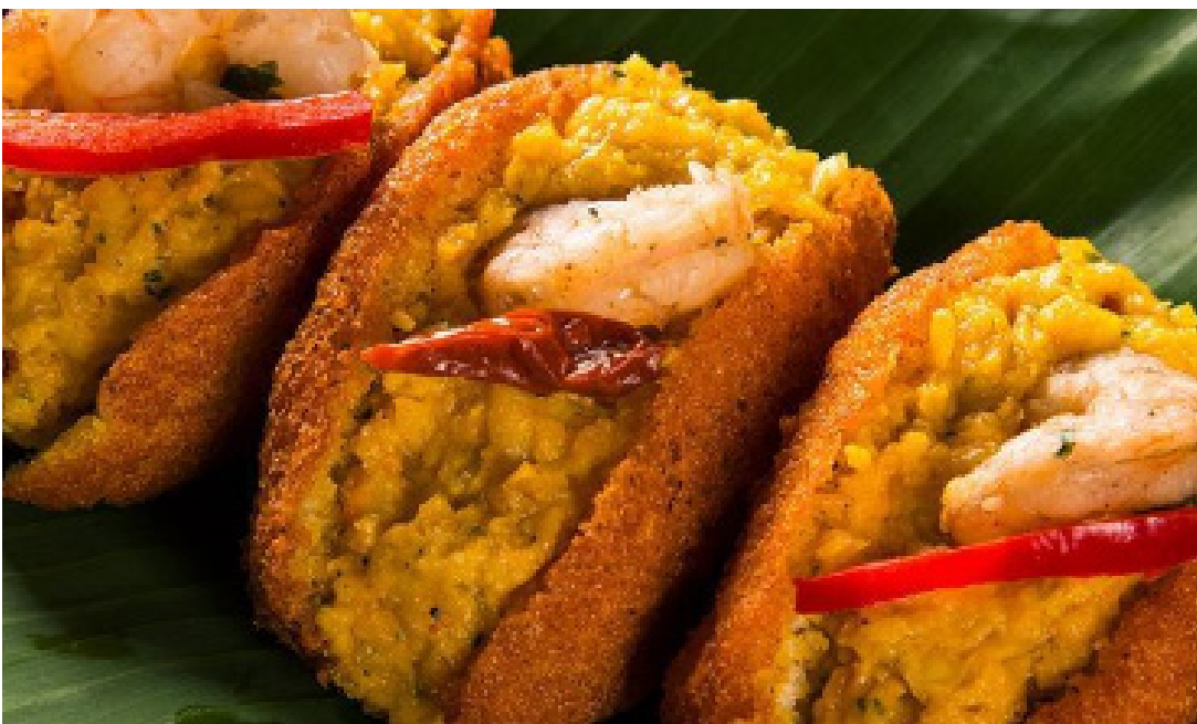
Poesia da comida de rua: acarajé espera com seu altar de dendê e devoção

Na calçada quente, entre o cheiro do milho assado, da carne na brasa e das mãos que carregam memórias em forma de comida, é que o Brasil revela seu verdadeiro tempero