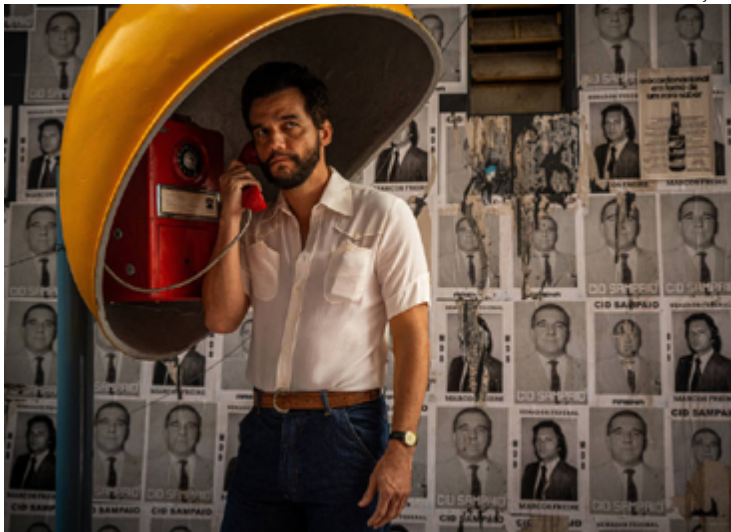
Ator baiano interpreta o protagonista Marcelo em longa-metragem

Com Wagner Moura, 'O Agente Secreto' está na seleção oficial do festival francês, onde faz estreia