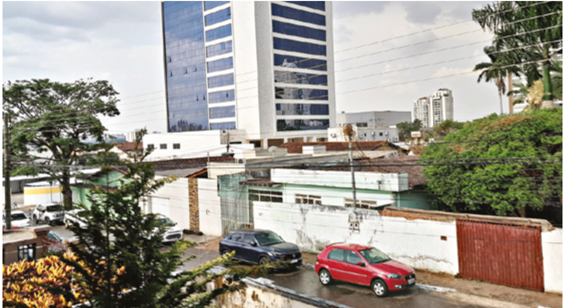
Na sexta-feira (11), o tempo segue com sol e aumento de nuvens ao longo do dia

Já no domingo (13), o cenário muda: a previsão é de sol com muitas nuvens e pancadas de chuva à tarde, seguido por tempo chuvoso à noite. A mínima cai para 18 °C, e a máxima desce para 26 °C, com umidade de 75%.