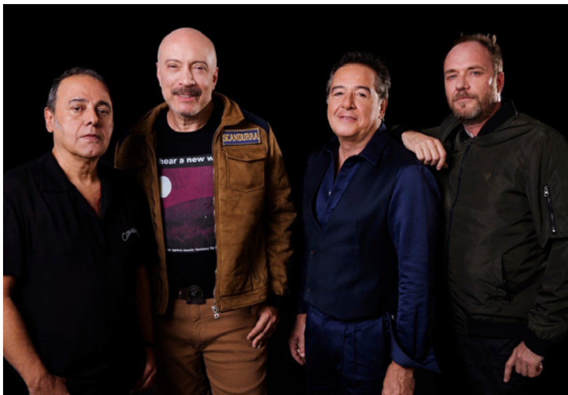
Banda paulistana está na estrada com turnê que celebra 20 anos do 'Acústico MTV'

alegou que não havia outra saída a não ser desmarcar as apresentações em Jaraguá do Sul (SC), Blumenau (SC), Caxias do Sul (RS) e Pelotas (RS).