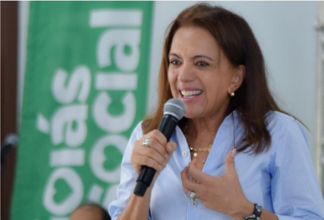
Gracinha Caiado comanda novo Goiás Social na região Norte: entrega de 1.580 benefícios sociais