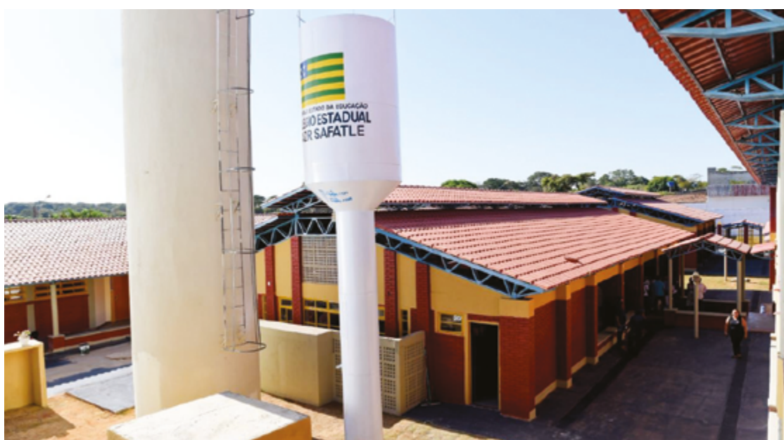
A escola será construída em uma área pública oficialmente cedida pela Prefeitura de Anápolis ao Estado de Goiás

A escola será construída em uma área pública oficialmente cedida pela