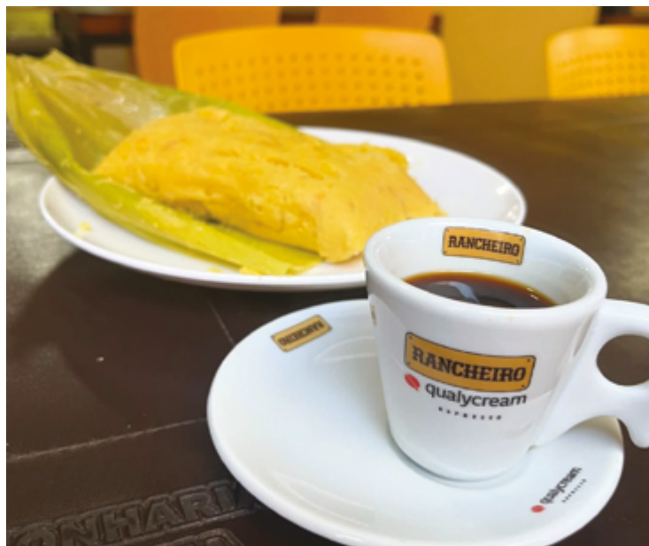
Nos dias mais frios e chuvosos, nada como o aconchego de uma pamonha quentinha

Com décadas de tradição, é conhecida pelo tempero caseiro e o ambiente acolhedor. Além das clássicas pamonhas doces e salgadas, o cardápio oferece caldos e sucos naturais. Ideal para quem quer comer bem e se sentir em casa.