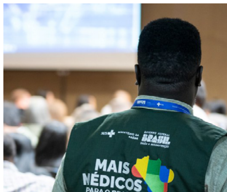
A maior parte das vagas goianas está concentrada em municípios considerados de alta ou média vulnerabilidade — 49 ao todo

O Mais Médicos conta hoje com cerca de 24,9 mil médicos em atuação em mais de 4 mil municípios brasileiros. A meta do governo é chegar a 28 mil profissionais em todo o território nacional. Em Goiás, municípios interessados ainda podem ingressar por meio de cadastro reserva, mecanismo que garante reposição rápida em caso de novas demandas.