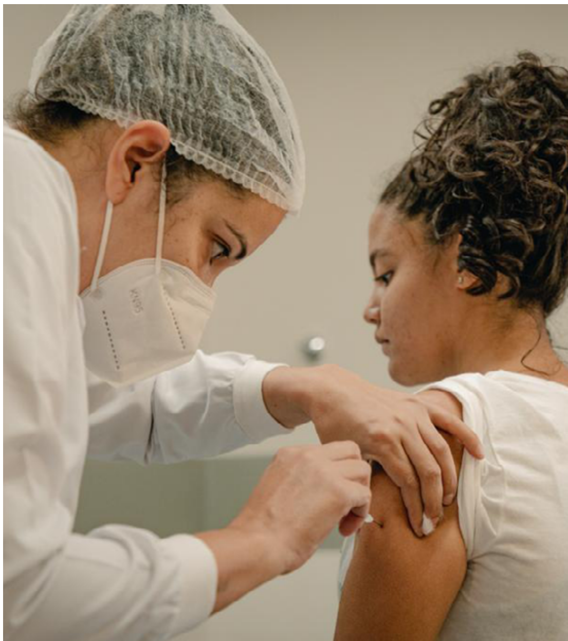
A campanha, iniciada em 7 de abril, segue voltada aos públicos definidos pelo Ministério da Saúde