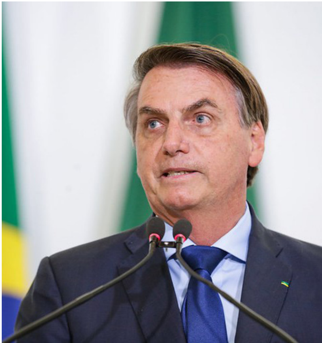
O ex-presidente Jair Bolsonaro também está no olho do furacão do escândalo do INSS

O desconto de mensalidades de associações e sindicatos vem de governos anteriores, mas atingiu patamares bilionários após 2022, explodindo durante o governo Lula, com movimentações políticas no Congresso que impe-