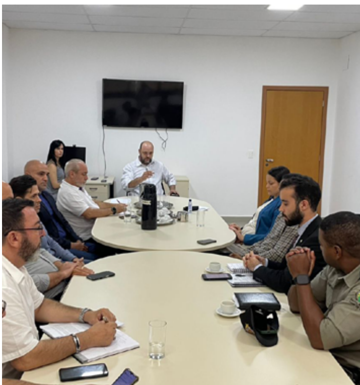
“Mudar a lei não pode. Vai ter que se adequar”, resumiu o promotor

Está prevista uma nova reunião no período de um mês para que a questão seja tratada de forma definitiva.