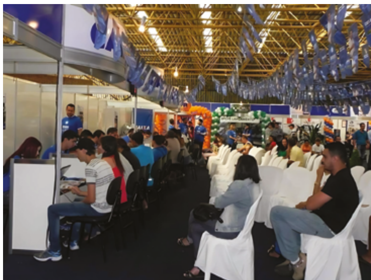
O evento também será uma oportunidade para esclarecer dúvidas sobre as recentes atualizações no programa Minha Casa, Minha Vida

na Praça Dom Emanuel, é organizado com o apoio de entidades como a Associação Comercial e Industrial de Anápolis (ACIA), Associação das Imobiliárias de Anápolis (AIA), a Associação dos Construtores de Anápolis (ACAN), a Câmara Municipal, a Prefeitura de Anápolis, a Federação das Indústrias de Goiás (FIEG) e o Sindicato do Comércio Va-