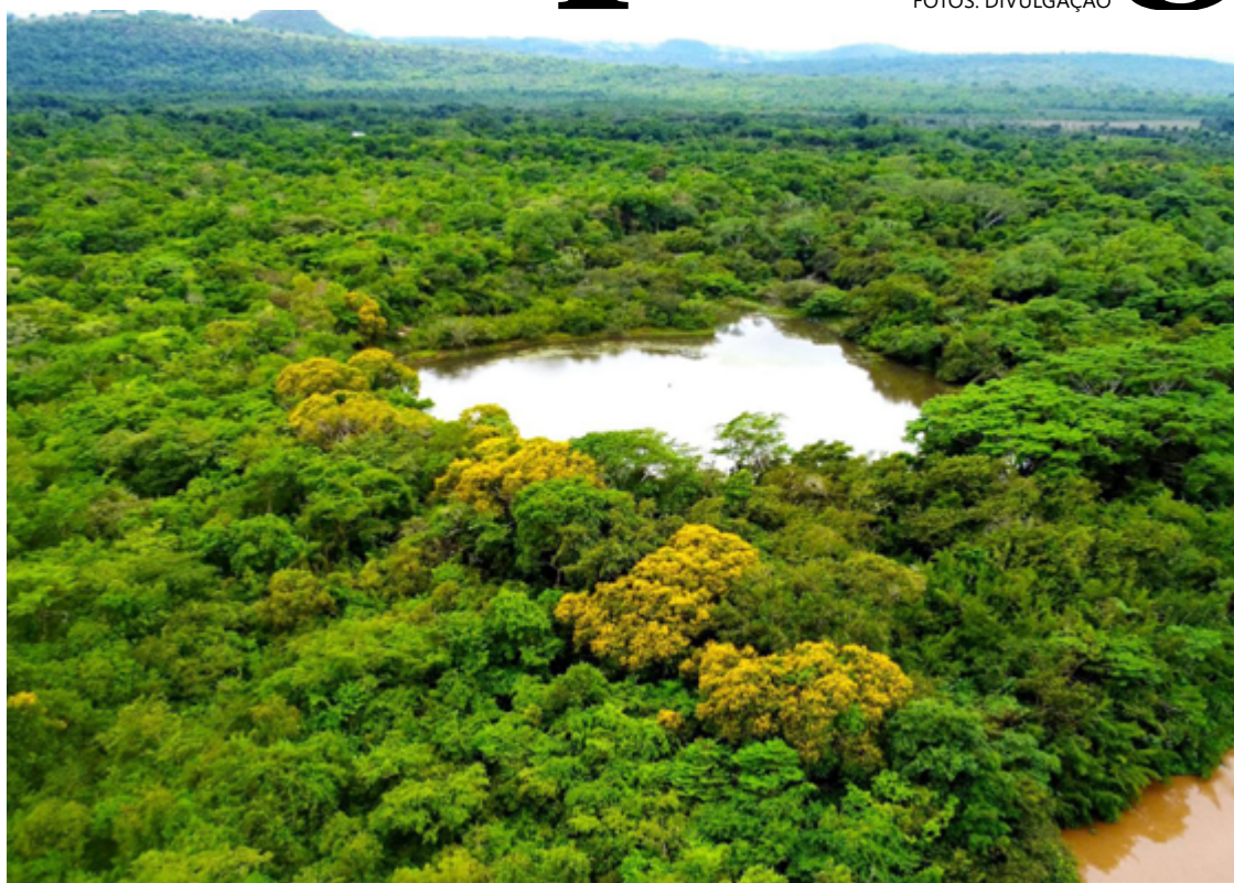
Área da reserva ambiental tem 171 hectares e foi adquirida por sócios em 1998

Os desafios, contudo, logo surgiram. Queimadas fora de época tiveram que ser combatidas com o apoio do Ibama, Corpo de