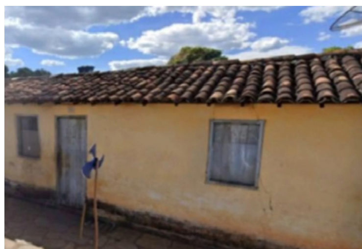
Casa teria importância histórica para Pirenópolis: Iphan autuou responsável pelo imóvel