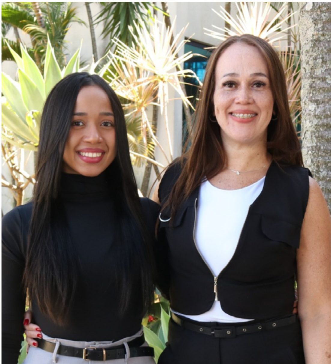
Segundo mãe e filha, trabalhar juntas exige equilíbrio para conciliar os diferentes papéis - o profissional e o familiar

- A Bola da Vez (Ficção, 2022) - Direção: Elder Patrick Crianças guiam o espectador por lembranças e paisagens da Cidade de Goiás, resgatando a essência da infância e das relações humanas.