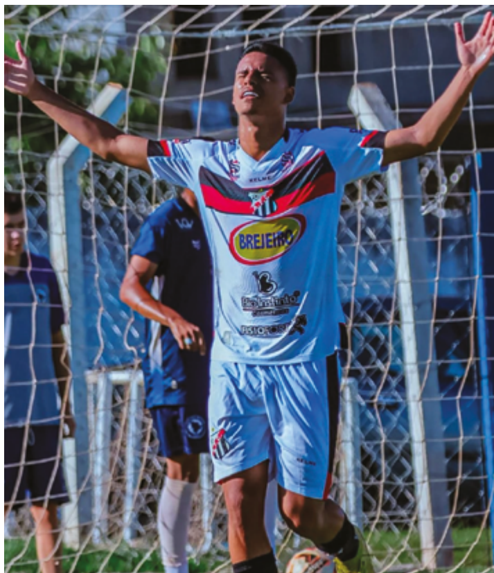
A vitória não foi apenas expressiva no placar, mas emblemática pelo desempenho apresentado

Em paralelo, a rodada teve o Itaberaí SAF como destaque, ao vencer o Jardim América por 7 a 0 fora de casa, garantindo com folga a liderança do Grupo A. A Divisão de Acesso Sub-20 não só define os campeões da competição, mas também os dois clubes que garantirão acesso imediato à Copa Goiás, que será disputada no próximo semestre goiano.