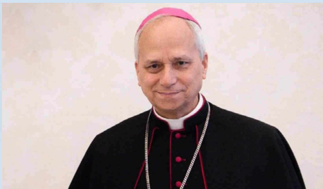
Prevost foi eleito após três rodadas de votação sem definição e alcançou os dois terços exigidos no início da tarde desta quinta-feira, no segundo dia de conclave

Em nota, a Diocese destacou a trajetória pastoral e missionária do novo papa, especialmente sua atuação no Peru. “[O novo papa] traz consigo uma rica trajetória missionária, especialmente no Peru, e uma vida dedicada ao serviço da Igreja. Como Prefeito do