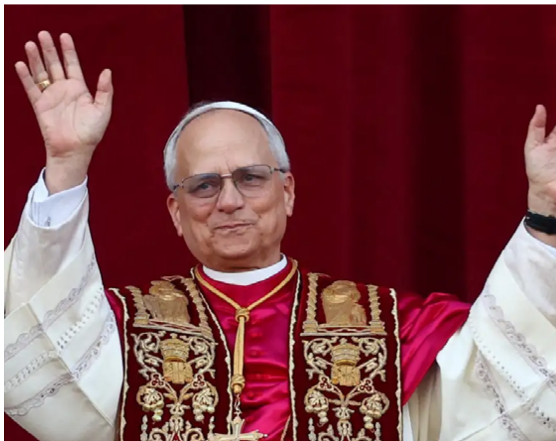
Robert Prevost, chamado de “pastor de duas pátrias”, promete seguir os caminhos do papa Francisco

Especialistas destacam que a escolha de um pontífice dos Estados Unidos era considerada improvável, devido ao peso político do país e à tradição da Igreja em evitar tal nacionalidade no comando do Vaticano. No entanto, a proximidade de Prevost com a América Latina e seu perfil pastoral pesa-