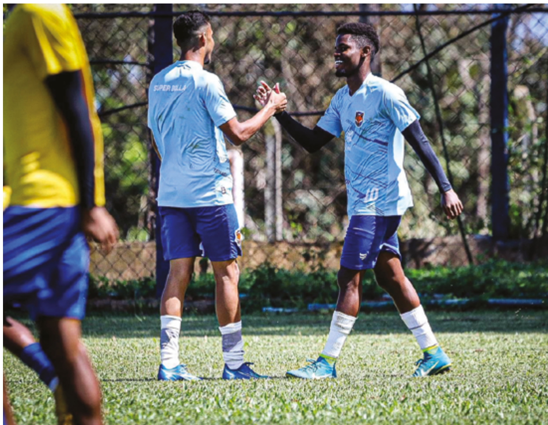
Grêmio Anápolis encerrou a primeira fase do Goianão Sub-20 na sexta colocação, com 17 pontos conquistados em 11 jogos