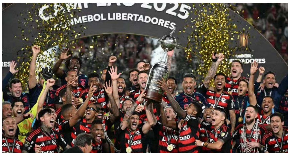
Após conquistar a Libertadores, o clube entrou para o grupo das oito equipes mais votadas