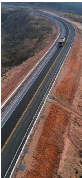
Pavimentação entre Guarani de Goiás e o Parque Terra Ronca será concluída neste mês

A ciclovia passou a ser utilizada antes mesmo da conclusão total da obra. Moradores e visitantes já realizam passeios ciclísticos no trajeto recém-pavimentado. Praticantes de mountain bike também relatam melhora significativa nas condições de acesso ao parque.