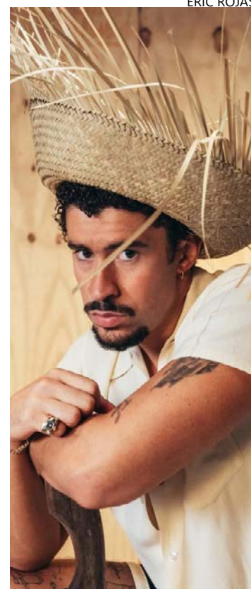
Astro do reggaeton dominou streaming

No Brasil, os sertanejos Henrique e Juliano foram os artistas mais escutados pelo segundo ano consecutivo. Seu álbum, “Manifesto Musical 2 (Ao Vivo)”, foi o de maior sucesso.