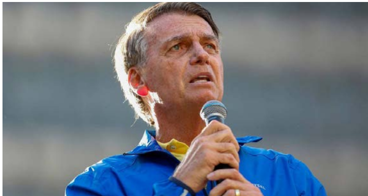
Jair Bolsonaro cumpre pena atualmente na Superintendência da PF

Ex-presidente foi condenado a 27 anos: fim da pena está previsto para novembro de 2052