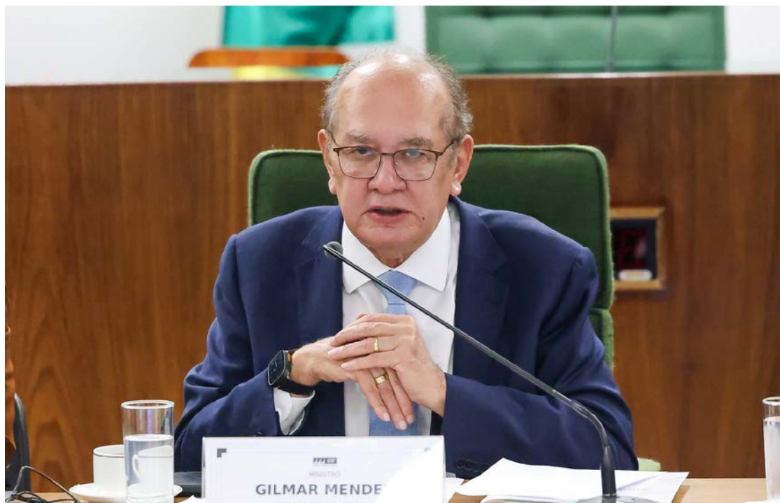
Gilmar Mendes determina que somente PGR pode ingressar com ações contra ministros do STF

A decisão de Gilmar Mendes será levada ao plenário do STF em sessão virtual agendada para começar no próximo dia 12 e