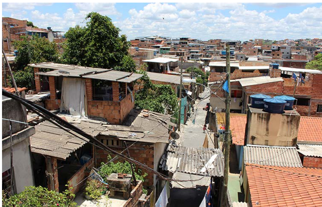
Taxas de pobreza vêm recuando após terem alcançado os maiores patamares da série em 2021

de pobreza vêm recuando, após terem alcançado os maiores patamares da série em 2021, durante a pandemia (36,8% e 9%). Segundo o pesquisador André Simões, tanto o aquecimento do mercado