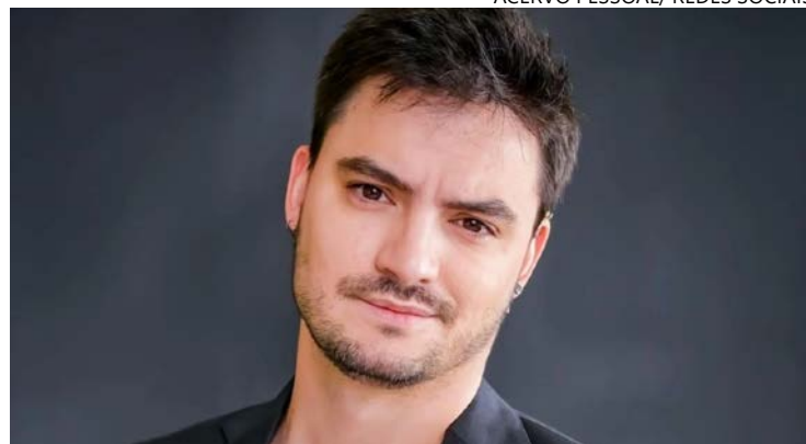
Influencer alerta para desconforto que problema carrega