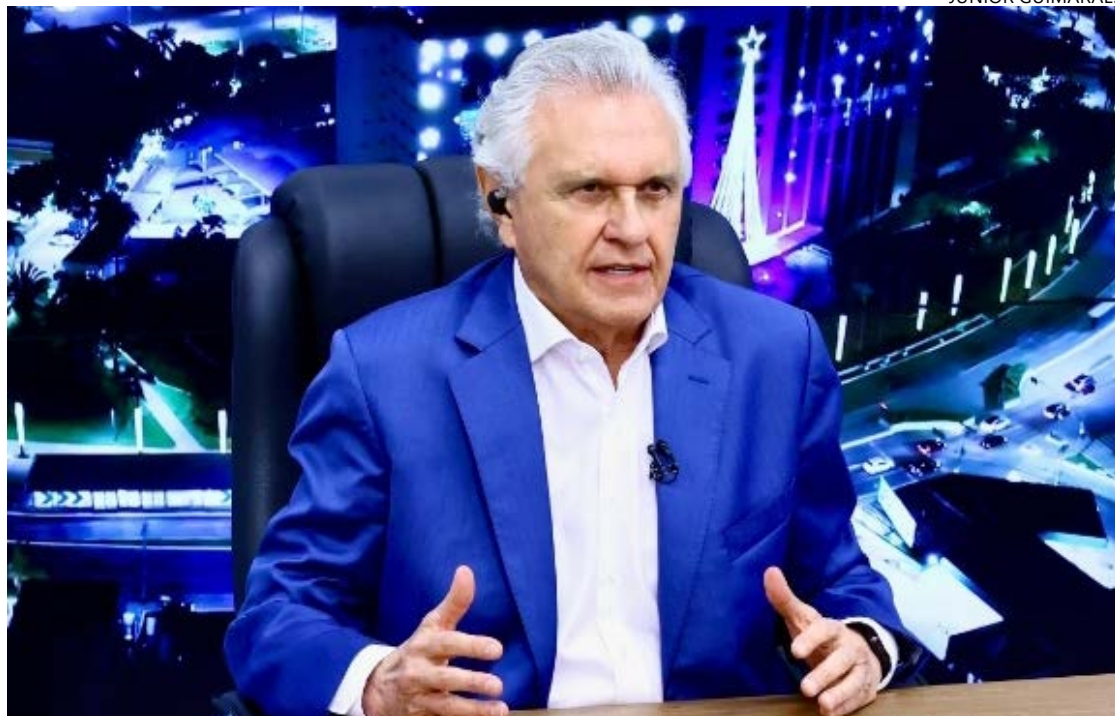
Ronaldo Caiado chama para o debate a gestão federal: postura da União e combate do crime organizado em foco

Caiado também afirmou que há complacência do governo federal com o crime organizado, citando o avanço territorial de facções. Ele mencionou o levantamento Cartografias da Violência na Amazônia para exemplificar a expan-