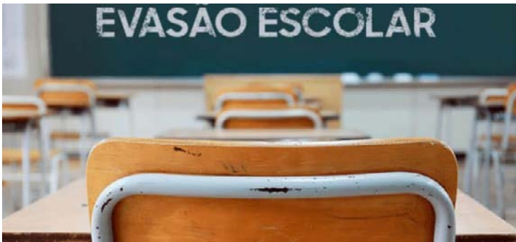
8,4 milhões de jovens não estudavam e não concluíram o ensino médio em 2024

A evasão por trabalho cresce com a idade: 19,9% dos jovens de 15 a 17 anos, 39,6% de 18 a 24 anos e