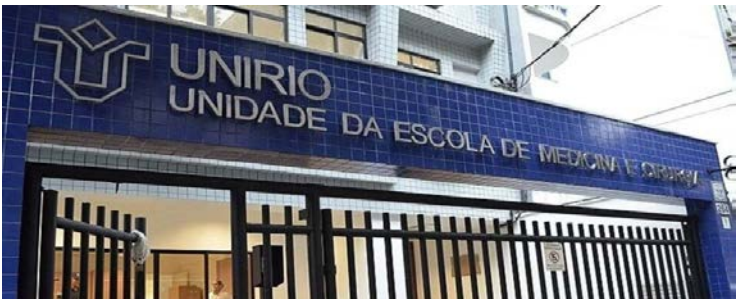
Valor pago financiará bolsas para cotistas na Unirio