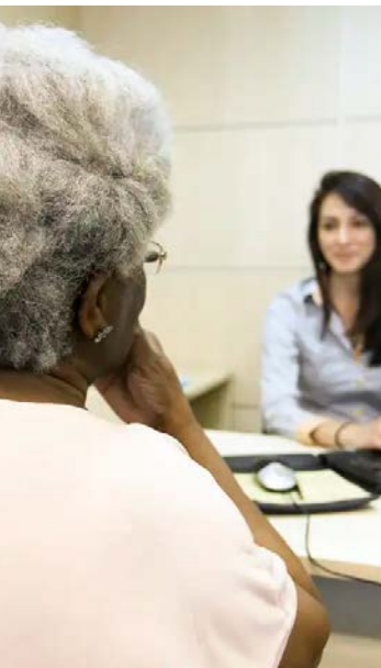
Crescimento veio após melhora do mercado depois da pandemia

O instituto também destacou que o avanço foi registrado após a reforma da Previdência, que entrou em vigor no país em 2019. À época, o nível de ocupação dos idosos era de 23,1%.