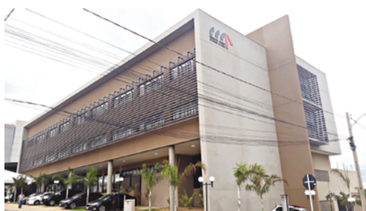
O caso foi levado ao MP depois que houve a retirada de uma resolução, que havia sido publicada no dia 14 de fevereiro

O caso foi levado ao MP depois que houve a retirada de uma resolução, publicada no dia 14 de fevereiro deste ano, que nomeava a mesa-diretora do Conselho Municipal de Defesa dos Direitos da Criança e do Adolescen-