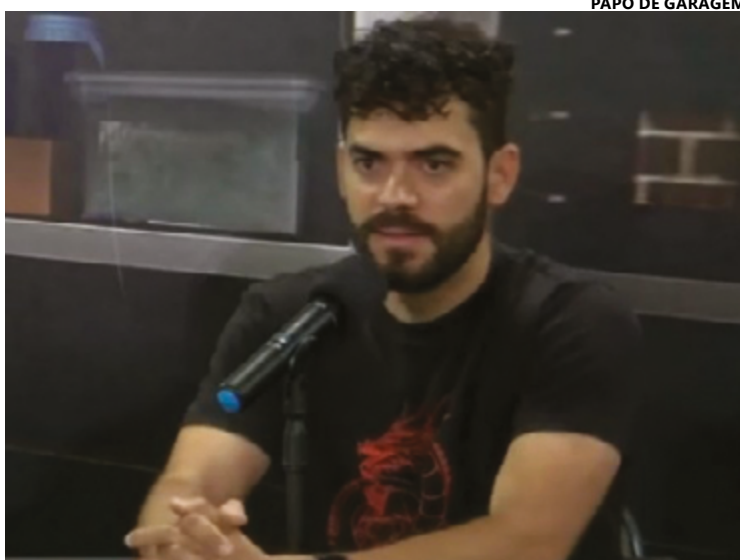
Aurélio revelou que Musk participava ativamente das partes mais complexas da empresa

Ele explicou que iniciou na Tesla com um estágio na Califórnia e, posteriormen-