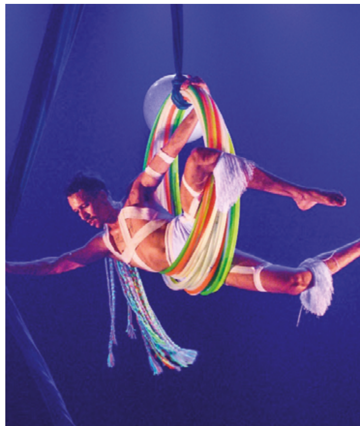
Além das apresentações, Saracura promoverá duas oficinas práticas de manipulação e malabarismo com aros

fundou o Espaço Cultural Rosinha do Brejo, um casarão histórico que abriga um hostel e um galpão para apresentações circenses, teatrais e musicais, com capacidade para cerca de 100 pessoas.