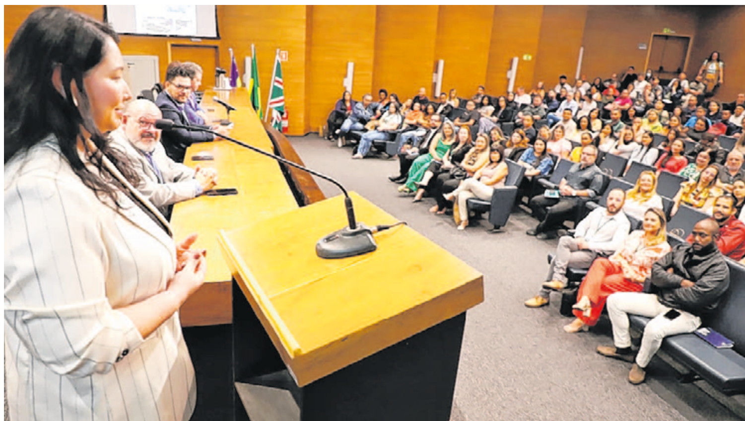
Capacitação que ocorre no auditório da Câmara Municipal é primeiro passo para eficaz funcionamento da unidade