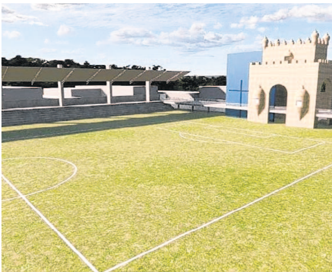
Imagens de projeto do novo cavalcódromo: atual coloca em risco população