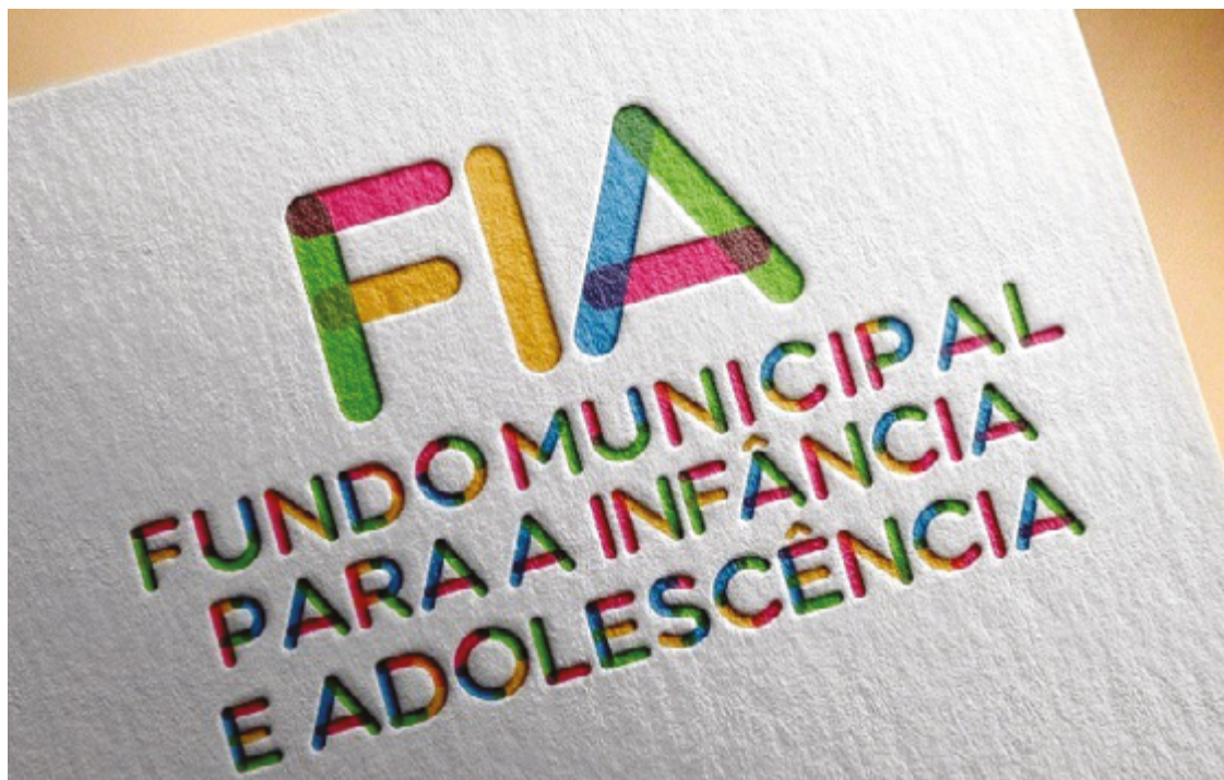
Os fundos arrecadados são destinados para entidades sociais do município como o Fundo Municipal de Infância e Adolescência

“As nossas instituições que hoje recebem essas crianças e também esses idosos estão com as vagas exauridas, não temos mais onde colocar mais pessoas. Com esses valores destinados nós poderemos ampliar essa rede de proteção para conseguir atender ainda mais pessoas que estão aguardando na fila desses locais”, afirmou a secretária.