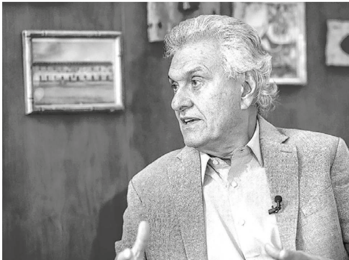
Ronaldo Caiado foi entrevistado na quarta-feira por emissora baiana: pré-candidato diz que Lula não consegue aplacar problemas de Segurança Pública

"O narcotráfico está crescendo na economia, no transporte urbano, nos postos de gasolina, nos supermercados e em vários outros