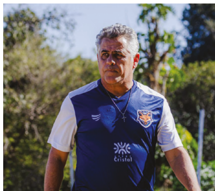
A saída acontece em um momento estratégico para o clube, que reforça seu compromisso com a formação de atletas