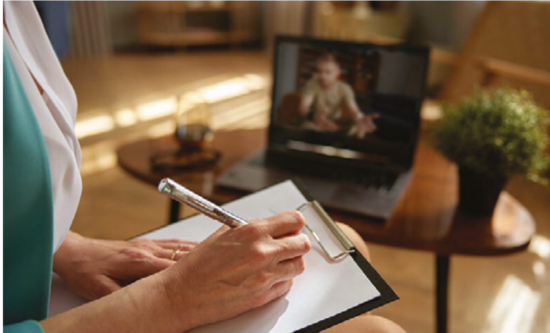
A acessibilidade da terapia online permite que pacientes escolham profissionais de qualquer lugar do mundo

A acessibilidade da terapia online permite que pacientes escolham profissionais de qualquer lugar do mundo, eliminando barreiras geográficas e facilitando o acesso para aqueles que vivem em áreas remotas ou possuem dificuldades de locomoção. Além disso, a possibilidade de realizar as sessões em casa proporciona conforto e maior adesão ao tratamento, especialmente para aqueles que sentem ansiedade ao frequentar um consultório presencial.