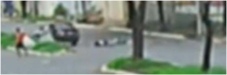
Vítimas estavam em uma moto que bateu em um carro

Outras quatro pessoas, que estavam em um segundo veículo, sofreram ferimentos. O Serviço de Atendimento Móvel de Urgência (Samu) e os bombeiros prestaram os primeiros socorros e encaminharam os feridos.