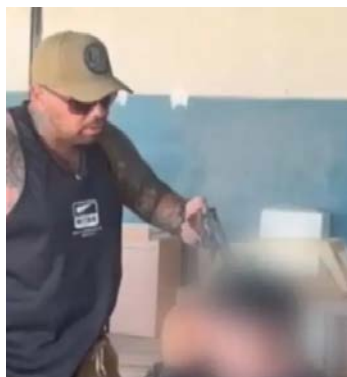
Polícia investiga as ações de três PMs, uma advogada e empresários

ficam detidos no presídio militar de Goiânia, enquanto Tatiane e os empresários permanecem presos em unidades de Luziânia. A PM afirma que afastou os envolvidos e colabora com as investigações. A Polícia Civil busca outras possíveis vítimas.