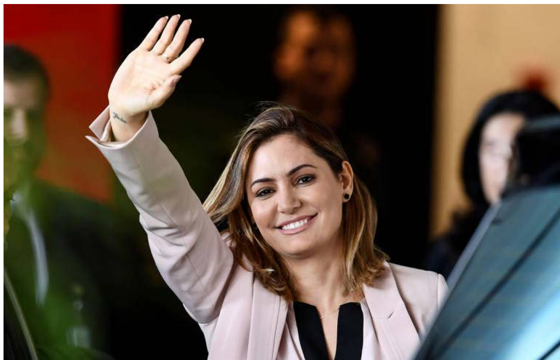
Michelle Bolsonaro ataca aliança do PL com Ciro Gomes no Ceará

nandes, também foi respaldado pelo presidente nacional do PL, Valdemar Costa Neto. A estratégia, contudo, envolvia evitar um posicionamento público de Bolsonaro sobre a aliança com o antigo adversário.