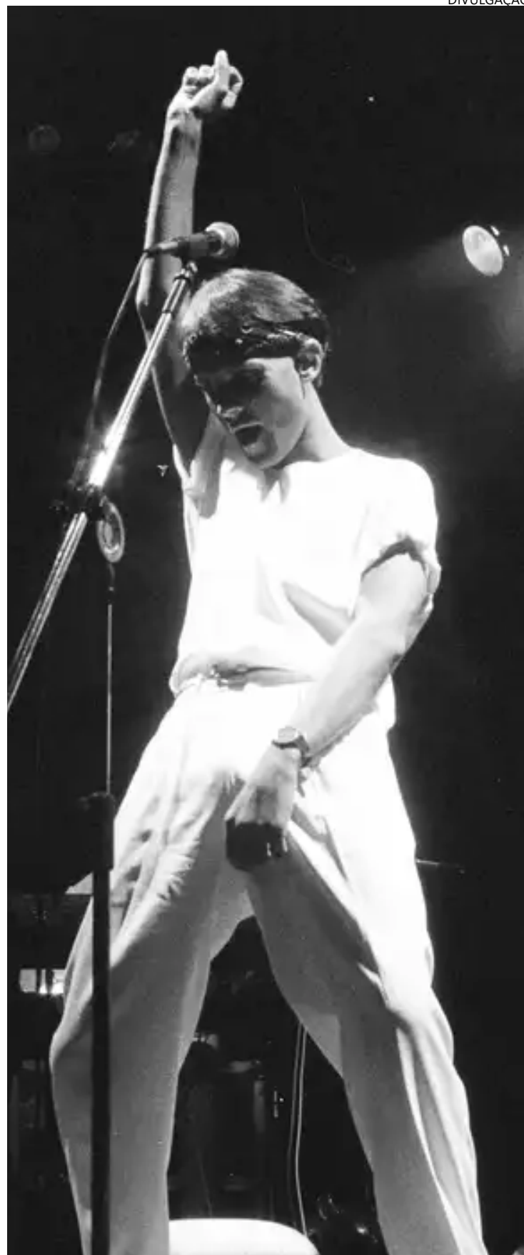
Produção estreia no Globoplay para manter viva memória do compositor carioca

“Ele acolheu a doença e, ao fazer isso, acolheu todos aqueles que, como ele, portavam o vírus”, afirma a diretora. Inspirada por tal postura, Lucinha fez do luto a sua luta. No mesmo ano da morte do filho, fundou a Sociedade Viva Cazuza. (Marcus Vinícius Beck)