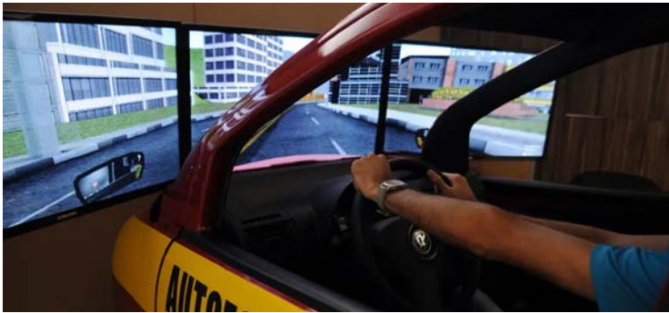
Medida simplifica etapas e retira a obrigatoriedade de passar por uma autoescola

Trânsito (Senatran), 20 milhões de brasileiros já dirigem sem habilitação e mais 30 milhões têm idade para ter a CNH mas não possuem o documento, principalmente por não conseguirem arcar com os custos que podem chegar a até R$ 5 mil.