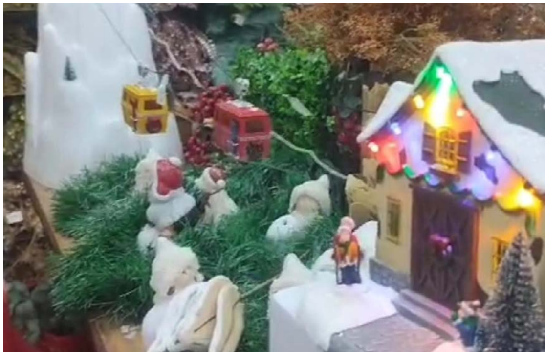
Brinquedos de Natal como o bondinho, árvores e itens clássicos marcam decoração de Natal das famílias

Os enfeites também seguem tendências internacionais. O artesanato voltou com força, especialmente peças em feltro, madeira reciclada e cerâmica, valorizando o feito à mão. Entre as cores da temporada, surgem três apostas: o tradicional vermelho-dourado, o verde-bosque com