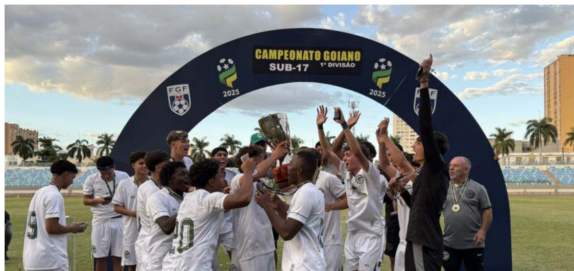
Campeão goiano sub-17, Goiás estreia nesta terça-feira (2), às 10h, diante do Furacão

Principal competição nacional da categoria Sub-17, a Super Copa Capital começou nesta segunda-feira (1º), reunindo 32 equipes de todas as regiões do Brasil. Entre os participantes está o Goiás, atual campeão goiano da categoria, que conquistou o título em junho após empatar com o Império Pires em 1 a 1. O Verdão estreia na nesta terça-feira (2), às 10h, diante do Furacão no Estádio Abadião.