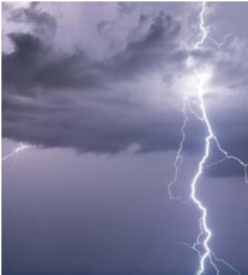
Previsão indica tempo fechado durante a semana

A previsão indica a formação de nuvens carregadas, com potencial para rajadas de vento, raios e volumes elevados de chuva em um curto período.