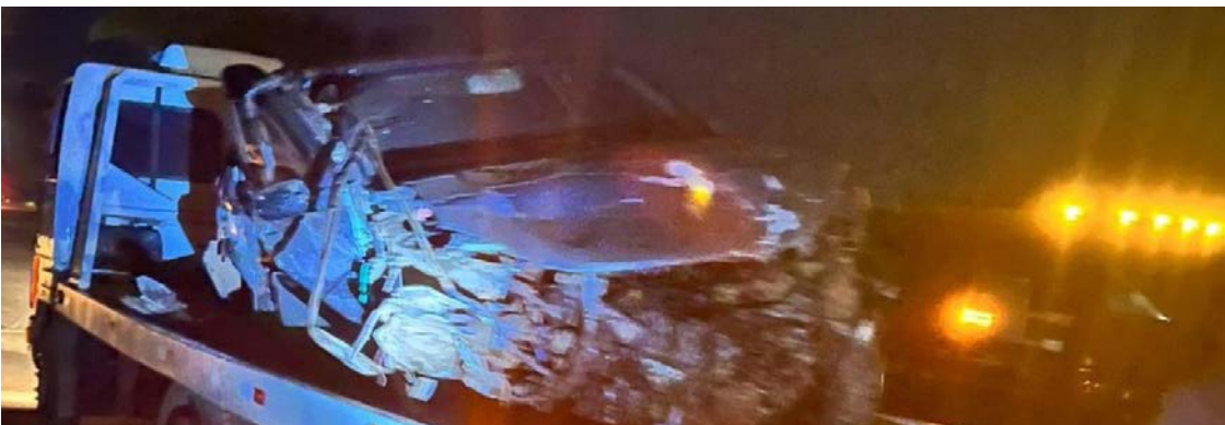
Um dos veículos caiu em leito de rio após acidente

Um grave acidente envolvendo três carros deixou dois mortos e seis feridos em Serranópolis. O fato ocorreu neste domingo (30/11), sobre a ponte do Rio Verdinho.