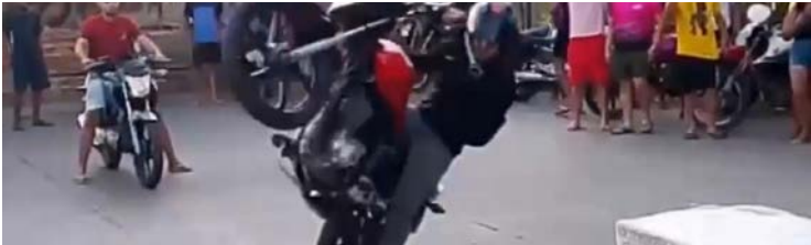
Imagens mostram piloto realizando manobras de "grau" ao lado dos caixões

Em nota, a Comurg lamentou a morte dos servidores, que atuavam na poda de gramados, e informou que as equipes de Assistência Social prestarão apoio aos familiares.