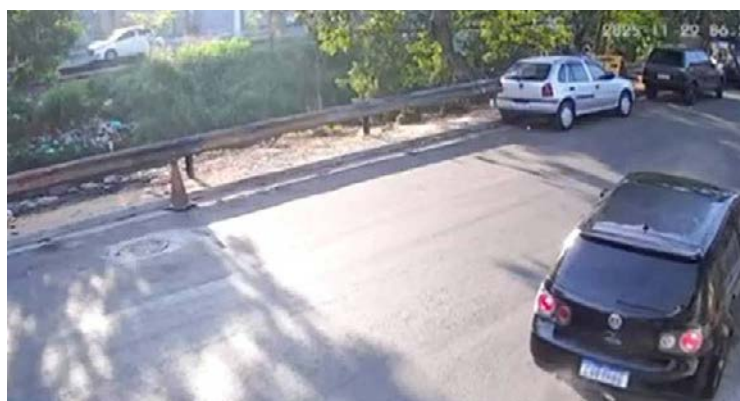
Prisão ocorreu na noite de domingo após investigação