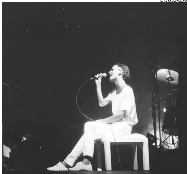
Cazuza acolheu a doença e, com isso, deu lição ao Brasil