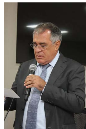
Joaquim de Castro: vínculo com o municipalismo goiano

À frente do TCM-GO imprimiu um trabalho voltado para orientação sobre gestão aos 246 prefeitos, evitando apenas agir para punir os gestores.