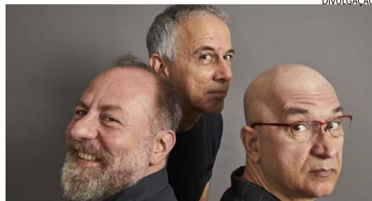
Banda vai tocar repertório que atravessa gerações