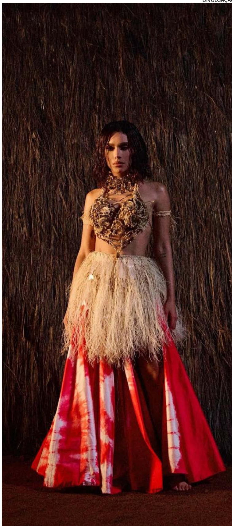
Cantora acena à espiritualidade forma plural em novo trabalho

Com 15 faixas, "Equilibrium" é recheado de influências da música brasileira, incluindo samples de Vinícius de Moraes e Baden Powell a Os Tincoãs. Há referências a Carmen Miranda, batidas de samba, inspiração em culturas indígenas brasileiras.