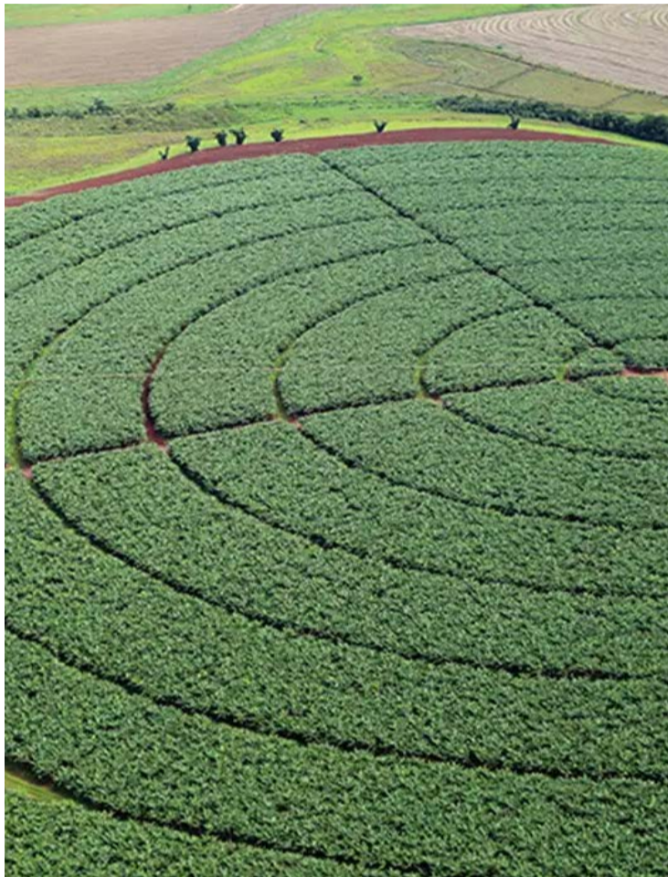
Principal pilar da economia goiana foi a agropecuária, que registrou crescimento de 20,4% no ano