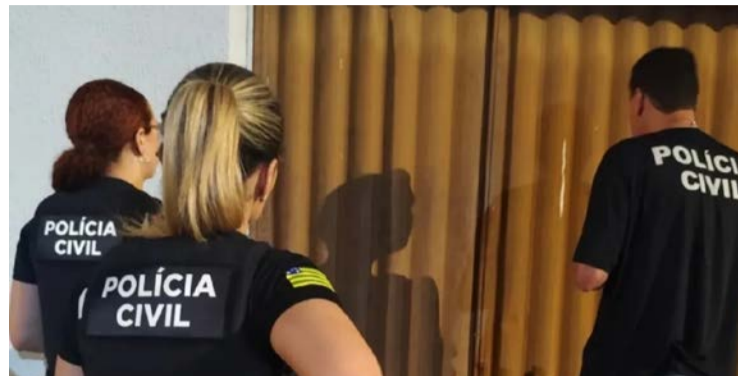
Polícia cumpriu mandado de busca e apreensão domiciliar

Segundo as investigações, as vítimas eram atraídas com anúncios para aplicativos