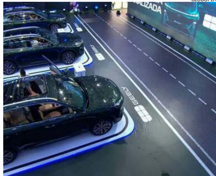
Trio foi testado ao vivo após assistir a vídeos