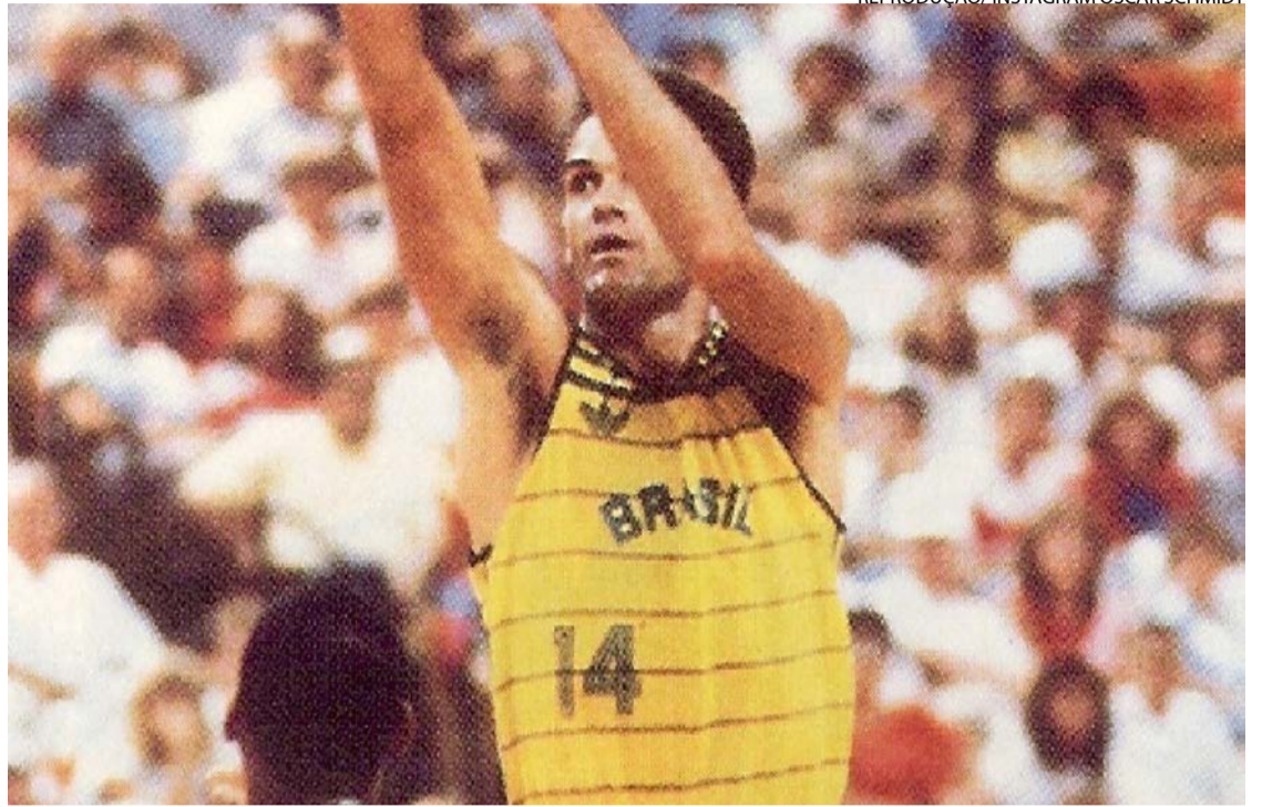
Oscar Schmidt durante partida histórica pela seleção brasileira: atleta construiu carreira baseada em treino intenso e recordes

Mesmo com propostas para jogar na NBA, optou por não seguir na liga norte-americana, priorizando sua participação na seleção brasileira em um período em que atletas da NBA não podiam disputar competições internacionais. Sua escolha reforçou sua identidade com o país, pelo qual disputou cinco Olimpíadas e conquistou diversos títulos sul-americanos e continentais.