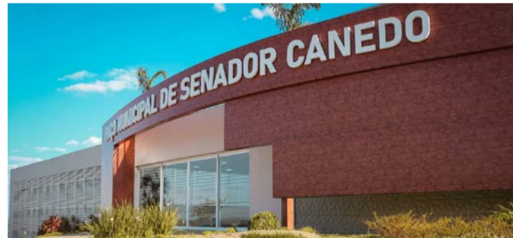
Sites fraudulentos induzem os candidatos a pagarem taxas via Pix