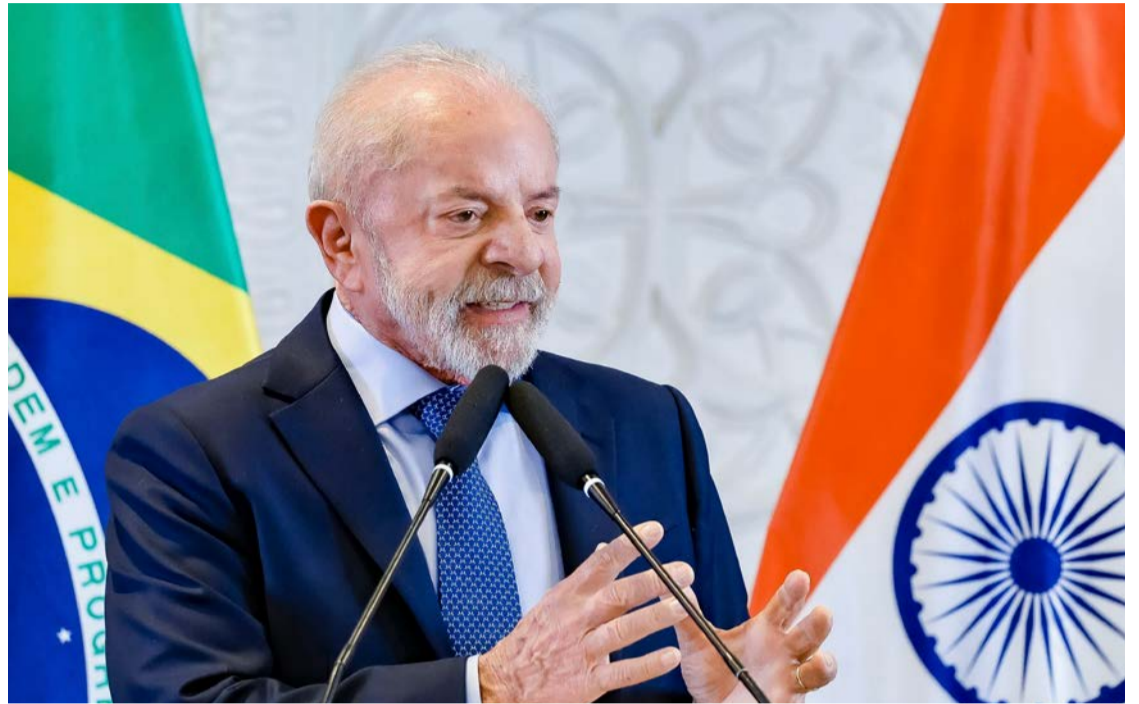
Lula quer melhorar sua imagem e parte para o ataque contra as bets

Na mesma entrevista de terça, Lula afirmou que tinha o "compro-