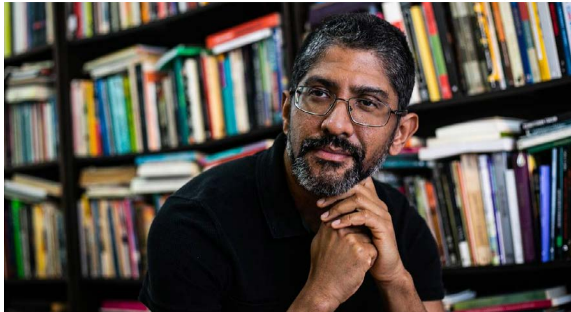
Escritor venceu Prêmio Jabuti com o romance "O Averso da Pele"