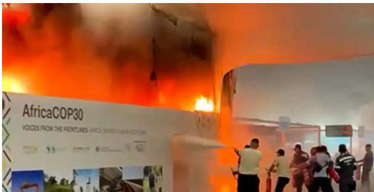
Bombeiros combateram o incêndio rapidamente e não houve feridos