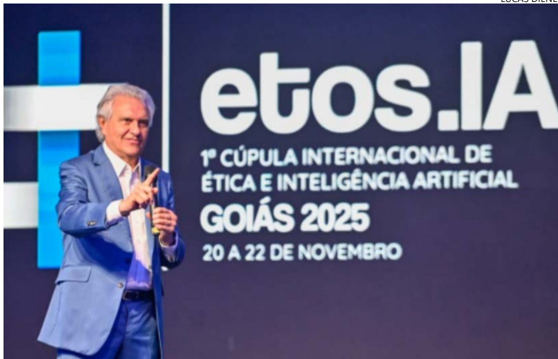
Governador Ronaldo Caiado abre a Etos.IA e reforça protagonismo de Goiás na pauta da inovação

Com programação até 22 de novembro, o Etos.IA ocorre no Shopping Passeio das Águas, em Goiânia. A expectativa é atrair cerca de 10 mil visitantes,