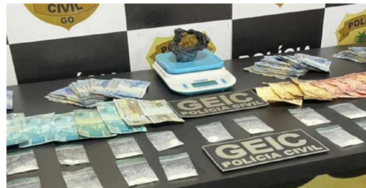
Parte dos entorpecentes foi localizada em depósito da construtora