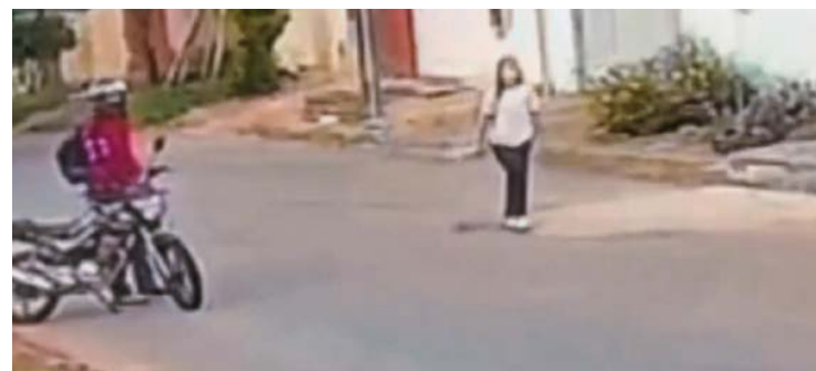
Homem já respondia por estupro, utilizava tornozeleira eletrônica e cumpria pena em regime de progressão

Ação criminosa foi interrompida quando um morador, ao abrir seu portão, percebeu a cena e se aproximou do motociclista e da garota