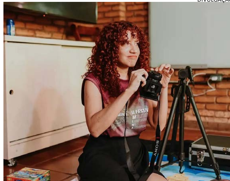
Iniciativa ocorre na capital goiana neste fim de semana