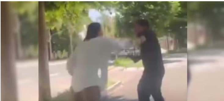
Vídeo divulgado nas redes sociais mostra o momento da agressão

mentou o ocorrido, informou que a servidora foi identificada e que todas as medidas administrativas para uma apuração rigo-