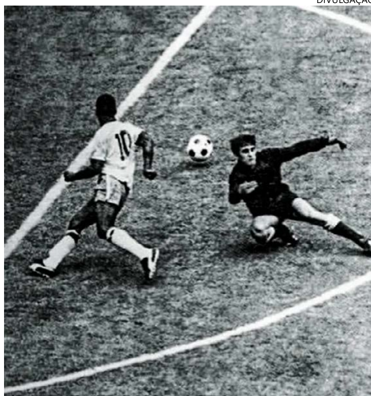
Rei dribla goleiro uruguaio Ladislao Mazurkiewicz em lance sublime

Voltemos ao livro Rei e às reflexões do jornalista Paulo Vinícius Coelho, estudioso do jeito brasileiro de jogar futebol: “Durante esses 66 anos, o ponto de comparação é sempre o mesmo: Pelé. Isso é ser Rei. Isso é ser Pelé.” A realza fez 1.281 gols lindos. Salve a mágica.