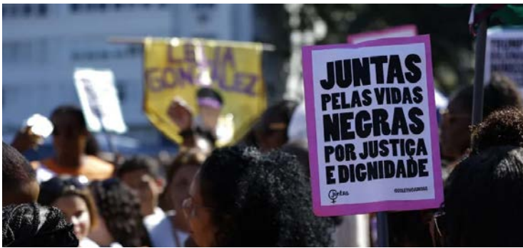
Estudo utilizou inteligência artificial para filtrar e identificar decisões relacionadas a racismo

nero foi significativa, com 43% das vítimas sem dados registrados. No ambiente digital, 429 casos tiveram origem em postagens racistas, e 62% dos autores seguem desconhecidos.