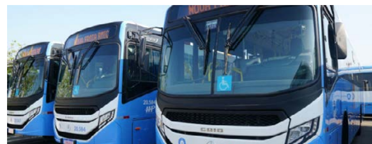
Ônibus funcionam em trajeto pré-definido e destino único