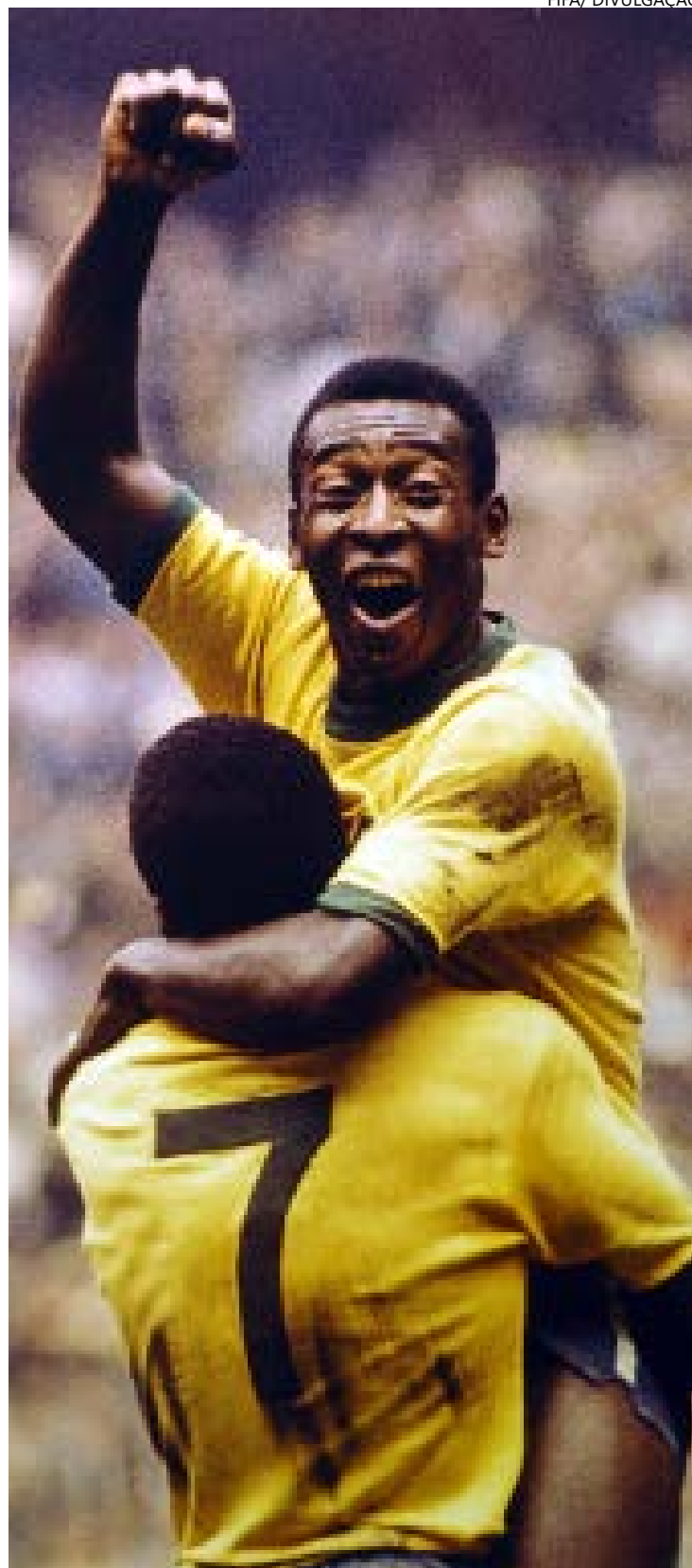
Pelé abraça o furacão da Copa, Jairzinho, ao balançar as redes no Mundial de 70

Entre 1958 e 1962 (com os dois títulos mundiais), o país abandonou a viratlite, reforçada pelo fracasso no Mundial de 1950. Passou a sonhar embalado pela bossa nova de João Gilberto, pela arquitetura de Oscar Niemeyer e pelos gols de Pelé — tal é a sua relevância.