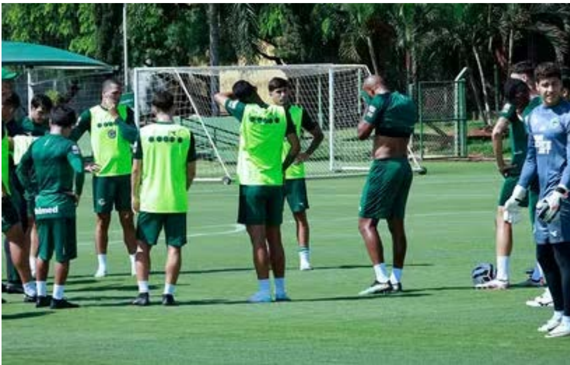
Jogadores do Goiás em treino antes do embarque para Belém (PA) para enfrentar o Remo

Logo abaixo vêm Chapecoense e Remo, empatados com 59 pontos. A Chape tem 17 vitórias e saldo maior, enquanto o time do Pará soma 15 vi-