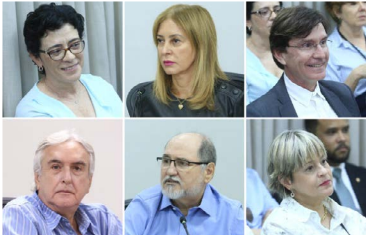
Representantes do MP que compõem lista sêxtupla para vaga no TJ-GO

Os seis nomes indicados já foram encaminhados ao procurador-geral Cyro Terra para definição