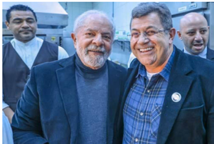
Lula da Silva e Emídio de Souza: defesa dos direitos sociais do povo brasileiro

Emídio de Souza afirma ainda que "a conjuntura atual e os estreitos limites em que o governo opera, com um Congresso hostil e uma amplíssima e frágil composição, desautoriza qualquer amadorismo. O PT não pode fazer de conta que não é governo e nem desconhecer os claros limites do