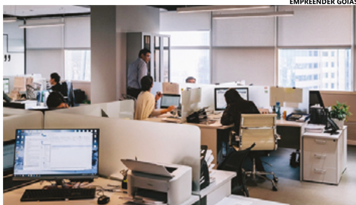
Goiás tem 1,169 milhão de empresas ativas, considerados os MEIs