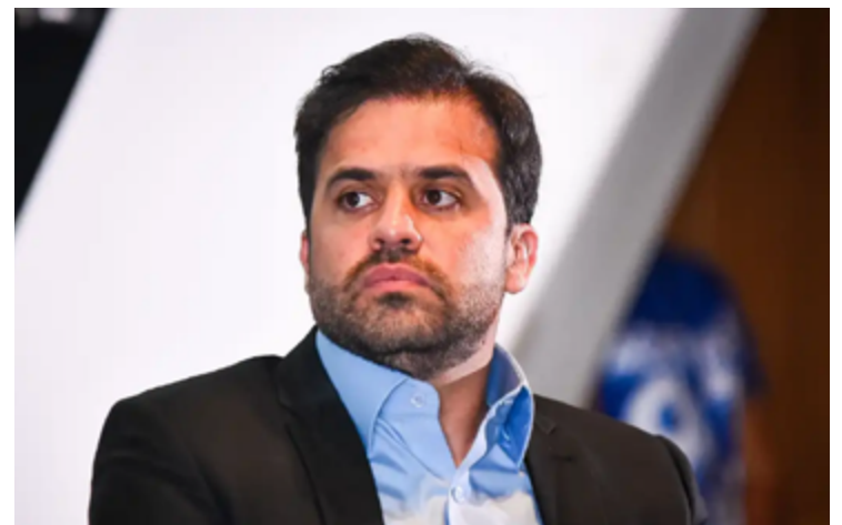
Pablo Marçal: explicações à PF sobre laudo falso