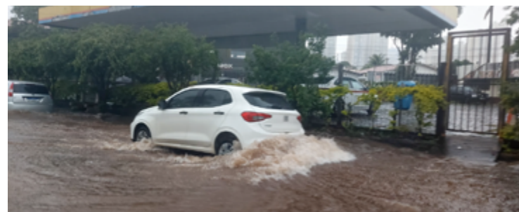
Tarde de segunda-feira na Capital: chuva forte causou inundações em vários bairros

Em Goiânia, previsão de sol, variação de nebulosidade e pancadas de chuvas isoladas. Temperatura máxima podendo chegar aos 32°C e umidade relativa do ar variando de 50% a 98%. O nascer do sol será às 5h35 e o pôr do sol às 18h26.