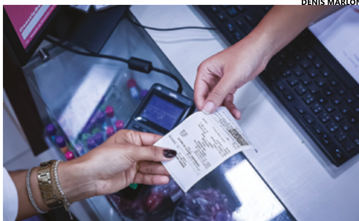
Para acessar programa, é preciso pedir nota fiscal com CPF na compra

A Secretaria da Economia alerta que os cidadãos com registro ativo no Cadastro Informativo dos Créditos não Quitados de Órgãos e Entidades Estaduais (Cadin Estadual) em 31 de dezembro de 2024 perderão o desconto no IPVA 2025, mesmo se tiverem alcançado o número mínimo de bilhetes. A legislação que instituiu o Cadin impede a concessão de vantagens decorrentes do programa Nota Fiscal Goiana a inscritos no cadastro estadual. (Com informações S. Economia)