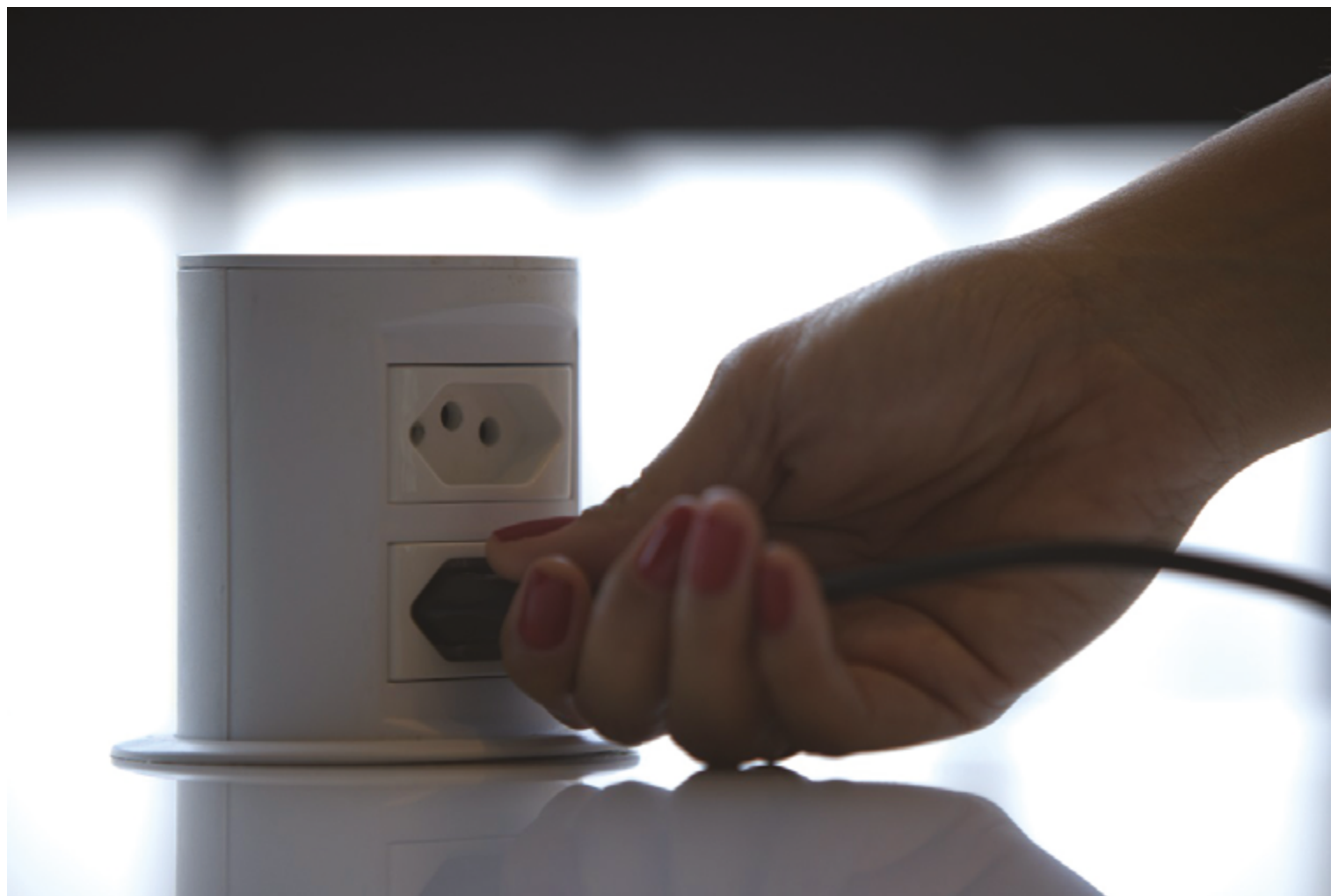
Os fatores que impactam no aumento do consumo de energia influenciam sobre o custo de fornecimento; em outubro a bandeira tarifária foi a vermelha

O cálculo do consumo de energia de um cliente é feito a partir da leitura do medidor de energia, com a diferença entre a leitura atual e a do mês anterior, dentro de um