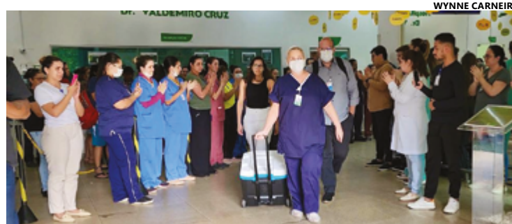
A doadora era uma mulher, de 55 anos de idade, que teve morte encefálica determinada por protocolos seguidos por lei; sua família autorizou a doação