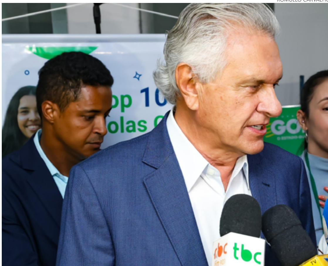
Ronaldo Caiado: “Sou médico, então não acreditem nessas opiniões totalmente fora de contexto da ciência, em dizer que a pessoa, ao se vacinar, terá uma coisa ou outra”

“Faço um pedido encarecido a vocês. Sejamos responsáveis. Não é possível, que nós brasileiros, que sempre fomos referências, estarmos distantes de vacinar todas as nossas crianças. Por favor! Eu sou médico, então não acreditem nessas opiniões totalmente fora de contexto da ciência, em dizer que a pessoa, ao se vacinar, terá uma coisa ou outra. Que absurdo! Cada pai deve responder pela saúde de seus filhos”, reforçou Caiado, ao destacar o aumento de casos e óbitos de