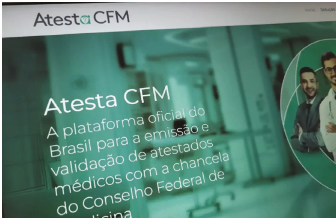
Ferramenta permite que médicos e pacientes tenham mais controle sobre a autenticidade dos documentos

A plataforma permite que médicos emitam atestados de forma online e offline, acessando o sistema de qualquer lugar. O médico poderá acompanhar e gerenciar todos os documentos emitidos, inclusive cancelando atestados, se necessário, o que, segundo Maleski, reduz a exposição do profissional a riscos legais. "Isso permite mais segurança