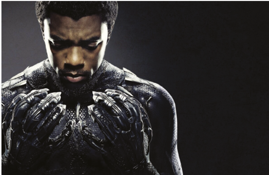
Pantera Negra (2018), está entre as exhibições do festival, assim como 'Mandela e a luta pela liberdade' (2007)