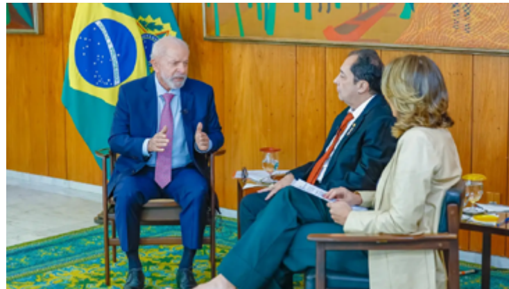
Lula da Silva, Jorge Kajuru e Leila Barros: apostas eletrônicas