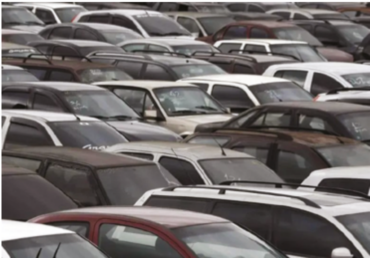
Evento é por meio eletrônico; visitação aos lotes teve início na segunda, 11

-GO, Delegado Waldir, ressaltou que, conforme a legislação, o proprietário do veículo ainda pode reivindicar a retirada do bem a qualquer momento, desde que regularize