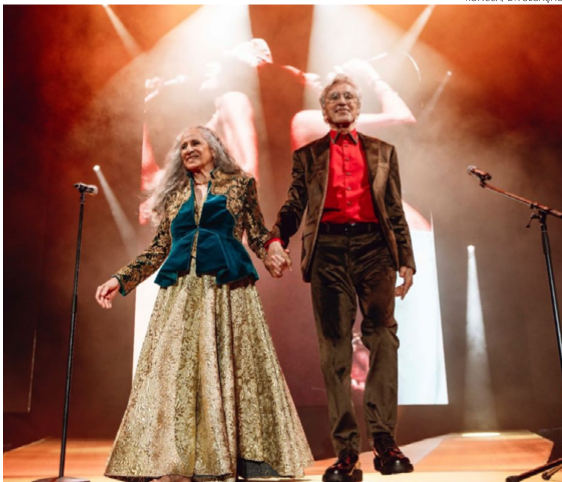
Bethânia e Caetano revisitaram diferentes fases da carreira em show

Foi bonita a veneração, pá, fiquei comovido. Na clássica “Baby” (impossível não lembrarmos Gal), Bethânia acentua verso “Baby, I Love You”, em lindíssima forma de declarar amor à cantora inesquecível. Depois dessa canção, Caetano & Bethânia interpretam