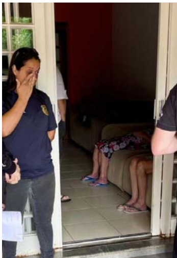
Ação foi motivada por denúncia anônima do Disque 100

A ILPI continua operando com 18 idosos em regime integral, mesmo sem atender aos requisitos legais. A Deai instaurou inquérito policial para apurar o crime de maus-tratos, multou a instituição e intimou proprietário e funcionários.