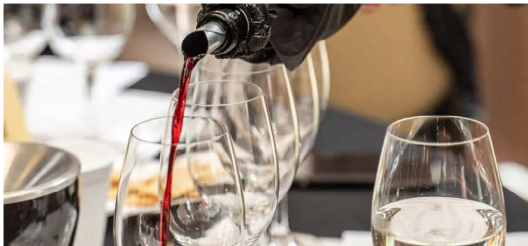
Mundo bebe o Brasil e isso diz muito sobre quem nos tornamos

Vinho brasileiro deixou de ser promessa para se tornar um país inteiro, derramando nas taças as tradições gaúchas e o sabor do Cerrado