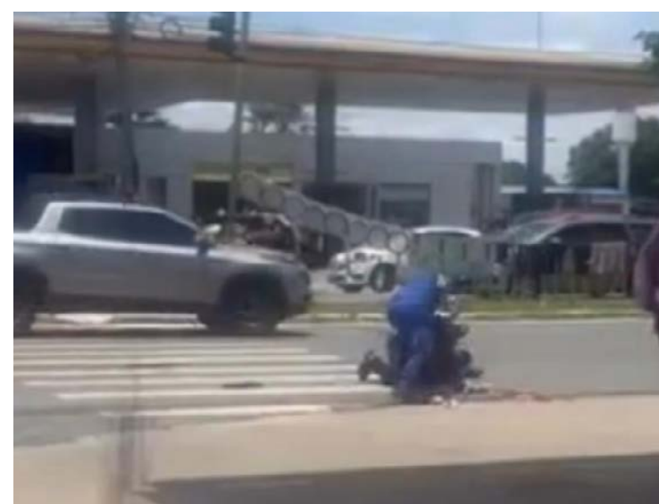
Vídeo que viralizou mostra o desentendimento: confusão na 5ª Avenida