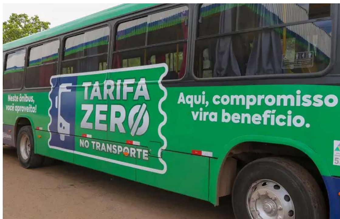
País tem 137 cidades com tarifa zero, número considerado o mais alto no mundo

O país tem hoje 137 cidades com tarifa zero, número considerado o mais alto no mundo. Para um dos autores, André Veloso, doutor em economia pela UFMG (Universidade Federal de Minas Gerais), o estudo tem o objetivo de enfrentar o colapso do transporte que ocorre há três décadas. "O pico de passageiros no transporte