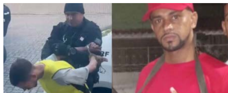
Braddock é apontado como líder violento da facção