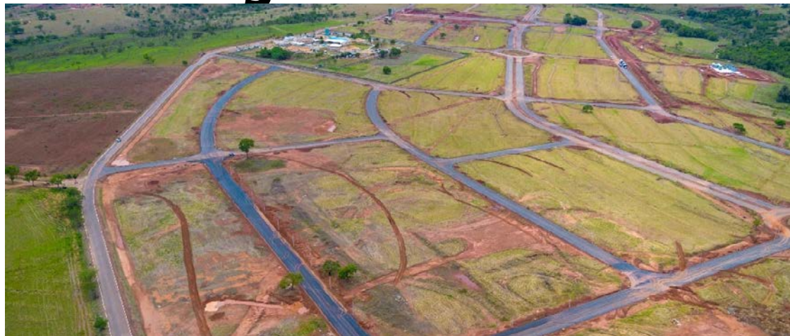
Obras do Distrito Agroindustrial Norberto Teixeira seguem em execução