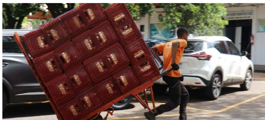
Movimentadores participarão no sábado de prova inédita na Ceasa/GO