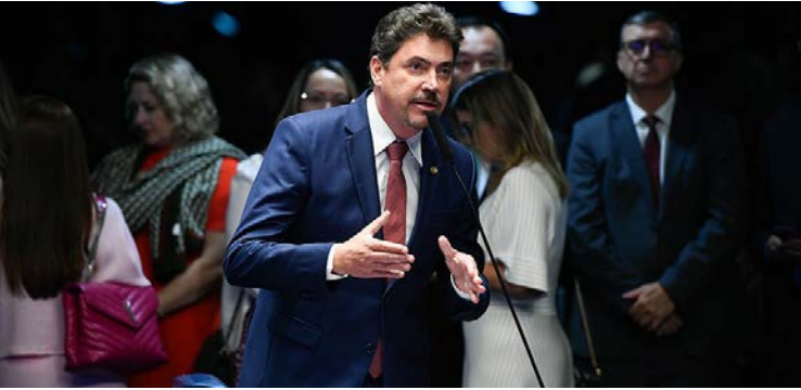
Senador Wilder Moraes defende fim das saidinhas e critérios na progressão de pena

Senador diz que é preciso avaliar o projeto com lupa para evitar o aumento da criminalidade