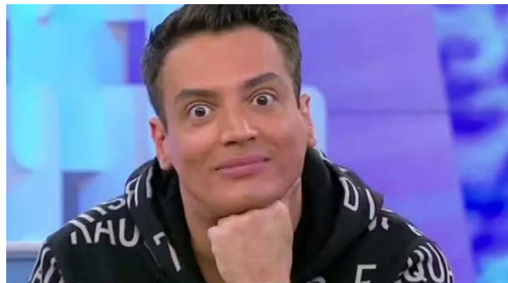
Lista inclui personalidades de grande visibilidade

Jornalista foi eleito pela plataforma de inteligência digital Zeeng