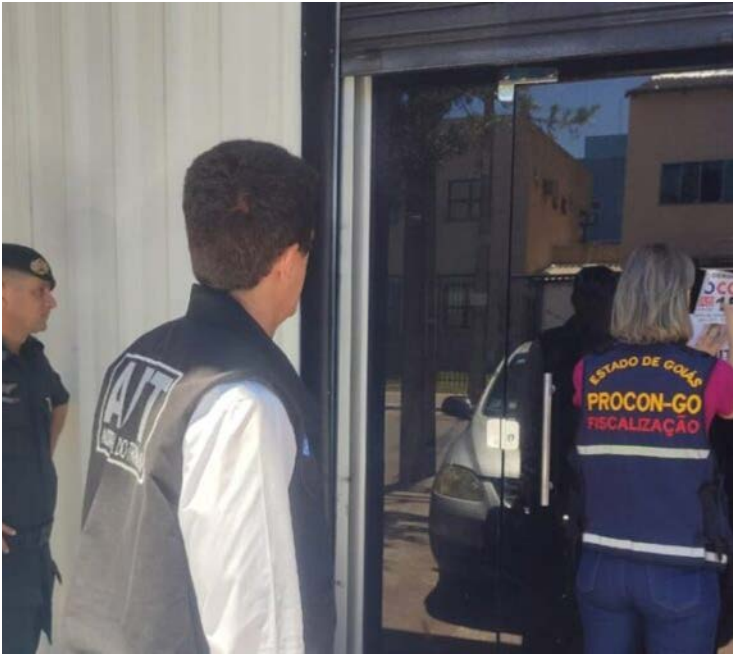
Ação foi realizada pelo Procon Goiás em parceria com o Ministério do Trabalho

Além disso, foram encontrados mais de 1.520 frascos de perfumes de fabricação própria, conhecidos como contratipos, o