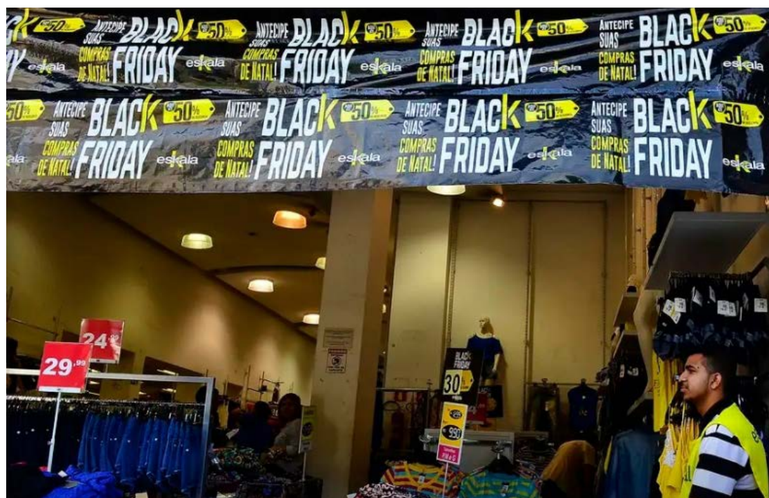
Lei estadual de 2017 funciona como instrumento de proteção em datas como Black Friday: histórico com notas deve ser apresentado na hora da compra

A legislação se mostra especialmente relevante em datas como a Black Friday, quando o volume de anúncios cresce expressivamente e muitas empresas utilizam es-