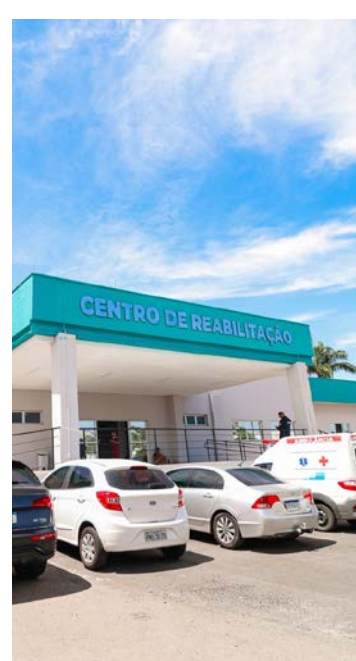
Fachada do Centro de Reabilitação de Senador Canedo