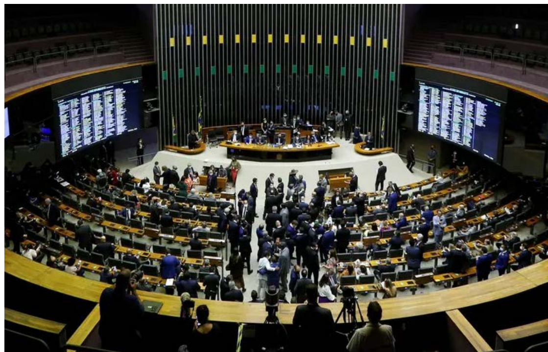
Plenário da Câmara Federal: Lula sofre nova derrota em projeto do Propag

O fundo foi criado na reforma tributária. Será abastecido com R$ 8 bilhões da União em 2029. Os valores vão subir até