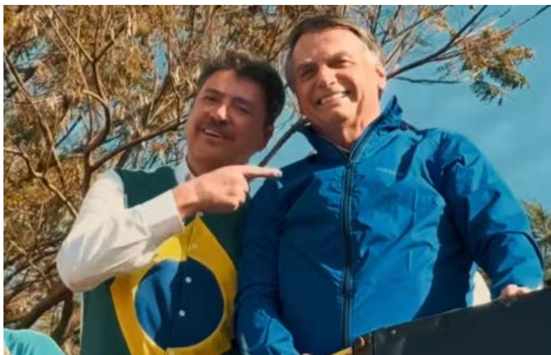
Wilder Moraes e Jair Bolsonaro: incertezas sobre as eleições em Goiás para 2026

Pesquisas divulgadas este ano apontam o se-