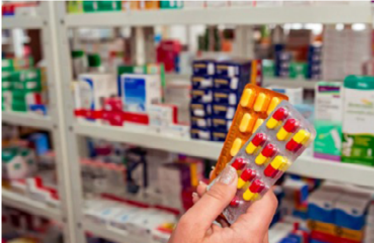
Novos produtos, inclusive de alta complexidade, estão disponíveis no mercado a partir de laboratório anapolino

Segundo a companhia, foram firmadas parcerias estratégicas que, aliadas à inovação, foram importantes para os resultados