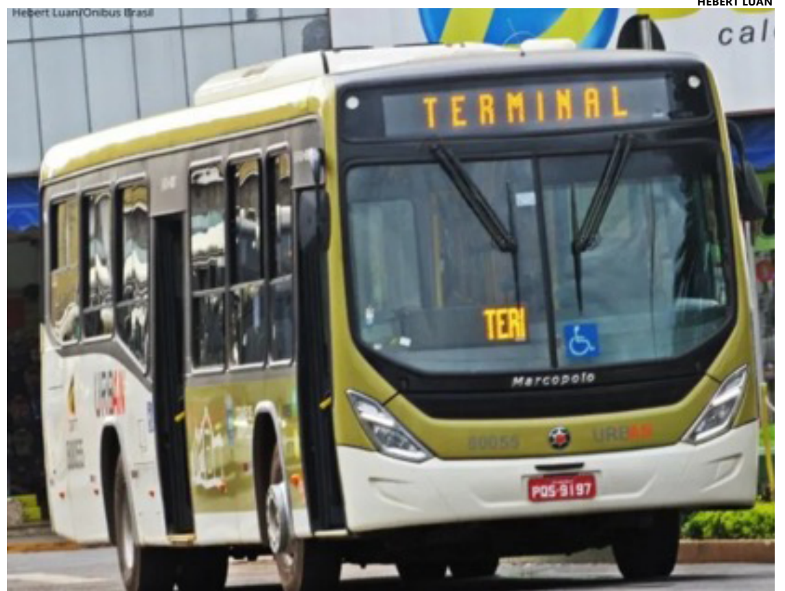
Ônibus do transporte coletivo de Anápolis, sistema operado pela empresa Urban.

seja, o que se convencionou chamar de transporte alternativo. A matéria fala não só de transporte urbano, mas também rural, definindo a composição da comissão que irá tratar da licitação para escolha das empresas que poderão operar o sistema.