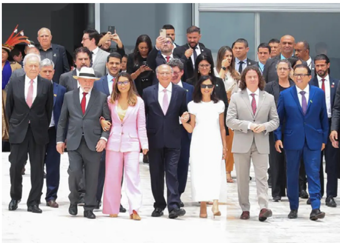
Lula da Silva e autoridades descem a rampa do Palácio do Planalto: "Defesa da democracia sempre"

Já a data do 8 de janeiro ficou marcada com um dos maiores ataques à democracia —o STF (Supremo Tribunal Federal) já condenou 375 réus pelos atos, que resultaram na denúncia de 1.682 envolvidos. "Hoje é dia de dizer, em alto e bom som, ainda estamos aqui. Estamos aqui para dizer que estamos vivos, que democracia está viva, ao contrário do que planejam golpistas de 8 de janeiro de 2023", disse Lula. "Estamos aqui, mulheres e homens de diferentes origens, crenças, uni-