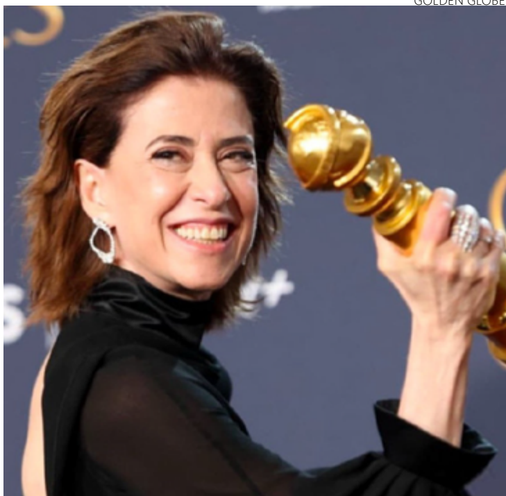
No páreo: atriz venceu Globo de Ouro nesta semana

A vitória de Torres no Globo de Ouro é outro elemento que pode influenciar o cenário, já que os votos para o SAG Awards foram registrados antes da premiação no último domingo, enquanto a votação do Oscar ainda está em aberto.