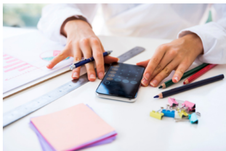
Plataformas digitais deixam consumo cada vez mais próximo do cidadão e dificultam austeridade

Embora o cartão de crédito tenha se tornado um dos meios de pagamento mais populares desde sua criação nos anos 1950, ele pode ser um grande vilão quando usa-