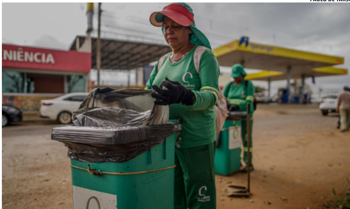
Prefeito volta a criticar serviço de limpeza urbana e faz cobrança mais dura aos prestadores de serviço

O contrato da limpeza urbana vai até o fim de maio. A gestão anterior já havia iniciado uma nova licitação, que seria concluída pela administração de Corrêa. Em novembro do ano passado, porém, o Tribu-