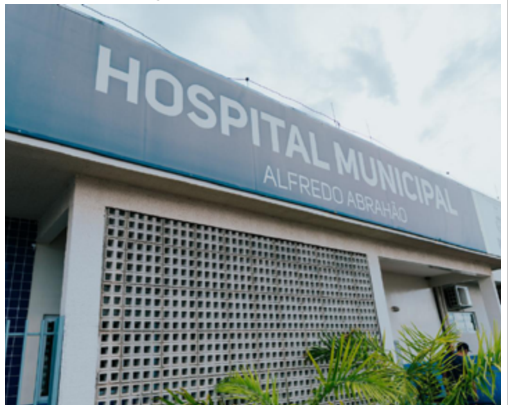
Hospital Municipal Alfredo Abrahão ampliou perfil de atendimento há uma semana