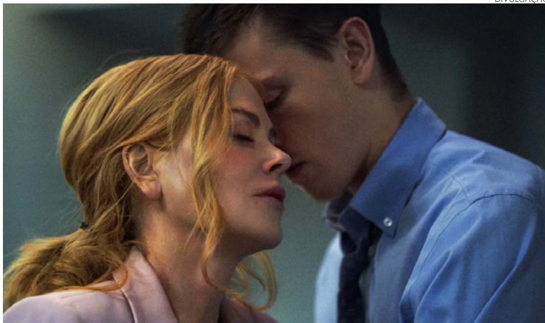
Obra não desperdiça tempo do espectador com explicações psicológicas

Pois então essa será menos uma crítica de filme quanto um desafio. Eu quero ver quem aqui (e ali, e em qualquer lugar) vai passar pela vida sem se abalar com um momento de "Babygirl" em que o personagem de Harris Dickinson dança com seus membros longos e desajeitados e o torso tatuado ao som de "Father Figure", hit de George Michael de 1987.