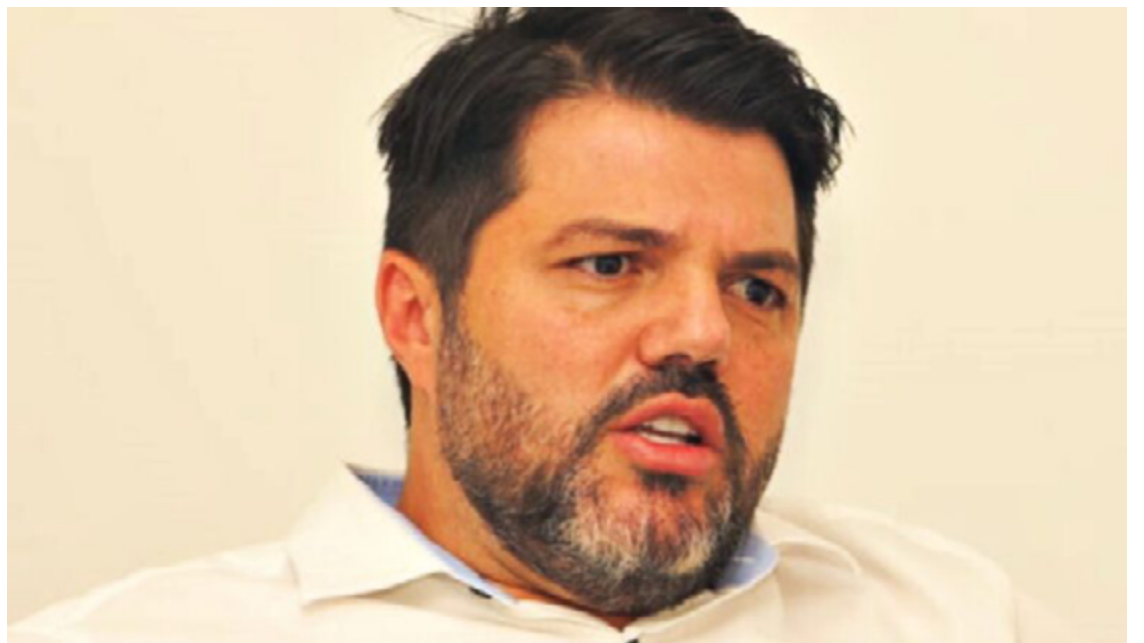
Prefeito Márcio Corrêa se comprometeu a apresentar plano de melhorias e redução de tarifa do Sistema de Transporte Público de Anápolis (STPA).

Além disso, o projeto autoriza o prefeito a abrir licitação para contratar empresa que fará o transporte completar, por micro-ônibus e van. Ou