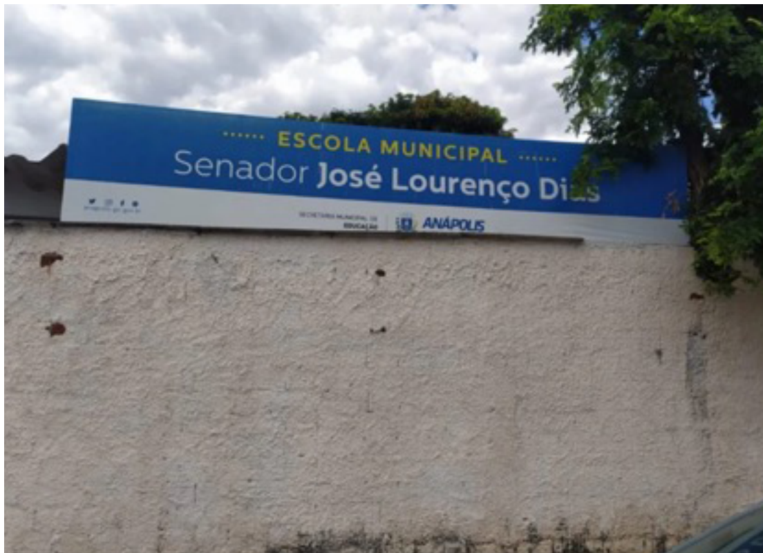
Fachada da Escola Municipal Senador José Lourenço Dias, que será interditada pelo prefeito para reconstrução