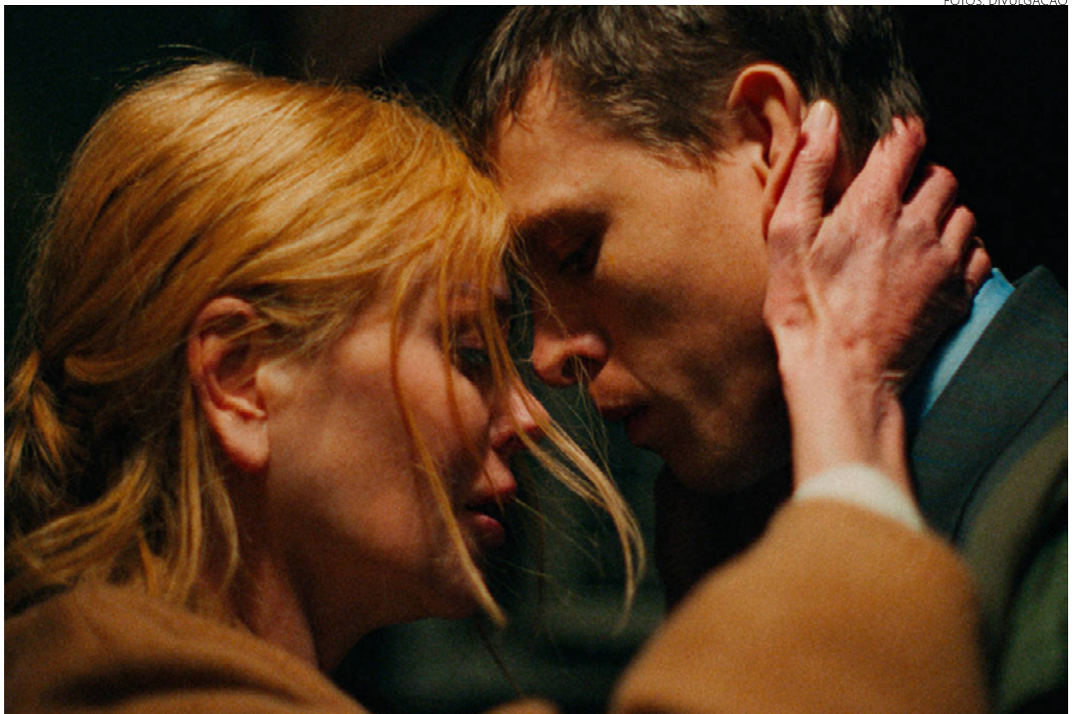
Parceria erótica: Nicole Kidman contracenava com Harris Dickinson em filme que estreia hoje nos cinemas goianos

Ele começa fazendo comentários rudes e dando ordens a ela, o que a enche de libido. Logo, a relação escala para es-