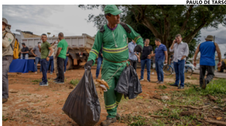
Centenas de servidores seguirão empenhados até sábado na região para efetuar serviços de limpeza

De acordo o prefeito Márcio Corrêa, a operação vai chegar