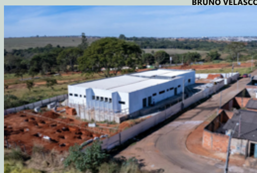
Estrutura da UPA Veterinária. Prefeito garantiu continuidade das obras a vereadora

“Nós sabemos que é um anseio da causa animal, dos protetores. O antigo Centro de Zoonoses não tinha nenhuma estrutura. Por isso trabalhamos arduamente por este recurso para construirmos este lugar para dar dignidade aos animais. É uma luta do nosso mandato, da causa animal. Essa vitória é de