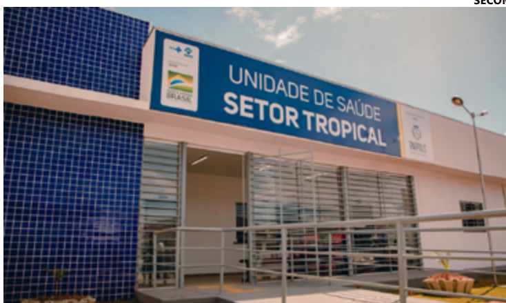
Fachada da Unidade de Saúde do Setor Tropical. Prefeito faz mudanças no formato de atendimento

Além do 'Zap da Saúde', a Prefeitura de Anápolis também implementou o 'Zap 24h', uma plataforma digital que oferece mais de 400 serviços, como abertura de empresas e solicitação de serviços urbanos. Com um ano de funcionamento, a plataforma já atendeu mais de 147 mil cidadãos, atingindo uma taxa de satisfação de 92%, consolidando-se como um modelo de inovação e eficiência no atendimento ao público.