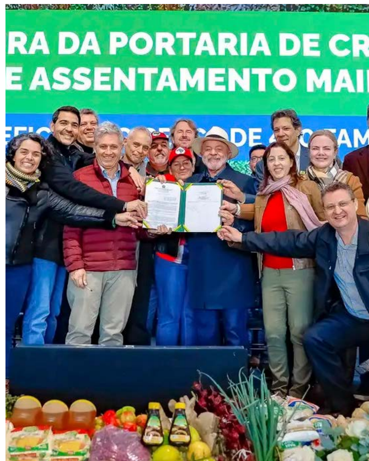
Presidente Lula com lideranças do MST em evento para assentamento de trabalhadores rurais

Integrantes da comunidade fizeram parte da "Vigília Lula Livre", como era chamado o acampamento