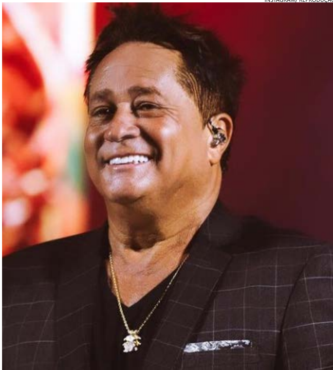
MP afirma que valor se mostra superior ao que é pago por outros municípios ao artista

“O referido valor se mostra superior aos que são pa-