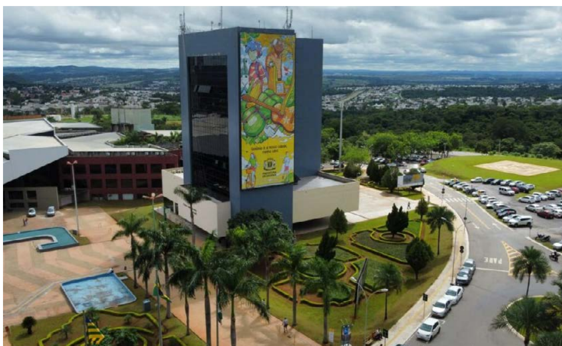
Aumento de cargos comissionados nas prefeituras é sintoma de clientelismo