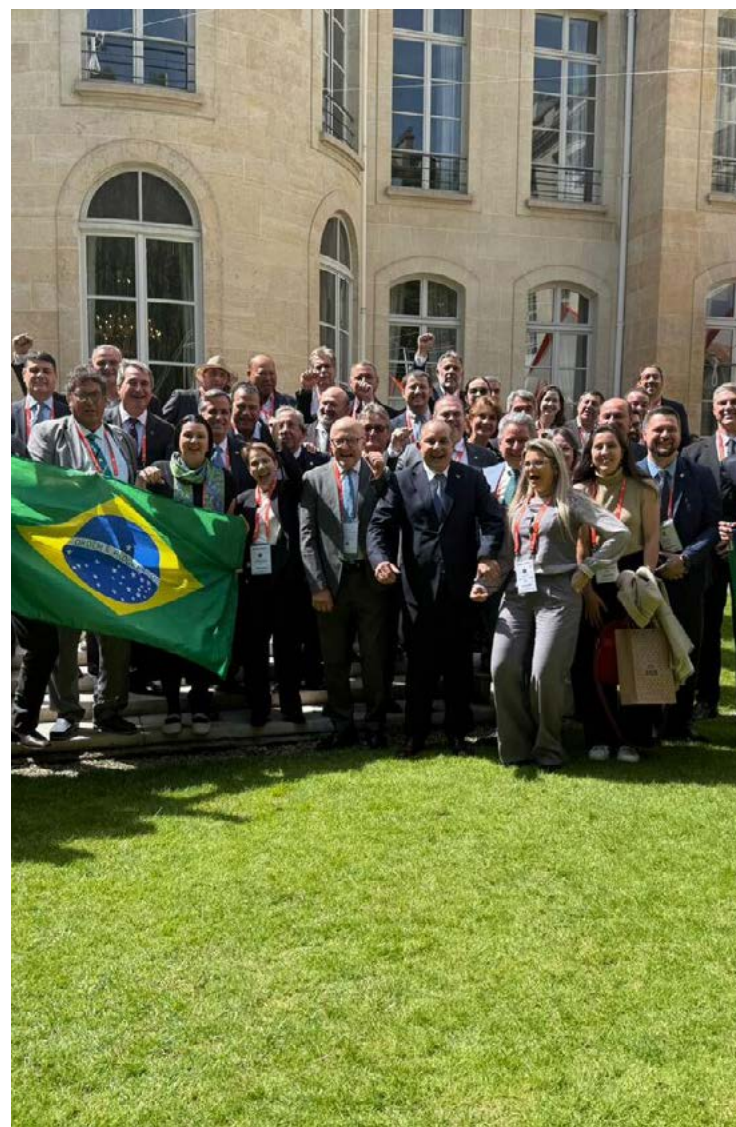
Comitiva goiana, composta por representantes da Agência Goiana de Defesa Agropecuária e da Secretaria Agricultura, acompanhou evento em Paris

"Para proteger o patrimônio pecuário e o reba-