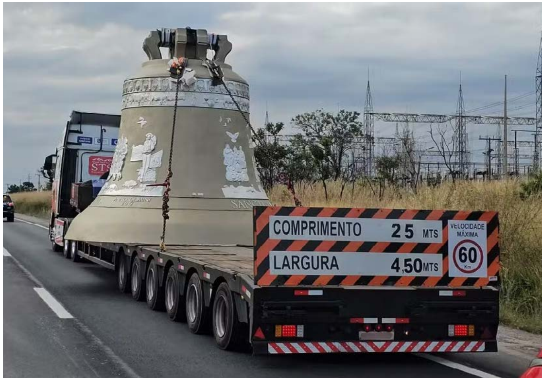
Pesando 55 toneladas, o sino está sendo transportado para a Basílica do Divino Pai Eterno, em Trindade

O maior sino do mundo, batizado como Vox Patris, que significa "A voz do Pai" em latim, chegou ontem ao território goiano