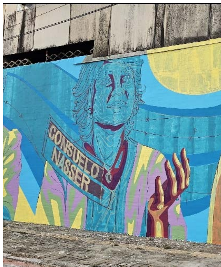
Mural celebra Consuelo Nasser, Neusa e Leodegária: imagem ainda está inacabada

Sua trajetória é objeto de pesquisas e investigações acadêmicas, uma vez que acelerou o movimento feminista brasileiro ao liderar debates de vanguarda e de direitos civis.