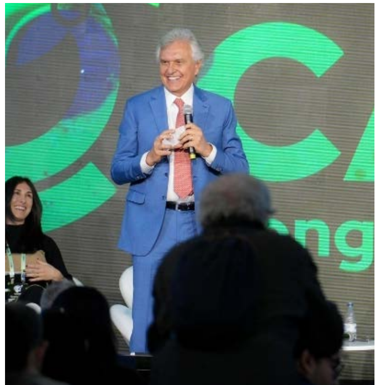
Ronaldo Caiado participa da abertura do 8º Congresso Ambiental (Cambi)

O congresso segue até esta sexta-feira e reúne cerca de 3 mil participantes de todo o país, com debates sobre legislações ambientais, mercado de carbono e políticas públicas sustentáveis.