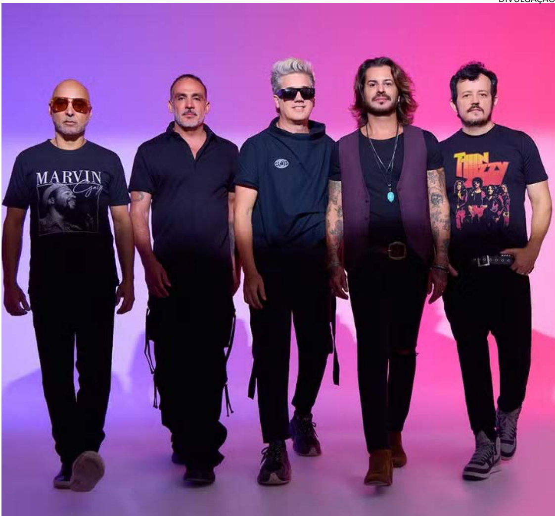
Jota Quest apresenta hits embalado pelo groove e letras sobre amor e sonhos

Raimundos, surgida em Brasília, foi um dos maiores expoentes do rock brazuca nos anos 1990. Com um estilo que mistura hardcore, punk e até forró, a banda conquistou o público com