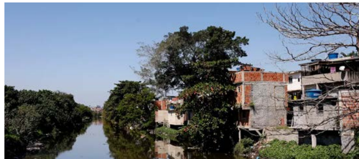
Em uma década, houve melhora no índice de desenvolvimento humano municipal do país