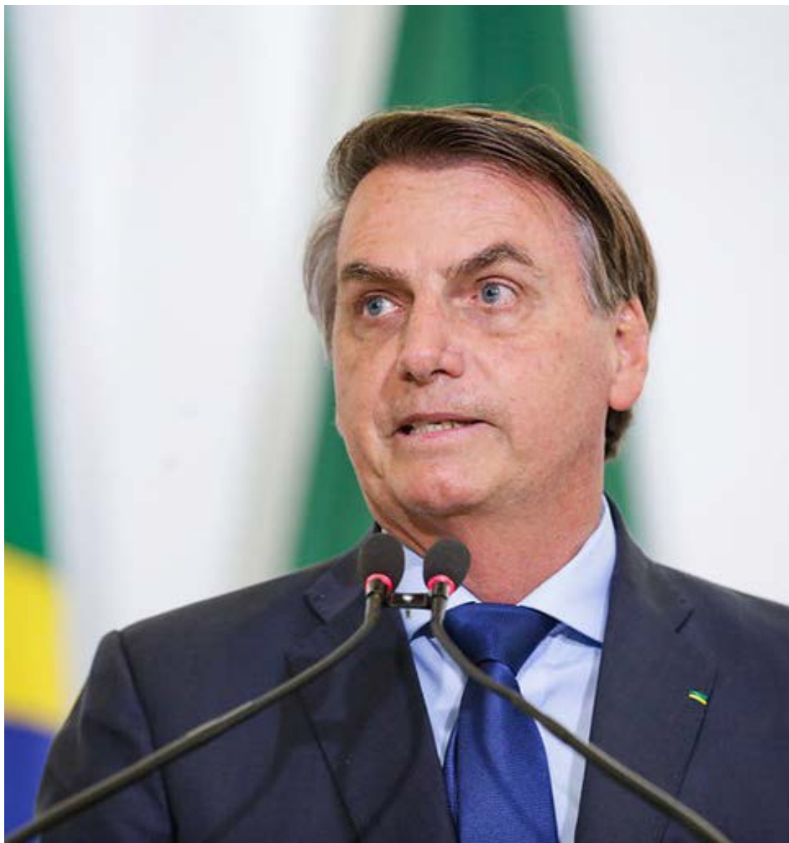
O ex-presidente Jair Bolsonaro também está no olho do furacão do escândalo do INSS

O desconto de mensalidades de associações e sindicatos vem de governos anteriores, mas atingiu patamares bilionários após 2022, explodindo durante o governo Lula, com movimentações políticas no Congresso que impe-