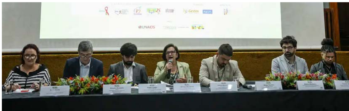
Documento, lançado ontem, foi produzido por um consórcio de organizações

Dados do Índice de Estigma em Relação às Pessoas Vivendo com HIV 2025 indicam que 52,9% das pessoas com a condição no Brasil já passaram por algum tipo de discriminação ao longo da vida