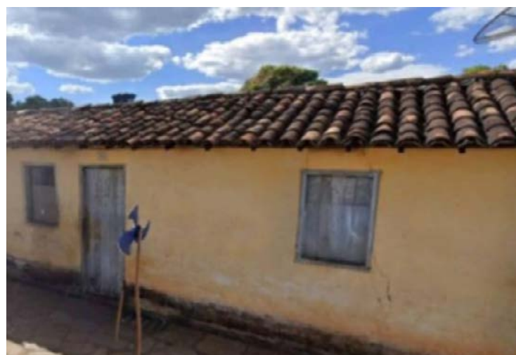
Casa teria importância histórica para Pirenópolis: Iphan autuou responsável pelo imóvel