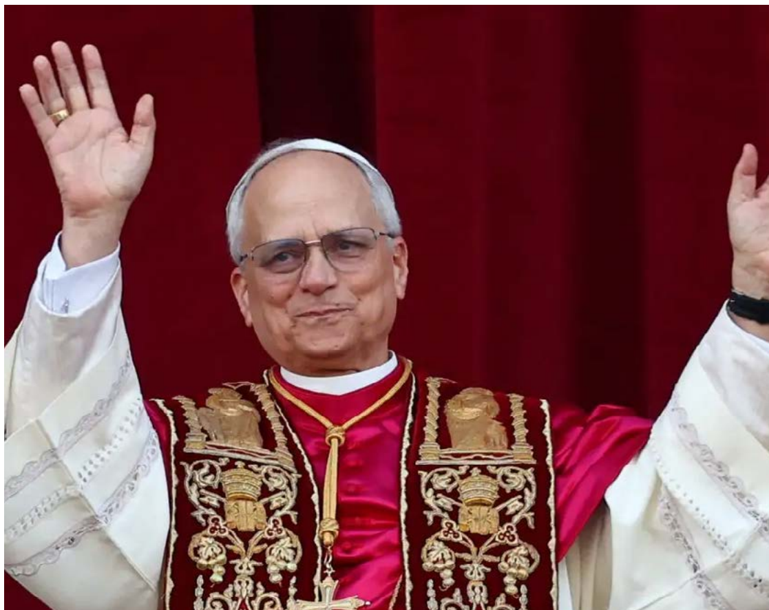
Robert Prevost, chamado de “pastor de duas pátrias”, promete seguir os caminhos do papa Francisco

Especialistas destacam que a escolha de um pontífice dos Estados Unidos era considerada improvável, devido ao peso político do país e à tradição da Igreja em evitar tal nacionalidade no comando do Vaticano. No entanto, a proximidade de Prevost com a América Latina e seu perfil pastoral pesa-