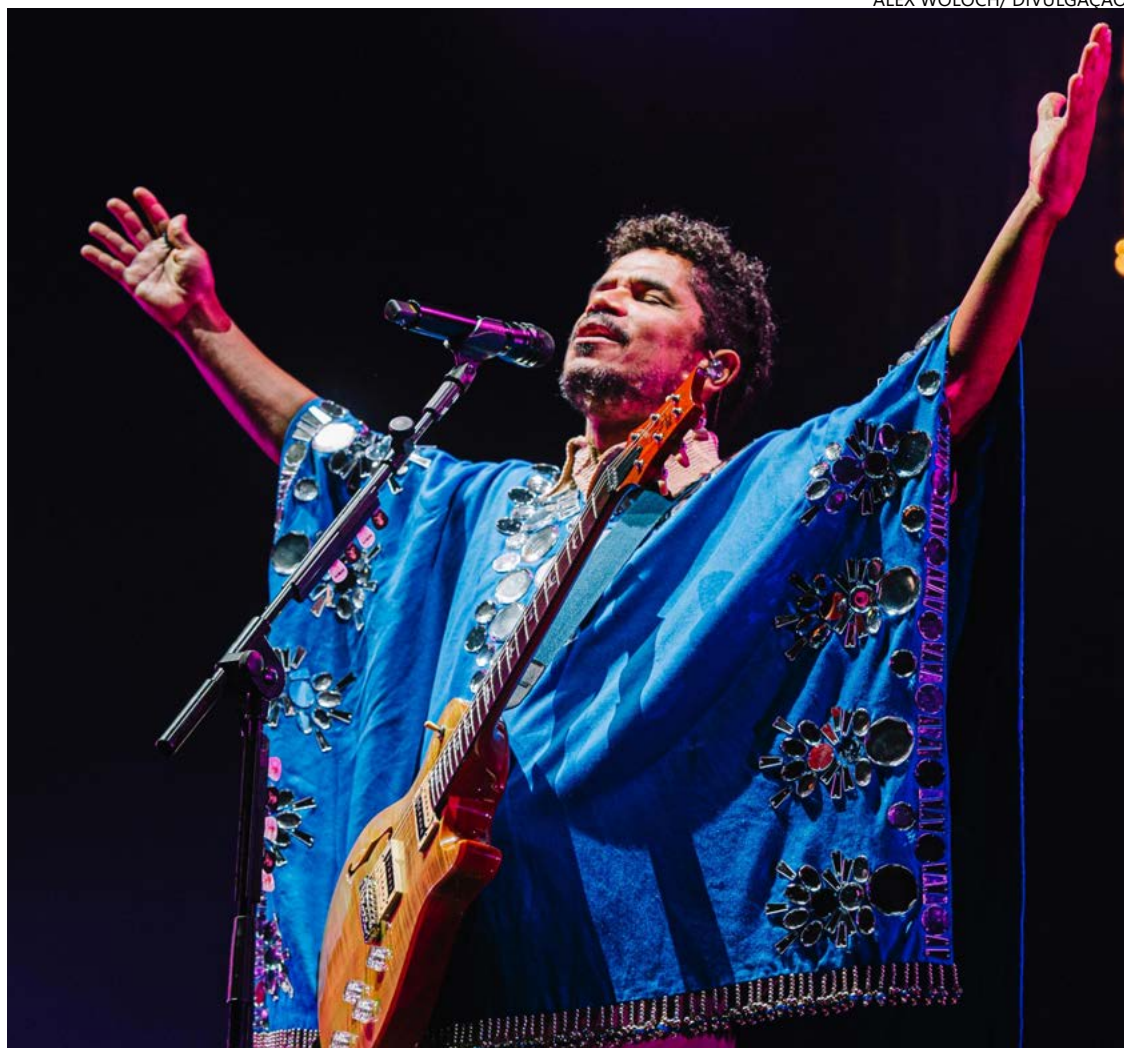
Brasilienses prometem apresentação apoteótica com hits que marcaram gerações

O espetáculo visual é um dos grandes atrativos, com produção assinada por Batman Zavarez. Uti-