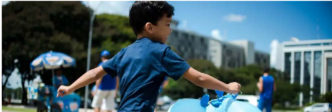
Dispositivo usa rastreamento ocular para auxiliar no diagnóstico de autismo

Dispositivo pode ser utilizado por qualquer profissional legalmente habilitado para dar diagnósticos médicos, em qualquer local com conexão à internet