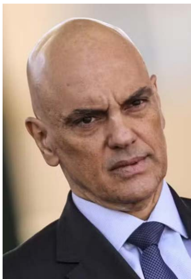
Alexandre de Moraes, ministro do Supremo Tribunal Federal (STF): caso não tem precedente na história dos EUA e Brasil

Nesse cenário, a pressão sobre Eduardo cresce. Se comprovado que o deputado buscou deliberadamente influenciar políticas externas de outro país contra autoridades brasileiras, ele poderá responder por atos contra o Estado democrático de direito, abuso de poder e atentado à soberania. A posição de Moraes no Supremo e seu protagonismo em investigações relacionadas ao 8 de Janeiro tornam qualquer medida articulada contra ele extremamente sensível do ponto de vista