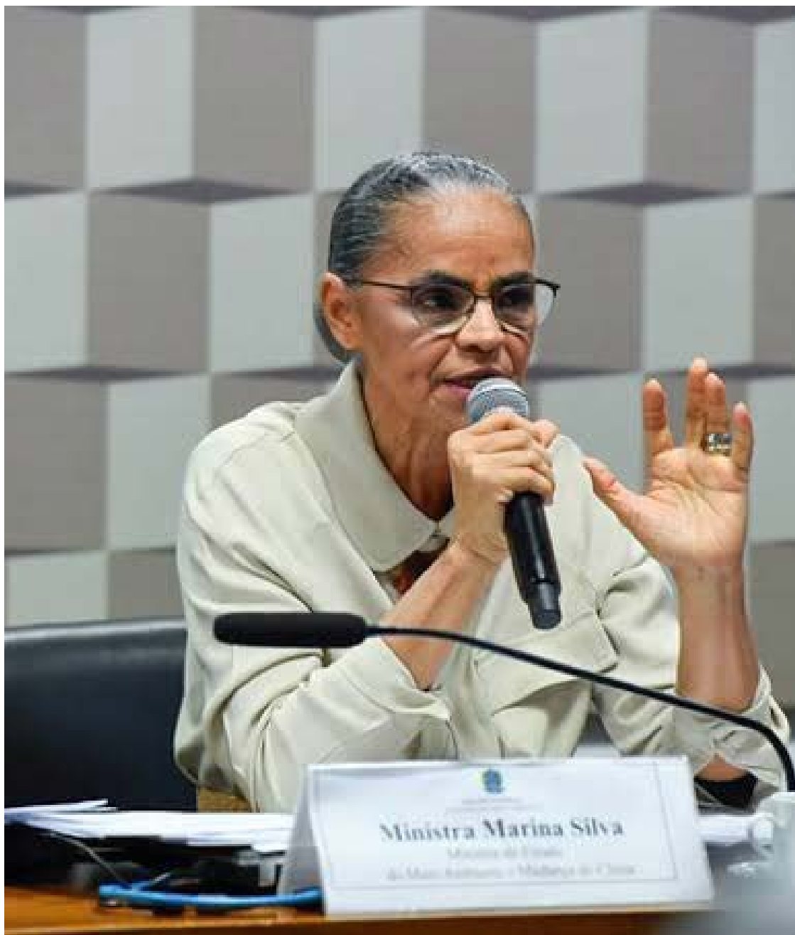
Ministra Marina Silva, do Meio Ambiente, foi vítima de ataques misóginos durante reunião no Senado

Marina disse ainda que foi vítima de violência de gênero, o que acontece o tempo todo com mulheres. Ela afirmou ainda que se sentiu agredida fazendo o seu trabalho, que era explicar tecnicamente a criação das unidades de conservação no Amapá, algo que deveria estar em discussão na audiência.