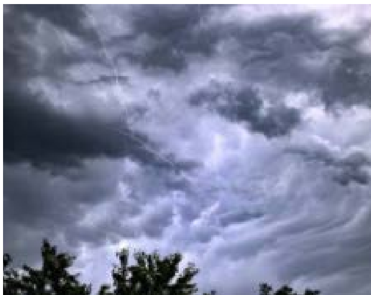
Temperaturas caem em Goiás a partir de quinta-feira

Em algumas regiões de Goiás, o Instituto Nacional de Meteorologia emitiu um alerta indicando temperatura mínima de até 5 °C devido à chegada da massa de ar polar na região central do país