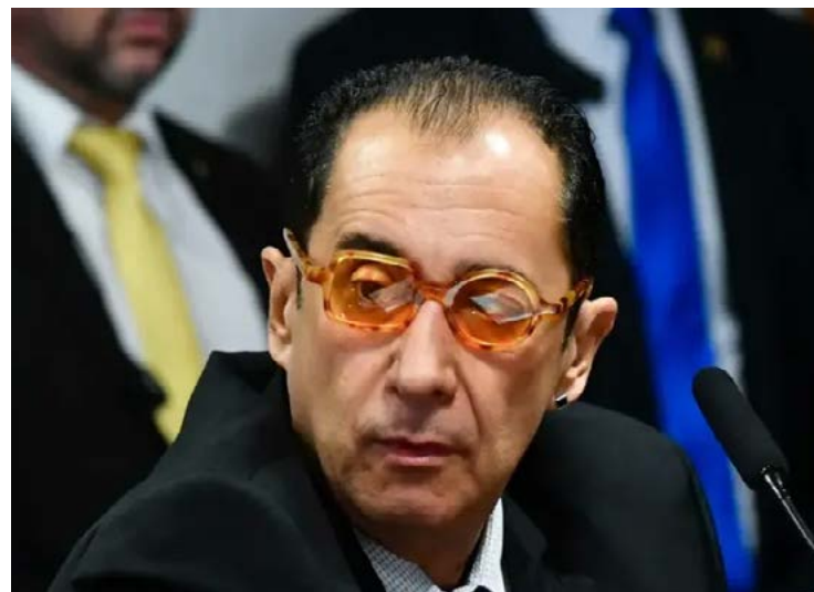
Jorge Kajuru: fim da carreira política já no ano de 2026

Senador defende mandato único de 5 anos para presidente, governadores e prefeitos