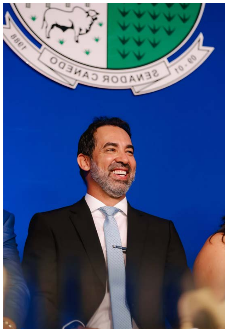
Prefeito de Senador Canedo, Fernando Pellozo, revela os segredos da sua boa gestão à frente da prefeitura

Em relação à corrida ao Senado, o prefeito apoia a ideia de uma chapa única, como tem defendido a primeira-dama de Goiás, Gracinha Caiado. “Con-