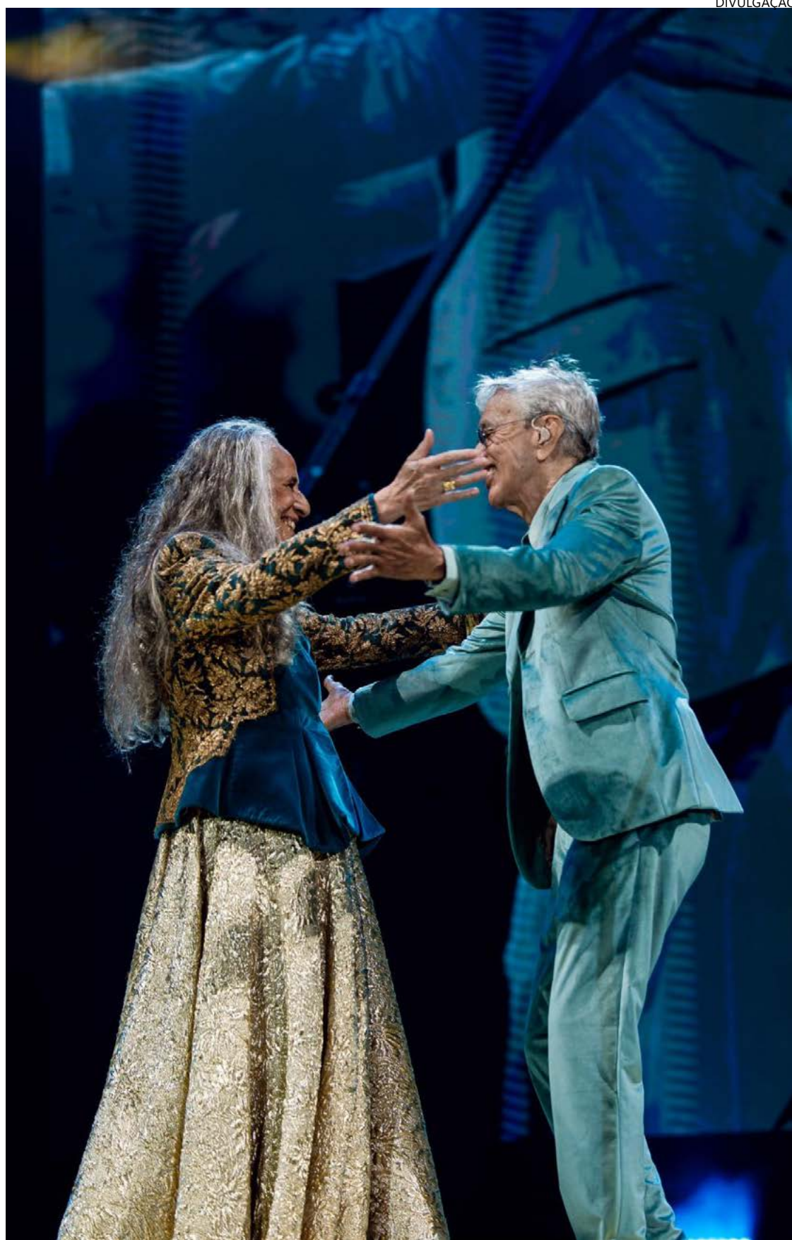
Maria Bethânia e Caetano Veloso revisitaram suas carreiras em estádios pelo Brasil

"Gente" teve duas gravações em 1977, nos dois