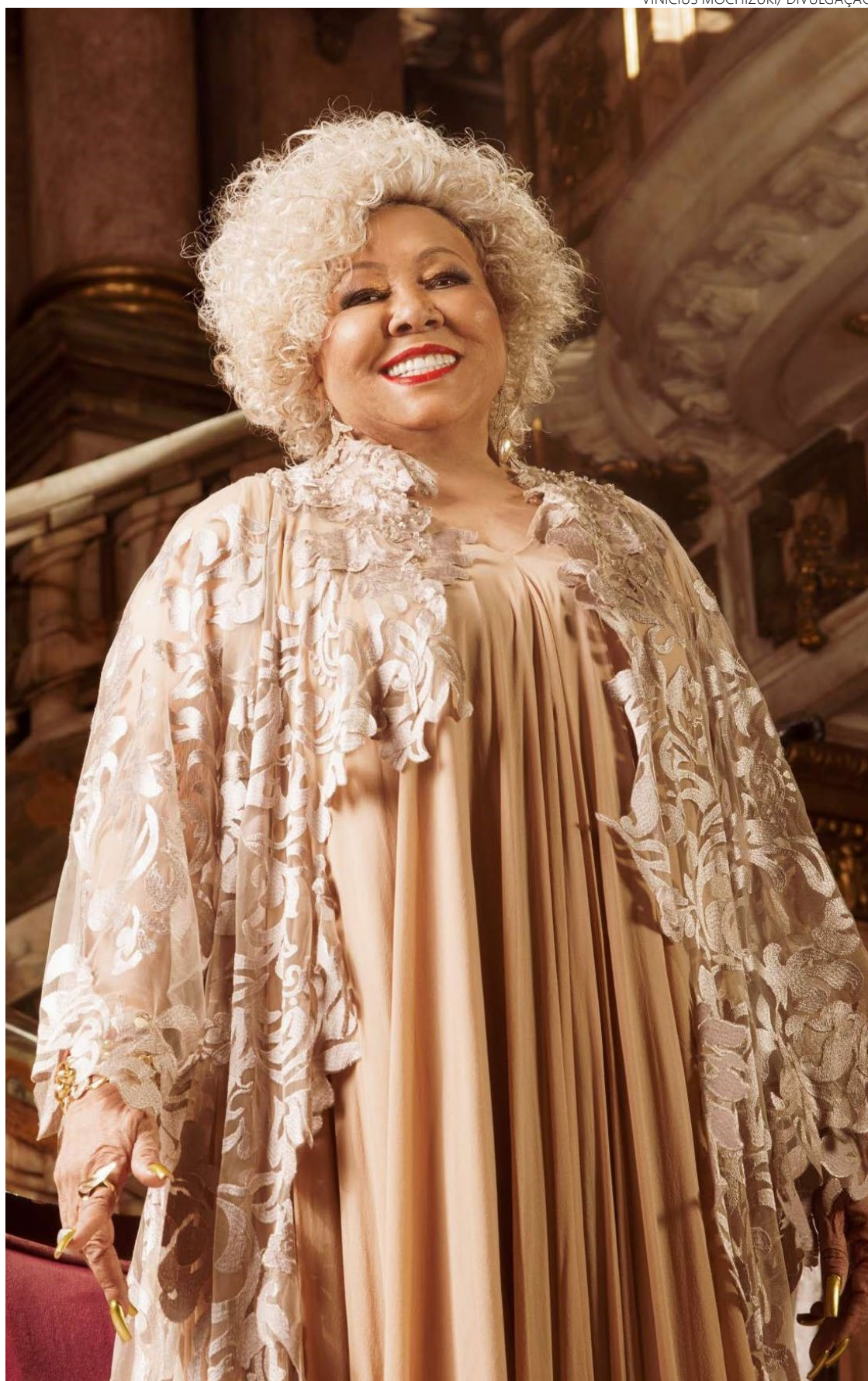
Alcione diz que vai continuar cantando enquanto “Deus permitir”

“Desde o início da carreira, quando as minhas canções começaram a tocar nas rádios e as minhas primeiras aparições nos programas de TV, o público foi chegando, os fãs começaram a aparecer”, rememora Alcione, radicada no Rio desde