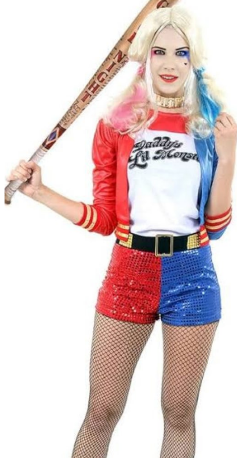
Pennywise, de "A Coisa": busca na internet