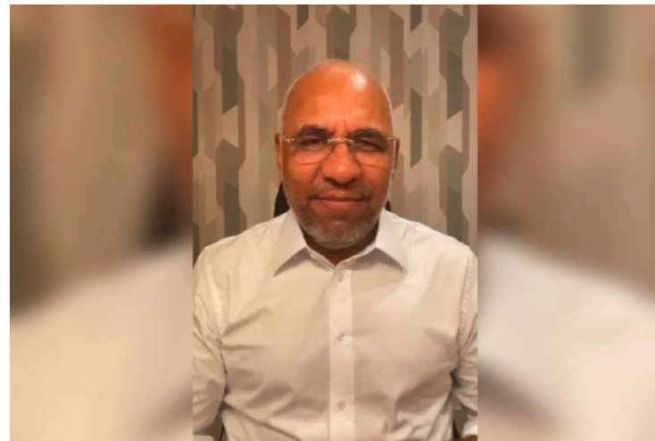
Rogério Cruz: dois meses para concluir mandato em Goiânia