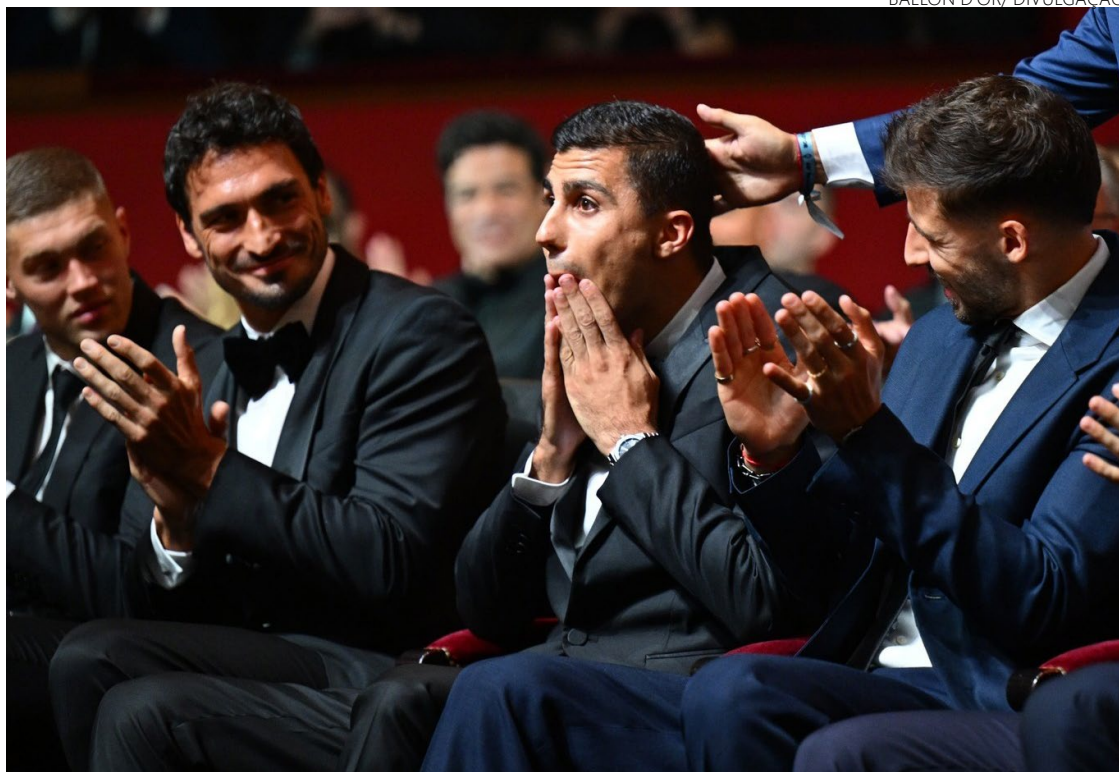
Surpresa: meia espanhol Rodrigo desbanca Vini Jr. em aguardada premiação do futebol

Internamente, o clube teria justificado a decisão dizendo que "se os critérios do prêmio não proclamam Vinicius ganhador, esses mesmos critérios devem proclamar Carvajal [espanhol também atleta do clube] ganhador", segundo a agência de notícias AFP. "Como isso não vai ocorrer, é óbvio que a Bola de Ouro-UEFA não respeita o Real Madrid. E o Real Madrid não vai onde não é respeitado."