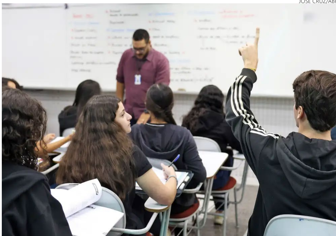
Dados informam que 4,3 milhões de candidatos foram inscritos para o exame

Todas as redes estaduais do país registraram médias na re-