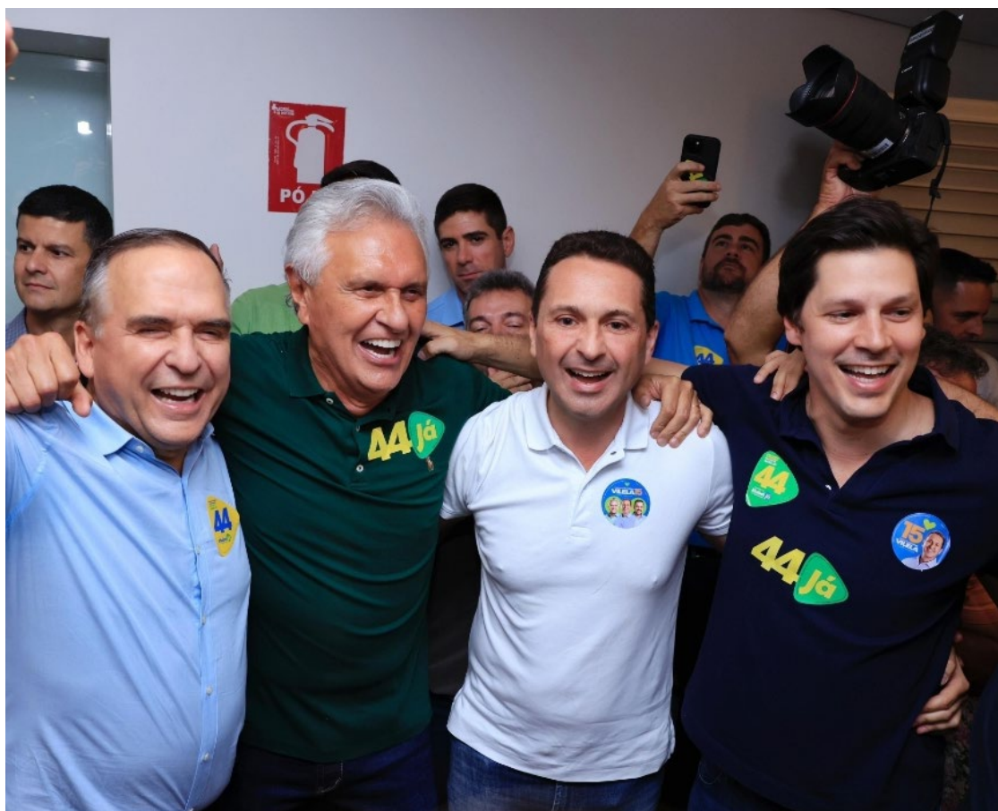
Ronaldo Caiado e Daniel Vilela foram os grandes vitoriosos na disputa das cidades: gestores foram fundamentais para 80% de êxito na lista das 30 maiores cidades de Goiás

Ronaldo Caiado e Daniel Vilela foram os grandes vencedores das eleições municipais em Goiás, com vitórias em 24 dos 30 maiores municípios do estado - equivalente a 80% das cidades mais importantes e densas do Estado. O União Brasil venceu em 13 destas cidades; MDB em 9, PP, 2.