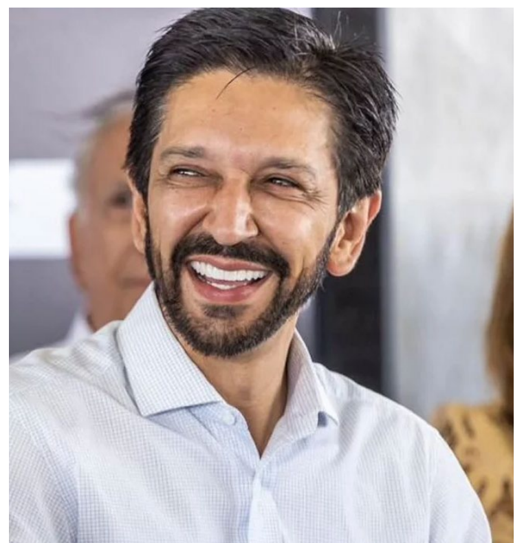
Ricardo Nunes (MDB): prefeito reeleito em São Paulo

O Nordeste concentrou a maioria das reeleições, com as vitórias de João Campos (PSB) no Recife, Bruno Reis (União Brasil) em Salvador, JHC (PL) em Maceió e Eduardo Braide (PSD) em São Luís.