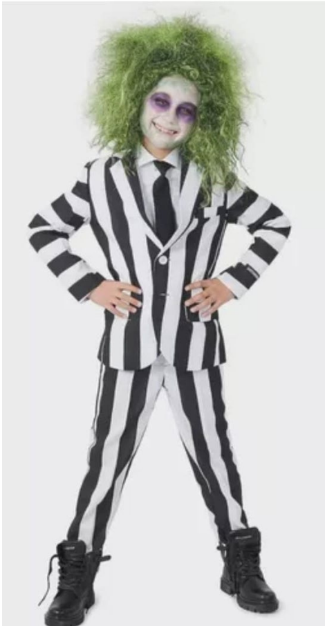
Beetlejuice de "Os Fantasma se Divertem": mais procurada