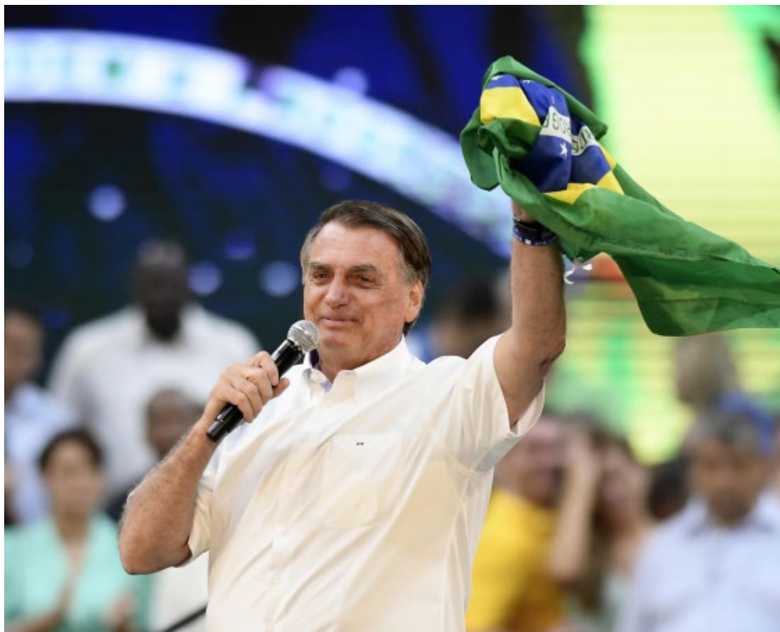
Jair Bolsonaro: balanço negativo do PL no segundo turno das eleições

Quando estava possivelmente na estrada —o ex-presidente viajou a Goiânia de carro— Caiado dava entrevista dizendo que pretende ensinar a Bolsonaro, que se achava "o dono da verdade e dos votos", o jeito certo de fazer política no campo conservador.