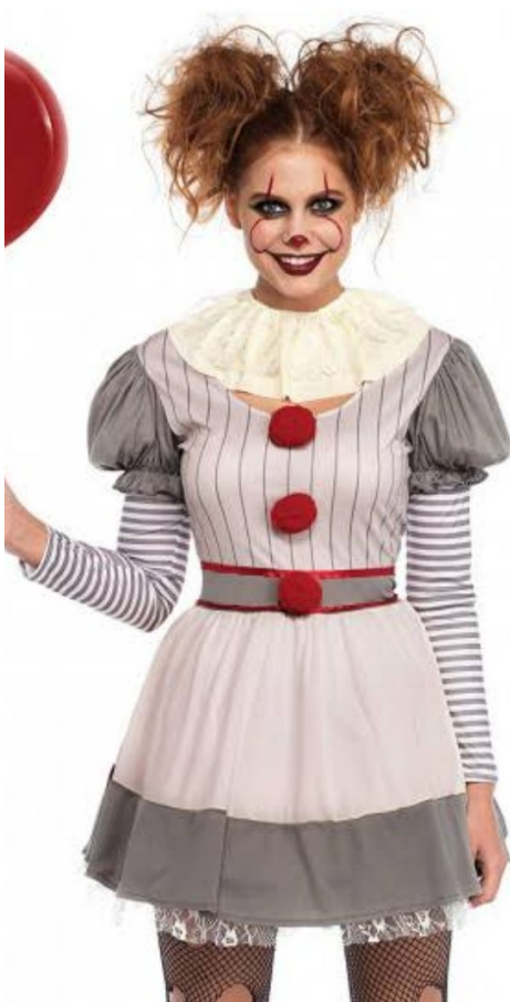
Arlequina, mais buscada no Halloween e no Carnaval