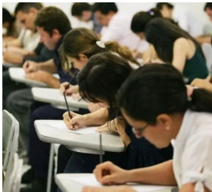
Distribuição segura dos cerca de 9 milhões de provas impressas e folhas de respostas

Exame coordenado pelo Ministério da Educação ocorrerá nos dias 3 e 10 de novembro