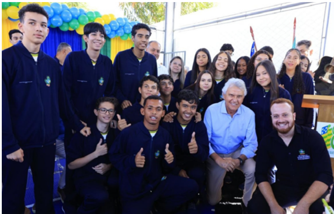
Ronaldo Caiado e estudantes na nova sede do Colégio Estadual Dom Fernando I, no Jardim Dom Fernando I

A nova sede conta com cinco blocos de alvenaria, 12 salas de aula, cozinha com refeitório, bloco administrativo, quadra coberta, central de gás e dispositivos de acessibilidade e prevenção a incêndios. Desde abril, já estão em funcionamento duas turmas do 9º ano do Ensino Fundamental e 16