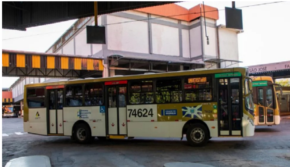
A gratuidade da tarifa aos domingos e feriados, conforme destacou o prefeito, será o primeiro "gesto" do projeto

A gratuidade da tarifa aos domingos e feriados, con-