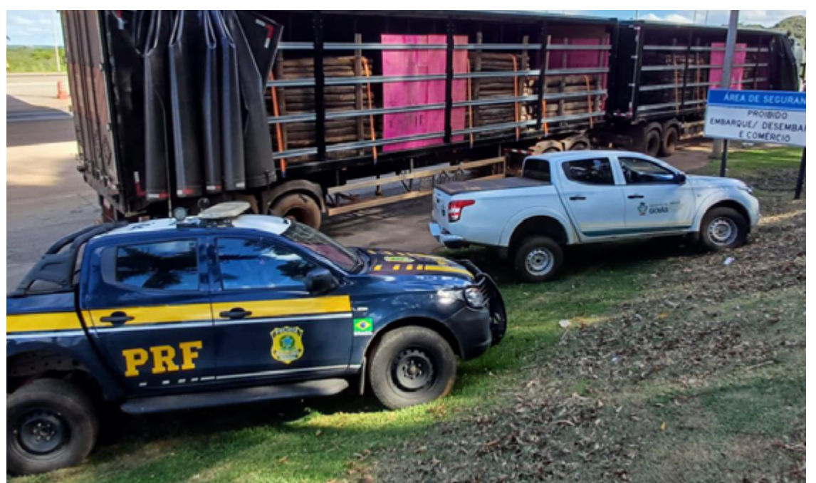
A verificação da documentação revelou inconsistências substanciais para a apreensão do veículo

A carga e o caminhão ficaram sob responsabilidade da Secretaria de Estado de Meio Ambiente e Desenvolvimento Sustentável (Semad), em Anápolis. Após os procedimentos, o motorista foi liberado.