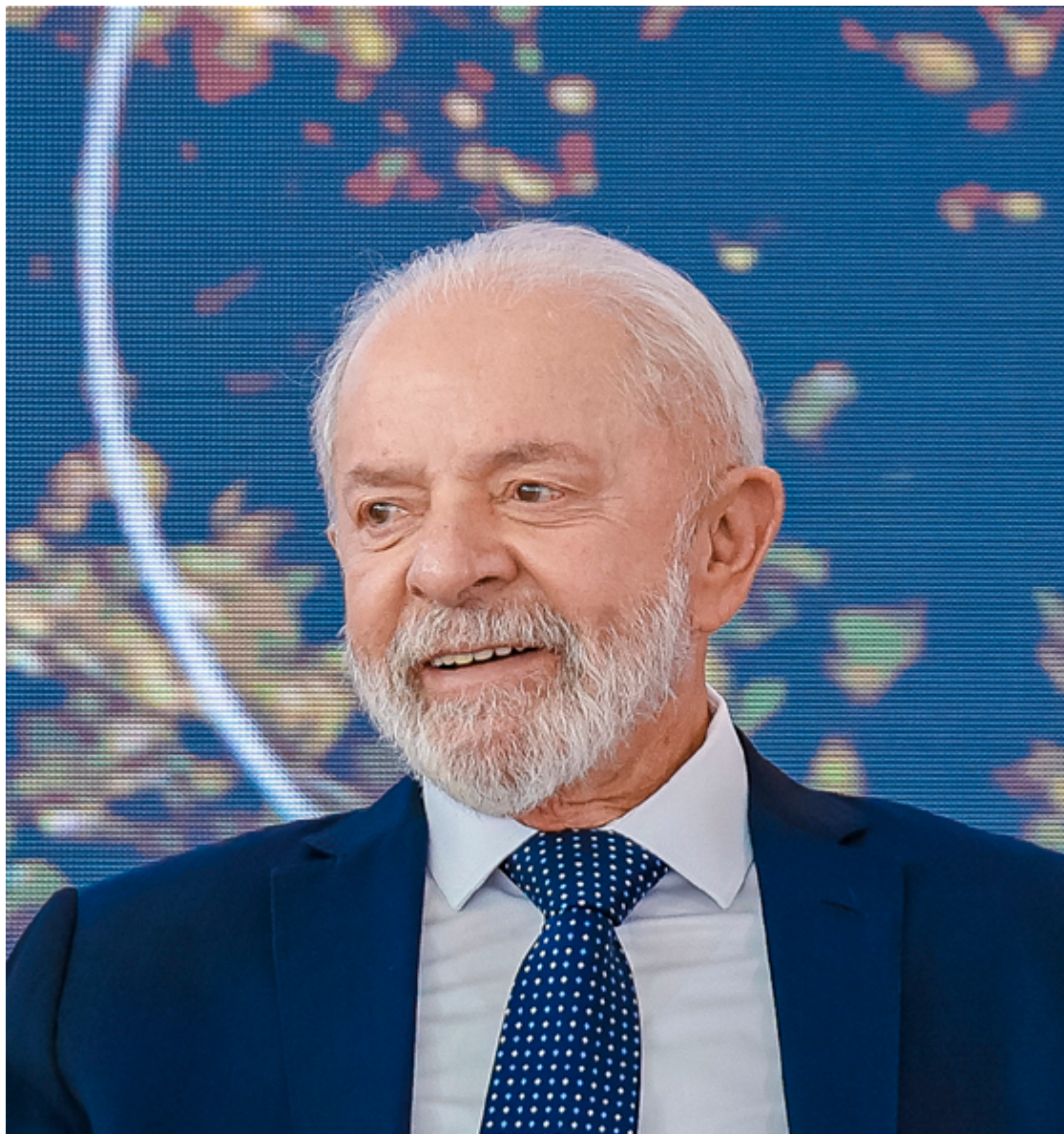
Presidente Lula vetou parte da lei que diminuía ações de controle e transparência nos salários do judiciário

A lei implementa um programa especial com o objetivo de assegurar a essas autoridades, e também aos oficiais de Justiça, "proteção por circunstâncias decorrentes do exercício de suas funções, sempre que demonstrada a necessidade".