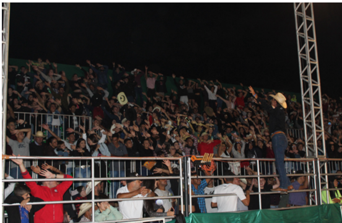
Em Anápolis, a Pecuária está prevista para acontecer entre os dias 30 de julho e 03 de agosto