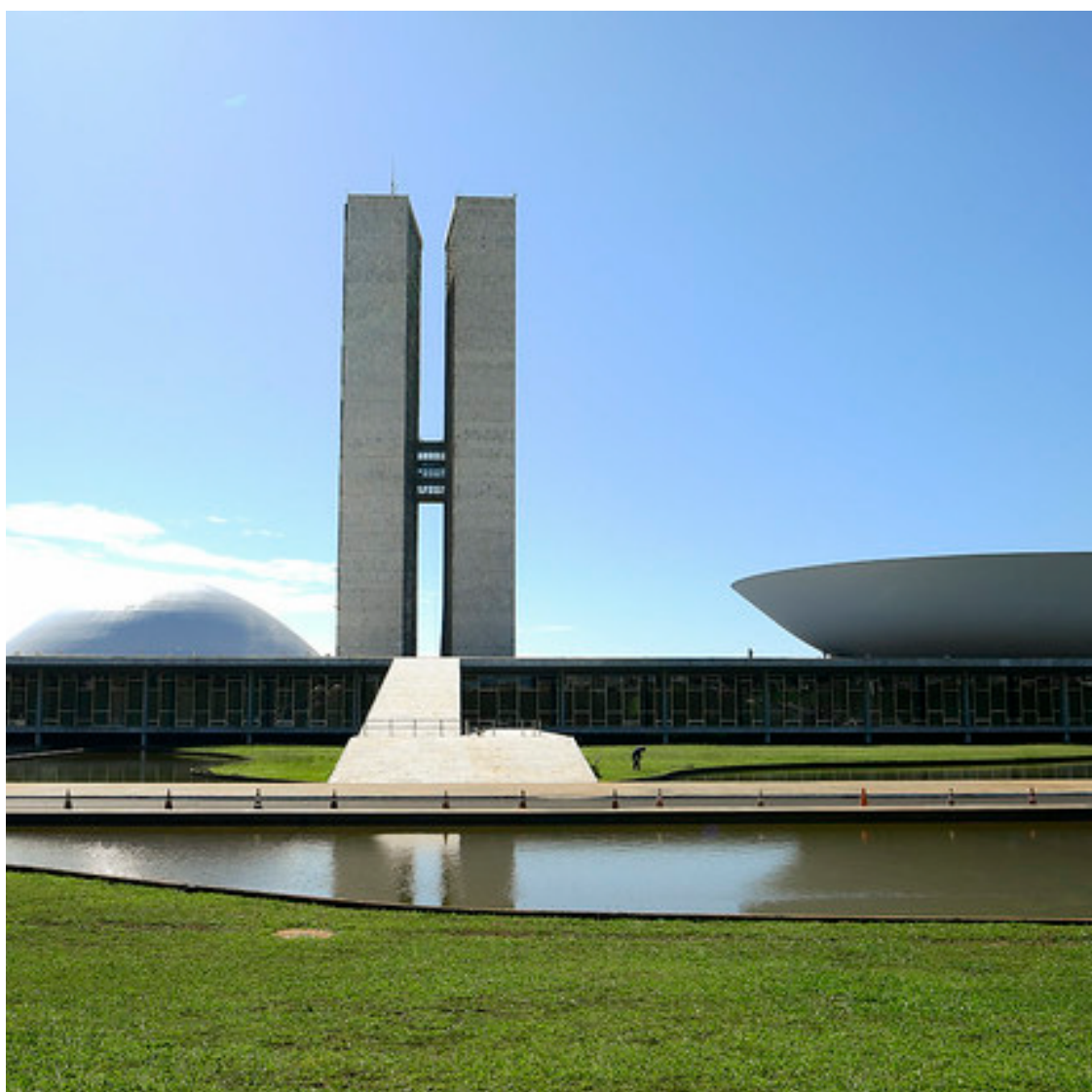
Sede do Congresso Nacional: Câmara aprovou aumento de parlamentares mas projeto tem que passar pelo Senado

Ao todo, nove estados ganham cadeiras com o novo arranjo: Pará (4), Santa Catarina (4), Ama-