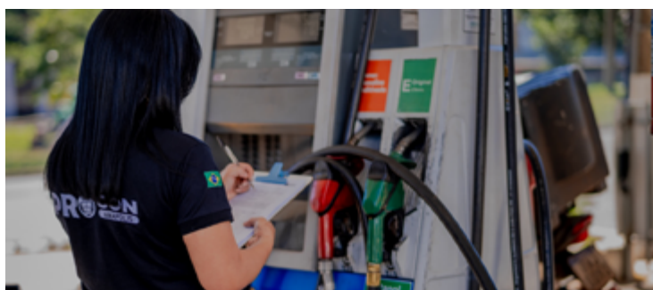
O órgão também ressalta que os postos de combustíveis podem praticar preços diferentes para pagamentos à vista e a prazo

O diesel S-10 apresentou variação de 12,30%. O maior preço foi encontrado no Posto Nota 10, Posto Rezende II, Pos-