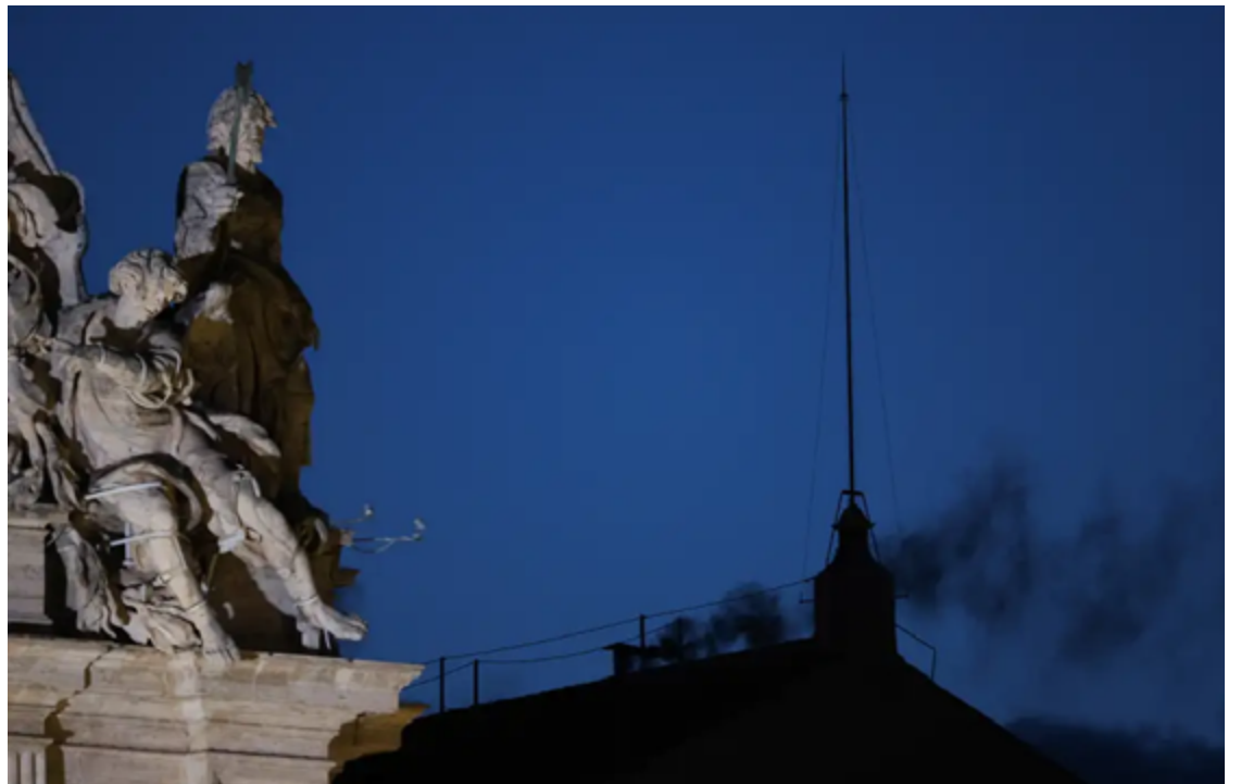
133 cardeais reunidos ainda não chegaram a um consenso sobre o sucessor do papa Francisco

No fim da tarde, foi realizado o primeiro escrutínio. Como esperado, não houve maioria de dois terços (89 votos) para nenhum