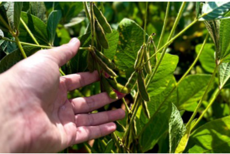
Soja mantém liderança absoluta entre os maiores VBPs de Goiás, com crescimento de 61,3% de 10 anos

Estimativa da Seapa aponta para VBP de R$ 119,4 bilhões, com destaque para desempenho da soja e da bovinocultura