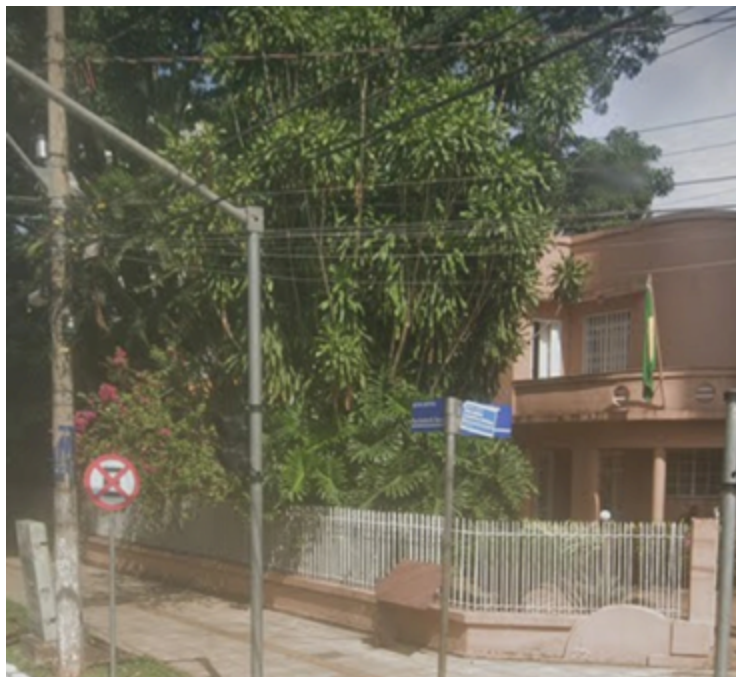
Casa de Pedro Ludovico está preservada e recebe visitas para mostrar a política e vida social goiana