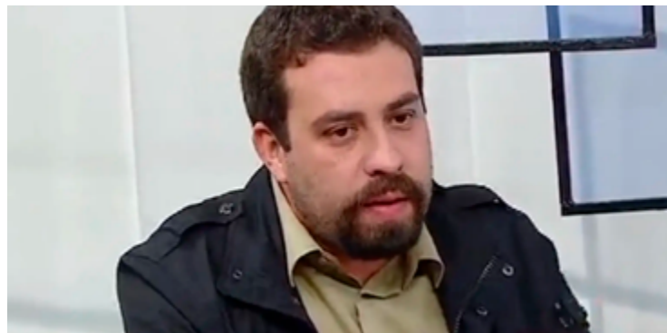
Guilherme Boulos, pressionado no PSOL por apoio ao governo Lula

Ala majoritária, liderada por Guilherme Boulos, defende o apoio ao governo Lula, enquanto a minoritária acusa o partido de se afastar de seus princípios socialistas