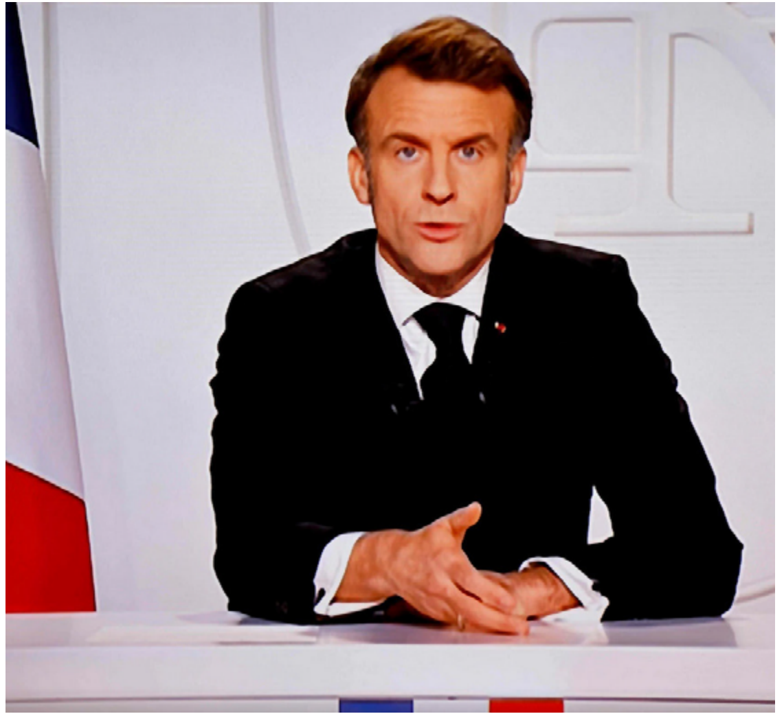
Macron em discurso dramático choca a nação: 'Europa à beira do precipício russo'

Macron anunciou duas iniciativas cruciais: uma reunião de todos os chefes militares europeus em Paris na próxima semana e a abertura de um debate estratégico sobre a extensão da proteção nuclear francesa aos aliados europeus. Estas medidas demonstram a determinação da França em liderar uma resposta europeia coordenada às ameaças de segurança.