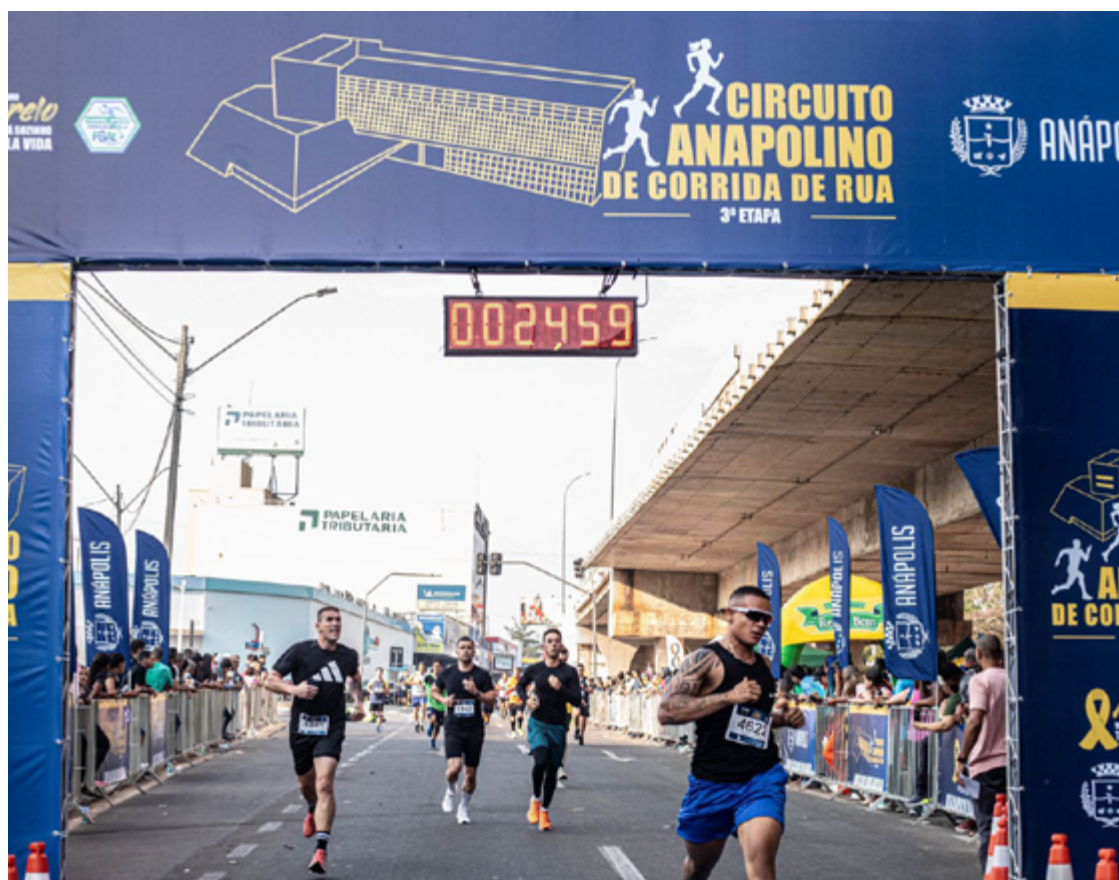
Após a corrida, haverá um show de rock nacional e MPB com a banda Irmãos Ayres

Assim como nos anos anteriores, também serão disponibilizados 500 kits por etapas, contendo sacochila, camiseta e viseira. No entanto, desta vez, a estratégia de distribuição será diferente. Nas edições passadas, o kit era entregue para os primeiros 500 inscritos, o que causava congestionamentos no site de inscrição. A partir de agora, haverá sorteios para definir quem receberá o material.