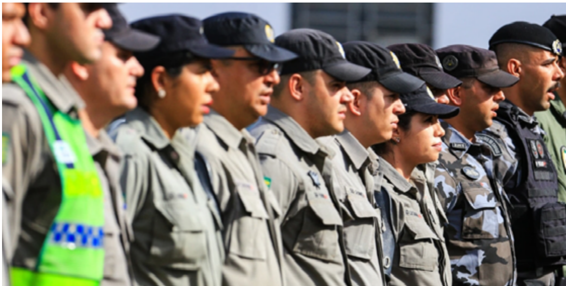
Policiais convocados atuarão em 19 cidades: governo nomeou mais de 1,5 mil policiais militares desde 2022

O concurso ofereceu 1.670 vagas para diversas funções, incluindo soldado combatente, cadete e oficiais da saúde. A seleção contou com provas objetiva e discursiva, teste físico e avaliações psicológica e de antecedentes. As primeiras convocações ocorreram em maio e setembro de 2023, chamando 1.370 candidatos.