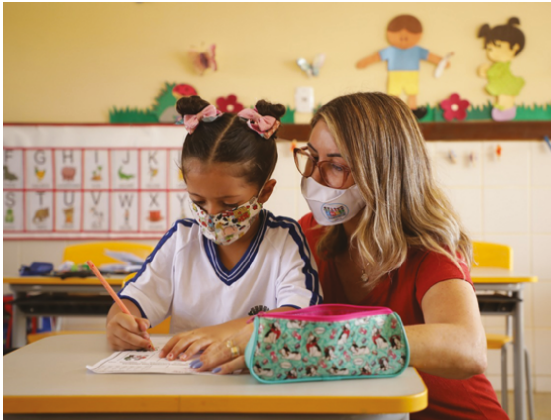
As vagas são temporárias e visam reforçar a eficiência da Rede Municipal de Ensino

O resultado preliminar será divulgado em 12 de