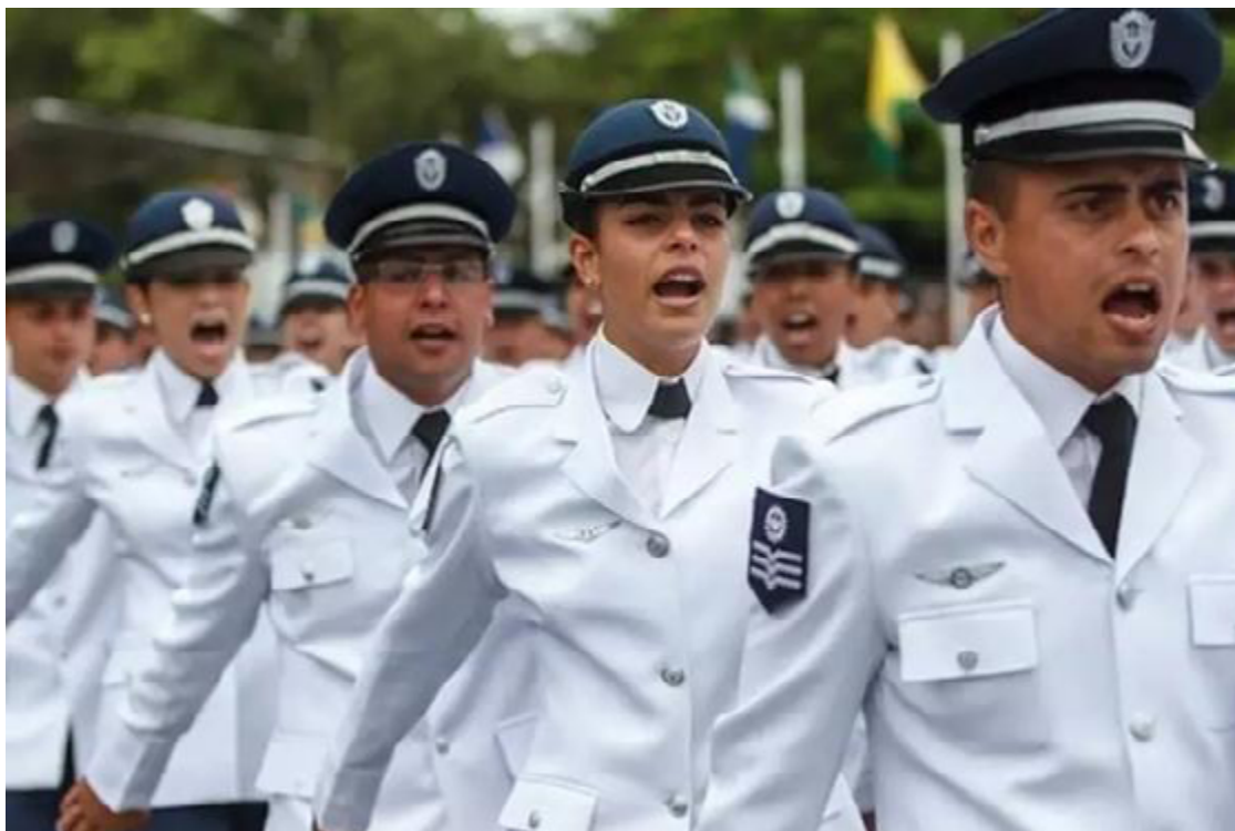
Além das provas escritas, o concurso terá diversas etapas eliminatórias e classificatórias

Para os cargos de médico, dentista, farmacêutico