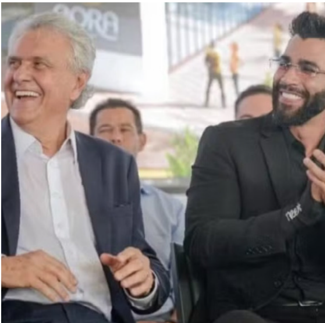
Ronaldo Caiado e Gustavo Lima estarão juntos para disputar eleições de 2026: chapa da direita mais competitiva

Jair Bolsonaro já disse que o PL aceita conversar com o cantor, mas também vetou sua candidatura ao Planalto.