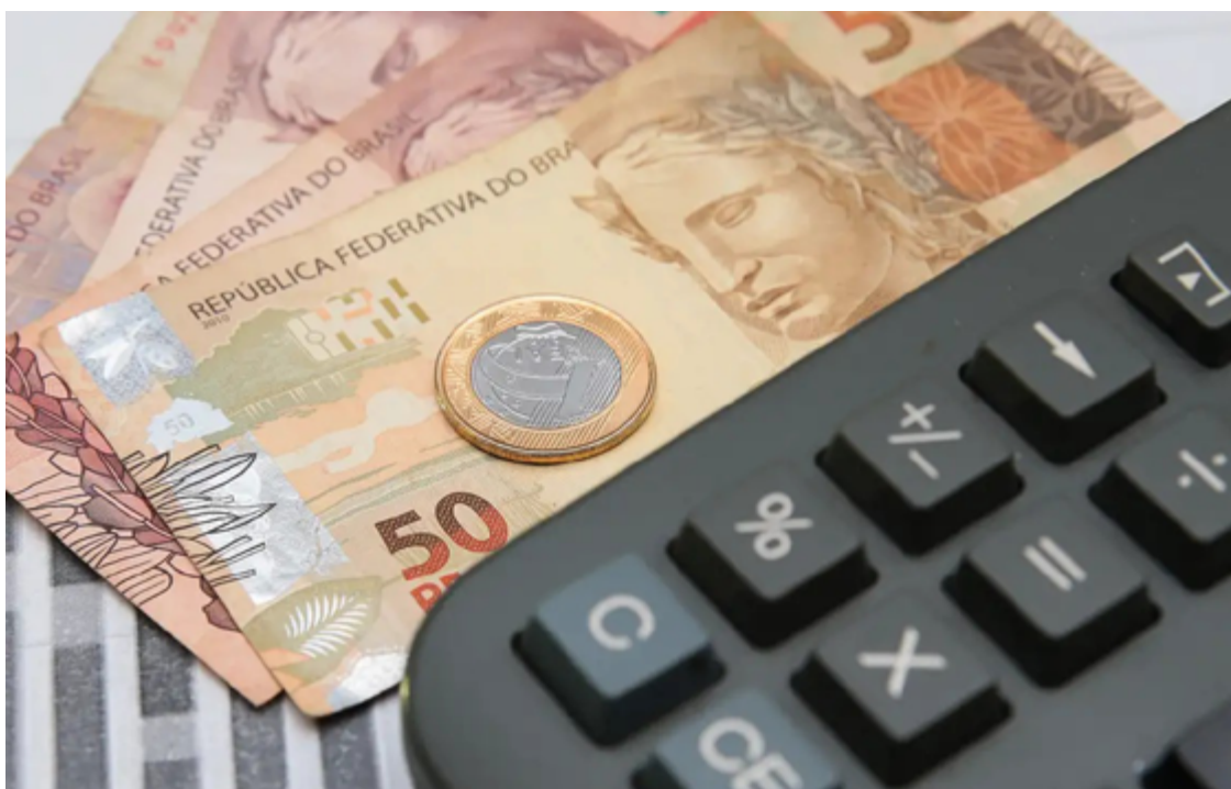
Mesmo para quem ainda não organizou sua gestão financeira, ainda há tempo de recuperar o controle

"Quando os empresários deixam para organizar as finanças apenas após o Carnaval, já perderam quase dois meses do ano sem planejamento estruturado. Isso significa que decisões importantes foram postergadas, investimentos foram adiados e, em muitos casos, despesas desnecessárias continuaram sem controle. Esse atraso pode impactar diretamente a lucratividade e a sustentabilidade do ne-