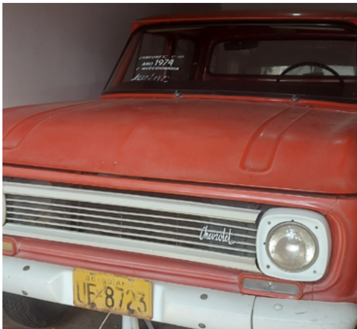
Velha caminhonete de Pedro Ludovico: ex-governador usava veículo para se deslocar até sua fazenda

pelo escultor grego-goiano Angelos Ktenas revela em 3D o rosto magro e longo de Pedro.