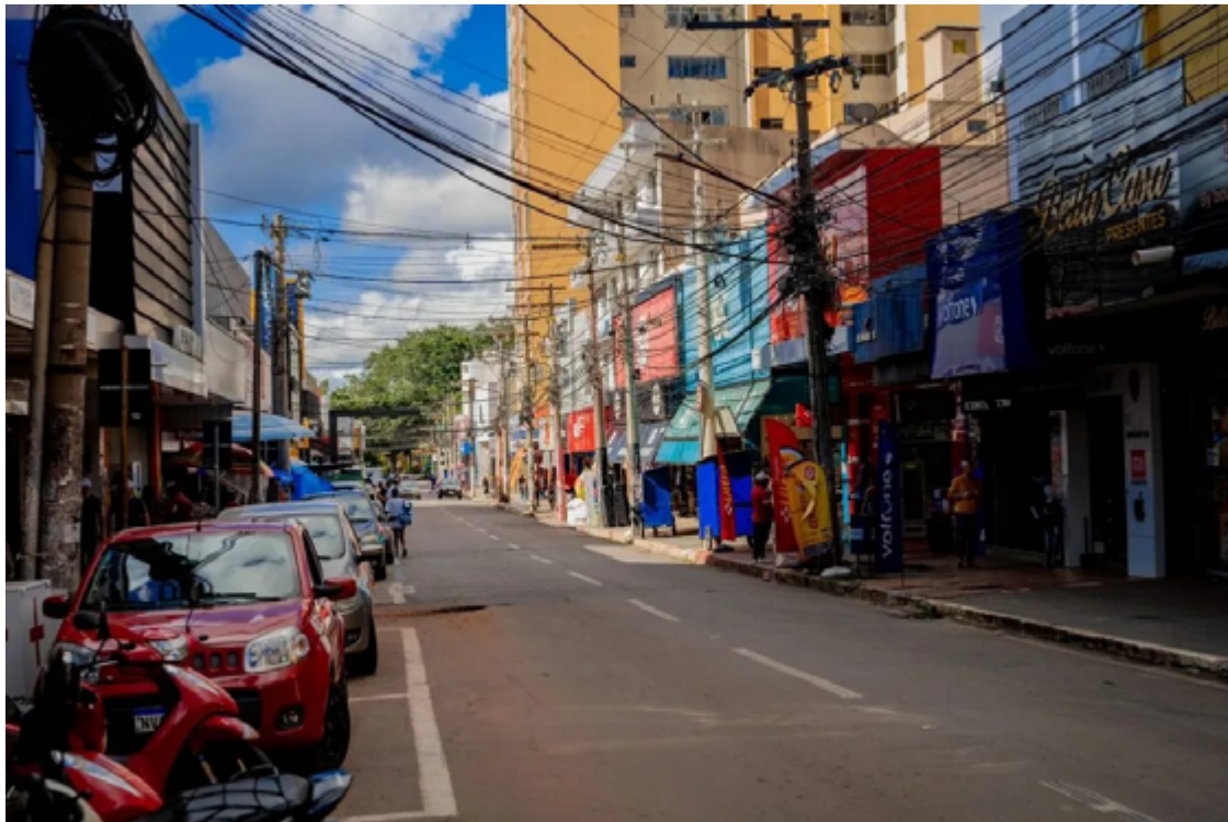
Conforme o Caged, Anápolis detém hoje um estoque de 115.424 vagas formais de trabalho

O bom resultado de janeiro foi muito galgado no desempenho do setor de serviços, responsável por um saldo positivo de 402 vagas. A indústria ficou em segundo lugar, com 204. De-