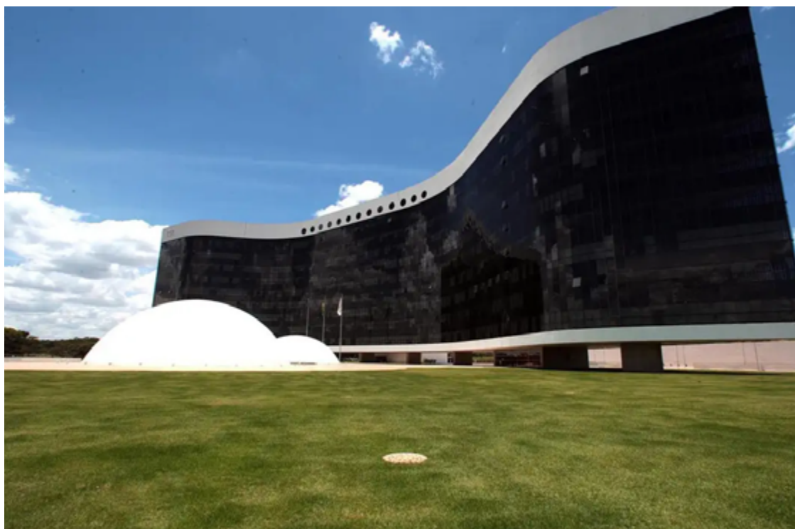
TSE: cotas para candidaturas femininas têm 30 anos, mas é importante aprimorar mecanismo

Diz ainda ser necessário efetivar as regras existentes na legislação e aprovadas pelo TSE (Tribunal Superior Eleitoral) para fortalecer candidaturas de mulheres. "Também é importante haver fiscalização."