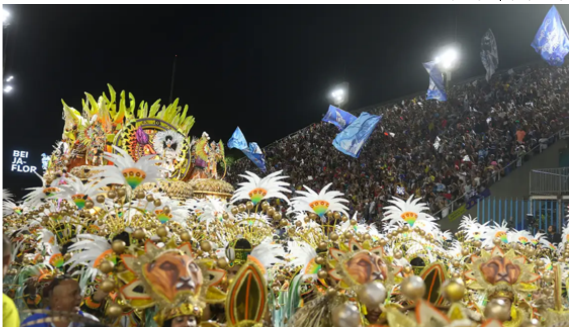
A apuração começou com um pouco de atraso às 16h10, na Cidade do

Já a Unidos de Padre Miguel recebeu as piores notas e vai desfilar na Série Ouro, no ano que vem. A tradicional escola da Zona Oeste tinha acabado de voltar ao Grupo Especial e trouxe para a Sapucaí o desfile Egbé Iyá Nassô, uma homenagem aos