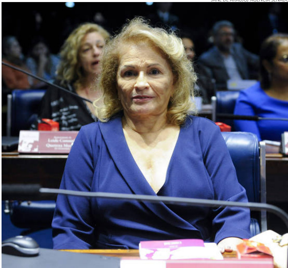
Vida pós-cargo: futuro político se estagnou e não conseguiu êxito para chegar a cargos eletivos