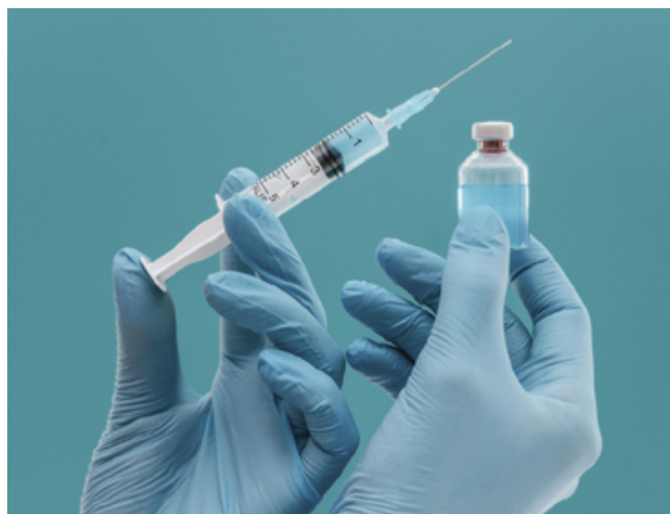
Essa vacina é mais uma aliada do processo de envelhecimento saudável

A vacina é indicada para adultos a partir dos 50 anos e é administrada em duas doses, com um intervalo de dois me-