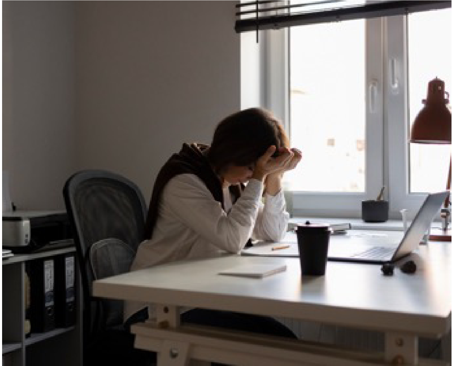
"Nem tudo o que desejamos é realmente nosso próprio anseio. Muitas vezes, são desejos induzidos por publicidade e redes sociais"