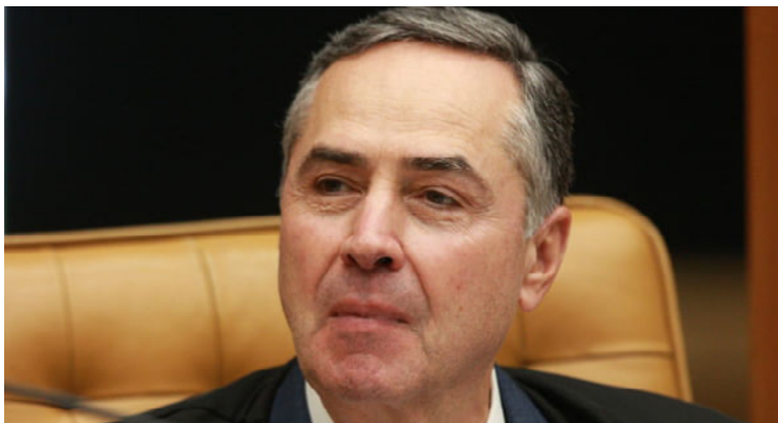
Luís Roberto Barroso: Brasil vive em normalidade democrática e harmonia entre os poderes

Apesar disso, magistrados dizem avaliar que pode crescer a pressão política para que o ex-presidente tenha a inelegibilidade revertida via perdão