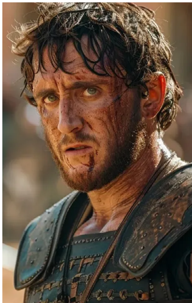
Paul Mescal: Lucius segue cartilha de protagonista bastante tradicional

entregou. Aí a ideia morreu. Dois anos depois, eu voltei a pensar nesse filme", ele diz.