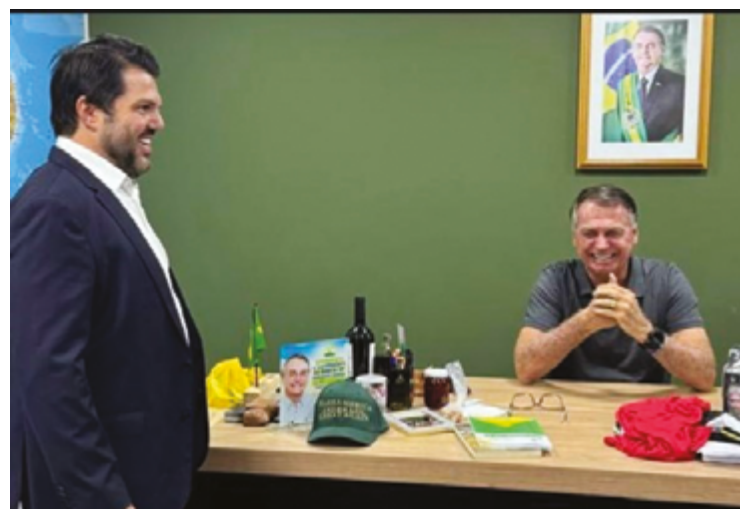
O prefeito eleito também se encontrou com o ex-presidente Jair Bolsonaro

Segundo ele, há uma boa interação com o Senai e acredita que, em breve, terá notícias importantes nesta área para a população anapolina, “sobretudo os nossos adolescentes, nossos jovens que terão a oportunidade dentro do nosso programa de governo, planejamos capacitar 5