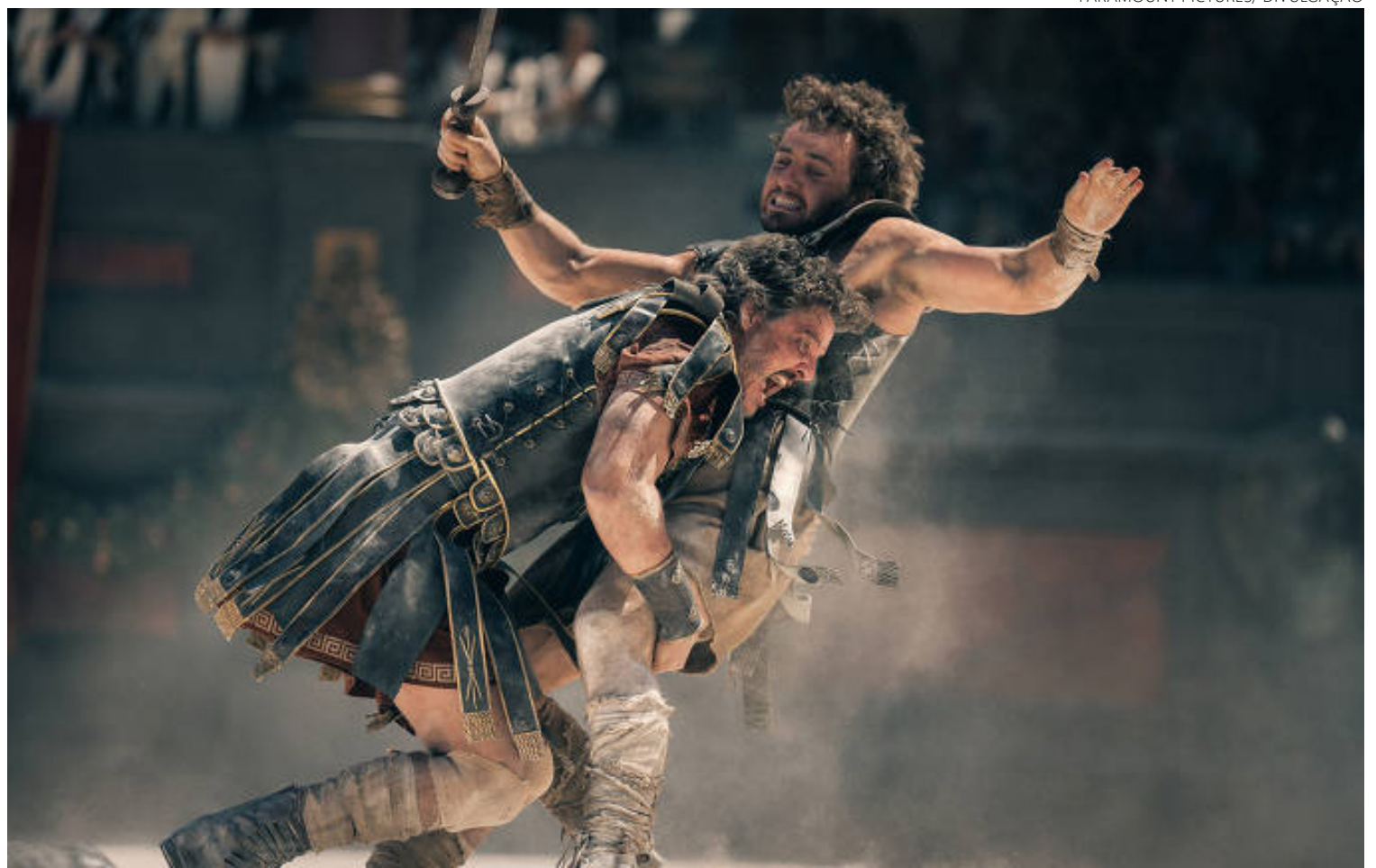
Roma antiga: primeiro 'Gladiador' foi criticado por historiadores em razão de incoerência factual entre trama e registros documentais

"Mas percebi que um novo 'Gladiador' poderia continuar o que foi dito no primeiro de forma mais complexa. Tentamos com um roteirista, esperamos por um ano, e ele não