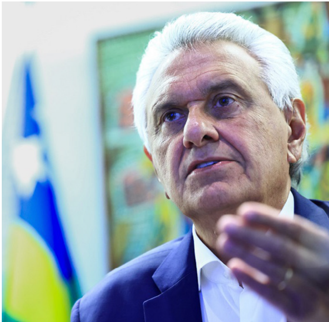
Ronaldo Caiado: governo Lula não resgata promessas feitas na campanha de 2022

Ao comentar os resultados das eleições de 2024, Caiado observou que a população está cansada dos extremos. “As pessoas não suportam mais isso. O Brasil não deseja divisões ou conflitos. Quer alguém capaz de promover a paz e que priorize o essencial, como discutir renda per capita, potencial de crescimento, industrialização e apoio à inovação e pesquisa. Onde estão essas discussões?”,