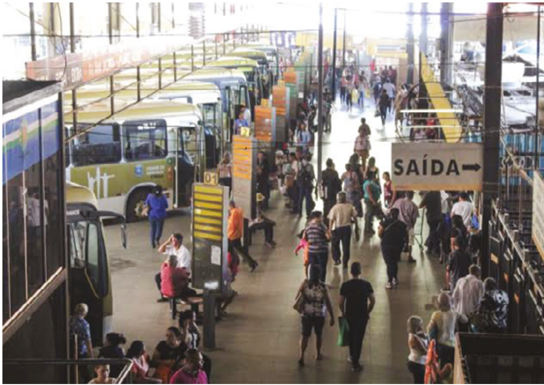
Negociações sobre o reajuste ocorrem a poucos dias da data anunciada pelo sindicato da categoria para início de greve

O Sindicato dos Trabalhadores em Transportes Rodoviários de Anápolis (SITTRA) cobra da Urban o reajuste