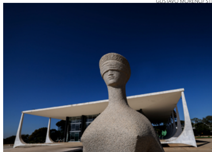
Decisão será debatida na manhã de hoje em sessão virtual

A entidade questiona a Lei 14.790/2023, norma que regulamentou as apostas online de quota fixa.