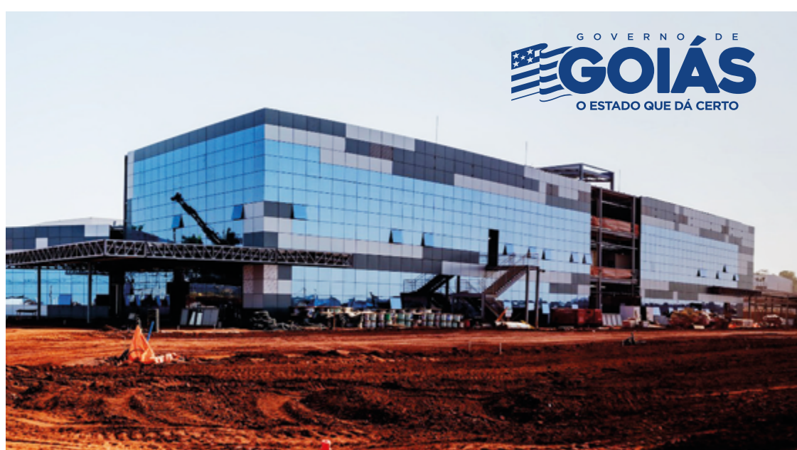
Hospital vai transformar atendimento oncológico; ala pediátrica será entregue em 2025

Um exemplo é o impacto que o CORA representará na