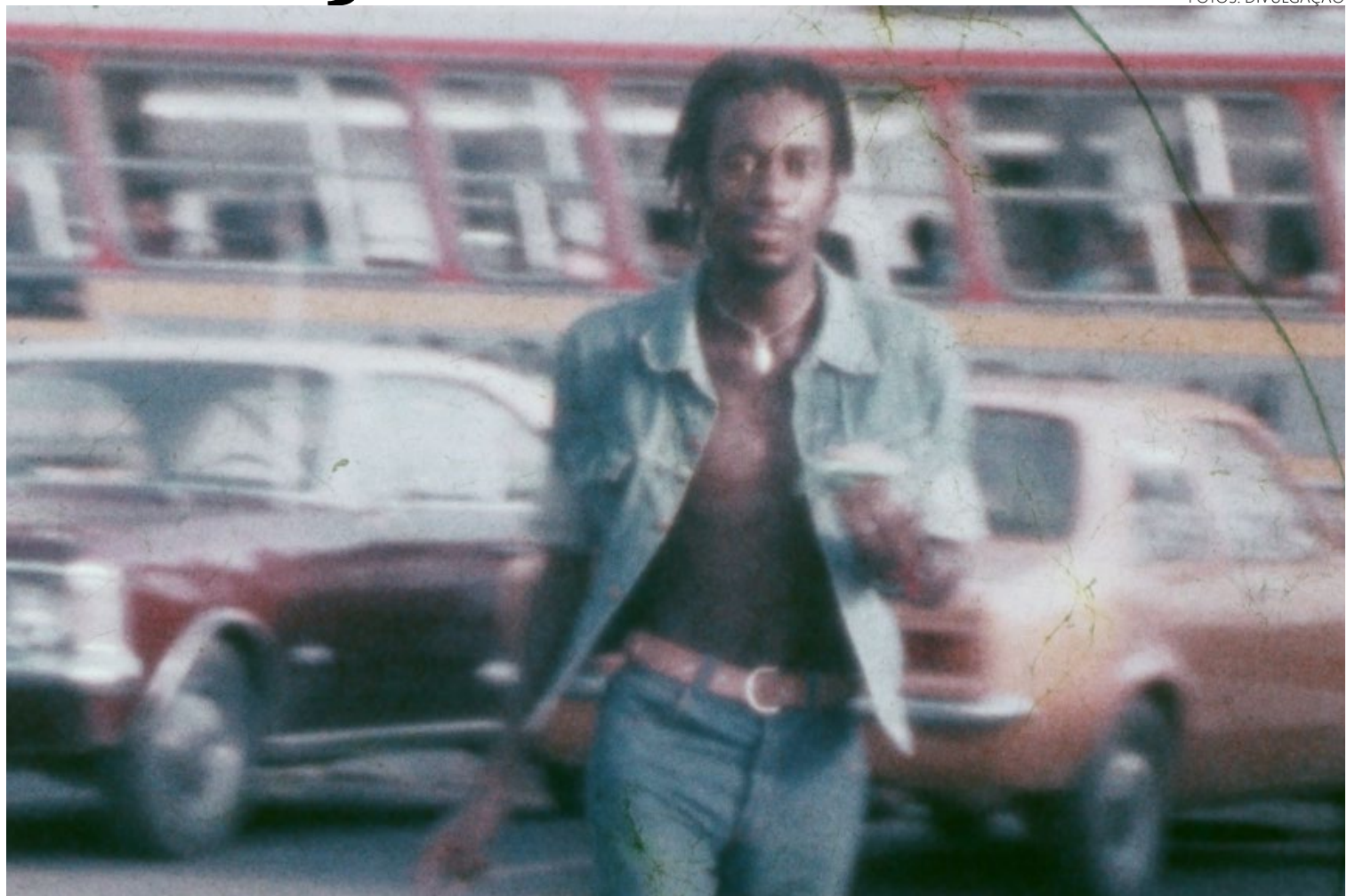
Poeta urbano: artista jamais aceitou a pecha de sambista, utilizada por empresários para aprisioná-lo em suas amarras

Melodia tinha voz aveludada. Seu vibrato, perolado e requintado, encantou o Brasil. Até o fim, o qual se anunciou