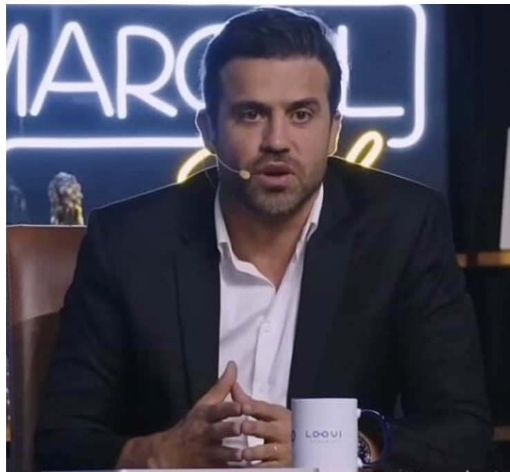
Pablo Marçal (PRTB): 'Sou cabeça de chapa'