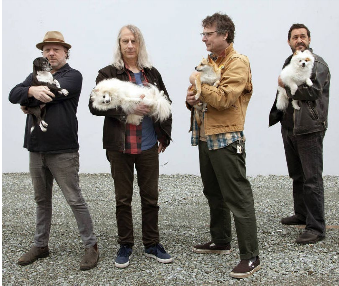
Uma das bandas preferidas de Kurt Cobain se apresenta em SP, no Rio e em BH

Talvez o que justifique a devoção dos fãs seja a energia