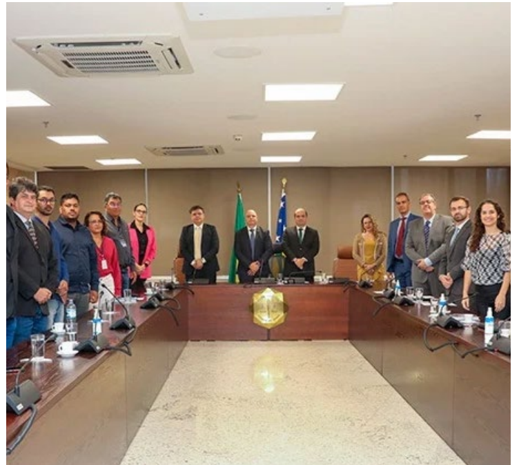
Leandro Crispim, presidente do TJGO: Apresentação de resultados