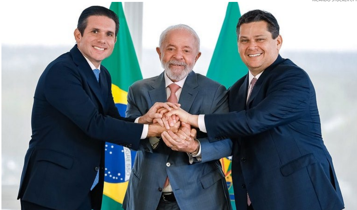
Petista deve mexer nas pastas ocupadas por membros de seu partido e ministros de sua cota pessoal

O período dessa articulação coincide com um momento de desgaste do ministro do Desenvolvimento Social, Wellington