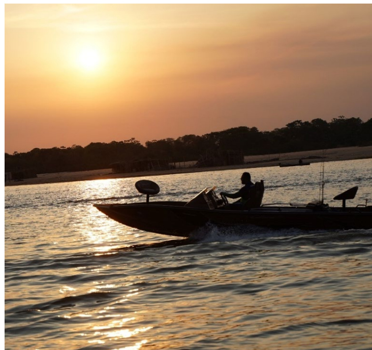
Pesquisa mostra desempenho de Goiás no mês de dezembro: receita também teve crescimento

O Observatório da Goiás Turismo acompanha mensalmente os dados da PMS e aponta que o bom desempenho do setor está ligado aos investimentos do Governo de Goiás para fortalecer a atividade turística, valorizando as 12 regiões turísticas do estado. Os relatórios completos, com gráficos comparativos, estão disponíveis no site da Goiás Turismo: www.goias.gov.br/turismo .