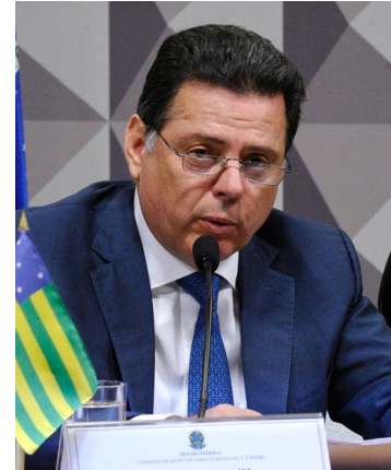
Ex-governador foi alvo de busca e apreensão durante operação da Polícia Federal