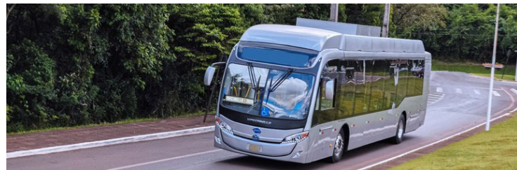
Encontro de Novos Prefeitos e Prefeitas discute novos modelos de transporte

Frotas velhas, dificuldades para a manutenção de veículos e de vias, alto custo e subsídios são alguns dos desafios das prefeituras para garantir o ir e vir de seus habitantes