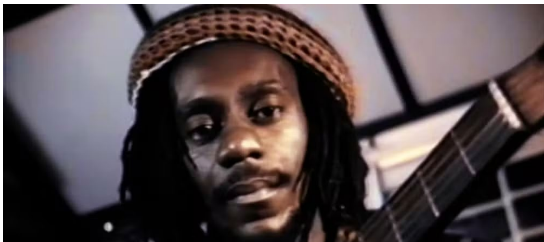
Pérola negra: Melodia fez batuque do samba ganhar sotaque bluesy e funky

precoce, ele seguiu lotando teatros. Câncer o matou cedo. Que se lasque o câncer. Melodia quebrou a cisão morro-asfalto, estraçalhando-a e jogando-a para longe, porque fazia música do morro no asfalto e vice-versa. Sabia-se artista universal.