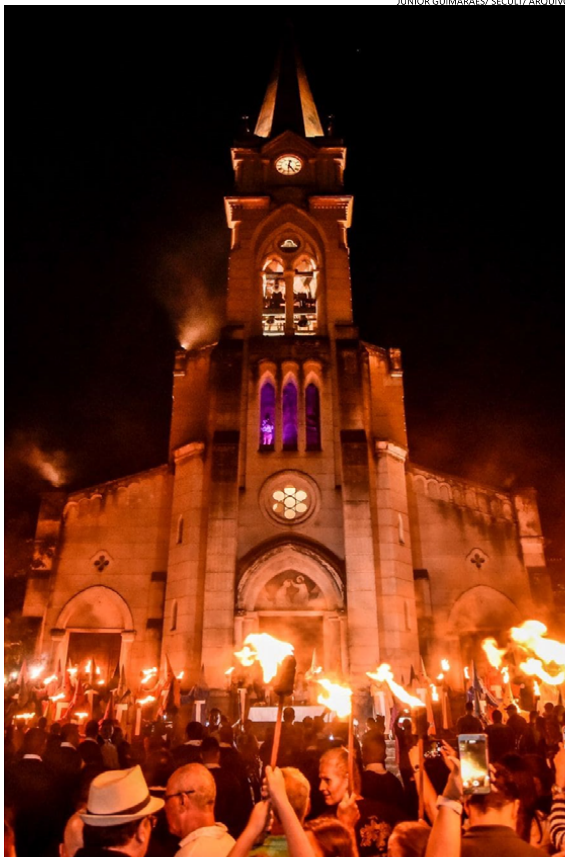
Igreja do Rosário recebe público que se encanta pela profusão de luzes e chamas

“A Procissão do Fogaréu profere um discurso que oscila entre angústia e esperança”, pontua ela, no