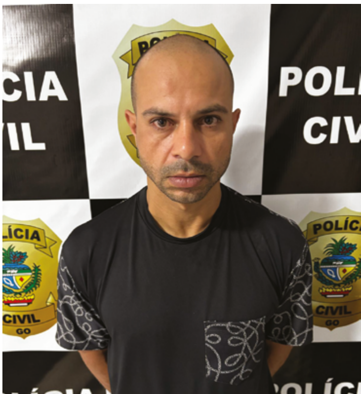
Um dos casos apurados envolve uma adolescente de 17 anos

A divulgação da identidade do suspeito foi autorizada por despacho fundamentado da autoridade policial, com o objetivo de possibilitar que outras possíveis vítimas o reconheçam.