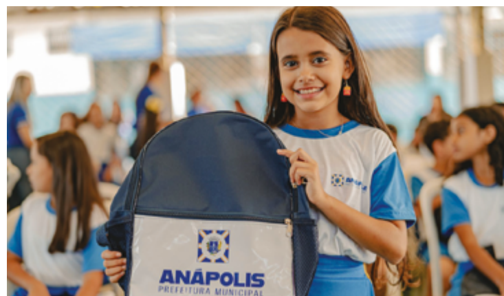
A entrega dos uniformes ocorre após o não cumprimento da previsão inicial divulgada no início do ano

A entrega dos uniformes ocorre após o não cumprimento da previsão inicial divulgada no início do ano, que apontava a distribuição para fevereiro. A Prefeitura atribuiu o atraso a trâmites do processo licitatório e à formalização dos contratos para aquisição dos materiais escolares.