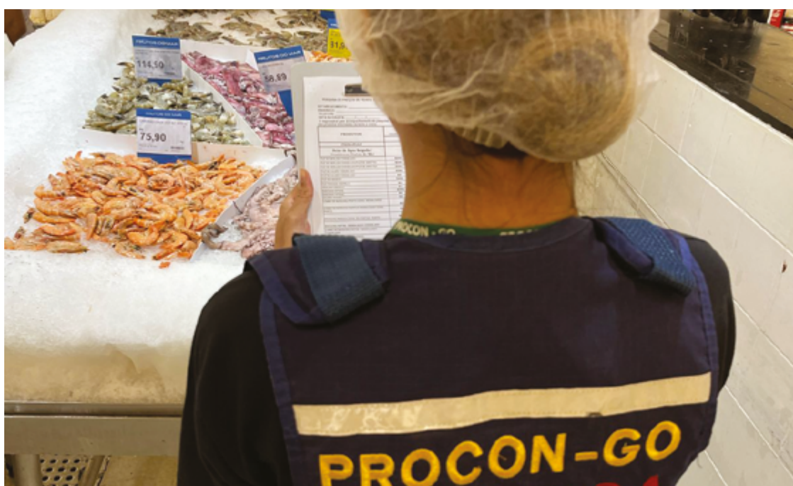
O Procon Goiás orienta os consumidores a observarem as condições de armazenamento e higiene dos produtos

O Procon Goiás orienta os consumidores a observarem as condições de armazenamento e higiene dos produtos. Pescados frescos devem estar expostos em balcões refrigerados ou com gelo picado e protegidos de sol e insetos. Além disso, é importante verificar sinais de frescor, como olhos brilhantes, guelras vermelhas e ausência de odor azedo.