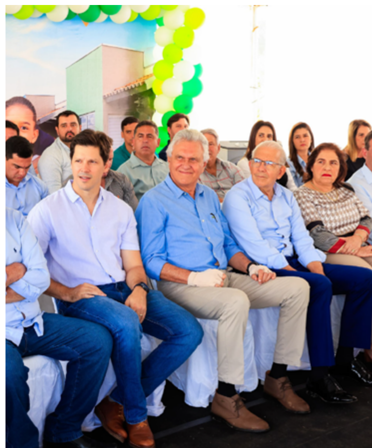
Governador Ronaldo Caiado e gestores ontem em Bela Vista: investimento de R$ 7 milhões