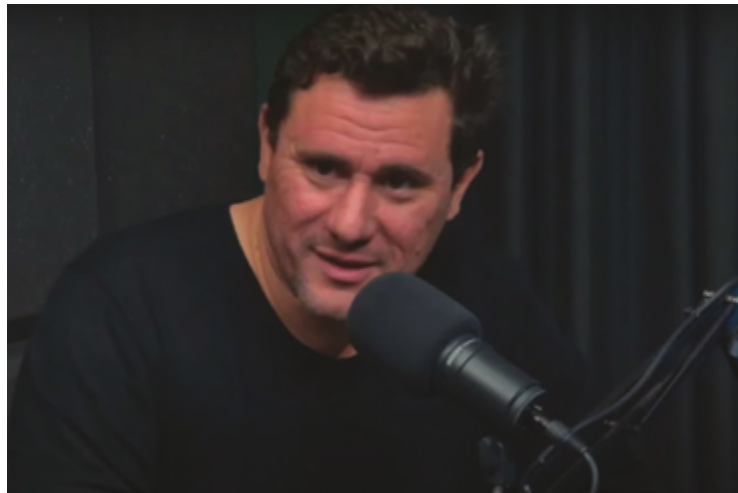
O dirigente fez um balanço de quase dois anos à frente do partido e reforçou a pré-candidatura a deputado estadual

O dirigente fez um balanço de quase dois anos à frente do partido e reforçou a pré-candidatura a deputado estadual nas eleições de 2026. “O projeto político, desde que eu assumi a presidência do partido, foi cumprido. A minha obrigação era compor uma boa relação com o PSDB. A gente teve alguns em-