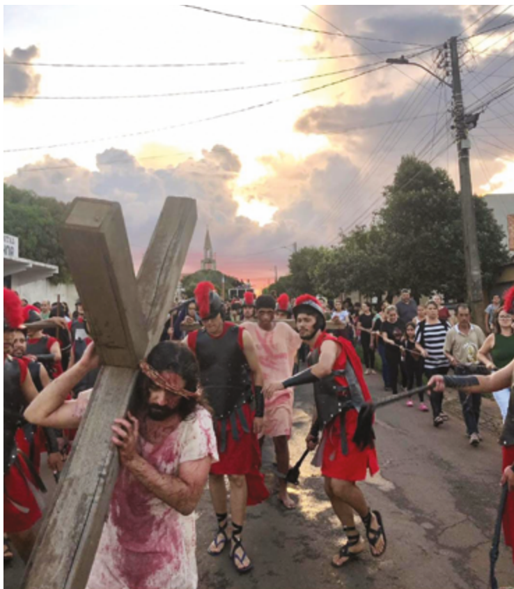
Em Anápolis, as paróquias se preparam para viver momentos intensos de fé, com celebrações que relembram os últimos passos de Jesus Cristo