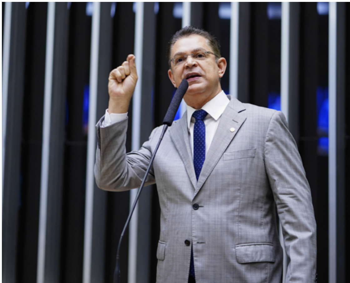
Deputado Sóstenes Cavalcante é o líder do PL na Câmara Federal: mais assinaturas do que o necessário

"Acabo de protocolar o requerimento de urgência do PL da Anistia com 264 assinaturas. Diante da pressão covarde do governo para retirada de apoios, antecipei a estratégia. Agora está registrado e público: ninguém será pego de surpresa. Anistia Já!", escreveu.