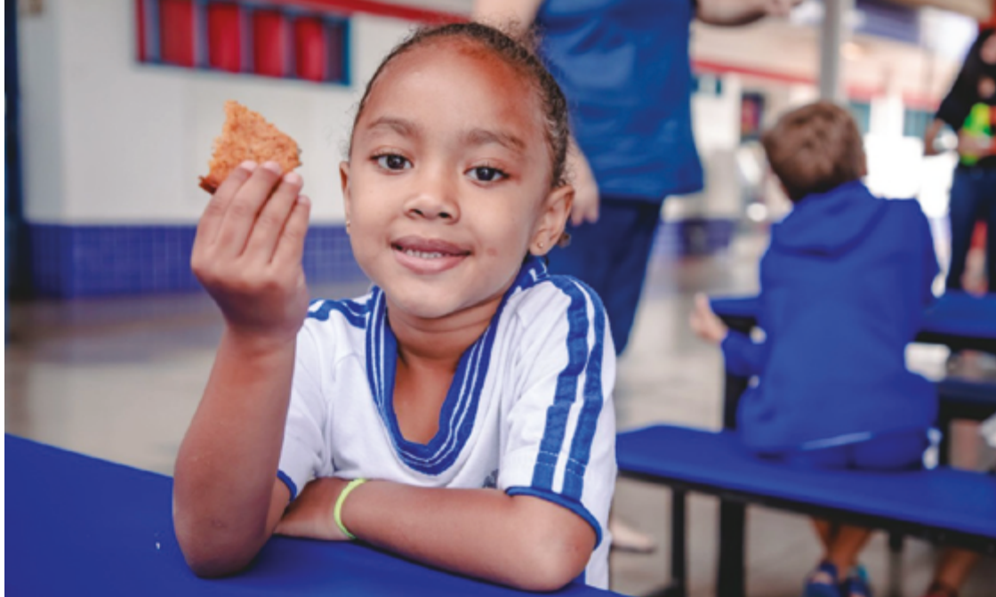
A situação da merenda escolar tem sido motivo de reclamação de pais e responsáveis desde o início do ano letivo

A situação da merenda escolar tem sido motivo de