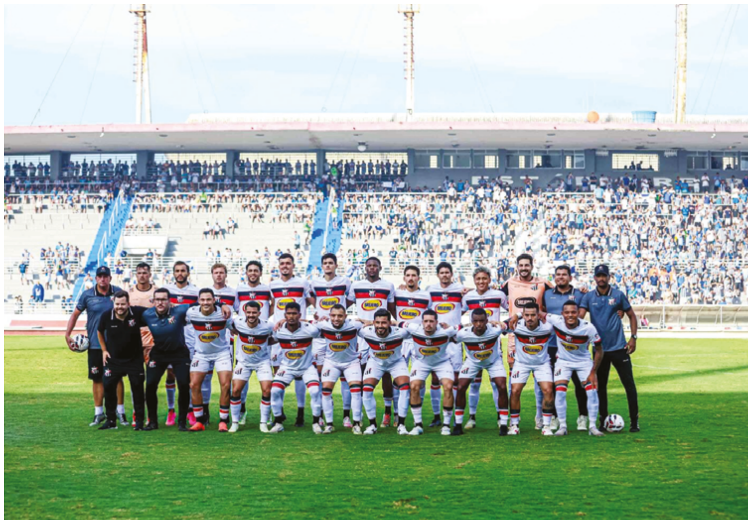
Foram 19 meses de invencibilidade no Jonas Duarte, com 21 jogos no período e um aproveitamento superior a 70%

Antes disso, foram 19 meses de invencibilidade no Jonas Duarte, com 21 jogos no período e um aproveitamento superior a 70%. O clube ficou todo o ano de 2024 invicto em seu estádio, com 11 vitórias e sete empates em 18 jogos. A equipe chegou a perder como mandante, mas no Aníbal Toledo, em Aparecida de Goiânia,