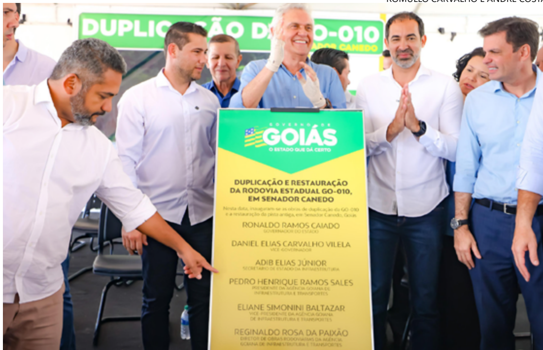
Governador Ronaldo Caiado e prefeito Fernando Pellozo: restauração e duplicação de trecho da GO-010

Além da Capital e Senador Canedo, a duplicação da GO-010 também beneficiará municípios como