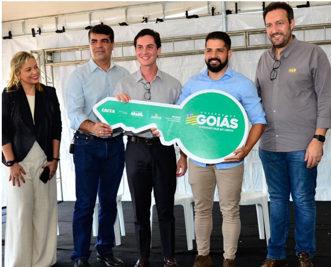
Empreendimento no Conjunto Vera Cruz, em Goiânia, atenderá 240 moradores