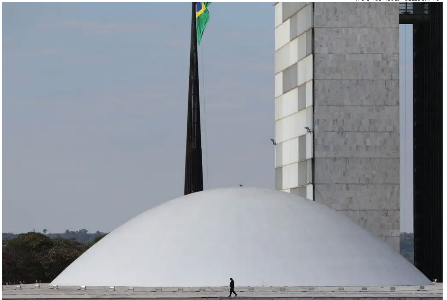
Pelo menos cinco dezenas de projetos tramitam na Câmara e no Senado: Bets despertam preocupação na sociedade brasileira