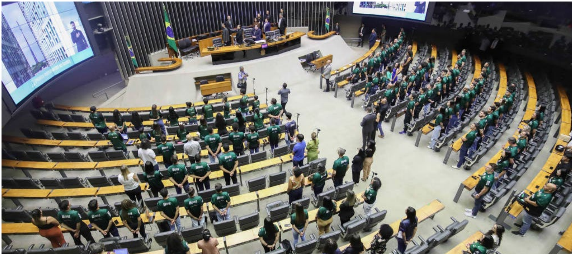
Congressistas estão irritados com restrições do STF às emendas parlamentares

Parlamentares cogitam não votar lei que autoriza gastos do Executivo no próximo ano, em um evento que não tem precedente na história do Congresso