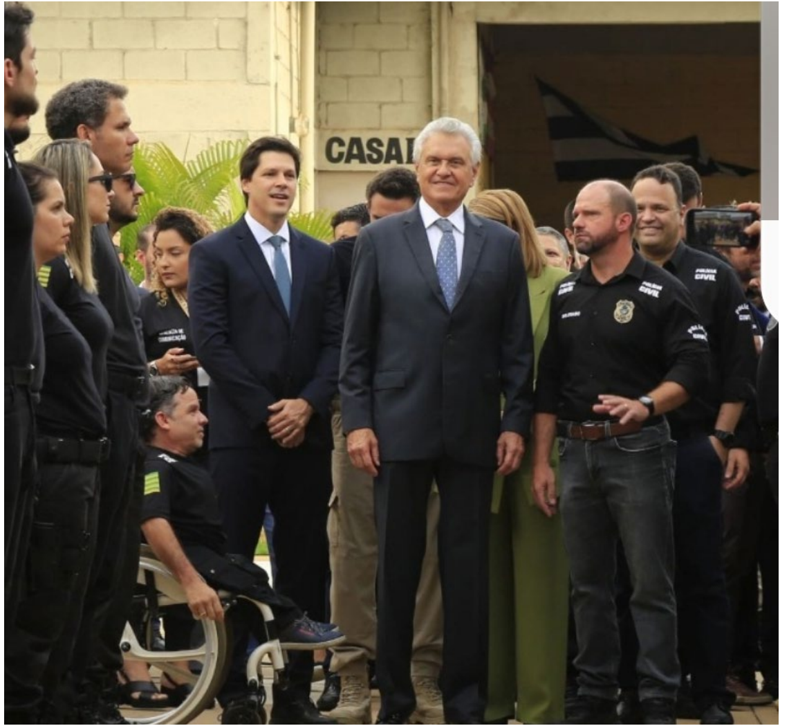
Governador Ronaldo Caiado e Daniel Vilela são recepcionados pela Polícia Civil: estado tem a melhor taxa de elucidação de crimes do país

Lançado na segunda-feira (11/11), o sétimo relatório da pesquisa "Onde Mora a Impunidade?" mostra tendência de crescimento do indicador nacional de esclarecimento de homicídios a partir de 2021. O