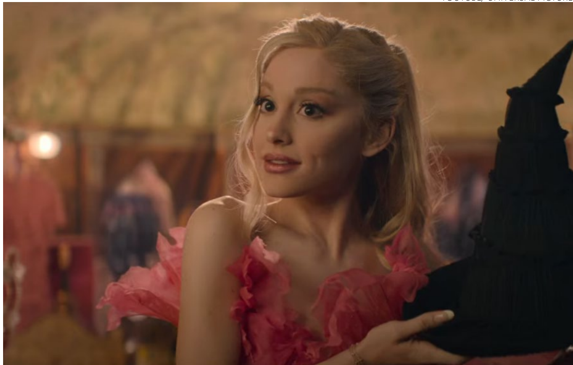
Artista é uma das estrelas de filme que adapta para cinema musical da Broadway

"Toda a sua vida, ela foi essa mulher privilegiada e mimada que sempre foi elogiada por ser ótima, engraçada e adorável",