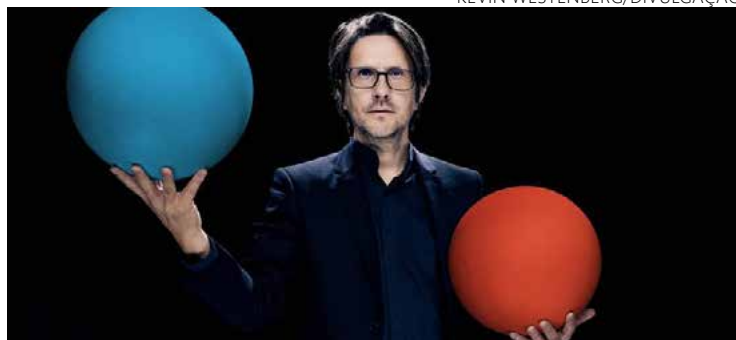
Cantor e compositor lança disco 'The Overview'

Esta atenção volátil está alterando a própria estrutura das músicas. Um exemplo, diz Wilson, são as faixas pop contemporâneas, que em geral não tem introdução e começam direto no refrão, sem que haja um crescendo para se chegar a ele, "porque é preciso capturar a atenção dos ouvintes imediatamente".