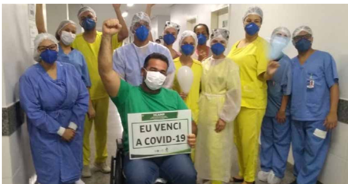
Hospitais de campanha, aos moldes daqueles instalados em uma guerra, foram essenciais para combater a doença