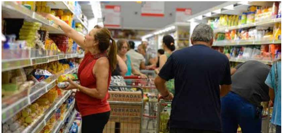
Levantamento do Procon visa fornecer aos consumidores ferramentas para a realização de compras mais conscientes e econômicas

Por outro lado, os cinco itens com menores variações de preços apresentaram oscilações mais modestas, entre 16,54% e 25,05%. O preço do arroz Tio Jorge (5 kg) variou entre R$ 29,99 e R$ 34,95, com flutuação de 16,54%. O leite integral Italac teve uma variação de 20,04%, variando de R$ 4,79 a R$ 5,75. O açúcar Itajá (5 kg) registrou variação de 23,94%, com preços de R$ 17,50 a R$ 21,69. O preço do óleo de soja Soya (900 ml) variou 25,04%, com preços