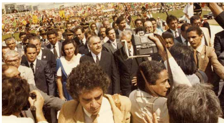
Político sobe a rampa do Congresso Nacional com a esposa Marly

"As pessoas não costumam prestar atenção no comportamento, na personalidade e no estilo presidencial, mas isso é importante. O Sarney era um político de trajetória longa, muito hábil, conciliador", diz. "Acho que Sarney tinha a personalidade [mais adequada]