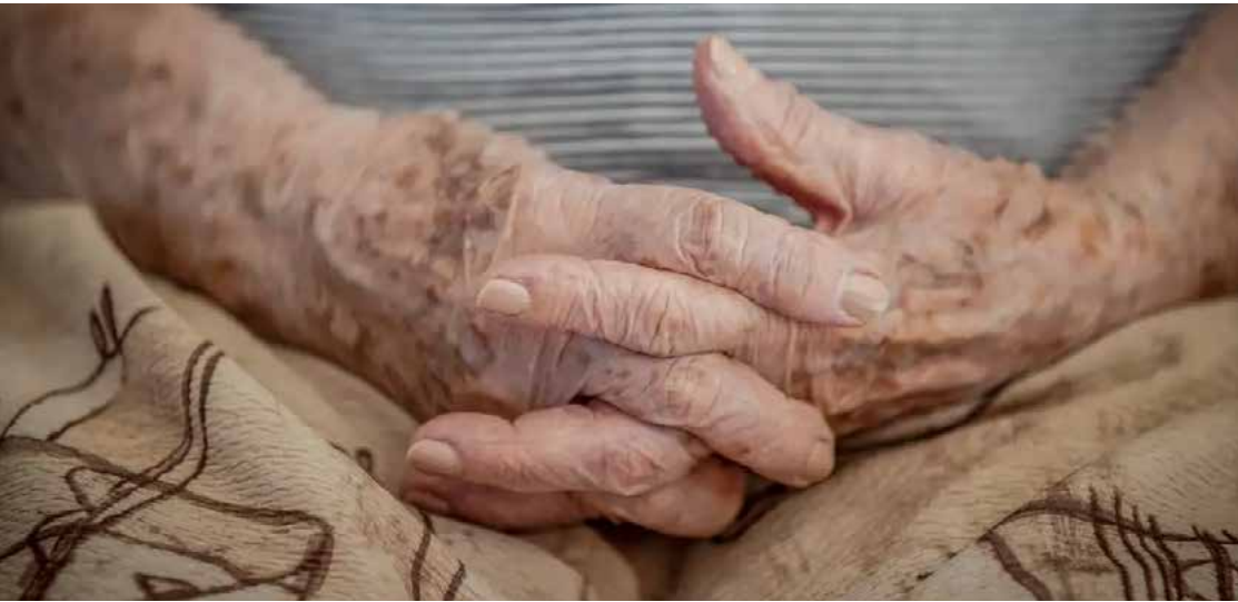
Apenas 7% dos matrimônios optaram por um regime diferente do que era obrigatório

Mesmo com o fim da obrigação de que pessoas maiores de 70 anos se casem com a exigência do regime de separação de bens, decidido há um ano pelo Supremo Tribunal Federal (STF), a maioria dos casamentos ocorridos mantém a opção por esse regime