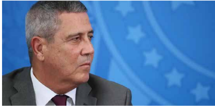
Braga Netto estaria obstruindo a investigação sobre a tentativa de golpe de Estado no país

Em dezembro do ano passado, Braga Netto foi preso por determinação do ministro Alexandre de Moraes, relator das investigações sobre a trama golpista