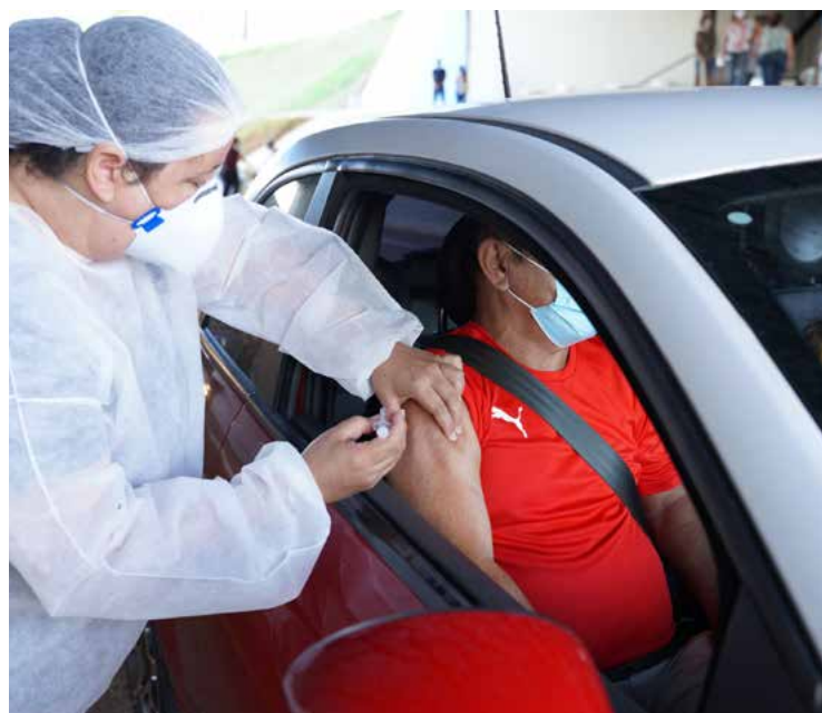
Equipe em unidade de saúde de Goiás realiza atendimento a paciente com sequelas

Uma das medidas foi abertura de oito Hospitais de Campanha. A estratégia do governo na guerra contra o vírus incluiu telemedicina, distribuição de insumos a municípios e priorização na vacinação.