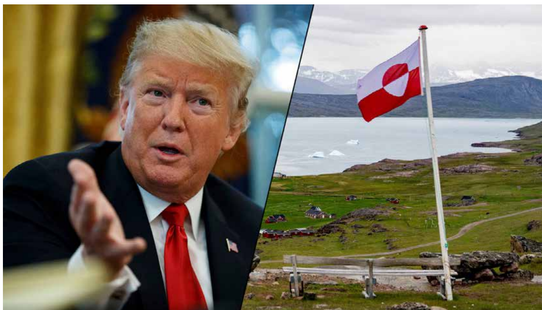
Políticos da Groelândia denunciam "comportamento inaceitável" do presidente americano Donald Trump

Líderes dos cinco partidos representados no Parlamento groenlandês emitiram uma declaração conjunta, expressando seu