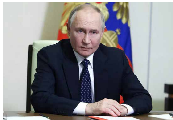
Presidente russo concorda com proposta de cessar-fogo dos EUA, mas impõe condições

Vladimir Putin concordou com a proposta de cessar-fogo dos EUA, mas colocou condições, como a desmobilização das tropas