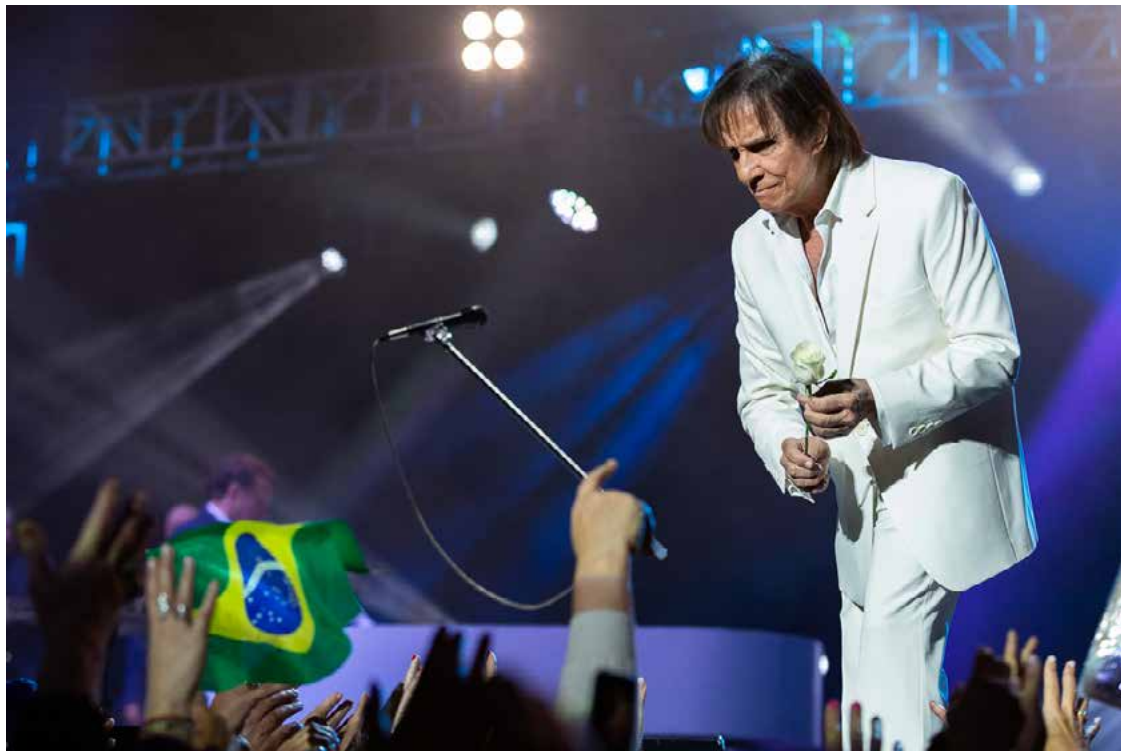
Artista lembrou episódio em que subiu tom com fã enquanto cantava música romântica

Roberto também foi questionado sobre ter composto a música-tema do filme "Ainda Estou Aqui". A faixa se chama "É Preciso Dar um Jeito, Meu Amigo", mas ele não foi mencionado por Walter Salles no discurs-