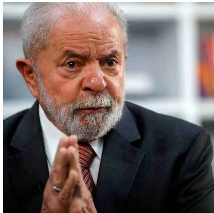
Lula promete enviar projeto de lei da isenção do Imposto de Renda

Anúncio foi feito pelo presidente Luiz Inácio Lula da Silva durante evento de entrega de ambulâncias, em Sorocaba