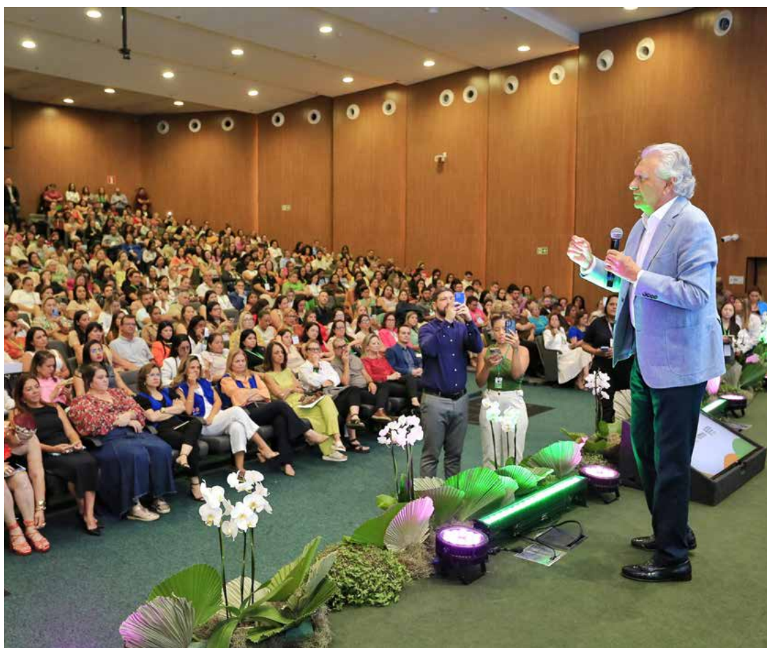
Ronaldo Caiado durante evento organizado pelo Goiás Social na Assembleia Legislativa: profissionais ajudam a reduzir extrema pobreza

O evento reuniu prefeitos, primeiras-damas e profissionais do setor para debates sobre estratégias de atendimento e programas estaduais.