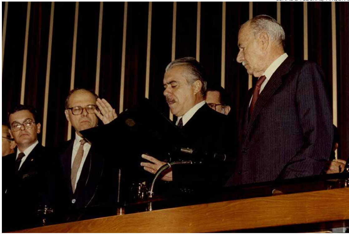
José Sarney presta juramento em sessão do Congresso realizada em 15 de março de 1985

Isso porque, em meio a transição de um regime mi-