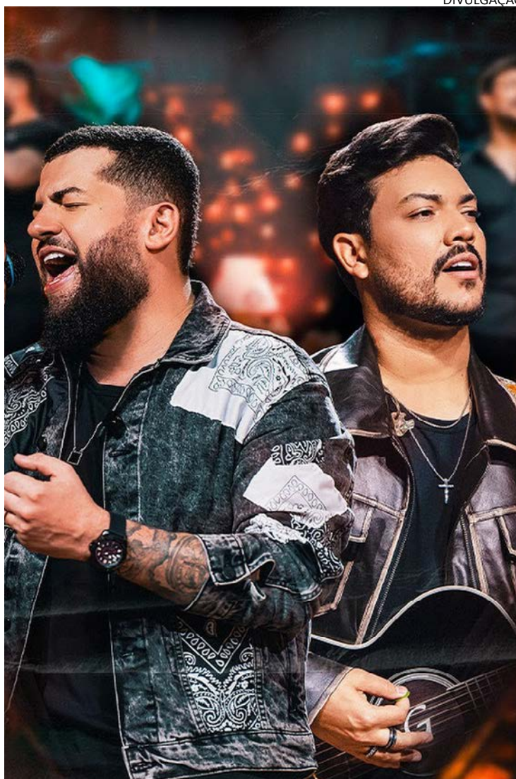
Réveillon Volta ao Mundo "leva" público ao Texas no Ano-Novo

Além da atração principal, outros artistas e participações especiais ainda serão anunciados nos próximos dias. Os ingressos já estão à venda pela plataforma Ticketou. Para quem busca mais conforto e exclusividade, há opção de lounges, com informações pelo telefone (62) 98338-4916.