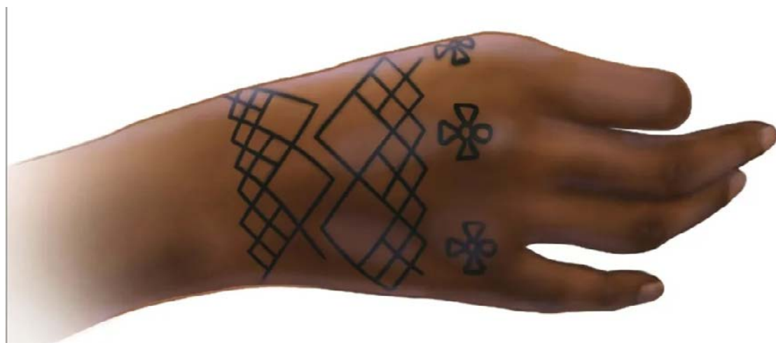
Estudo foi conduzido pela Universidade de Missouri em St. Louis (EUA): prática atravessa séculos

As tatuagens mais antigas identificadas no estudo foram encontradas no sítio arqueológico de Semna Sul, em fragmentos de pele pertencentes a três mulheres: uma jovem, possivelmente no fim da adolescência, e duas adultas entre 40 e 50 anos. Em dois casos, as marcas estavam localizadas nos