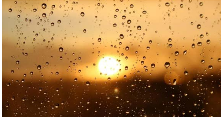
Calor abafado deve permanecer durante toda a semana

Previsão indica uma semana típica de verão: calor persistente, muitas nuvens e pancadas isoladas no fim da tarde e à noite