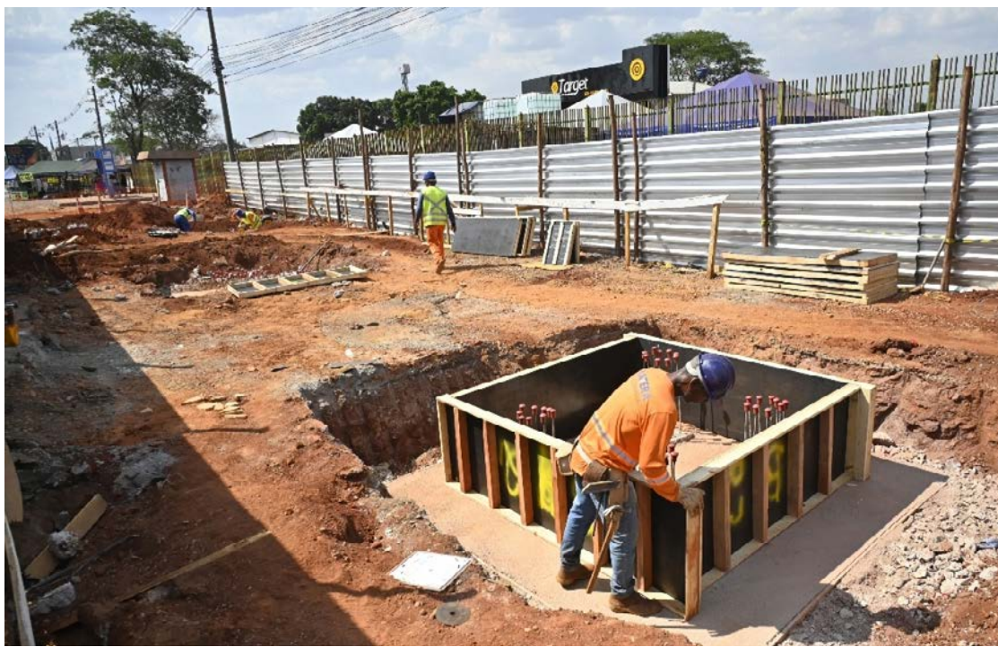
Construção e reforma de passarelas para pedestres em rodovias estaduais

Na GO-060, entre Goiânia e Trindade, estão previstas cinco novas passarelas, localizadas entre o Morro do Mendanha e o Setor Pontakayana 2. Na GO-070, outras