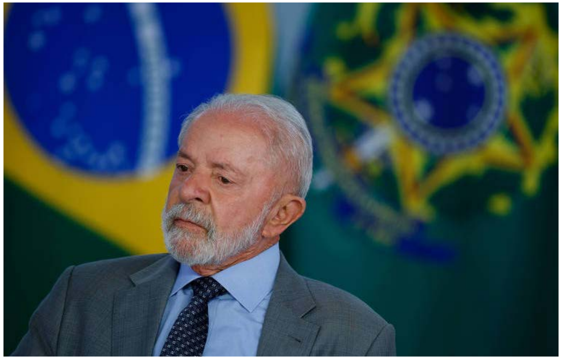
Lula encerra o ano de 2025 com a aprovação em baixa, o mesmo ocorre com sua gestão

A pesquisa não mediu a rejeição dos aspirantes ao Palácio do Planalto, considerada o principal empecilho para a candi-