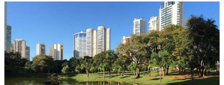
Prefeitura de Goiânia e Governo de Goiás decretaram ponto facultativo no feriadão