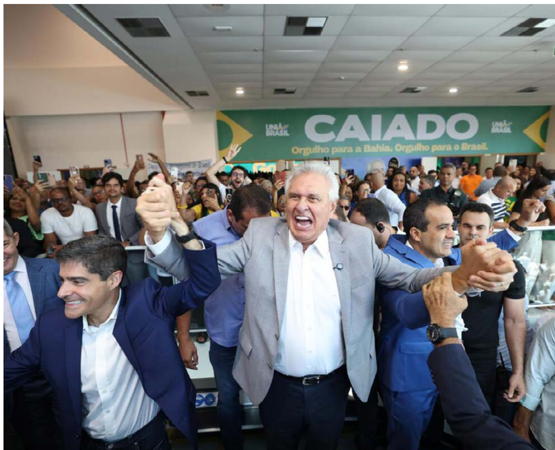
Ronaldo Caiado: lançamento de pré-candidatura à presidência da República

O prefeito de Goiânia, Sandro Mabel (UB) teve quebra-de-braço com a Câmara Municipal, com derrotas em plenário. A