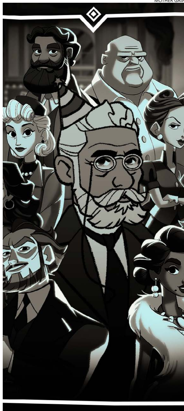
Pontas amarradas: “A Investigação Póstuma” conecta personagens do autor que transformou literatura brasileira

A intenção, diante de tamanho labor artístico, era jurar fidelidade conceitual ao texto machadiano, ao mesmo tempo em que os gamers seriam atraídos pelo produto digital. Para que a ideia em si funcionasse, as histórias do Bruxo do Cosme Velho se entrelaçariam em um ambiente novo, redundando em uma obra de honesta releitura. Adaptação simples? Não.