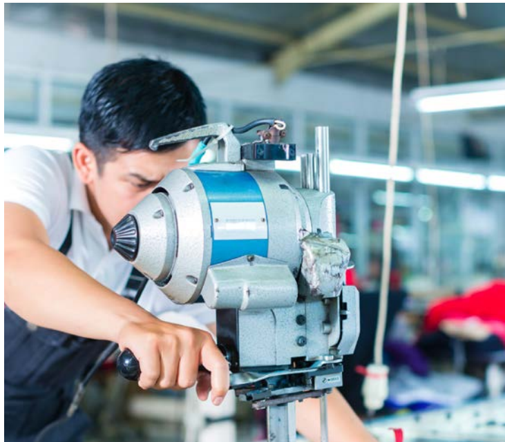
No acumulado em 12 meses, Goiás atingiu 4,6% e ocupa a terceira posição

“Os números refletem um conjunto de ações estratégicas adotadas pelo Governo de Goiás: responsabilidade fiscal, ambiente de negócios mais simples