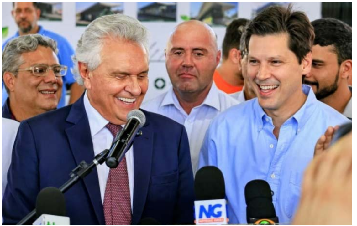
Daniel Vilela e Ronaldo Caiado apresentam liderança consolidada na pesquisa divulgada pela TV Atual/Record News

Explica-se: quem vira o ano na frente costuma consolidar a vitória nas urnas. E, uma vez que restam poucos meses para a disputa, começa a contar o cronômetro para os votos se enfileirarem no efeito bandwagon. O ano seguinte terá