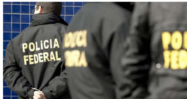
Polícia Federal, sob determinação do STF, prendeu um dos condenados pelo 8 de Janeiro

Ordens foram expedidas pelo ministro Alexandre de Moraes, um dia após prisão do ex-diretor da PRF