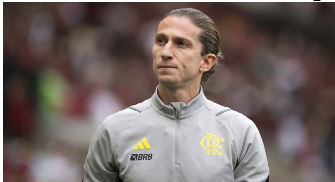
Negociações envolveram ajustes em salário e premiações