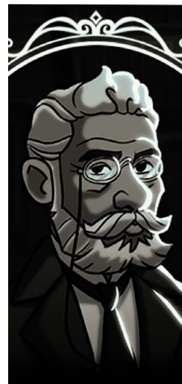
Escritor arrebatava leitor com prosa humorística e luso-brasileira

Como diz a Mother Gaia, “A Investigação Póstuma” chega em breve, com mistério, humor e “aquele toque machadiano que a gente ama”. O que não deixa de ser interessante, é verdade. Ciente de que a arte é intrínseca ao progresso, Machado volta — e dessa vez nos games.