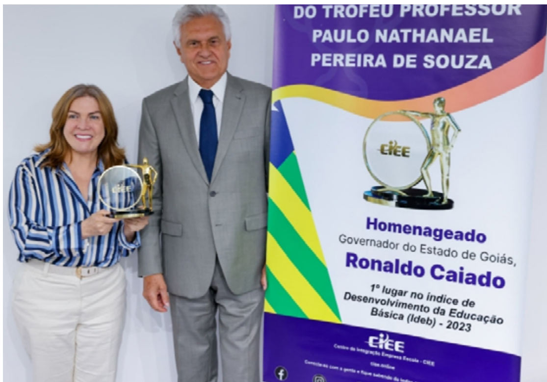
Governador Ronaldo Caiado é homenageado pelo CIEE: gestor se sente honrado com prêmio recebido em Brasília

A cerimônia de premiação ocorreu no auditório do CIEE, em Brasília, e foi mais um reconhecimento do esforço do governo goiano para melhorar a educação no estado.