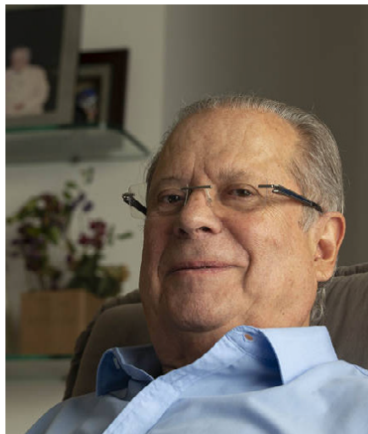
Zé Dirceu: livre para disputar as eleições de 2026

A primeira condenação de Dirceu na Lava Jato ocorreu em maio de 2016. A sentença de Moro previu 23 anos e três meses de prisão sob acusação de corrupção ativa, lavagem de dinheiro e organização criminosa pela participação em esquema de contratos superfaturados da construtora Engevix com a Petrobras.