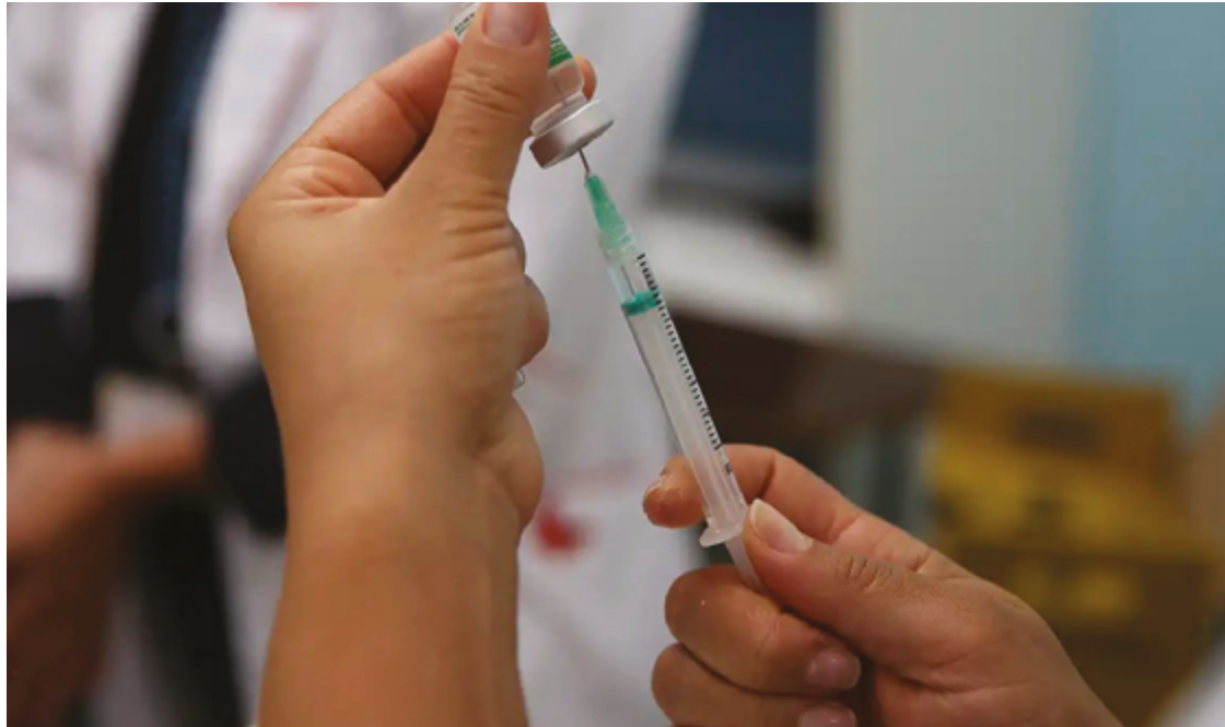
Segundo a SES, casos estão concentrados em escolas e Instituições de Longa Permanência para Idosos (ILPIs)

Em Goiânia, foram confirmados surtos de influenza em quatro escolas e em uma Instituição de Longa Permanência para Idosos, com a maioria dos casos envolvendo o subtipo influenza B. Em Rio Verde, uma ILPI registrou 11 casos de influenza A, enquanto uma escola contabilizou seis casos, sendo quatro por influenza B. Aparecida de Goiânia também apresentou um surto expressivo, com 38 casos confirmados de influenza, principalmente do subtipo A. Em Ivolândia, três casos de influenza A foram registrados em uma escola.