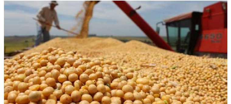
Soja responde por 46,55% do total exportado