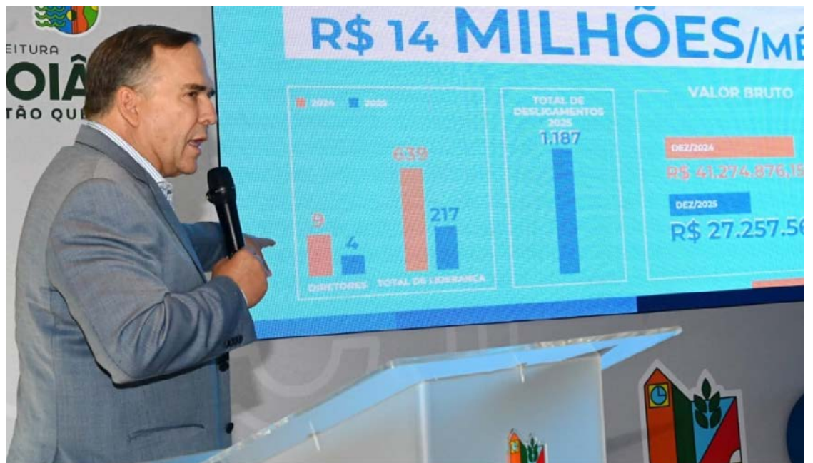
Prefeito Sandro Mabel: dados da administração municipal apontam redução de dívidas

Sandro Mabel declarou ainda, na tarde de ontem, que recebeu uma ameaça relacionada à atuação da gestão na Comurg. Segundo ele, um bilhete com os nomes de seus cinco netos, acompanhado dos ho-