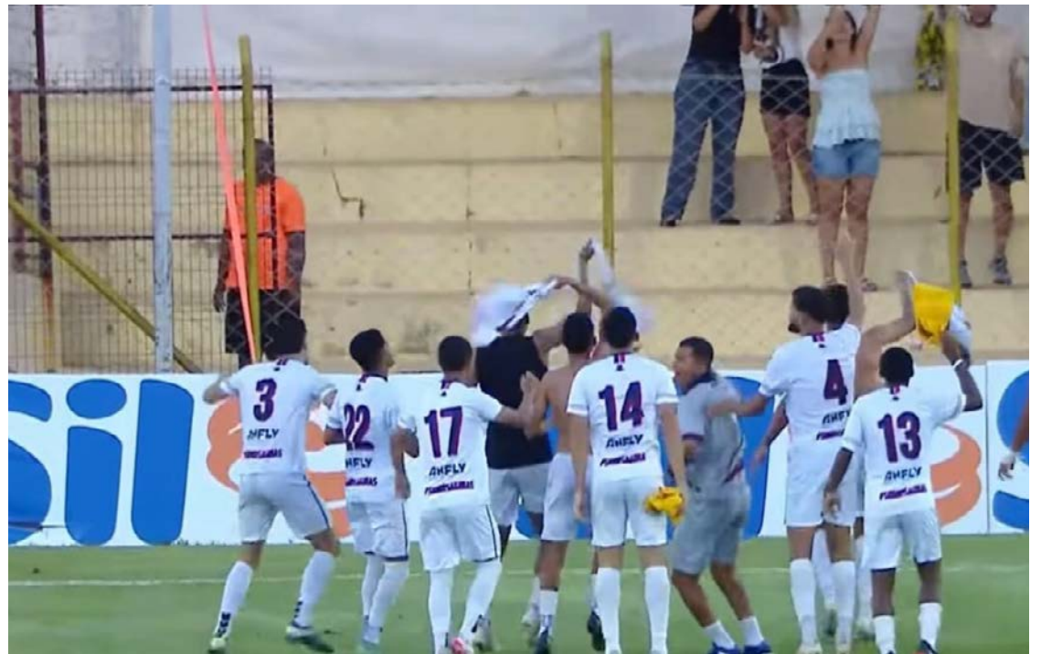
Guanabara City chegou como estreante na Copinha e já está entre os oito melhores da competição