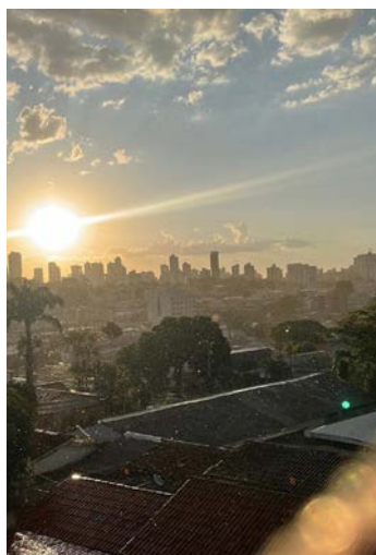
Dados do Climatempo mostram que umidade e calor voltam a Goiás

As chuvas devem ocorrer de forma irregular no norte e mais generalizada no centro-sul. No domingo (18), as pancadas de chuva ganham intensidade em todas as regionais.