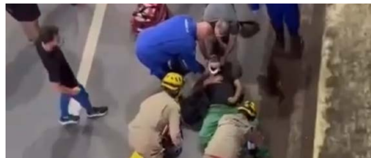
Ocorrência mobilizou equipes de resgate do Corpo de Bombeiros