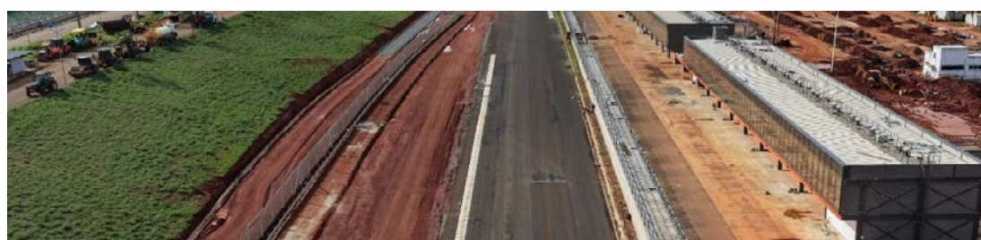
Autódromo Internacional de Goiânia recebe evento-teste nos dias 28 de fevereiro e 1º de março