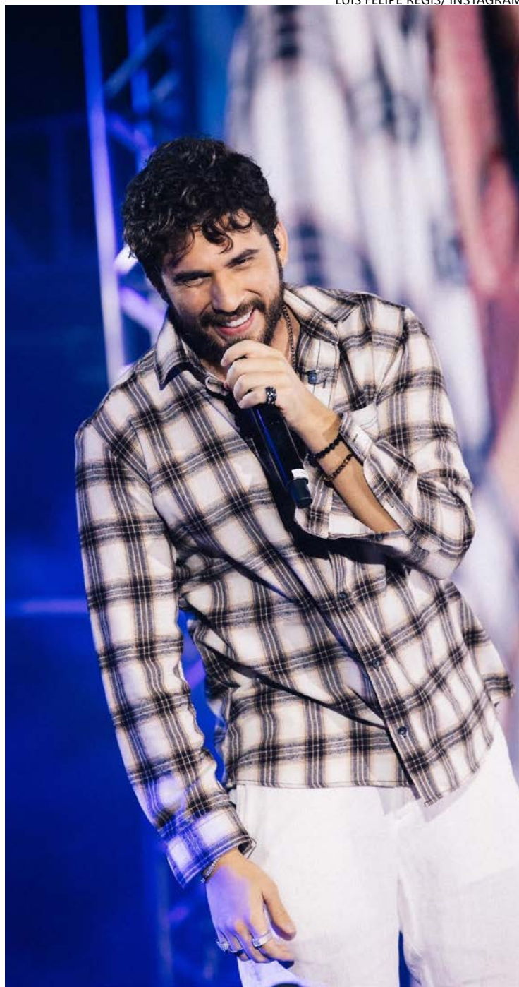
Bombando: cantor está escalado para fazer mocinho

Paralelamente à atuação, o cantor vive um momento decisivo na carreira musical. Há cerca de dois anos, ele vem estruturando um projeto internacional. O álbum, ainda sem título, terá faixas em inglês, espanhol e português, e deve ser lançado no segundo semestre de 2026.