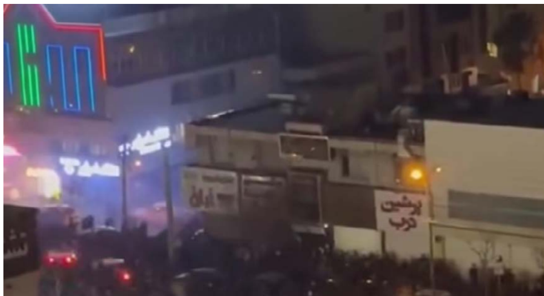
Forças de segurança intensificaram a presença em áreas urbanas do Irã após a onda de protestos

Relatos enviados à agência Reuters indicam que a resposta violenta do regime teria contido, ao menos temporariamente, as manifestações em massa. Em Teerã, moradores afirmaram que a capital permanece tranquila desde o último domingo, com forte presença de forças de segurança e uso de drones. Situação semelhante foi descrita em cidades do norte do país, embora haja