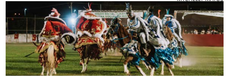
Secult diz que evento será o maior já feito