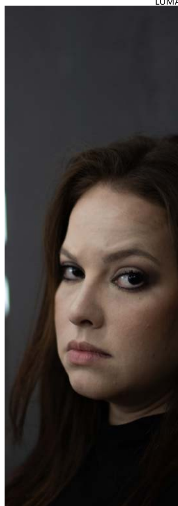
Trabalho se originou em núcleo de pesquisa

"Hugo era verbo" integra o projeto de manutenção da companhia, contemplado pela Lei Aldir Blanc 2024, e marca os 22 anos da Cia Sala3. A iniciativa prevê ainda outras montagens e ações gratuitas ao longo do ano, incluindo ocupações urbanas e apresentações voltadas a diferentes públicos, reforçando a atuação continuada do grupo na cena teatral goianiense.