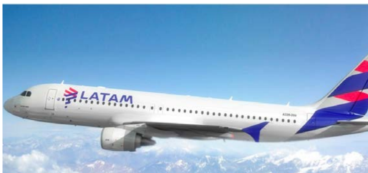
Segundo a Latam, as rotas domésticas serão operadas por aeronaves Airbus A320

Além de Caldas Novas, a empresa inaugurará voos de Guarulhos para Uberaba (janeiro) e Juiz de Fora (maio), e entre Brasília e Campina Grande (maio). As rotas domésticas serão