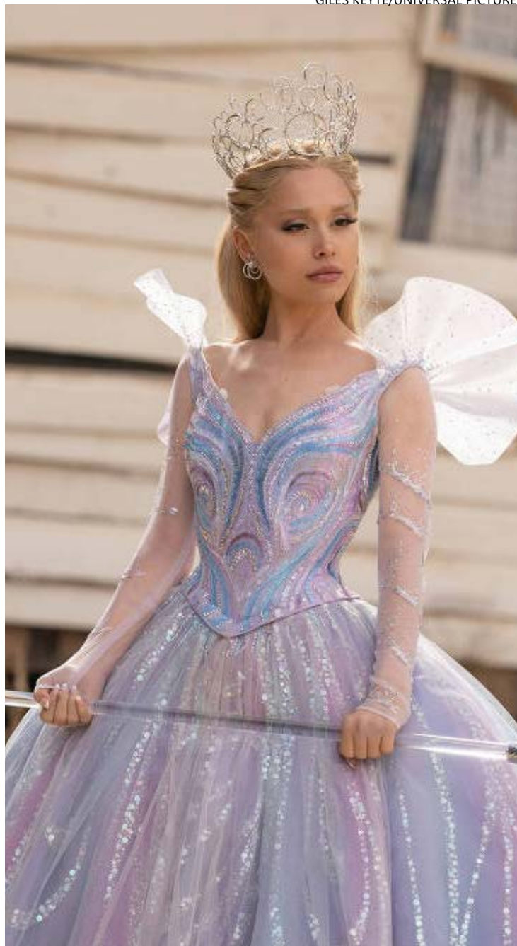
Produção conta com atuação da estrela pop norte-americana Ariana Grande

"Wicked" também é uma alegoria contra a opressão,