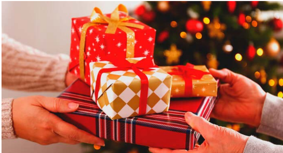
Universo corporativo: ideia é fortalecer laços e expressar apreço

Linguagem do presente ressurgue como gesto poderoso de afeto, gratidão e reconhecimento. Trata-se de reflexo intenso das relações