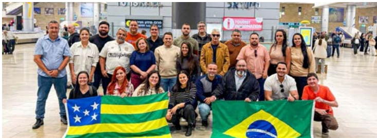
Pesquisadores da Emater buscam em Israel novas técnicas agrícolas

De 17 a 28, o grupo participa do Curso Internacional “Adoção e Implementação de Tecnologias para Impulsionar a Produtividade Agrícola”, promovido pela Agência