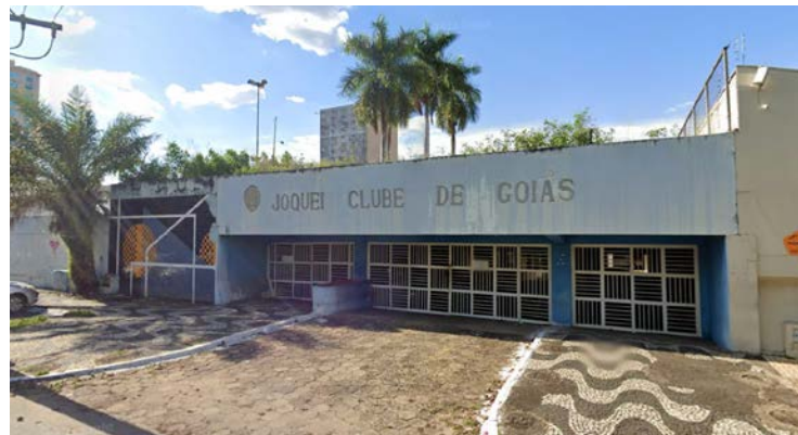
Instituição enfrenta sucessivas crises administrativas

Decisão é da juíza Flávia Lançoni Costa Pinheiro, da 15ª Vara Cível e Ambiental de Goiânia