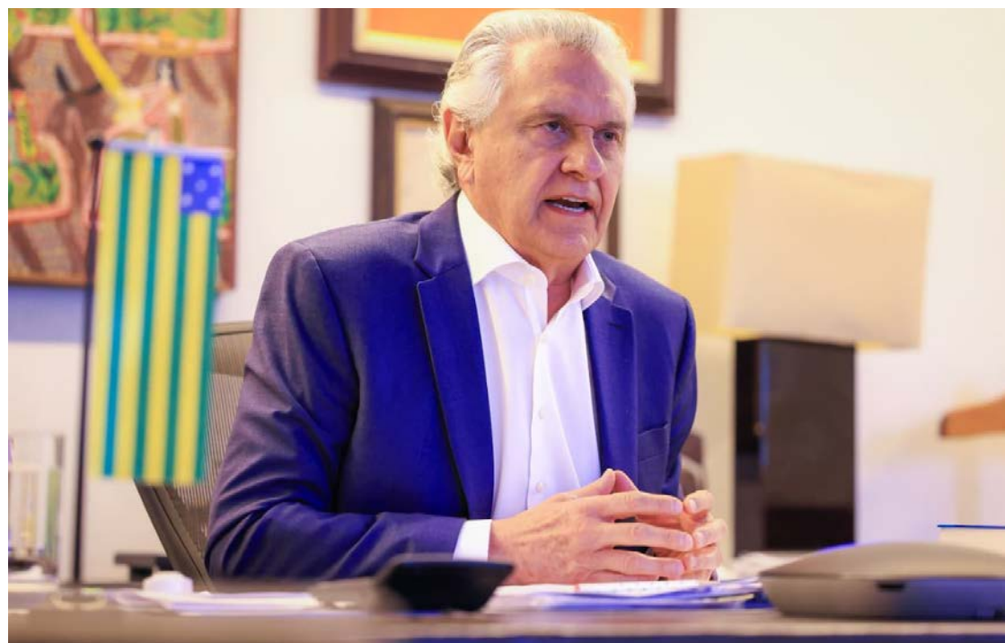
O governador Ronaldo Caiado apresentou indicadores sobre segurança em Goiás para justificar pedido

No pedido ao STF, Caiado destaca que o Estado alcançou queda superior a 90% nos principais indicadores criminais e prisionais entre 2019 e 2025. Ele cita ainda pesquisa Genial/Quaest, divulgada em agosto de 2025, que coloca a segurança pública como o serviço mais bem avaliado pelos goianos, com 74%