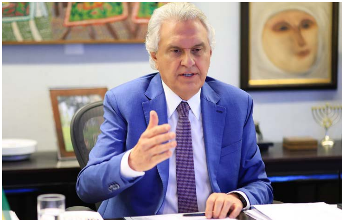
Ronaldo Caiado: segurança pública no centro do debate na pré-campanha

O ato reforça o papel do goiano como liderança nacional no debate sobre o combate à criminalidade. “Segurança pública é go-