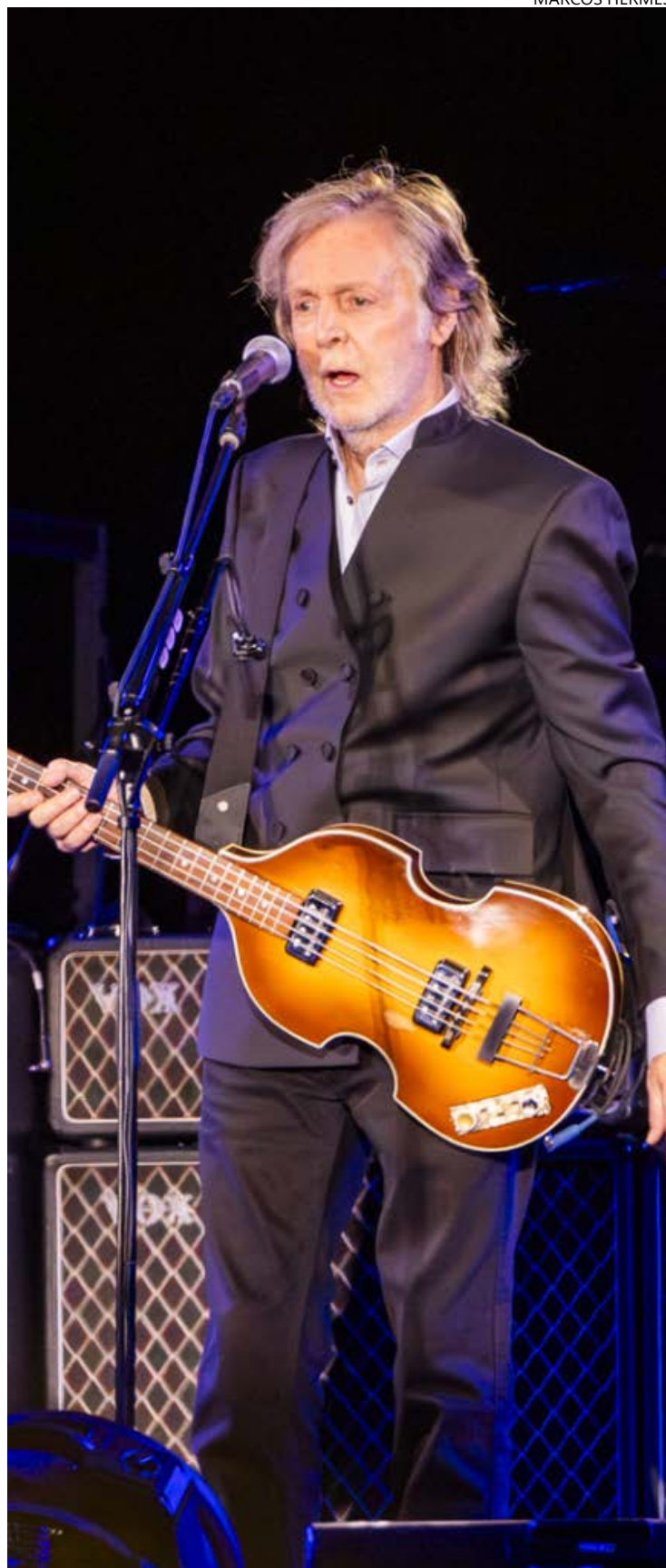
Paul McCartney, 83, afirma que é preciso ter cuidado com empresas de tecnologia

"Essas empresas de tecnologia estão investindo fortunas. E a inteligência artificial, cada vez que você for fazer as coisas com ela, você percebe o quanto aquilo é prático, o quanto aquilo é inteligente mesmo e o quanto aquilo te facilita a vida", pontuou o cantor goiano.