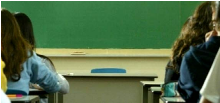
Pesquisa projeta déficit de 235 mil professores da educação básica até 2040

A Unesco aponta que até 40% dos professores abandonam a profissão nos primeiros cinco anos, devido a remuneração baixa, condições precárias, salas cheias e contratações emergenciais sem formação adequada. Também persistem desi-