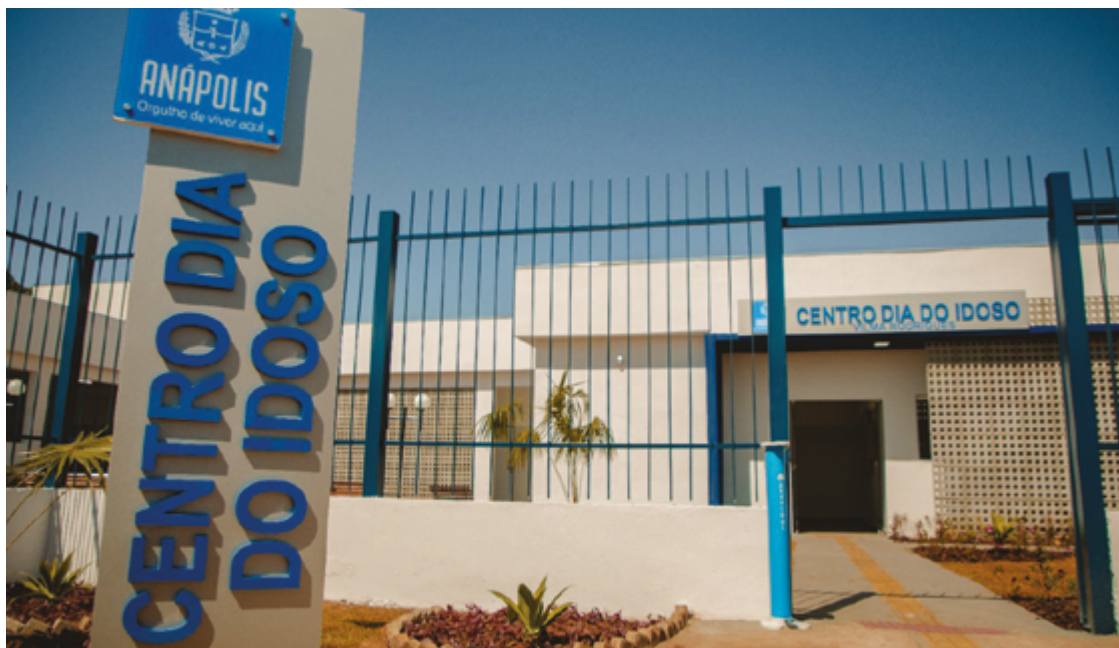
Ao DM, moradores da Vila Esperança relataram que foram informados do fechamento da creche do idoso nesta terça, no grupo de WhatsApp do bairro

A reportagem questionou a Prefeitura de Anápolis e a secretária de Integração, Jordana de Faria, sobre o porquê do fechamento do Centro Dia do Idoso. Também indagou o que será feito da estrutura, se a mudança era temporária e se os idosos que eram atendidos no local receberão atendi-