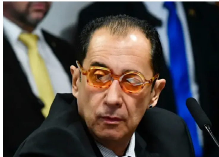
Jorge Kajuru: nova disputa para o Senado Federal e rejeição à ideia de mandato na Câmara Federal

Com trajetória marcada por altos e baixos com o governo Bolsonaro, senador agora atua na base do governo Lula