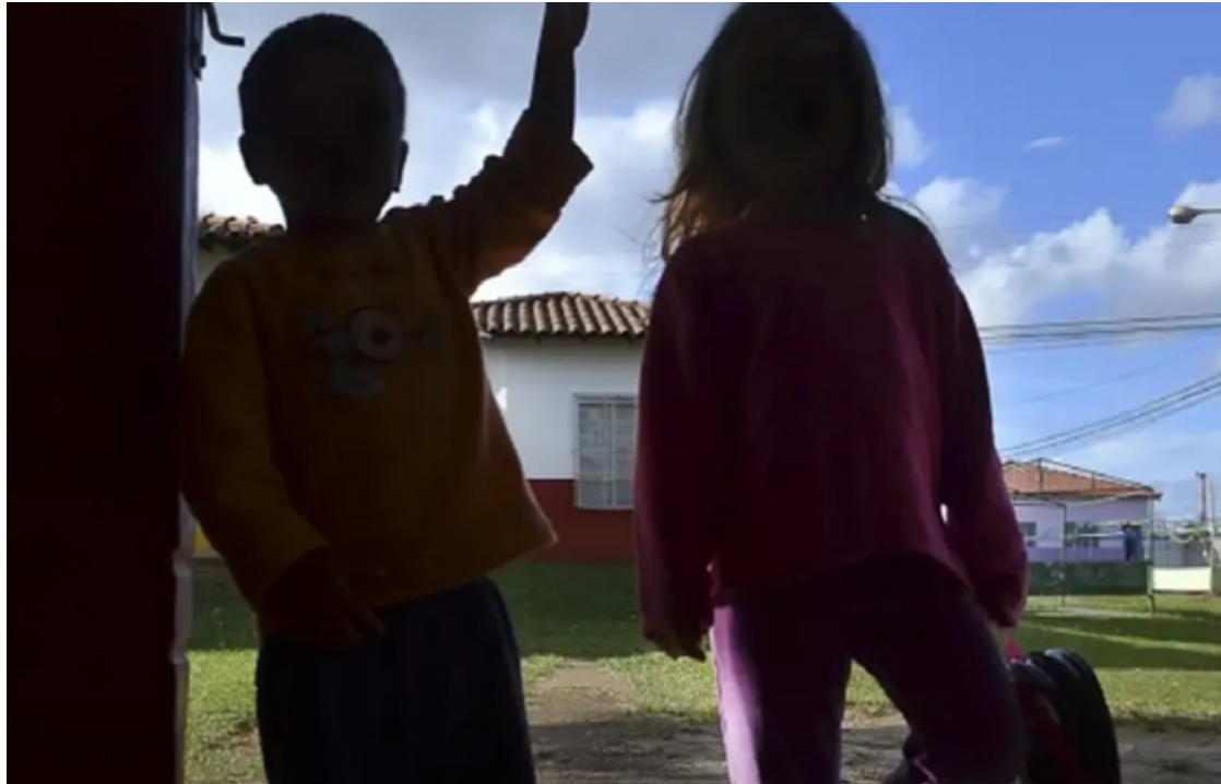
Norma institui programa que incentiva adoção tardia: quebra de preconceitos é desafio