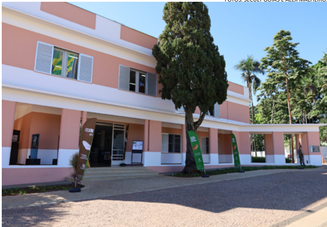
Centro Cultural Marietta Telles Machado é riqueza tombada pelo Iphan

O estilo, aliás, surge a partir do art nouveau, popular entre os séculos 19