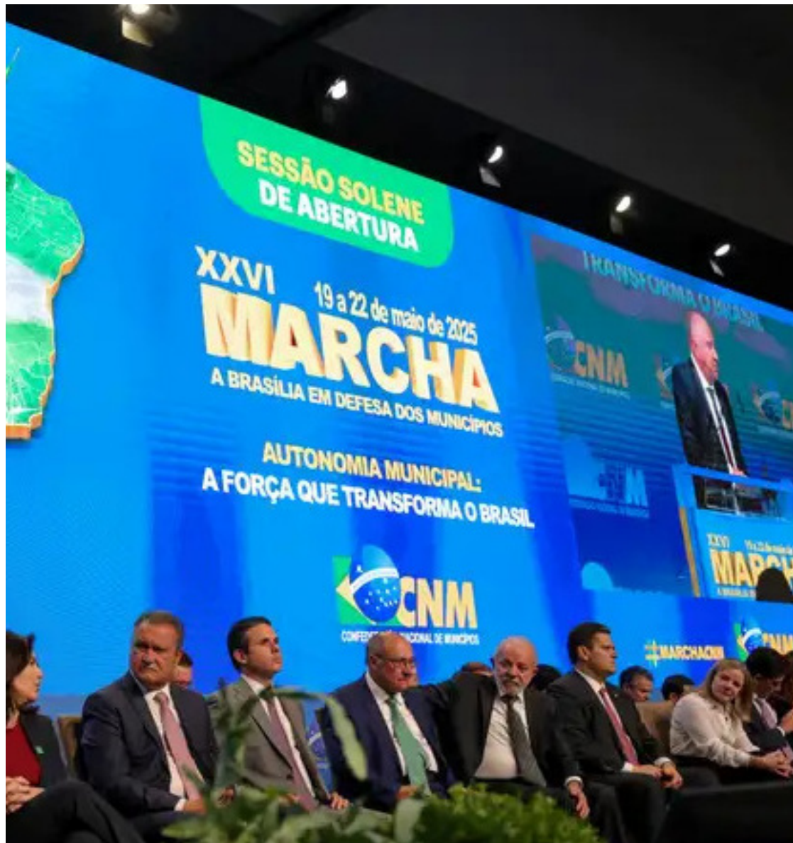
Presidente Lula durante Marcha dos Prefeitos em Brasília; evento em que foi vaiado e aplaudido

A Marcha dos Prefeitos acontece todo ano, organizada pela CNM (Confederação Nacional dos Municípios), e reúne milhares de prefeitos, vereadores, secretários e demais gestores municipais.