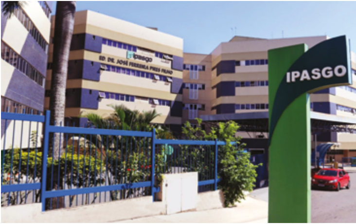
Ipasgo Saúde cobra contribuição fixa de 30% do valor gasto, conforme normativa da ANS

Valores correspondem a parte do segundo semestre de 2024 e ao mês de janeiro de 2025