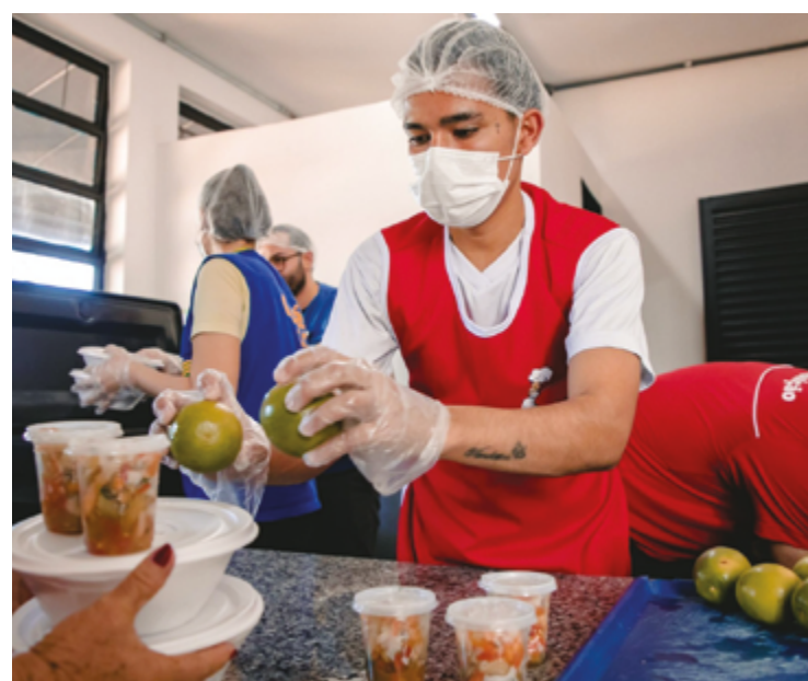
O prazo para envio das propostas comerciais e documentos de habilitação é de 10 dias úteis, contados a partir da data da última publicação do aviso

Mais informações podem ser obtidas diretamente com a Gerência de