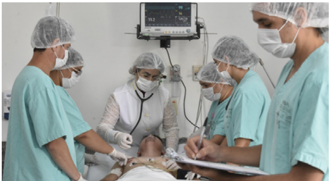
Iniciativa será aplicada em 24 hospitais estaduais e prevê integração da rede, otimização de leitos e diminuição das filas de atendimento: metodologia é adotada em outros estados

Segundo a gestão estadual, o projeto adota metodologia já aplicada em outras regiões do país e em hospitais internacionais, com resultados positivos na redução de superlotação e melhora no atendimento. A iniciativa está sendo estruturada há cerca de sete meses e será oficialmente lançada em junho.