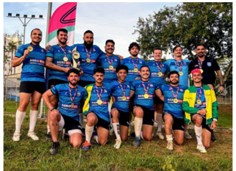
Time goiano aplicou goleadas nos quatro jogos e garantiu acesso à Divisão de Elite do campeonato

A equipe reforça a presença do esporte goiano no cenário nacional, motivando outras universidades da região a investirem no rugby como ferramenta de inclusão, desempenho esportivo e representatividade.