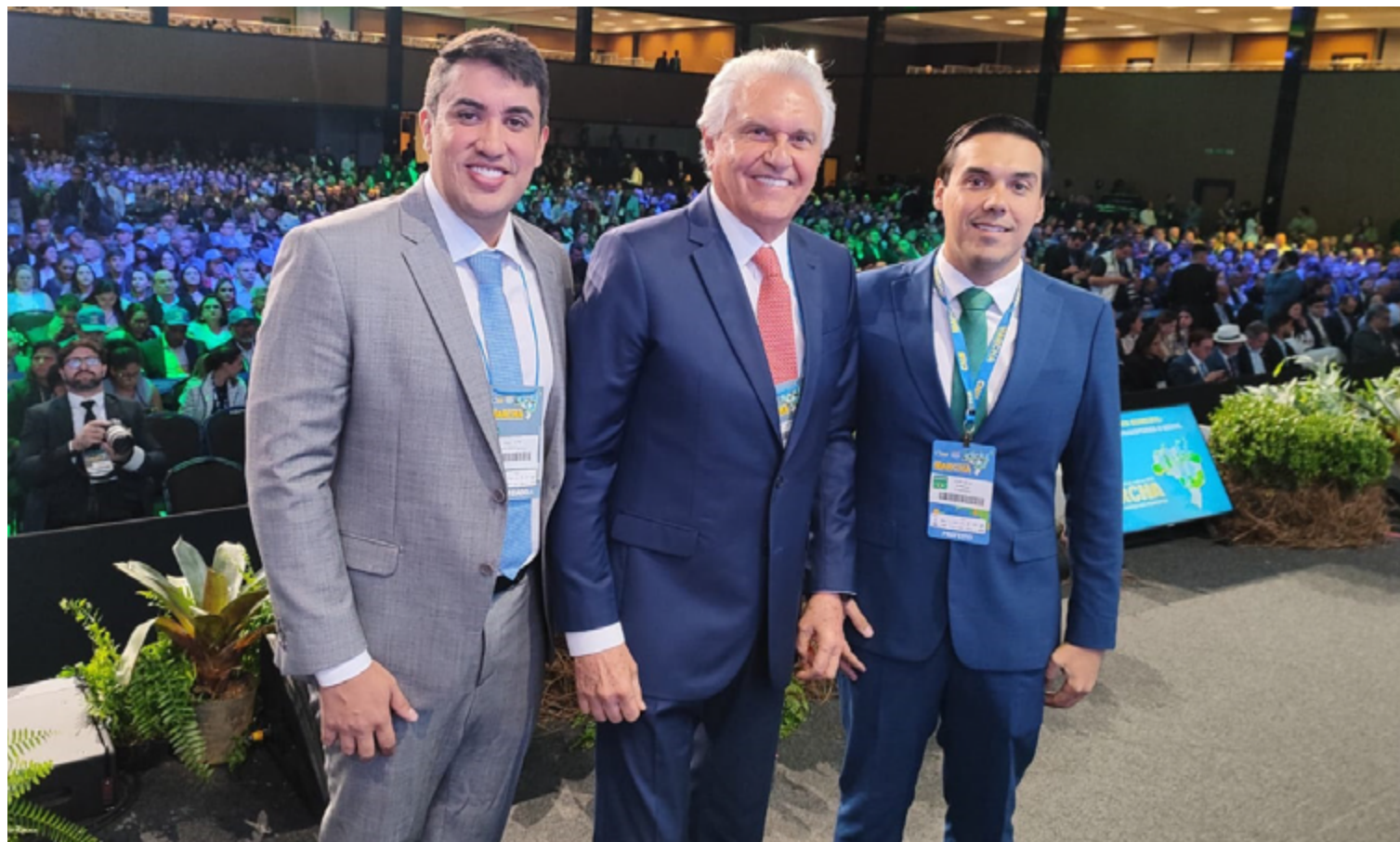
Ronaldo Caiado, Paulo Vitor e Zé Délio: presença expressiva de goianos na Marcha dos Prefeitos

Durante o discurso, Caiado reafirmou que continuará defendendo os municípios em todas as esferas. “Não é possível falar em desenvolvimento nacional sem reconhecer o papel estratégico das