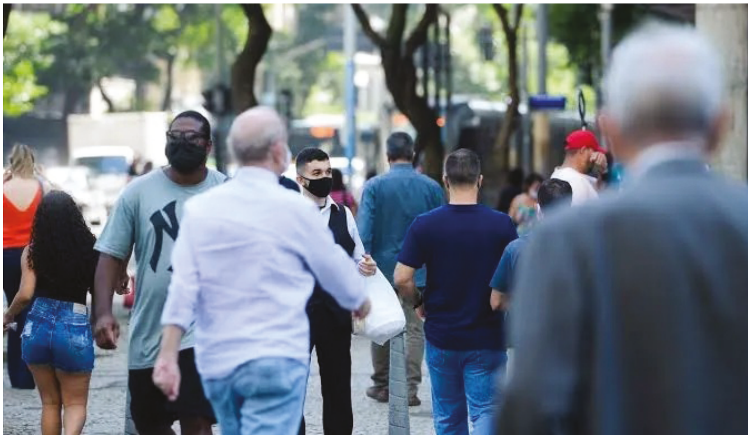
Em 2021, ano mais crítico da crise sanitária, Goiás atingiu o maior número de mortes da série histórica: 59.332.

Desde então, o estado vem observando uma desaceleração gradual, com destaque para a queda expressiva de 22,6% entre 2021 e 2022.