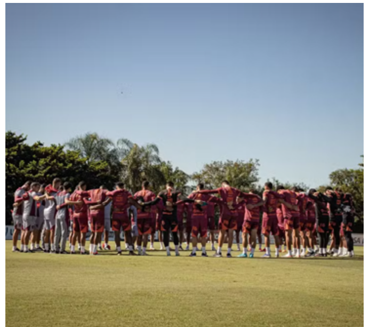
Vila Nova aposta no apoio da torcida em casa para superar a Raposa e se classificar para a próxima fase da Copa do Brasil

"O Vila por si só já tem o histórico de ser forte dentro de casa. No ano passado, o Vila só foi perder em casa lá para o final da Série B. Então, sempre friso isso para os atletas. Não vai ser logo na nossa vez aqui que o Vila não vai ser forte dentro de casa, afirmou durante coletiva.