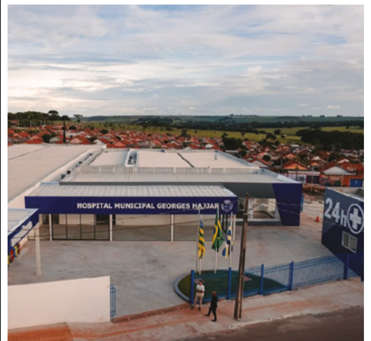
O contrato é de um ano e, neste período, será pago pela Prefeitura à OS o valor de R$ 32.866.404,84, o que dá R$ 2,738 milhões por mês

A construção contempla sala de triagem, consultórios médicos, de fisioterapia, sala de exames e curativos e sala de prescrição médica. O Georges Hajjar tem 32 apartamentos duplos hospitalares, 24 leitos para repouso clínico, sala de reabilitação, banheiros e vestiários acessíveis, central de abastecimento farmacêutico, sistema de geradores automatizados, refeitório, área de higienização e estacionamento para ambulâncias e acompanhantes.