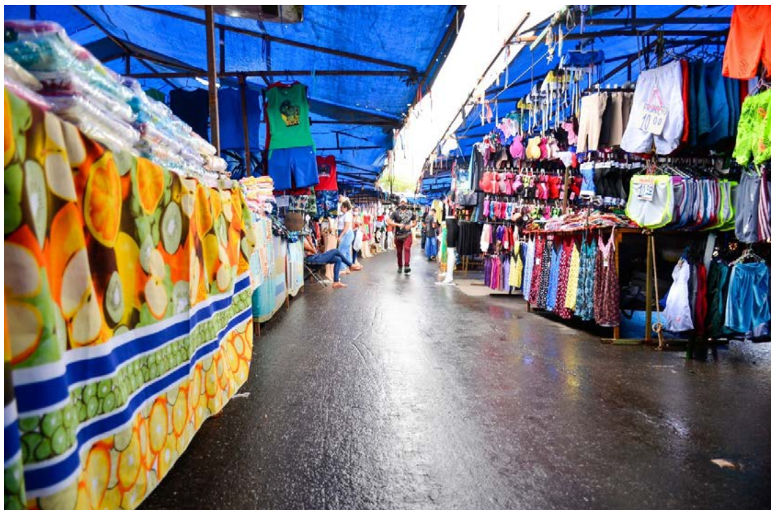
Acesso à feira ficou facilitado: feirantes apontam melhora nas vendas