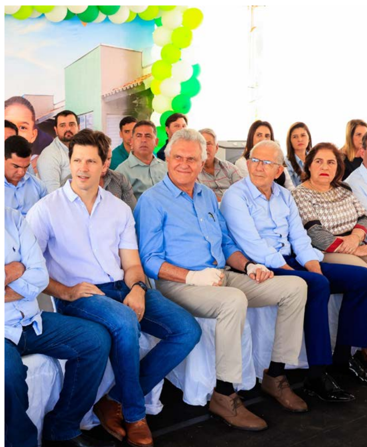
Governador Ronaldo Caiado e gestores ontem em Bela Vista: investimento de R$ 7 milhões

O vice-governador Daniel Vilela ressaltou a importância do programa, o qual considera o mais especial dentre todos os programas do Governo de Goiás. "A gente consegue ver aqui, no olho de cada um de vocês, um momento de muita emoção. Porque muitos não tinham mais expectativa de ter a sua casa própria, não tinham mais a esperança de ter um lar que pudesse dar a tranquilidade, a paz, a harmonia e a esperança de uma vida melhor", afirmou.