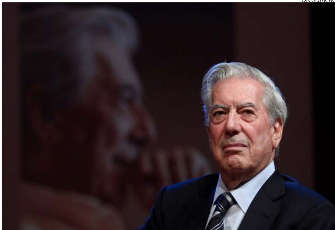
Autor teve obra reconhecida ao vencer o Nobel da Literatura em 2010

Com uma enorme facilidade de mesclar ficção e elementos da realidade pôde abordar questões políticas e sociais latentes e atuais, de modo literário. Em suas páginas, estão as ditaduras, a corrupção política e os conflitos sociais da América Latina. Um de seus livros mais conheci-