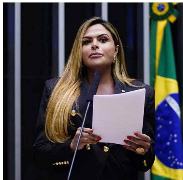
Silviê Alves (UB): a favor

niel Agrobom (PL), Dr. Ismael Alexandrino (PSD), Dr. Zacharias Calil (União Brasil), Glaustin da Fokus (Podemos), Jeferson Rodrigues (Republicanos), José Nelto (União Brasil), Marussa Boldrin (MDB), Professor Alcides (PL) e Silvyê Alves (União Brasil). Os únicos que não endossaram o pedido foram Flávia Moraes (PDT), Lêda Borges (PSDB) e, obviamente, os petistas Adriana Accorsi e Rubens Otoni.