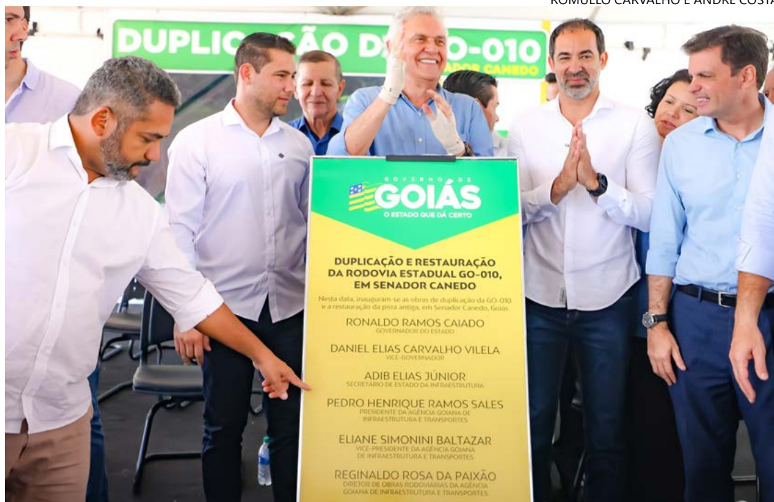
Governador Ronaldo Caiado e prefeito Fernando Pellozo: restauração e duplicação de trecho da GO-010

Além da Capital e Senador Canedo, a duplicação da GO-010 também beneficiará municípios como