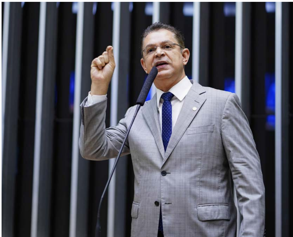
Deputado Sóstenes Cavalcante é o líder do PL na Câmara Federal: mais assinaturas do que o necessário

"Acabo de protocolar o requerimento de urgência do PL da Anistia com 264 assinaturas. Diante da pressão covarde do governo para retirada de apoios, antecipei a estratégia. Agora está registrado e público: ninguém será pego de surpresa. Anistia Já!", escreveu.