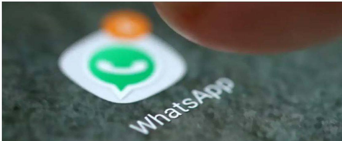
Clientes relataram terem sofrido com maior frequência golpes pelo WhatsApp

Os golpes do WhatsApp, das falsas vendas e da falsa central/falso funcionário de banco foram as principais armadilhas aplicadas em clientes de bancos no ano passado