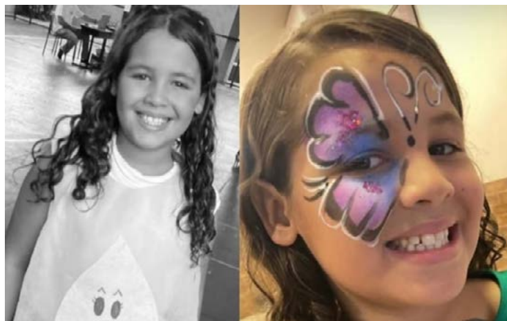
Inalação provocou parada cardiorrespiratória na criança

Uma criança de oito anos morreu no último domingo, 13, no Distrito Federal após participar do chamado desafio do desodorante, que vem circulando na rede social TikTok