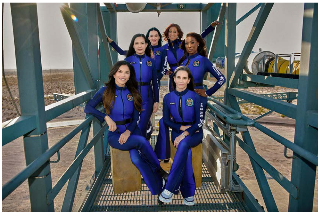
Katy Perry participou de uma breve, mas significativa, viagem ao espaço como parte de uma tripulação inteiramente feminina

Na manhã de ontem, o mundo testemunhou um marco na exploração espacial quando a missão NS-31 decolou majestosamente do local de lançamento da Blue Origin no oeste do Texas às 9:30 (horário do leste dos EUA). A cápsula New Shepard transportou uma tripulação exclusivamente feminina composta por seis mulheres extraor-