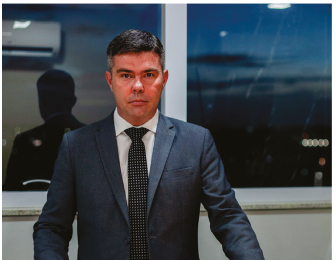
A medida integra o projeto FGTS Digital, que busca modernizar a fiscalização e tornar mais eficiente a arrecadação

De acordo com o MTE, essa é apenas a primeira fase da operação. “O processo de fiscalização será contínuo. Por isso, é imprescindível o empresário ficar atento, acompanhando regularmente as notificações eletrônicas no DET”, ressaltou.