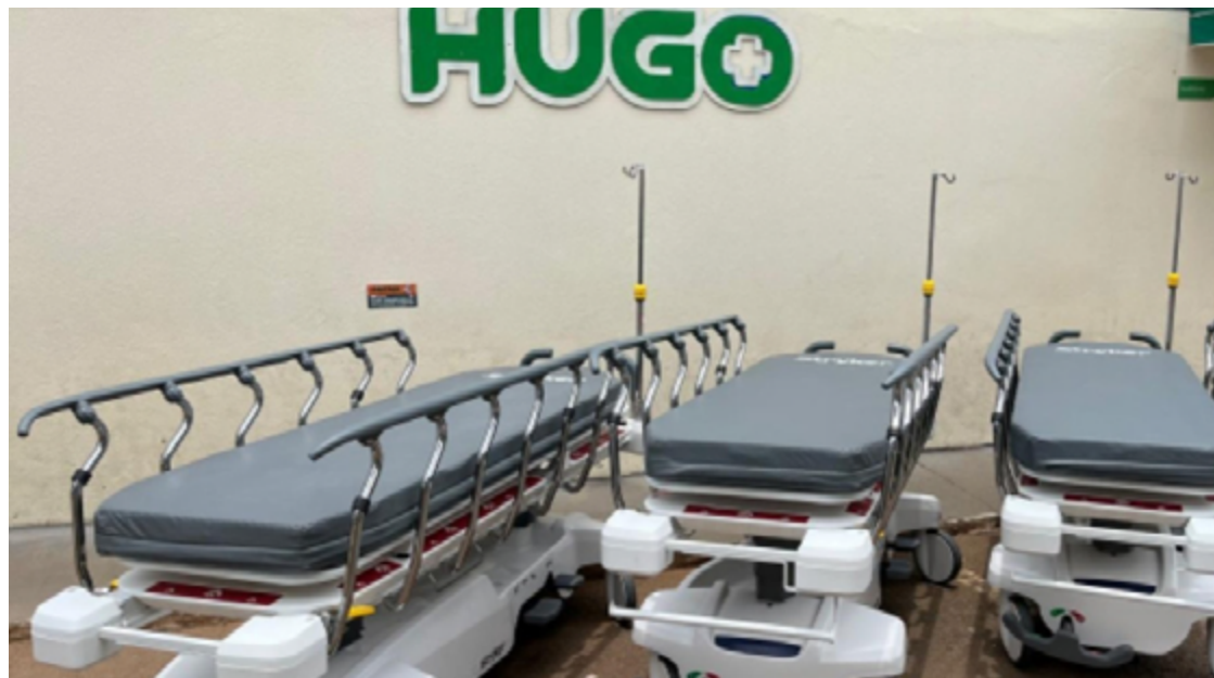
Foram repassados monitores de sinais vitais, macas hidráulicas, aparelhos de ultrassom portáteis, dentre outros

Além das aquisições, a gestão informa que outras ações estão em andamento, como melhorias na infraestrutura, capacitação de pessoal e atualização de protocolos clínicos.