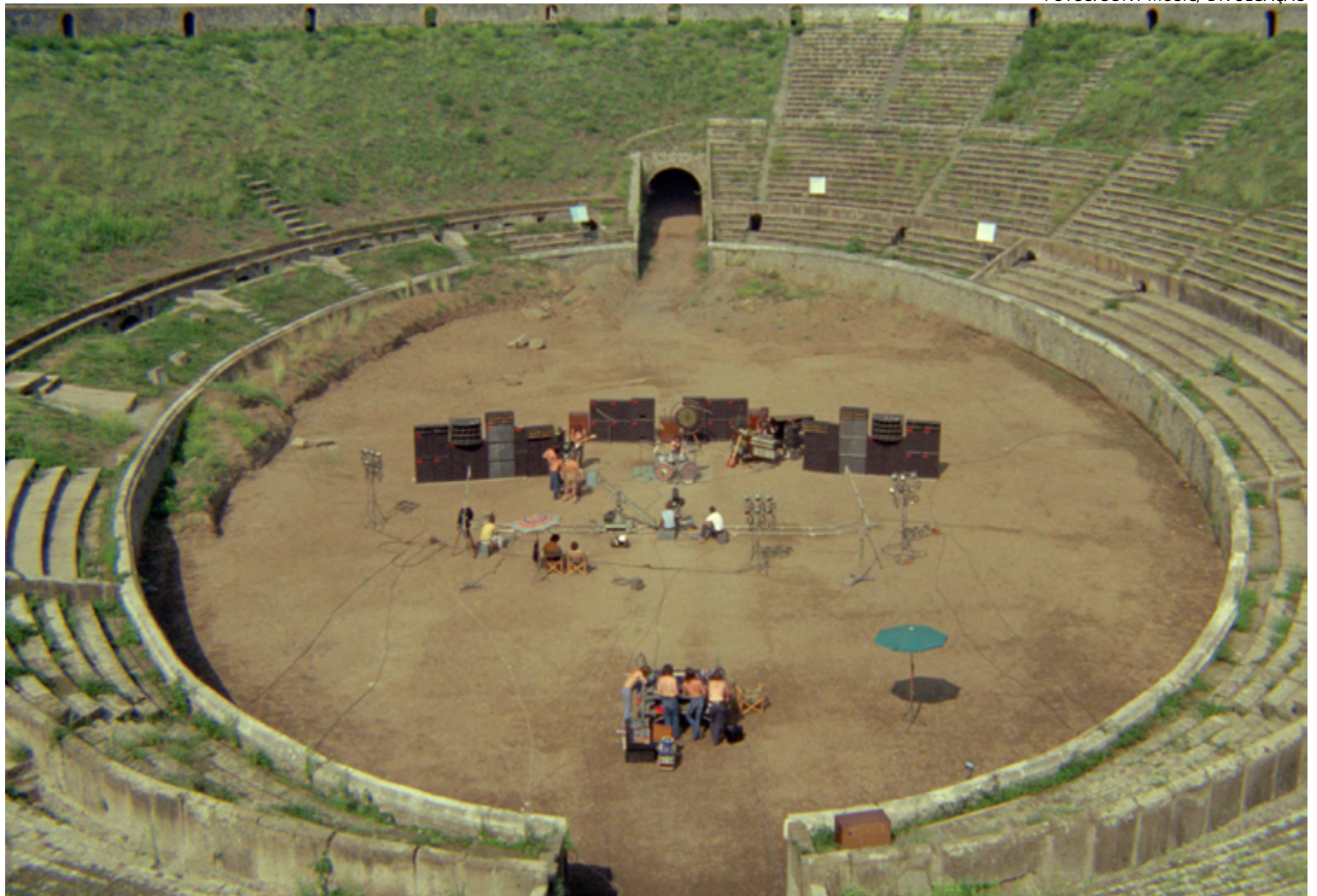
Pink Floyd gravou filme em anfiteatro localizado em histórica cidade italiana que viu Vesúvio deixá-la devastada há quase dois mil anos