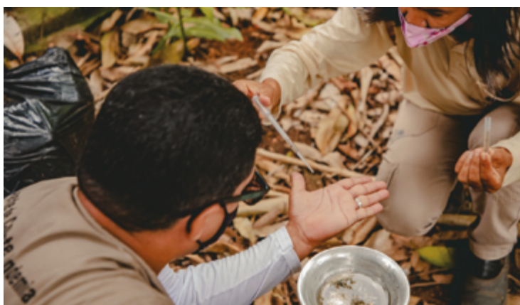
Ao analisar os dados mês a mês, é possível observar a significativa retração nos registros de casos em 2025

Do ponto de vista do perfil dos infectados, a maioria dos casos prováveis neste ano foi