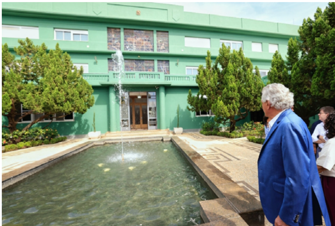
Governador Ronaldo Caiado durante entrega de restauração: obra recuperou áreas internas e externas

A obra, que custou R$ 3,8 milhões, recuperou áreas internas e externas do prédio, respeitando suas características originais.