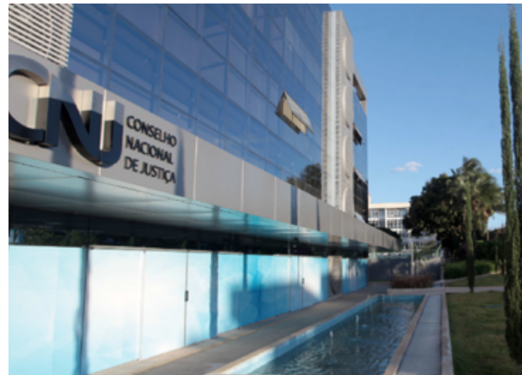
CNJ foi instado a instaurar investigação a partir de pedido de ministro do STF

O valor do benefício foi elevado, em 2023, de um terço (33%) para três quintos (60%) do subsídio mensal