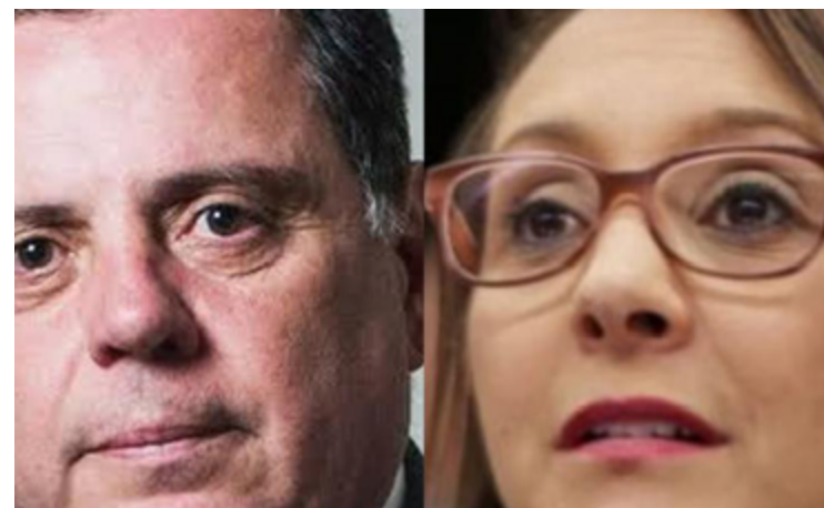
Marconi Perillo e Renata Abreu: acordo em fase final

Prestes a deixar de existir em razão dos últimos resultados eleitorais, partido de Marconi quer evitar a perda de mais lideranças