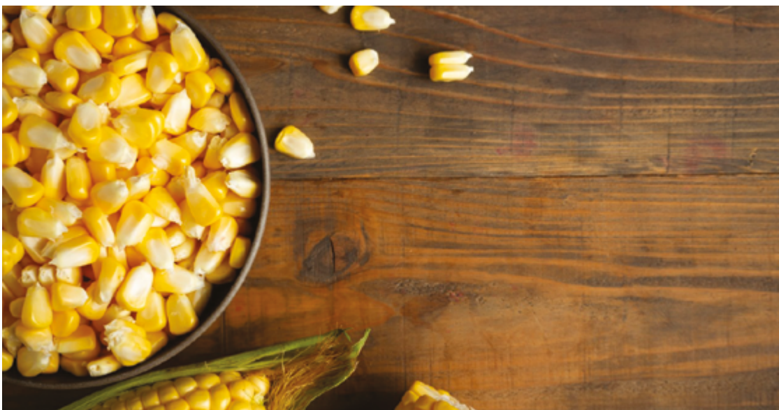
O milho é fonte de carboidratos, sem glúten, e uma alternativa energética para pessoas com diabetes.

O milho é fonte de energia e nutrientes essenciais para a saúde humana. Rico em vitaminas (A, B1, B3), fibras e minerais (cálcio, ferro, fósforo, magnésio, potássio), o cereal fortalece o sistema imunológico, melhora o funcionamento intestinal e ajuda a prevenir doenças, como reumatismo. Além disso, é fonte de carboidra-