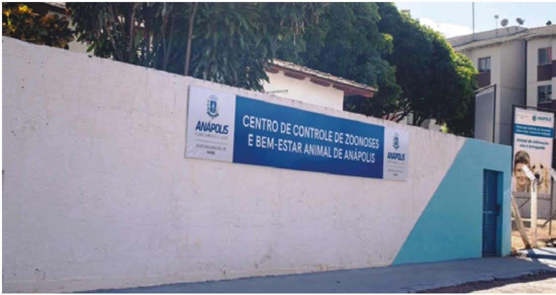
Em resposta ao questionamento do promotor, a Secretaria Municipal de Saúde alegou estar em conformidade com uma lei municipal de 2019