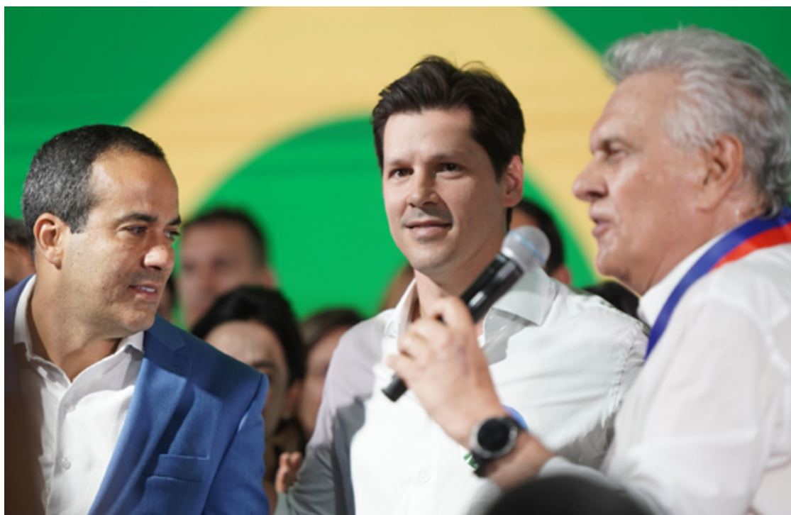
Ronaldo Caiado ao lado de Daniel Vilela e Bruno Reis no lançamento da sua pré-candidatura à presidência

se presta a espalhar fake news ao afirmar que 163 postos em Goiás estariam ligados a facções. Isso é uma distorção grave da realidade: são apenas 26 investigados, e só 4 com qualquer indício de conexão criminosa”, declarou.