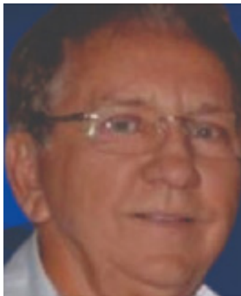
MOACIR MELO ESPECIAL PARA O DM ECONOMISTA E EMPRESÁRIO EM ANÁPOLIS

Em seu livro “A República” o filósofo e matemático grego, Platão (428 AC -348 AC), escreveu seu texto mais contundente, comentado e analisado em todos os tempos, que foi “O Mito da Caverna ou Alegoria da Caverna,” cuja explicação minimizada pode ser assim definida e contextualizada: “os seres