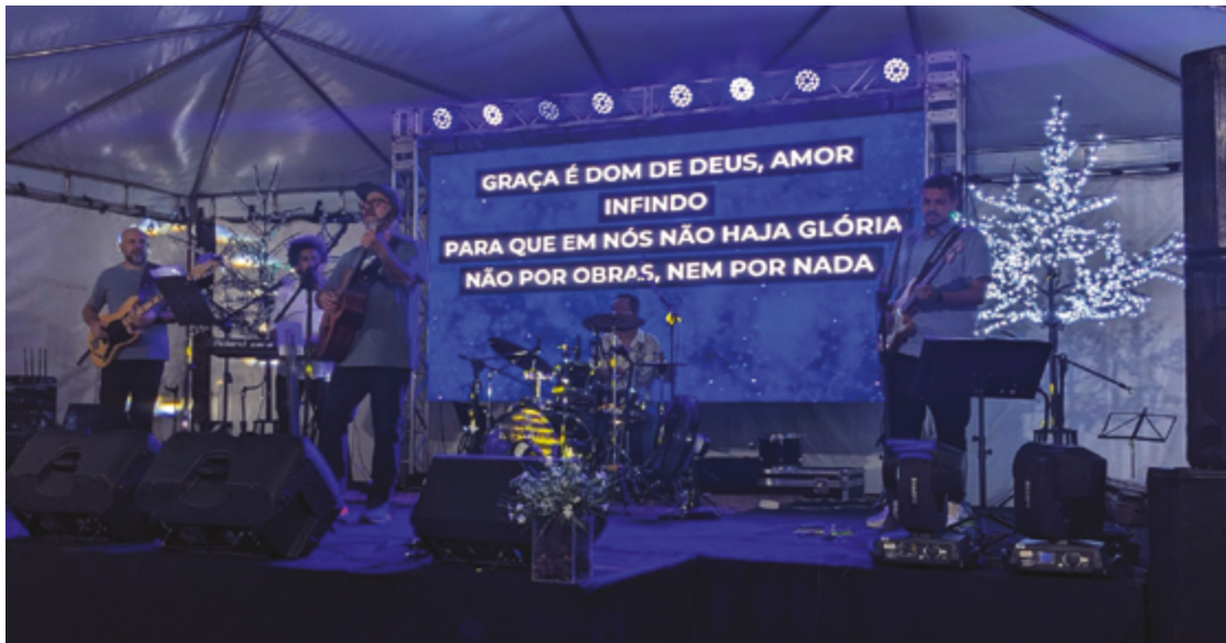
Um dos destaques do evento será o palco principal, que receberá apresentações artísticas de diferentes estilos musicais

Um dos destaques do evento será o palco principal, que receberá apresen-