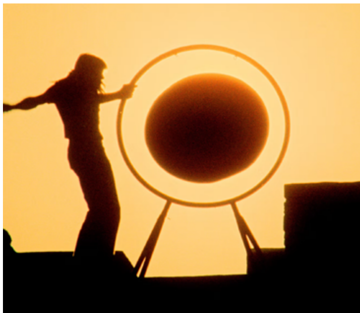
Roger Waters desfere golpes no gongo para produzir um som metafísico