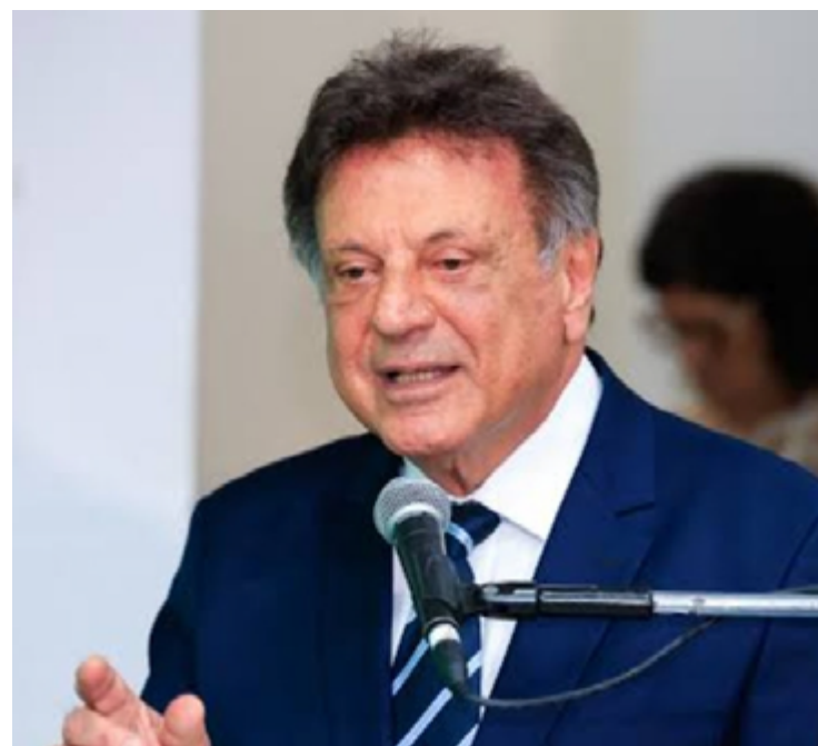
Secretário de Estado da Infraestrutura, Adib Elias: parceria com prefeituras reduz déficit habitacional

Criado em 2021, o Pra Ter Onde Morar - Construção busca reduzir o déficit habitacional em Goiás por meio de parcerias com prefeituras.