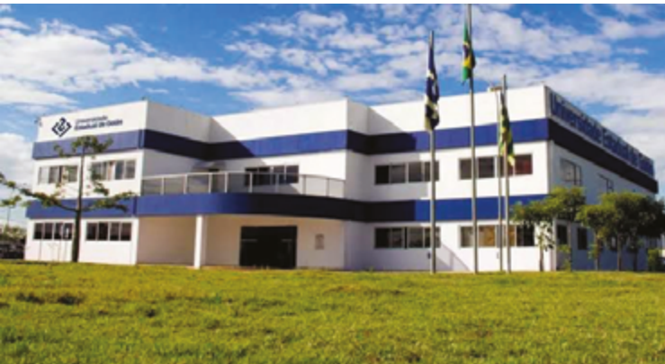
UEG prorroga inscrições para processos seletivos do Vestibular 2025/2 e Vestibular Modalidade Educação à Distância (EaD)