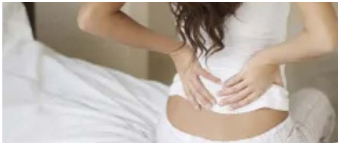
Dores nas costas dominam ranking com 237.113 licenças ao longo de 2025

4,1 milhões de trabalhadores foram temporariamente afastados em 2025 por motivos de saúde, no maior volume registrado desde 2021