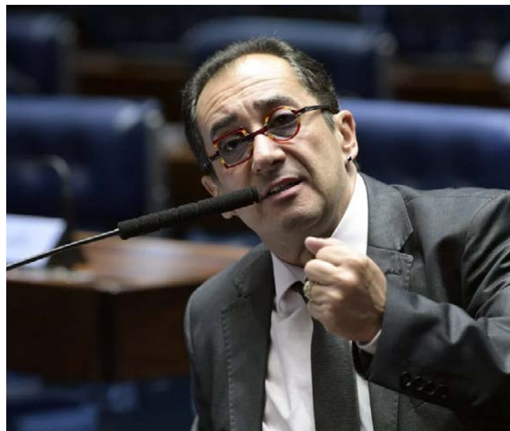
Jorge Kajuru: mandatos de vereador por Goiânia e senador por Goiás

Senador foi diagnosticado com Mal de Parkinson; vai priorizar tratamento da saúde a partir de agora