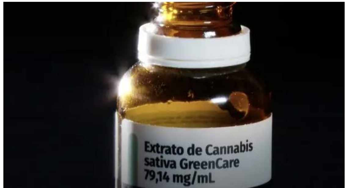
Comitê da Anvisa ficará incumbido de manter controle e assegurar fiscalização de produtores

As mudanças nas regras do uso da cannabis no país atendem a pedido do Superior Tribunal Federal