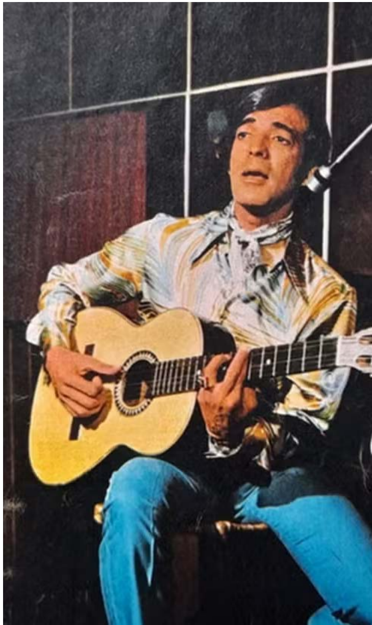
Ápice do cantor ocorreu entre os anos 1960 e 1970

O artista também manteve uma presença internacional, apresentando-se em países da América Latina e em shows para comunidades brasileiras no exterior. O velório foi realizado nesta quarta-feira, 28, no Cemitério São Pedro, localizado na Avenida Francisco Falconi, na Vila Alpina, em São Paulo, das 17h30 às 19h30.