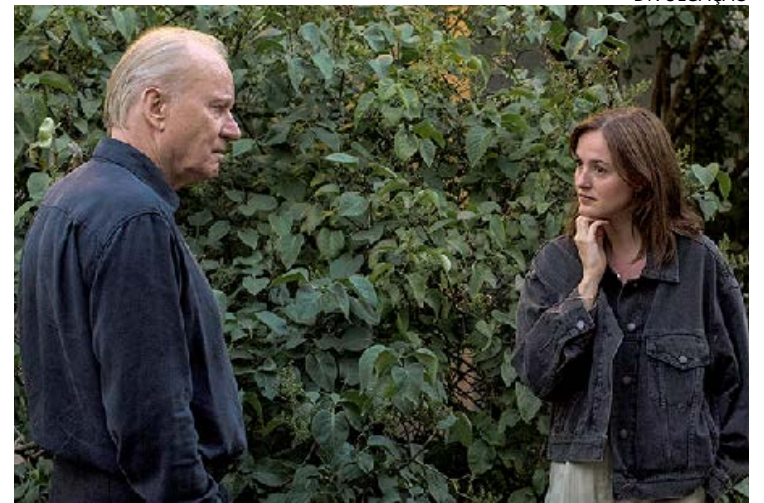
'Valor Sentimental' retrata relações familiares