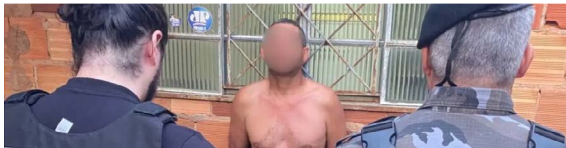
Investigados na operação são condenados por diversos crimes