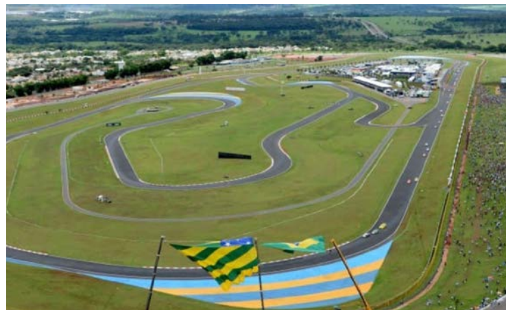
Última edição do GP do Brasil da categoria aconteceu em 1992

Prova acontece no Autódromo Internacional Ayrton Senna entre os dias 20 e 22 de março