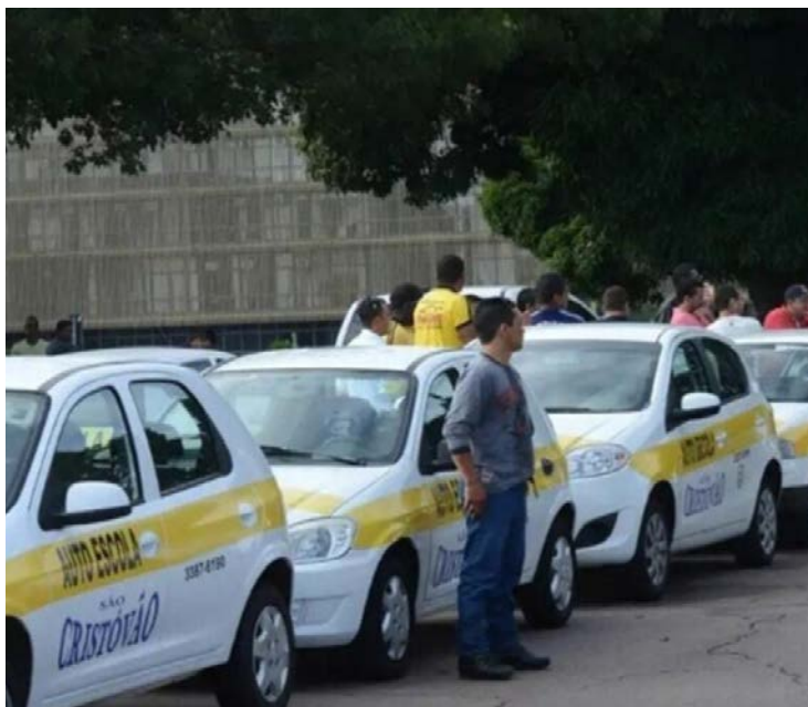
Reteste gratuito da prova prática deve beneficiar cerca de 40 mil pessoas por ano em Goiás

Outros serviços do novo modelo já estão em funcionamento em Goiás. Entre eles, o fim do vencimento dos processos de CNH, a aplicação de novos parâmetros para aulas práticas, com carga mínima de duas horas para as categorias A e B e dez horas para as categorias C, D e E, além da abertura do Registro Nacional de Conduto-