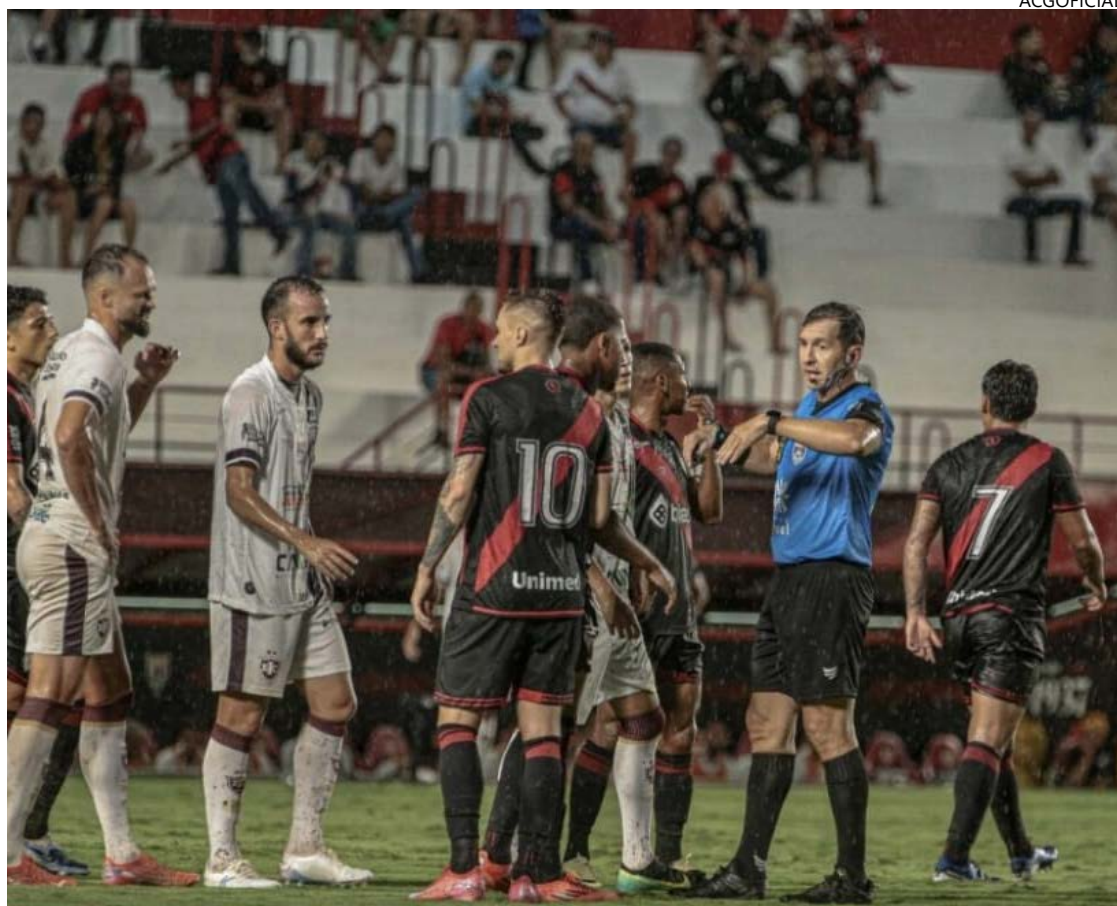
Atlético-GO vence Inhumas por 2 a 0 em Antônio Accioly encharcado

Com o resultado, o Atlético-GO chegou aos 13 pontos e assumiu a liderança provisória do Goianão. O time aguarda os demais jogos da rodada. O Inhumas perma-