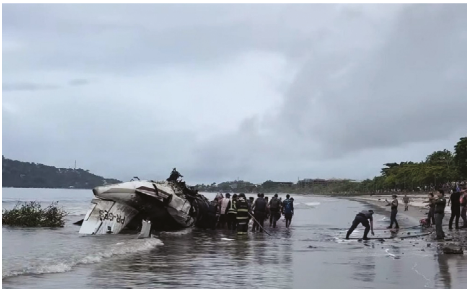
Avião ficou destruído após queda em praia no litoral paulista

De acordo com o advogado, o Brasil é o segundo país no mundo em número de pistas de aviação geral, o que exige um sistema de manutenção rigoroso. “Esses aeródromos precisam estar em conformidade com normas de segurança, como áreas de escape, cercas de proteção contra animais e drenagem adequada. No entanto, em situações como