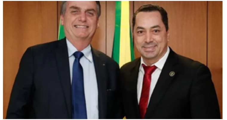
Jair Bolsonaro e Uugton Batista: proximidade política