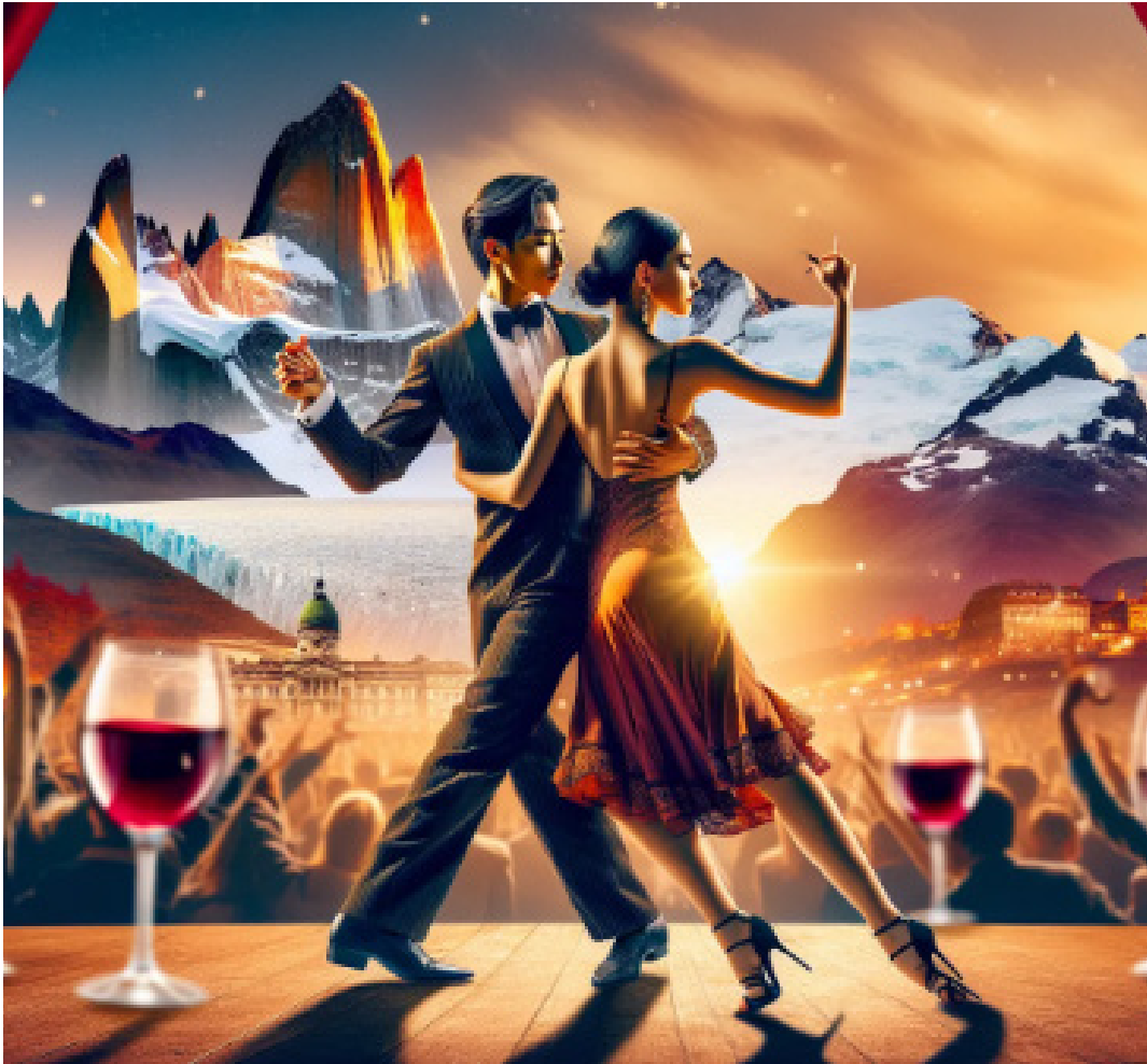
Vinhos argentinos, assim como o tango, têm alma: emocionam os sentidos

Há certa sensualidade que emana da Argentina. Uma dança de corpos e taças, de sabores que se entrelaçam com o ritmo pulsante de um bandoneón