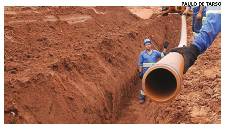
Serviço de implementação de rede de esgoto por parte da Saneago

“A situação é extremamente frustrante. Além de sermos os únicos sem esgoto na região,