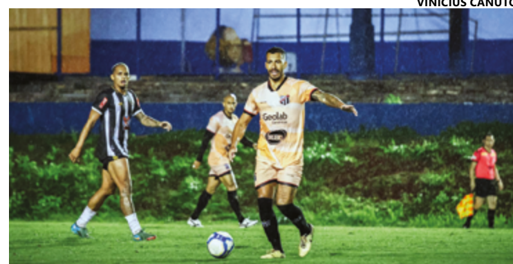
Anápolis encarou Ceilândia em jogo-treino sob forte chuva no estádio Jonas Duarte

A estreia do Galo será no próximo dia 15, às 20h30, diante do Crac, em Catalão.