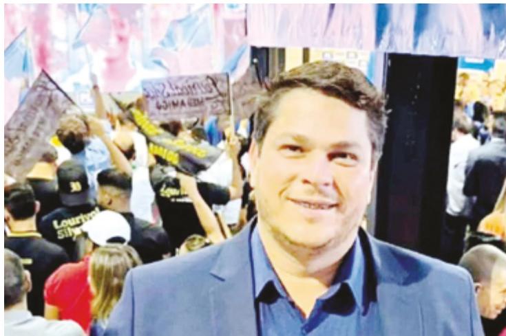
Vereador eleito em Ceres tem mandado de prisão em aberto e teve posse suspensa