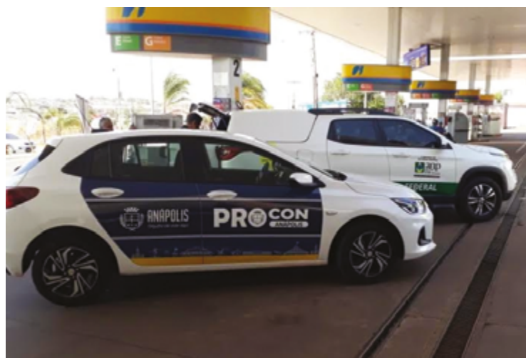
Carros do Procon estão entre aqueles que serão devolvidos para reavaliação de cessão pela gestão.

"Mesmo que os carros sejam próprios, temos custos com manutenção e combustível", justificou o prefeito. Nos primeiros dias, Corrêa tem adotado um discurso austero e anunciado medidas no sentido de cortar gastos. Segundo ele, o objetivo é oferecer à sociedade uma gestão mais eficiente.