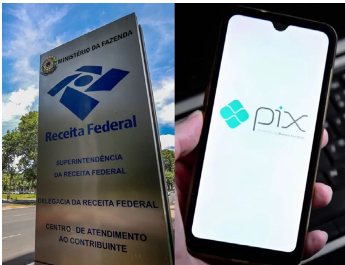
Instituições têm a obrigação de informar movimentações financeiras à Receita Federal

R$ 5 mil para pessoas físicas são comunicadas à Receita Federal.