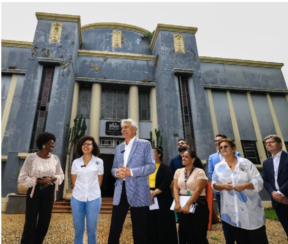
Vistorias começaram pelo Palácio das Esmeraldas e seguiram pela praça Cívica: Caiado garante entregas antes do término de seu mandato

Para 2025, estão previstas novas etapas de restauração no Centro Cultural Marietta Telles e no prédio da antiga PGE, que também receberá parte da estrutura da Secretaria de Estado da Cultura. Os projetos estão em fase de elaboração e os custos ainda serão definidos.