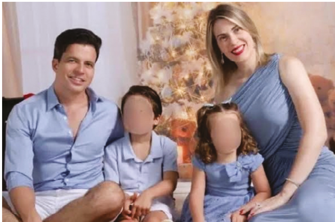
Família conhecida no agro goiano estava na aeronave

A responsabilidade pela apuração das causas do acidente cabe ao Centro de Investigação e Prevenção de Acidentes Aeronáuticos (Cenipa), ligado à Força Aérea Brasileira (FAB). O órgão já iniciou o trabalho no local do acidente, utilizando