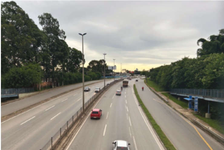
Calendário para pagamento do IPVA já tem início na próxima semana, confirma Detran Goiás