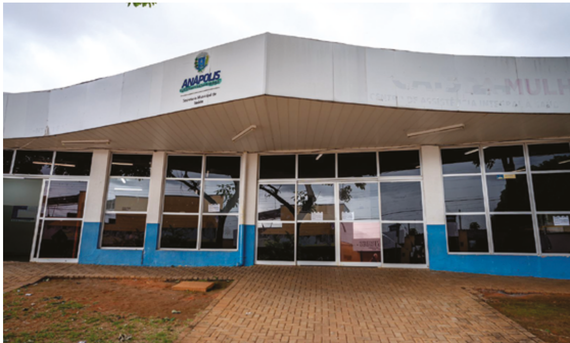
Entrada da UBS Abadia Lopes, no Jardim Calixto, que será mais uma a funcionar em horário estendido

De acordo com a administração municipal, a iniciativa faz parte de uma série de ações planejadas pelo prefeito para desafogar a UPA Alair Mafra, na Vila Esperança, que frequentemente enfrenta lotação devido à grande procura. A UBS Aba-