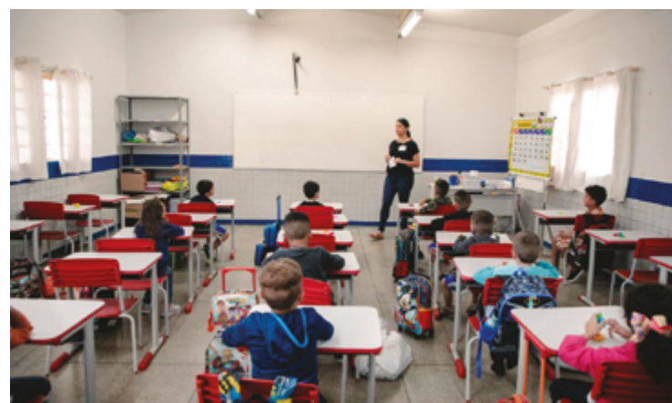
Sala de aula em CMEI de Anápolis: gestão fala em abrir 2,5 mil vagas de imediato

Já em Goiânia, o prefeito Sandro Mabel anunciou um plano para criar 10 mil novas vagas na educação infantil até junho deste ano. A estratégia combina convênios com o terceiro setor e a otimização da infraestrutura existente. Entidades religiosas como a Igreja Videira e a Assembleia de Deus estão adaptando as instalações para oferecer parte dessas vagas. Além dis-