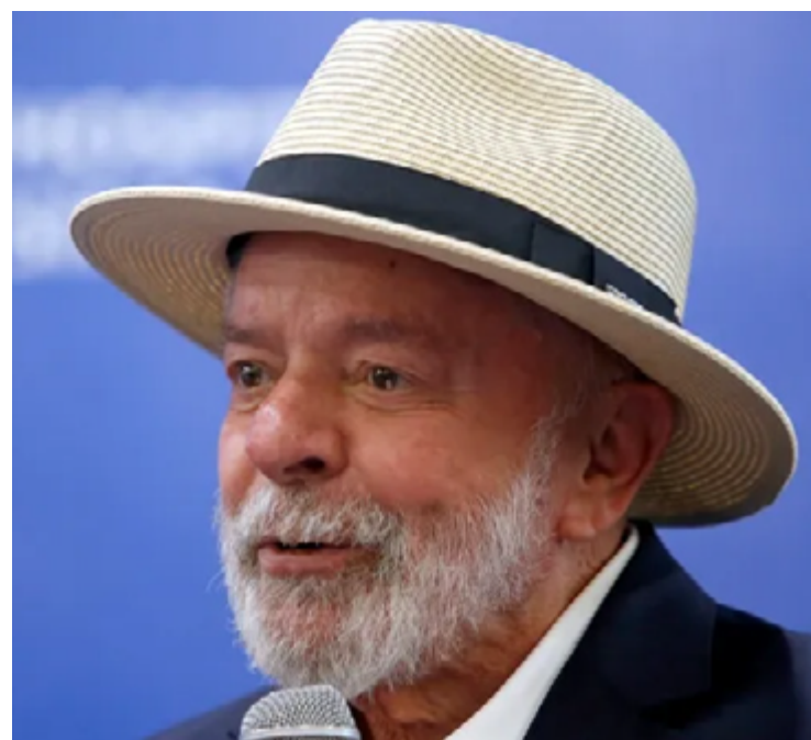
Lula da Silva: soberania do Brasil resguardada

Sidônio disse, na quarta-feira, que a decisão da Meta "é um problema também para a democracia, que a gente está discutindo aqui".