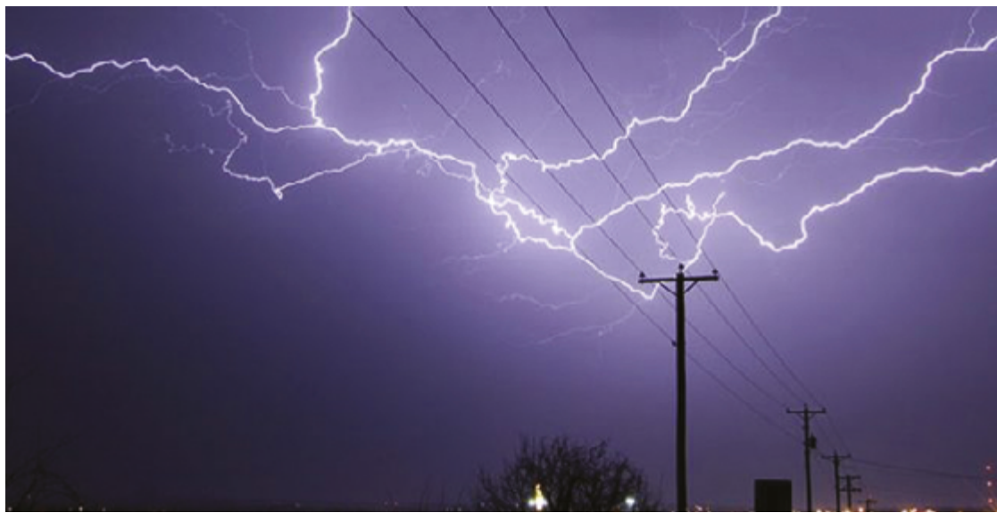
Fortes chuvas podem causar problemas e é importante evitar contato com a água próximo à rede elétrica

regada de impurezas, é condutora de eletricidade. Quem entrar em uma área alagada com circuitos elétricos energizados corre o risco de receber um choque. Isso pode causar lesões graves. Por isso, em alguns