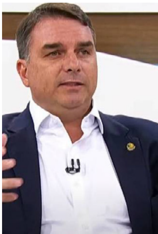
Senador Flávio Bolsonaro (PL/RJ)