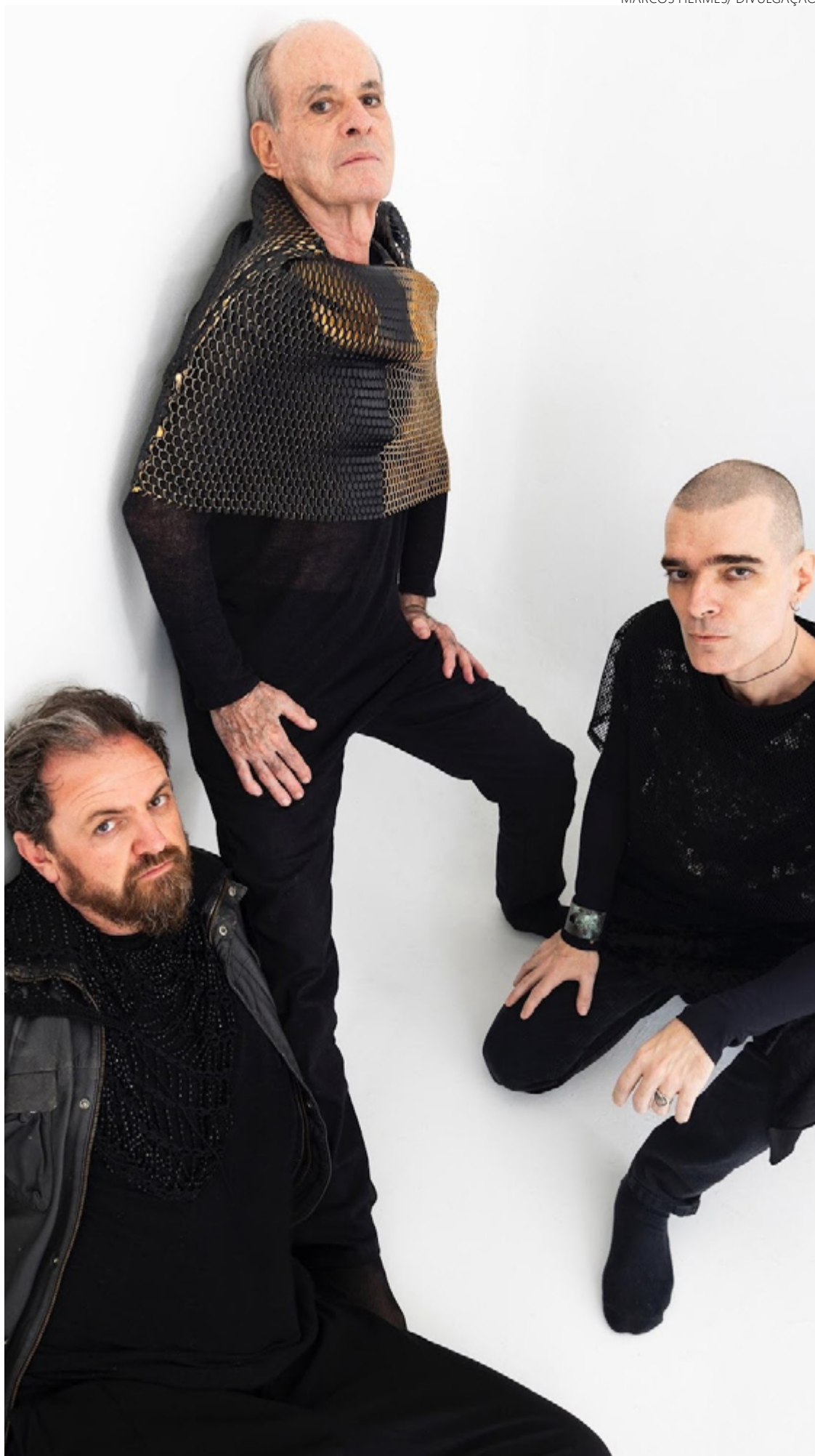
Ney e o duo Hecto: parceria se mostrou frutífera em disco que traz grandes participações

Aos 83 anos, deseja se manter jovem. Continua arejado. Uniu-se a dois jovens músicos, aos quais se conectou de cara, e começou a trabalhar em novo disco. Tudo ali funcionou como uma grande parceria. Ney ofereceu tranquilidade. Ensinou