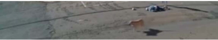
Testemunhas relataram que o indivíduo permaneceu no local por

Moradoras e frequentadoras do entorno do Terminal Cruzeiro já relataram anteriormente a sensação de insegurança na região, especialmente em lotes vagos e com pouca iluminação.