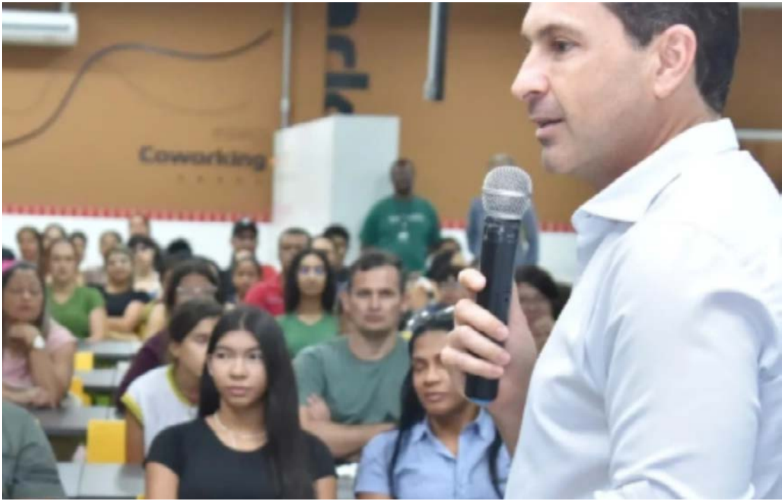
Leandro Vilela, prefeito de Aparecida: correções nas contas reestabeleceram a previsibilidade financeira

ações imediatas de contingenciamento. A Prefeitura deixou de nomear 2 mil cargos comissionados dos mais de 4.200 previstos e revisou contratos considerados onerosos, como o pagamento de R$ 14,8 mil mensais por cada um dos 101 totens de segurança eletrônica. As correções abriram caminho para equilibrar as contas e restabelecer a previsibilidade financeira. Aparecida figurou como a única entre os maiores municípios goianos que não recebeu o salário de dezembro de 2024. Servidores atribuíram a decisão do ex-prefeito Vilmar Mariano a um gesto de retaliação após a derrota eleitoral do então candidato Professor Alci-