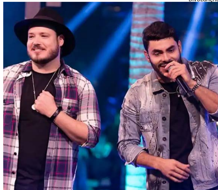
Dupla se consagrou com repertório romântico