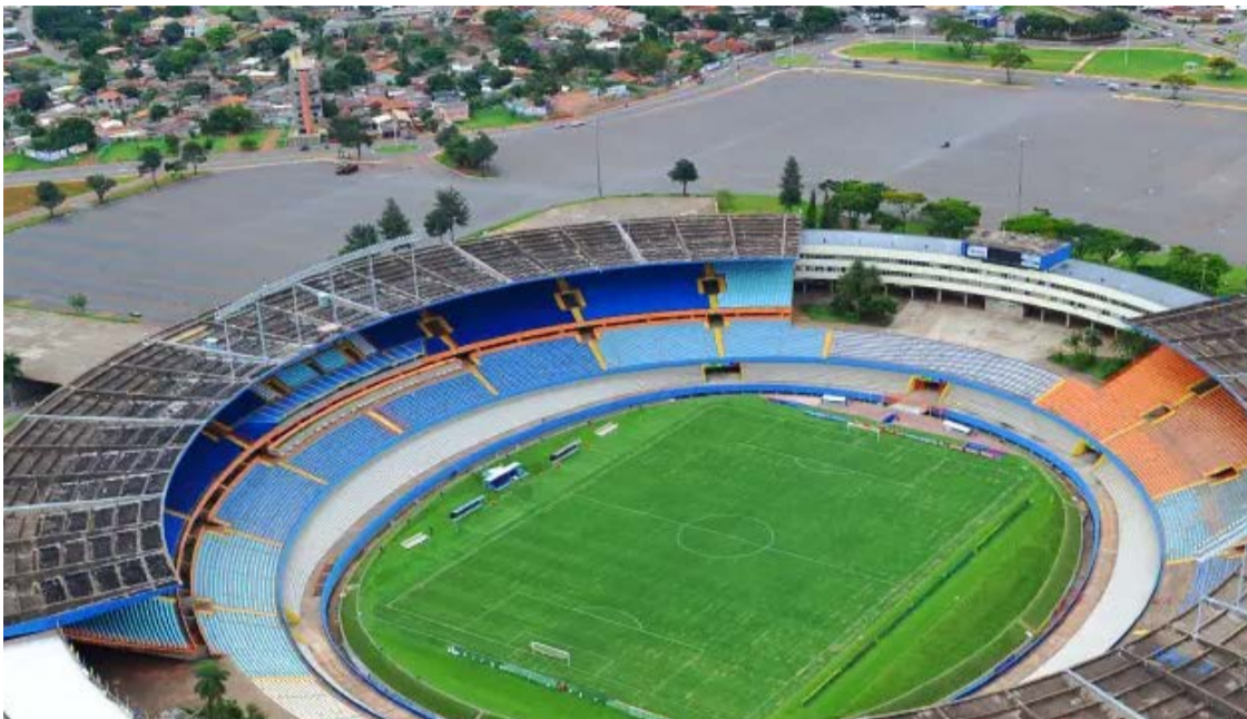
Valores destinados à obra já superam em quase três vezes o investimento obrigatório de R$ 215 milhões estabelecido na concessão

Caiado destacou que o espaço de mais de 400 mil metros quadrados será transformado na arena mais moderna e imponente do país. “Aquilo ali será a arena mais bonita do que todas que existem hoje”, afirmou o governador sobre o projeto de revitalização do estádio.