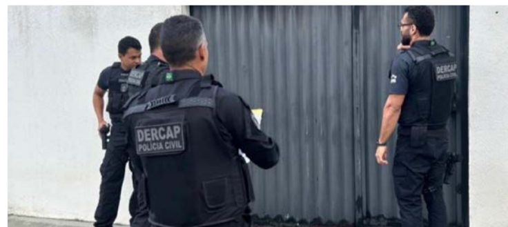
Ex-funcionária adulterava boletos originais e redirecionava os pagamentos