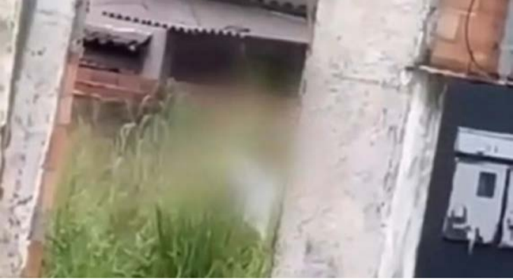
Testemunhas relataram que o indivíduo permaneceu no local por