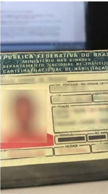
Exame, obrigatório a cada 30 meses, custa até R$ 300,00

Ele critica o impacto sobre desempregados e questiona possíveis interesses de laboratórios. Goiás era um dos 20 estados que ainda não aplicavam a multa e passou a fazê-lo após pressão de órgãos de controle.