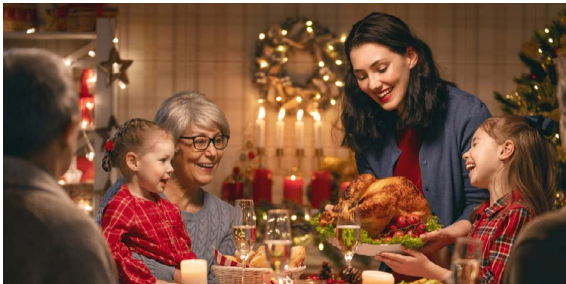
Não se esqueça: é bom nunca monopolizar conversas nem falar demais de si durante a ceia

Em meio a tanta euforia, é crucial lembrar do respeito mútuo ao pensar na etiqueta das festas natalinas. A seguir, veja dicas para fazer bonito