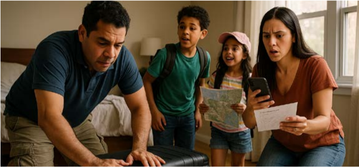
Viajar bem envolve adotar hábito contínuo de organização

Ele explica que períodos como dezembro, ja-