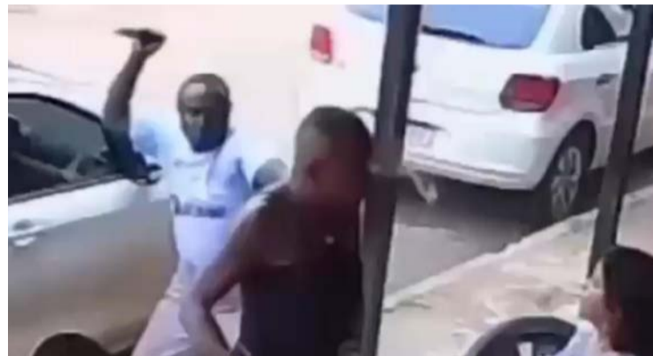
Clientes que estavam no estabelecimento fugiram assustados

Câmeras de segurança do local registraram o momento em que a vítima é atingida pelas costas