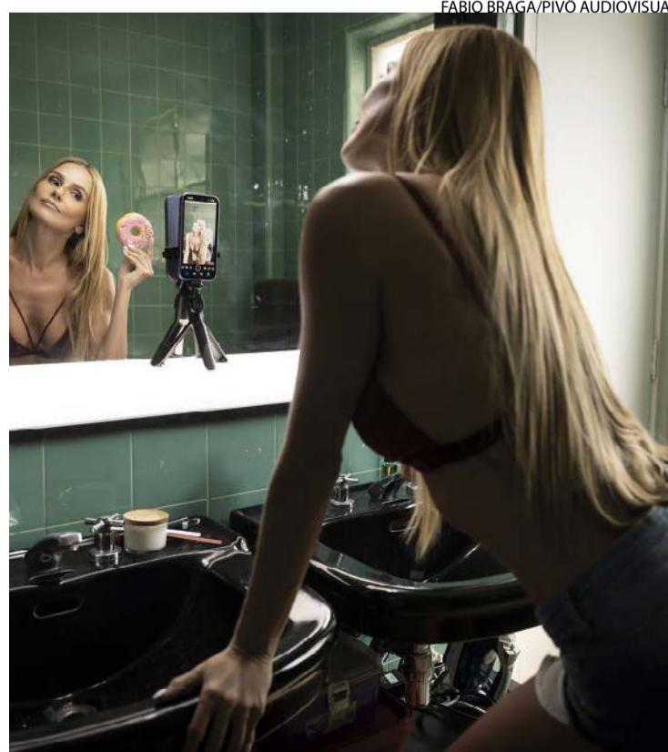
Artista foi alvo de comentários machistas por viver prostituta