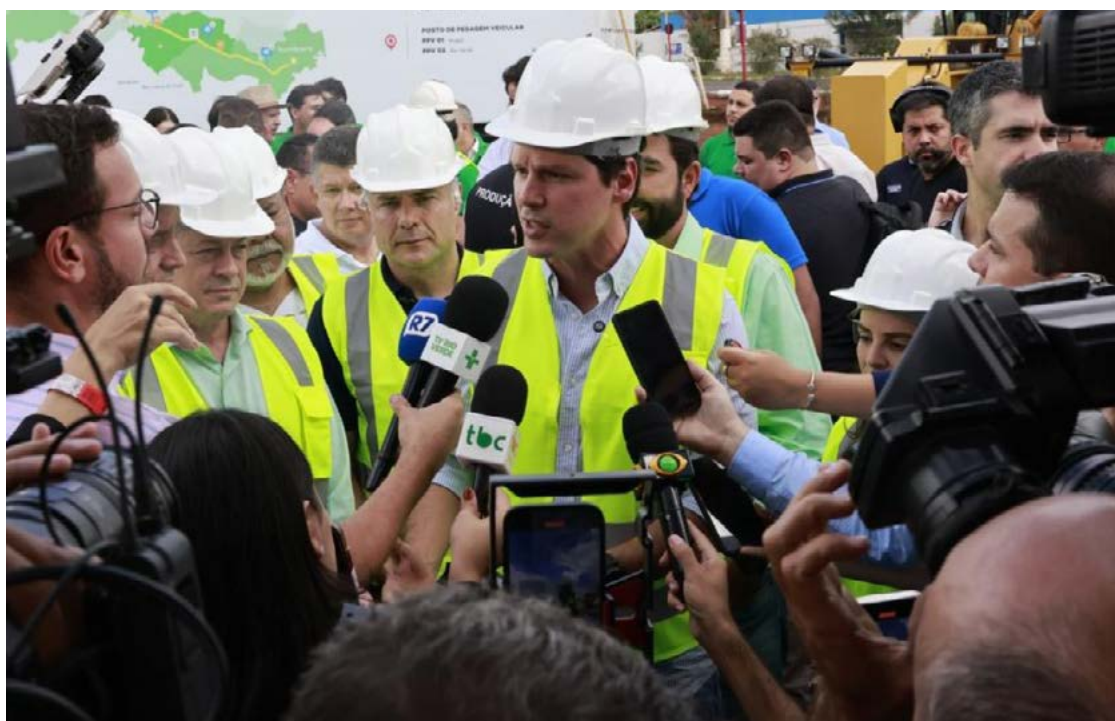
Vice-governador Daniel Vilela durante lançamento da Rota Verde Goiás: 426 km de rodovias serão reformadas

Durante o evento, Daniel Vilela ressaltou que o investimento federal se soma ao esforço estadual por melhorias na infraestrutura. “Goiás vive um momento histórico, com