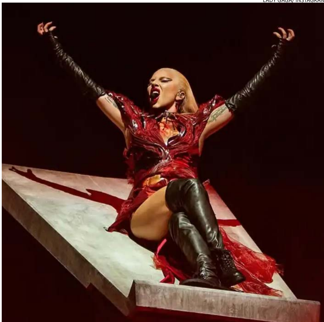
Pronunciamento da estrela pop chegou a virar meme na ocasião: "Brazil, I'm devastated"

cercar carros pretos, supostamente da comitiva da cantora, para ver se ela estava no interior de algum deles. Houve correria também no aeroporto internacional Tom Jobim, onde Gaga chegou em um avião fretado, com mais seis pessoas a bordo.