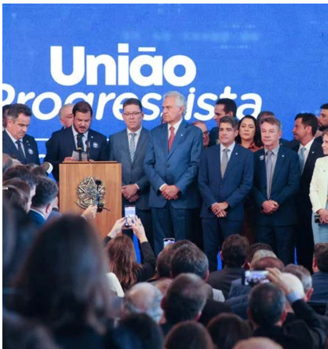
Reunião realizada ontem em Brasília com as principais lideranças do PP e União Brasil

“É isto, minha gente, que nós precisamos, neste momento, da classe política: entender o recado que deve ser dado, nesta hora,