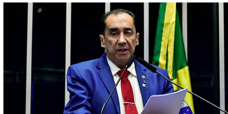
Jorge Kajuru destinou emenda de R$ 1 milhão para cidade paulista