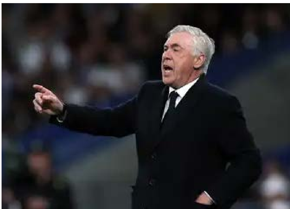
Carlo Ancelotti: acordo encaminhado para que o italiano assuma o comando da Seleção Brasileira a partir de junho

A saída do italiano do Real Madrid é vista como iminente. A imprensa espanhola aponta que o ciclo de Ancelotti no clube merengue está encerrado após uma temporada de resultados irregulares, e a diretoria já busca um substituto, com Xabi Alon-