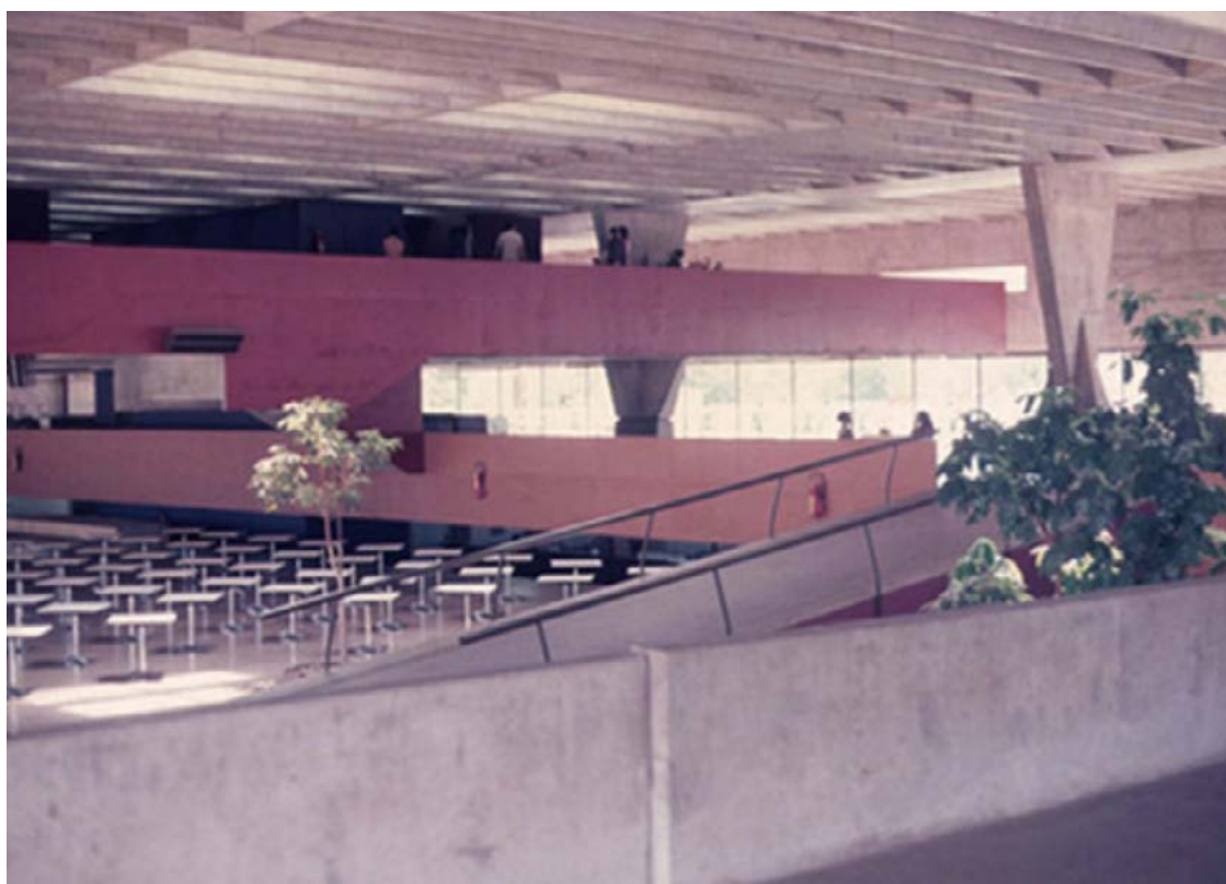
Clube teve importância histórica nos esportes e socialização da Capital: nova função afastará estilo de clube

A decadência do Centro como bairro financeiro afastou as elites, as matri-