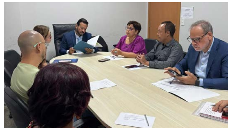
Gestão apresenta proposta, mas sindicato articula e categoria inicia paralisação

Administração propôs pagamento do novo piso já na folha do mês de maio e quer discutir retroativos