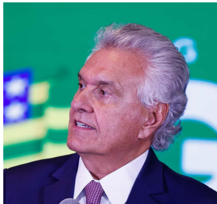
Ronaldo Caiado sai em defesa da goiana