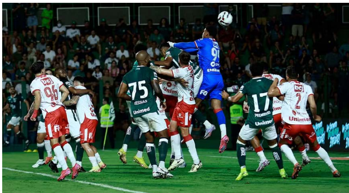
Duelo reúne os dois primeiros colocados da competição e pode provocar mudanças diretas no topo da tabela

Pelo regulamento, os oito melhores avançam às quartas de final, com os quatro primeiros garantindo o direito de decidir em casa. Nesse contexto, o clássico ultrapassa a rivalidade histórica e assume peso estratégico principalmente na definição da liderança e da ordem de classificação, fatores que influenciam diretamente os cruzamentos do mata-mata, ainda que o G-4 di-