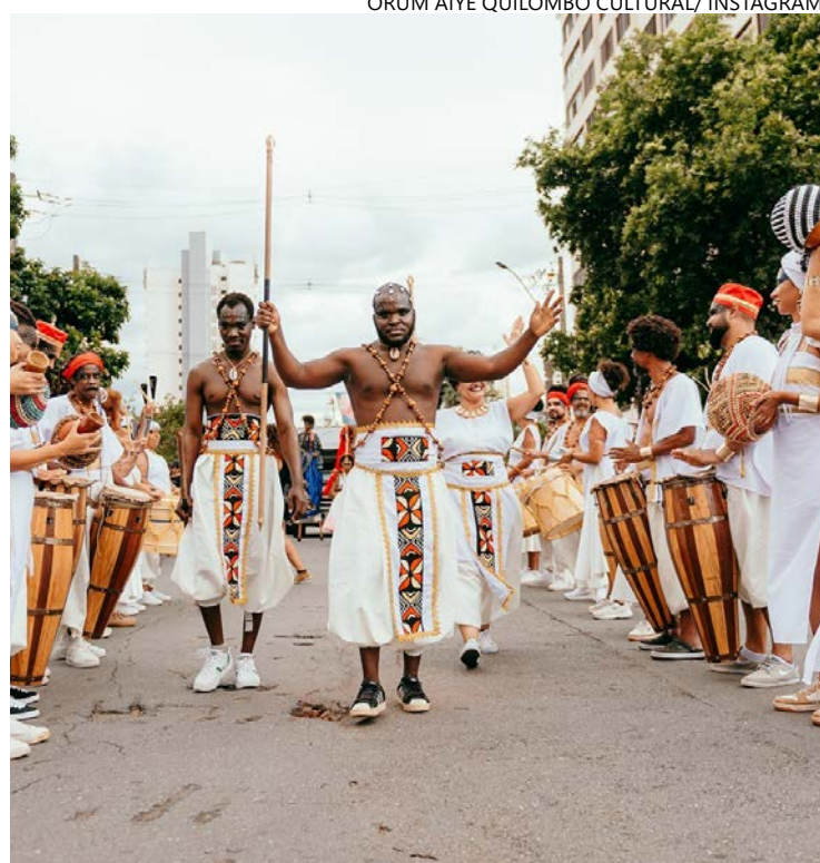
Foliões propõem encontros abertos para se aproximar de público

A programação começa às 14h com oficina de máscaras e confecção de estandarte, seguida, às 15h30,