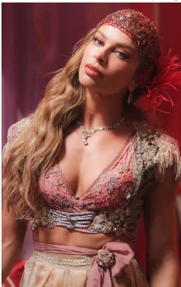
Artista vive mulher considerada ultrajante pelo conservadorismo

Na história, Beja é sequestrada pelo ouvidor do rei de Portugal. Tempos depois, quando se liberta, a personagem volta já rica para a cidade mineira de Araxá, onde cresceu, mas é mal recebida, considerada uma safada. Decide então chocar ainda mais e abre um bordel.