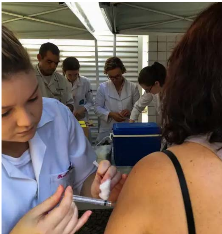
Mobilização ocorre após a confirmação de 37 casos de febre amarela em primatas não humanos

Em entrevista ao jornal Diário da Manhã, o diretor do Programa Nacional de Imunizações (PNI), médico infectologista Eder Gatti, explicou que os municípios participantes irão abrir unidades de saúde e pontos volantes de vacinação fora das estruturas tradicionais. O objetivo é ampliar a cobertura vacinal e