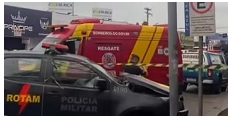
Testemunhas afirmaram que viatura estava em alta velocidade