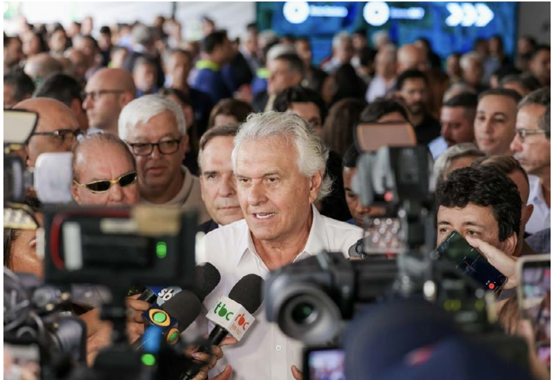
Governador Ronaldo Caiado entrega o Terminal Praça A reconstruído, novos ônibus elétricos e a estação de recarga do Projeto Nova RMTC

O projeto prevê investimentos de R$ 2 bilhões e atende cerca de 530 mil usuários por dia em 19 municípios. "É uma parceria que deu certo entre o Estado, as prefeituras e o empresariado. Esse foi o tripé que fez a frota mais verde do país", disse, ao destacar a redução de emissões.