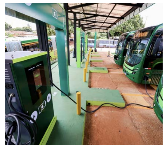
Estação de recarga conta com 23 carregadores de 240 kW e capacidade para atender 46 ônibus de uma única vez