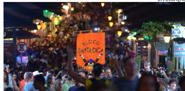
Cidade história traz marchinhas e festa infantil