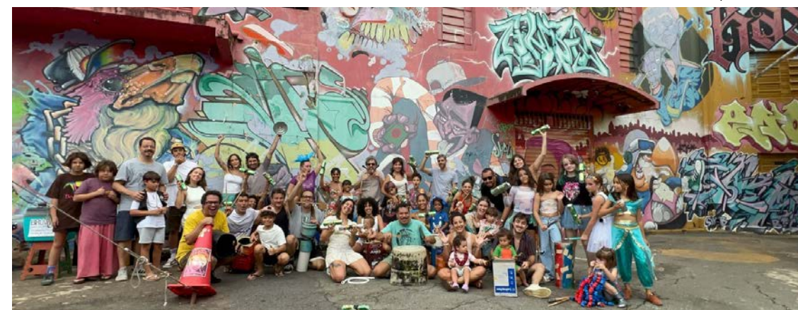
Concentração está prevista para começar às 14h: evento reúne público infantil