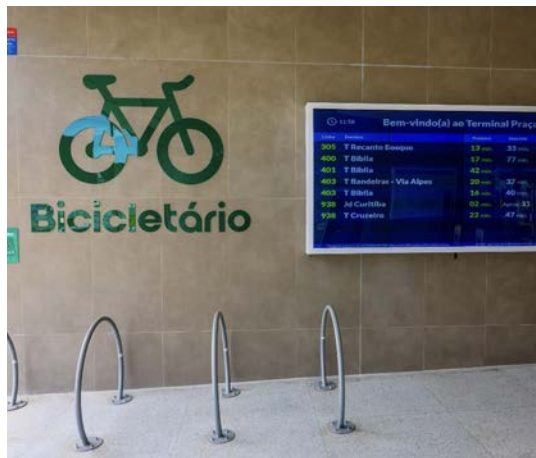
Estação para usuário deixar a bicicleta e usar o ônibus em uma das possibilidades de utilização do terminal