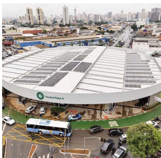
Vista de cima do terminal da praça A: tamanho aumentou de 1.941,60 m 2 para 5.541,76 m 2