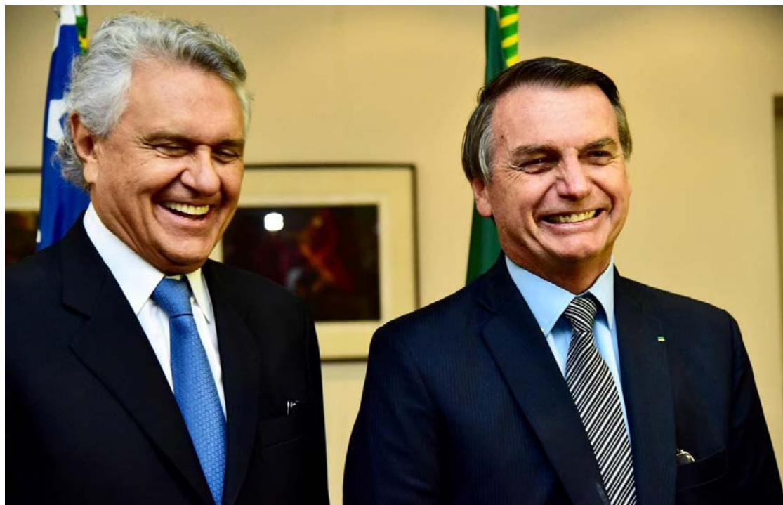
Ex-presidente Jair Bolsonaro diz que ida de Caiado ao PSD agrega força política na direita

também destacou que as pré-candidaturas de outros nomes do PSD, como Ratinho Júnior (PR) e Eduardo Leite (RS), igualmente contribuem para o fortalecimento do bloco oposicionista. A avaliação compartilhada entre os líderes é de que a diversidade de candidaturas amplia o alcance político