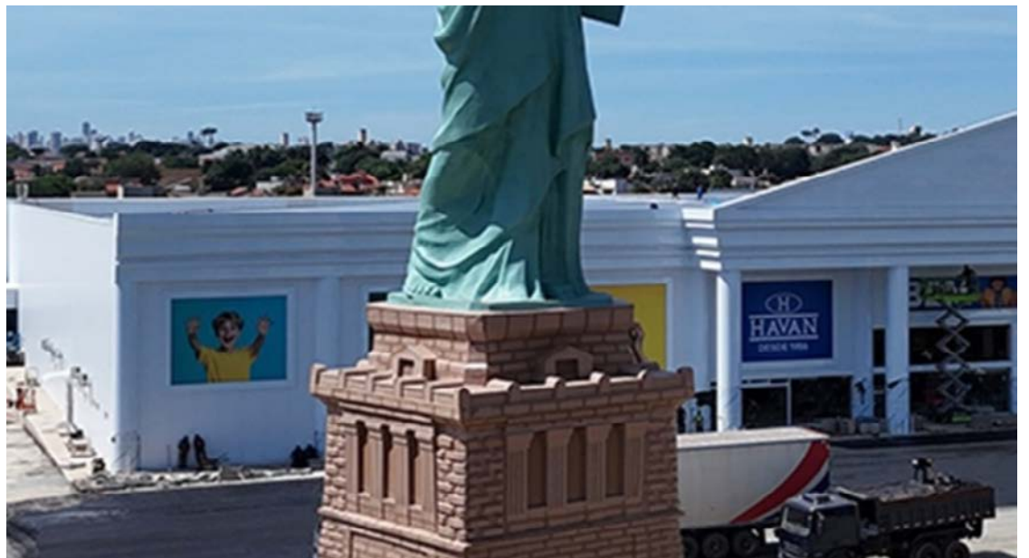
Havan inaugura loja próxima a shopping de Goiânia: 40 anos celebrados na Capital

Ontem, o prefeito de Goiânia, Sandro Mabel, informou nas redes sociais que o empresário Luciano Hang participou da pintura