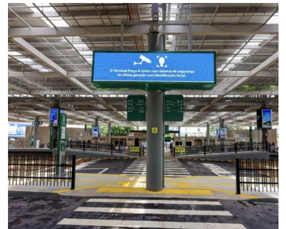
Novo terminal da Praça A, em Campinas: antes o local estava em ruínas, com equipamentos destruídos