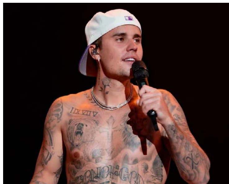
Justin Bieber deve ser a atração do "Todo Mundo no Rio"

Prefeito do Rio de Janeiro deu declaração a lojistas em um shopping, segundo portal