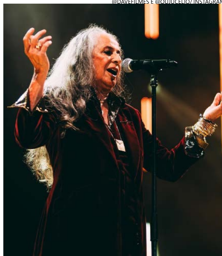
Maria Bethânia: “só vim agradecer por tudo o que Deus me fez”