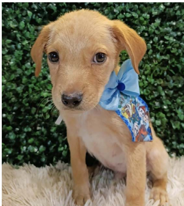
Prefeitura incentiva a adoção: pets adultos são entregues vacinados