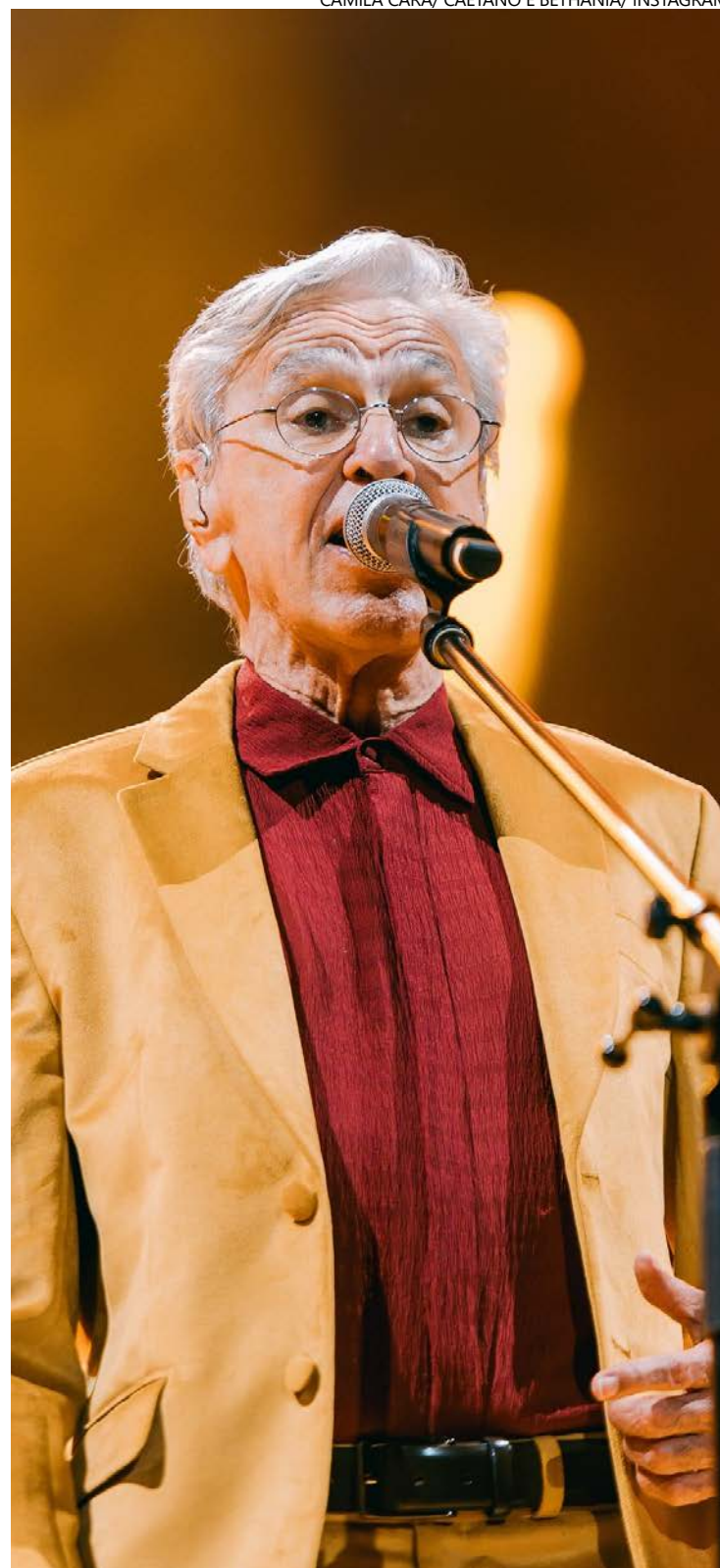
Caetano Veloso: compositor de destinos e poeta tropicalista