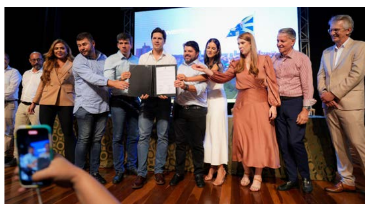
Governador em exercício Daniel Vilela e prefeito Márcio Corrêa: retomada da construção do Anel Viário no Daia

O Governo de Goiás também destinou R$ 10 milhões para a recuperação de ruas e estradas vicinais,