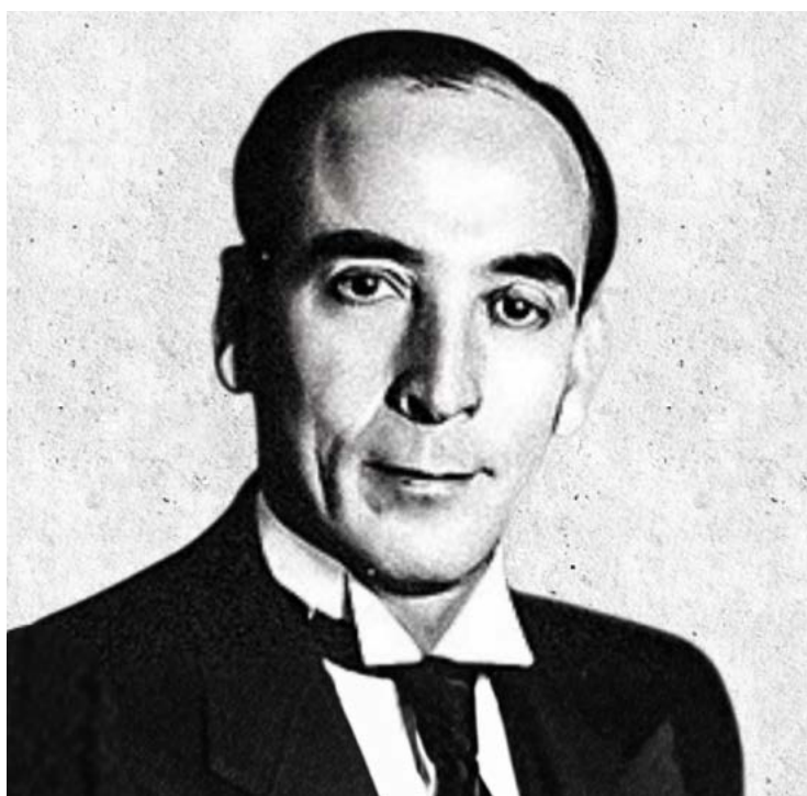
Pedro Ludovico Teixeira foi um dos mais importantes médicos na política goiana

co — muitas vezes o único profissional com quem a população tem contato regular no sistema público — acaba se tornando uma figura de confiança e respeito.