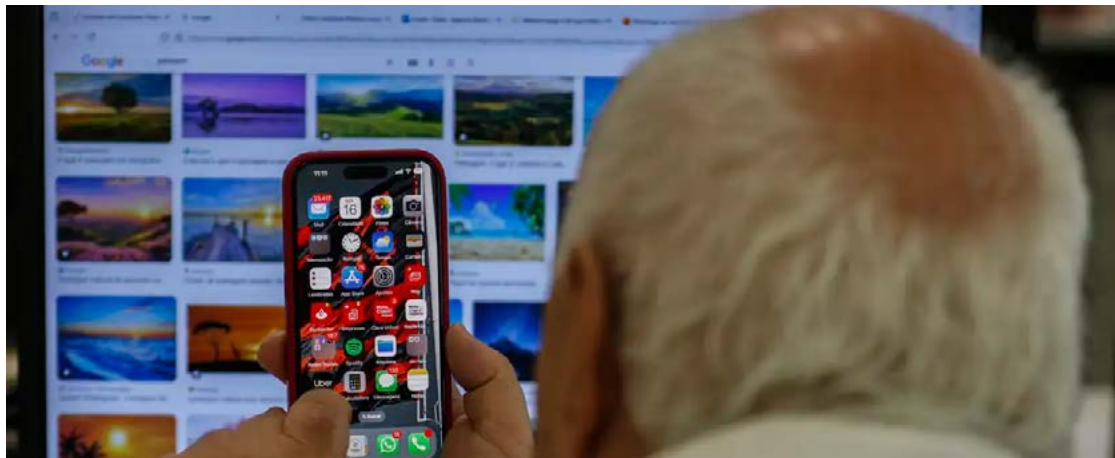
Faixa etária de idosos representou 38% do total de compradores pela internet no ano passado

Os consumidores mais maduros, com 50 anos ou mais, estão liderando as compras na internet, já os jovens tiveram queda