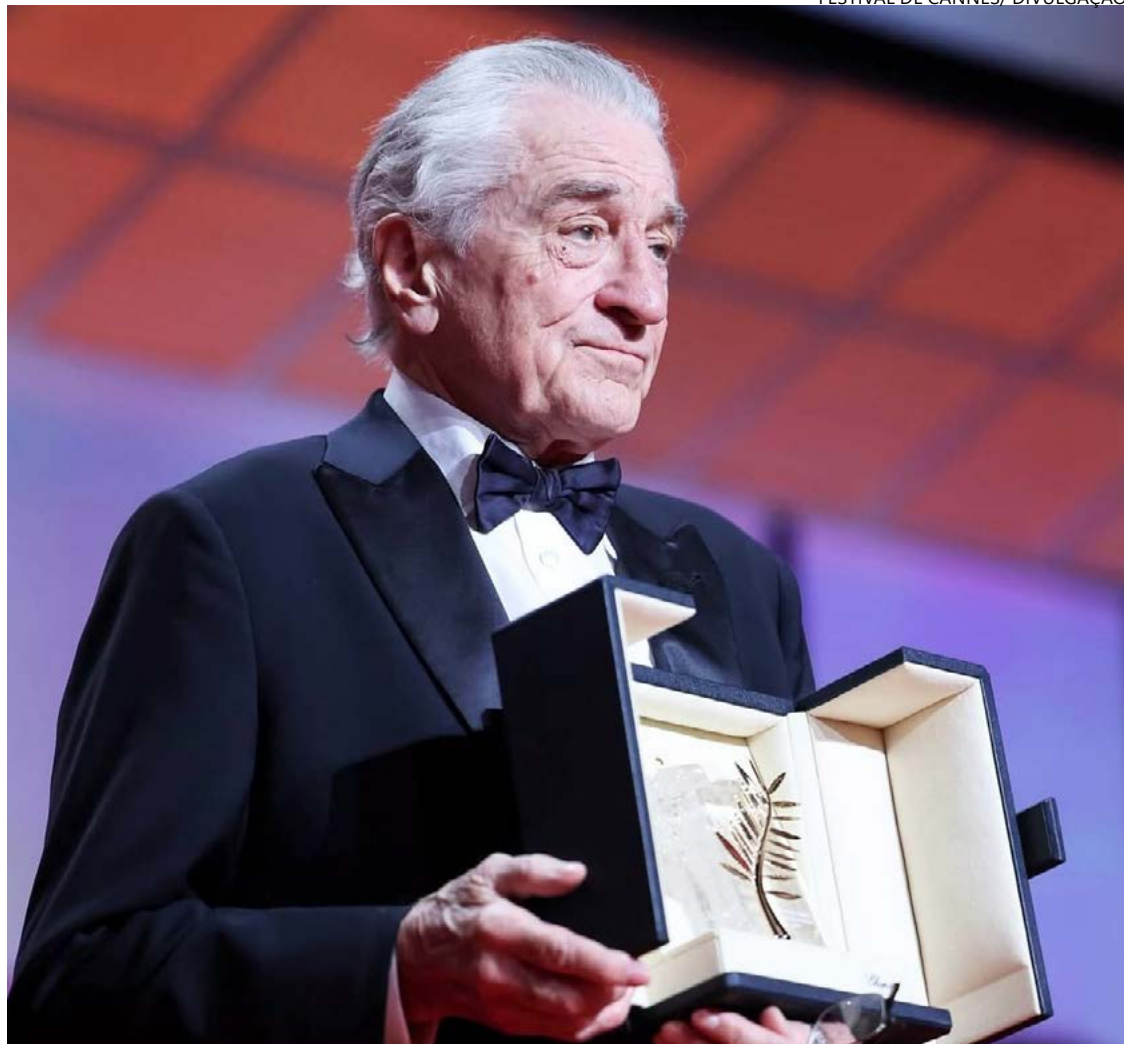
Artista recebeu Palma de Ouro honorária na abertura do Festival de Cannes

Na semana passada, o presidente americano taxou em 100% filmes gravados fora dos Estados Unidos, decisão que veio na