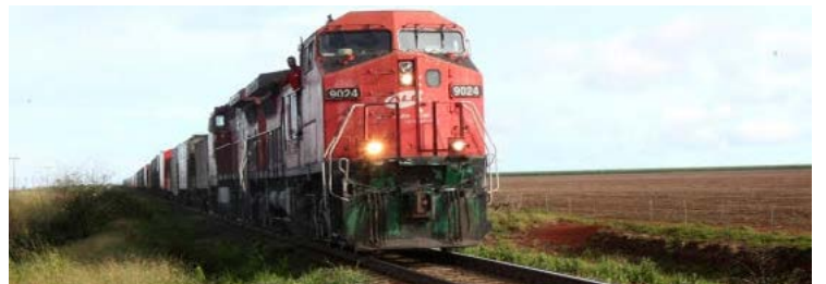
Traçado da ferrovia Brasil-Peru corta grande parte de Goiás

China manifestou interesse em negociar a construção de ferrovias, enfatizando a Bioceânica Brasil-Peru que favorece Goiás