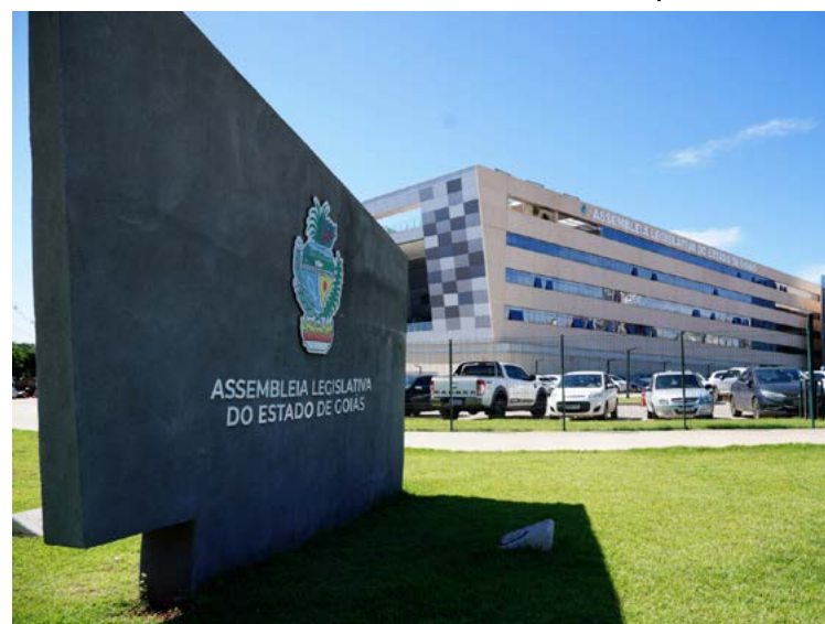
Fachada da Assembleia Legislativa: deputados querem secretários-candidatos fora do governo

Legalmente, o prazo para desincompatibilização é abril de 2026; Caiado não deve atender pedido