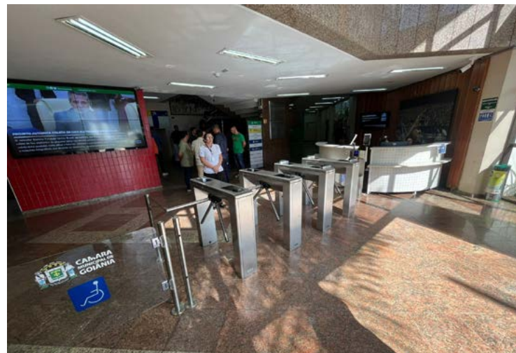
Entradas do Legislativo serão monitoradas com detectores para evitar entrada de armas

Comissão técnica analisará instalação de equipamentos para garantir mais segurança no Legislativo de Goiânia