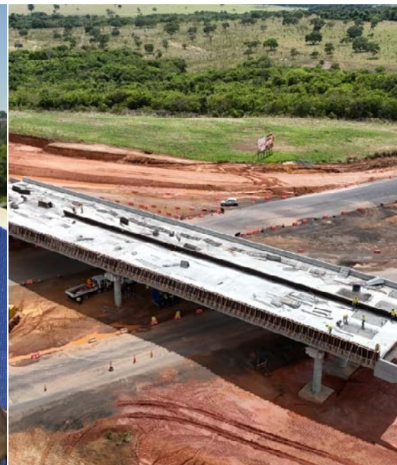
Obra em execução no Estado: além do Fundeinfra, maior parte da carteira de obras é executada com recursos do Tesouro Estadual

andamento ou entregues, alcançando volume recorde de investimentos em pavimentação e modernização da malha viária, com implantação de estruturas completas: viadutos, pontes, trevos, bueiros, passarelas de pedestre etc. Entre essas ações, destacam-se obras consideradas demandas históricas, como a duplicação da GO-330 entre Catalão e Ipameri, aguardada há décadas pelo setor produtivo e pela população, e que já está com o primeiro subtrecho em execução. O trabalho não se limita às rodovias estaduais. A Goinfra oferece um suporte às prefeituras em programas de infraestrutura que alcançam desde estradas vicinais até ruas e avenidas urbanas. O Goiás em Movimento Municípios e as Patrulhas Mecanizadas se tornaram programas fundamentais para os prefeitos e simbolizam a marca do atual governo: uma gestão municí-