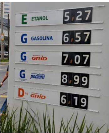
Nove postos de combustíveis foram autuados pelo Procon Goiás

Os postos autuados têm agora 20 dias para apre-