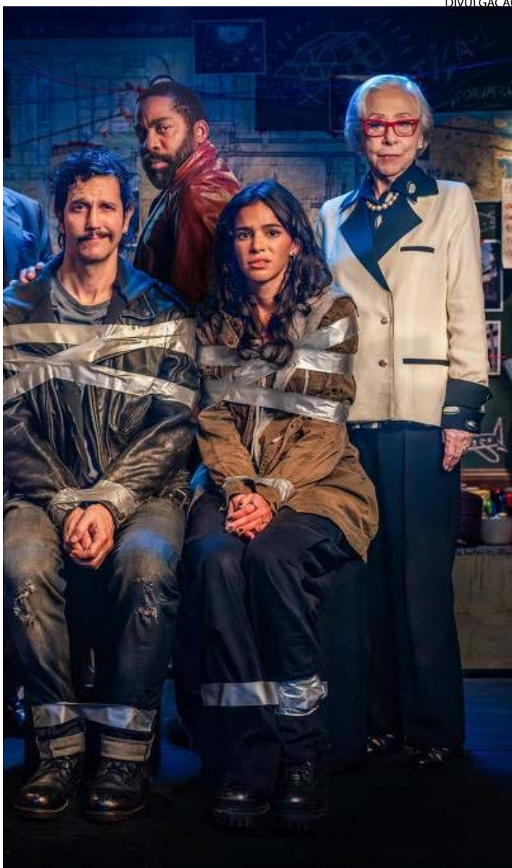
Elenco estelar: atriz (à direita) contracenando com atores famosos durante a gravação do filme