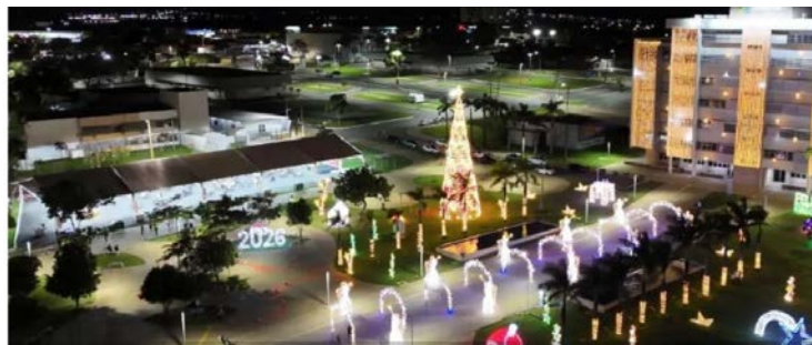
Objetivo do evento é criar ambientes de convivência e encanto, afirma o prefeito Leandro Vilela

O prefeito Leandro Vilela afirma que o objetivo é criar ambientes de convivência e encanto.