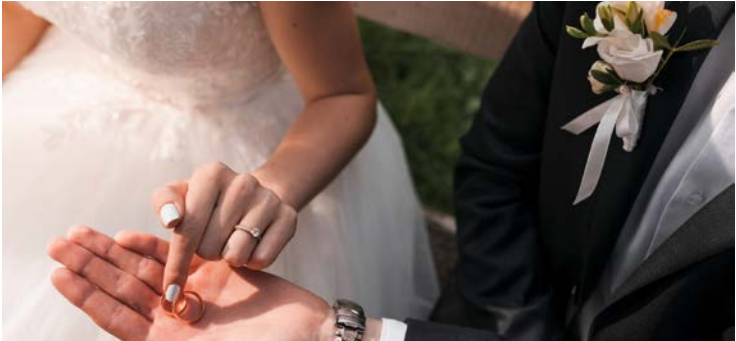
Levantamento integra a Pesquisa de Estatísticas do Registro Civil

Goiás registra avanço expressivo no número de casamentos em 2024. O estado soma 33,6 mil uniões no ano e apresenta crescimento de 3,5% em comparação com 2023, índice quatro vezes maior que a média nacional. O levantamento integra a Pesquisa de Estatísticas do Registro Civil, divulgada pelo IBGE.