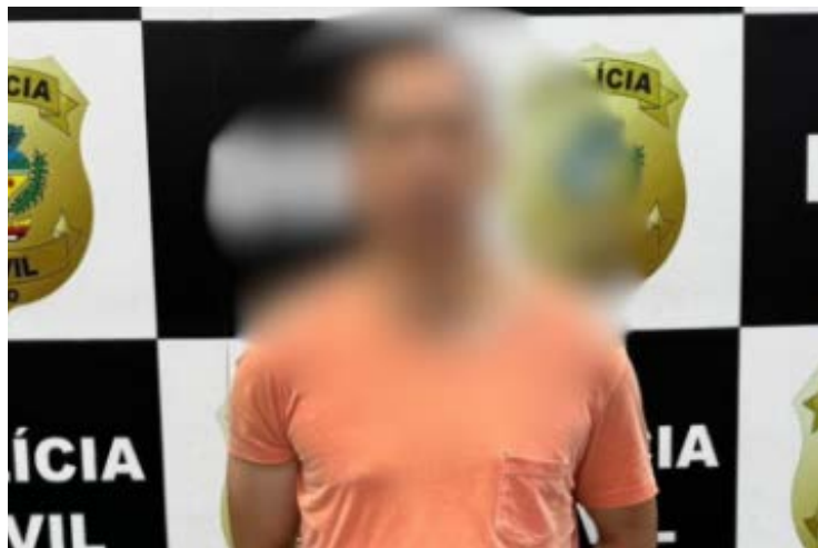
Polícia chegou ao investigado após compartilhar informações

Mandado de prisão preventiva foi expedido pelo Poder Judiciário de Fortaleza, capital do Ceará