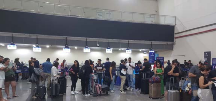
Aeroporto de Goiânia lotado devido ao atraso de voos

Uma moradora de Goiânia enfrentou um verdadeiro caos ao tentar voltar de avião à capital. O voo de Guarulhos, que deveria durar cerca de 1h20, transformou-se numa exaustiva jornada de quase 12 horas,