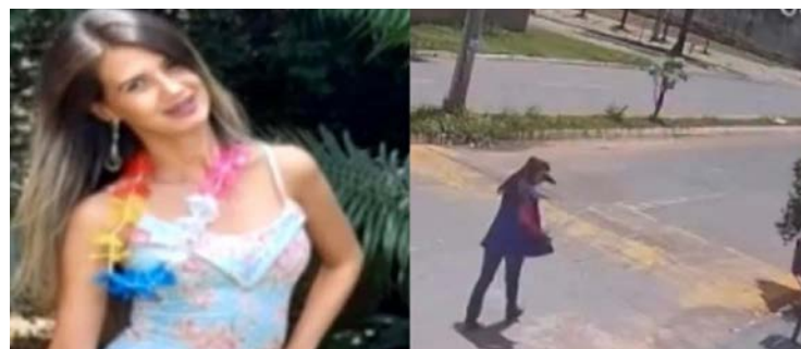
Câmeras de segurança registraram o acidente com servidora