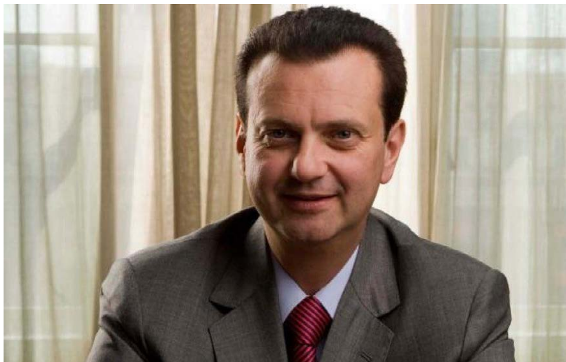
Gilberto Kassab, presidente do PSD nacional, descarta aliança com Flávio Bolsonaro

Em entrevista à Folha de S.Paulo, o líder do PP na Câmara, o deputado dou-