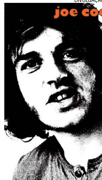
“Joe Cocker”: pesquisador afirma que obra deve ser lembrada pela intensidade musical

Por fim, o pesquisador aconselha que o feriado natalino seja ao som de “Very She & Him Christmas”, de 2011. “Trata-se de um LP delicado, bonito, calmo, singelo, acessível a qualquer ouvido, recomendado para escutar relaxado, sentado ou dançando”, preconiza.