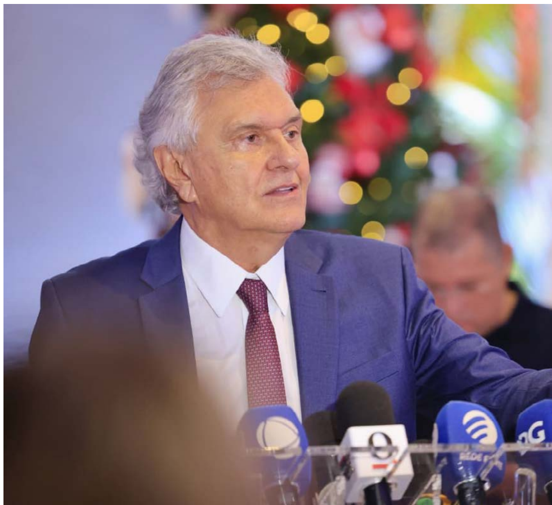
Após processo de reestruturação econômica, iniciado em 2019, Goiás é o primeiro estado do país a aderir ao Propag

Caiado destacou que a adesão ao novo programa representa uma mudança estrutural na gestão da dívida pública estadual. “Nós já asseguramos os R$ 4,1 bilhões referentes à amortização extraordinária prevista no Propag, o que impede a incidência de novos juros sobre a dívida. Isso é um fato inédito na história de Goiás”, destacou. A medida, segundo o governador, contribui para reduzir o peso do endividamento e ampliar a capacidade de planeja-