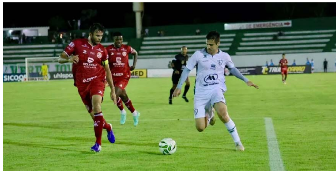
Partida acontece nesta quarta-feira (11), às 19h30, no Estádio Jonas Duarte, em Anápolis