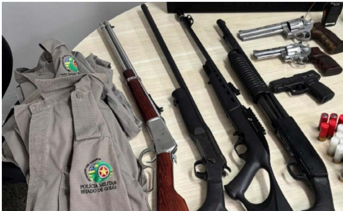
Farda e armas foram encontradas com o suspeito: ele não integra a PM, mas usava uniforme para amedrontar

Delito teria ocorrido em novembro do ano passado em Aparecida de Goiânia; homem preso por injúria é suspeito de impedir ritual afro