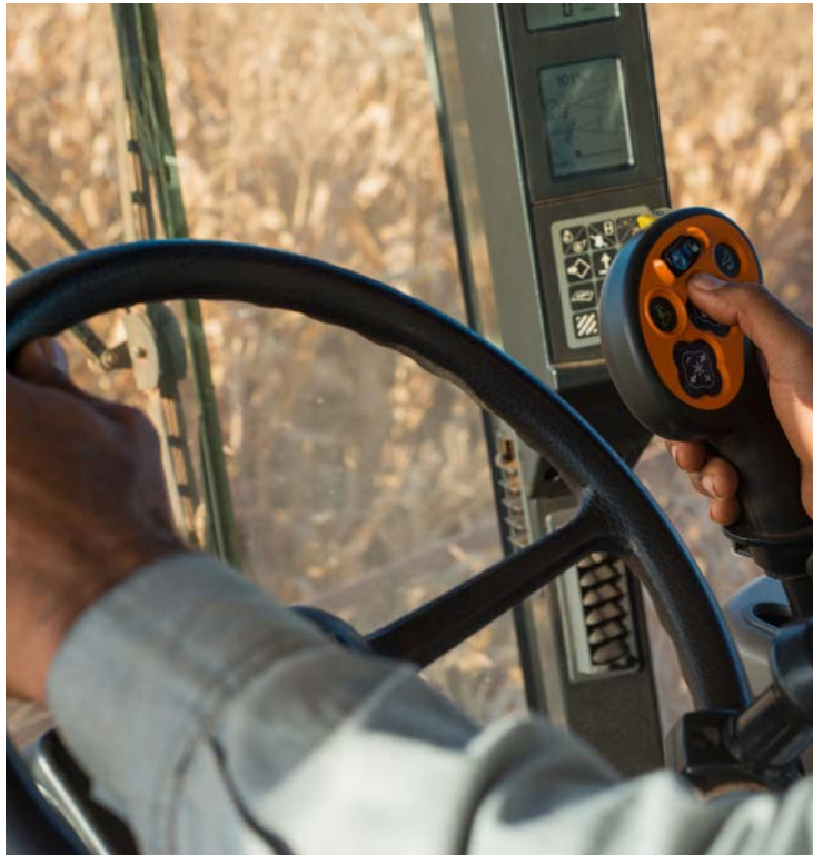
Goiás encerrou 2025 com crescimento na geração de empregos formais na agropecuária