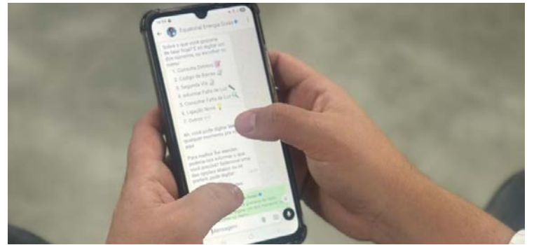
Ao clicar em "Pagar Agora", cliente é direcionado para uma página segura