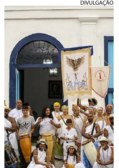
Grupo ganhou notoriedade nos anos 1990