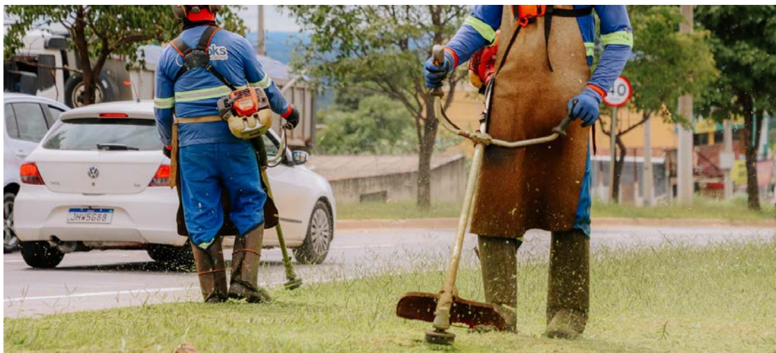
Execução de serviços de roçagem nas avenidas Dom Emanuel e Progresso