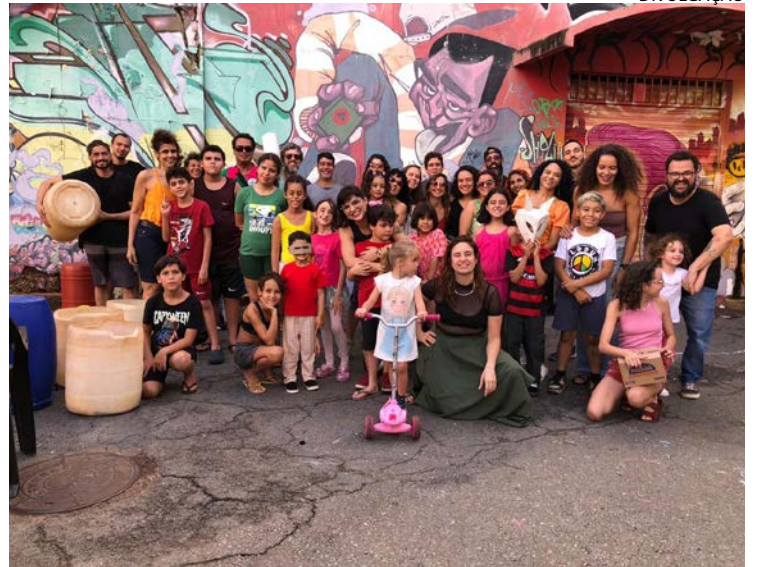
Programação inclui brinquedos infantis e discotecagem