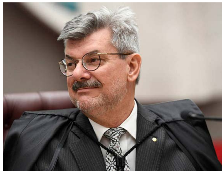
Juiz Marco Aurélio Gastaldi Buzzi, acusado de assédio sexual

Sessão extraordinária estabelece que magistrado fica impedido de exercer funções