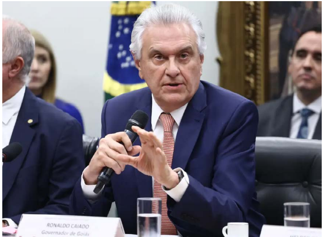
Ronaldo Caiado: andar o país para se consolidar como o candidato do PSD ao Planalto

Segundo ele, a pulverização de nomes pode ser uma vantagem para a direita na corrida presidencial. “Imagine um candidato só enfrentando o bombardeio de um governo que não tem escrúpulo com gastos públicos, cada vez mais populista, com um presidente que não tem responsabilidade com o arcabouço fiscal”, argumentou o goia-