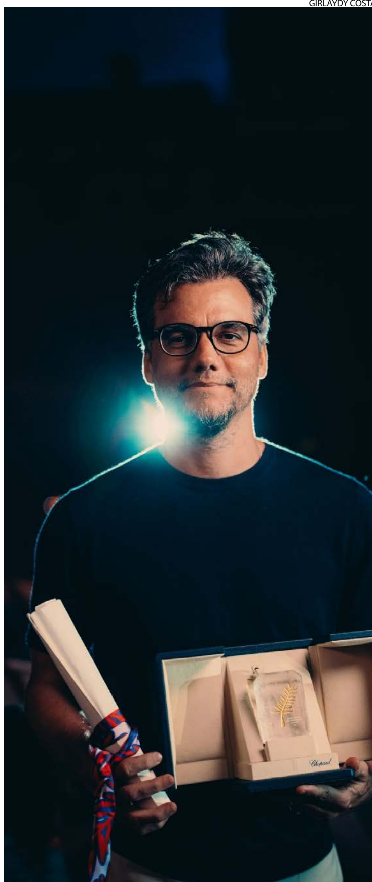
Wagner se coloca como nome sólido para disputa

O estilo autoral do diretor combina comentário político, suspense e observação social, com uma estética caracterizada por atmosferas densas, enquadramentos precisos e narrativa detalhada. Com "O Agente Secreto", Kleber Mendonça Filho reafirma seu lugar no circuito internacional, reforçando o protagonismo do cinema brasileiro autoral e mostrando que a produção nacional continua a impressionar e influenciar públicos e críticos ao redor do mundo.