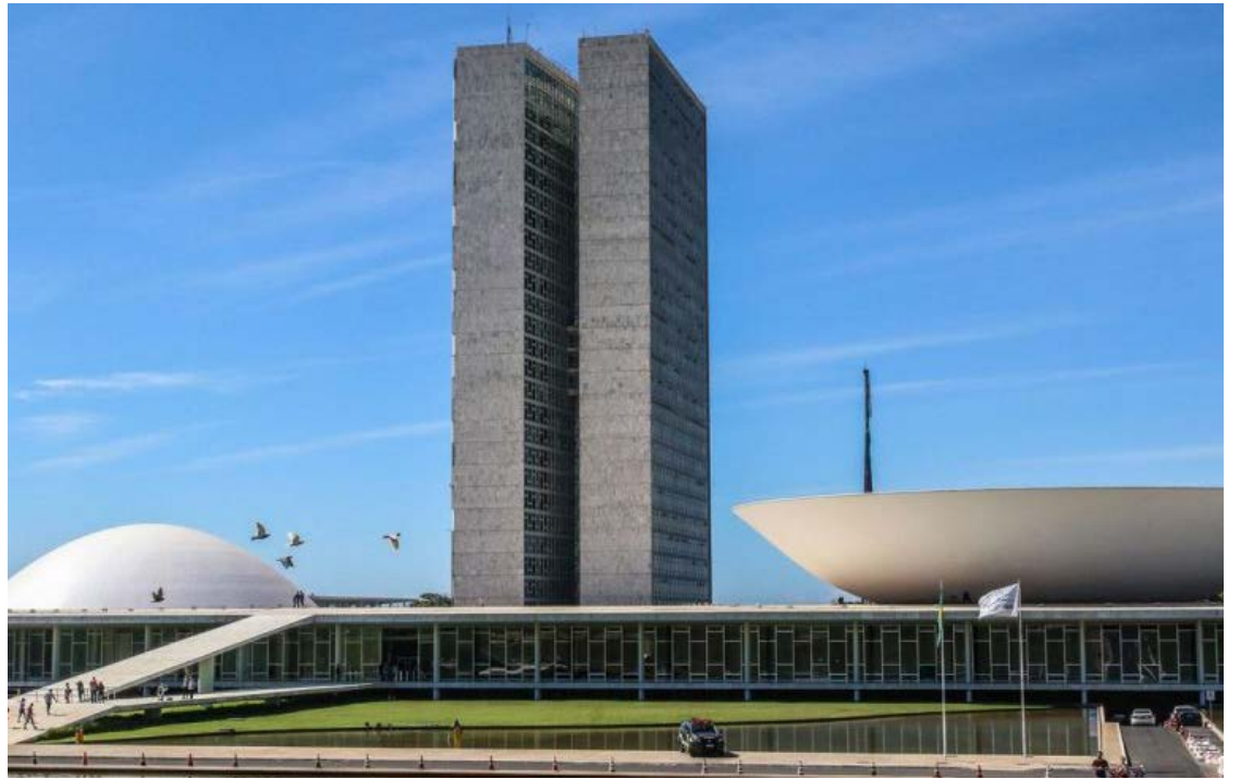
Congresso Nacional contribui para piorar o índice que avalia a corrupção no Brasil

No relatório, a Transparência Internacional aponta sinais de fragilidade no enfrentamento à corrupção ao longo de 2025. Entre os fatores destacados estão o crescimento expressivo no volume de emendas parlamentares e episódios de fraude envolvendo o Instituto Nacional do Seguro Social (INSS) e o Banco Master. Para a entidade, tais ocorrências indicam dificuldades estruturais na consolida-