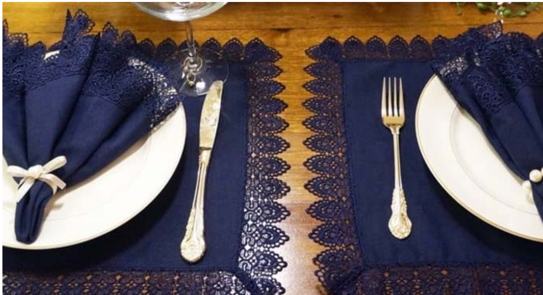
Arte da mesa posta: origem remonta à Europa nos séculos XVIII e XIX

Mesa Posta transcendeu mera função de servir alimentos, tornando-se uma linguagem visual e, como tal, é rica em nuances e expressões