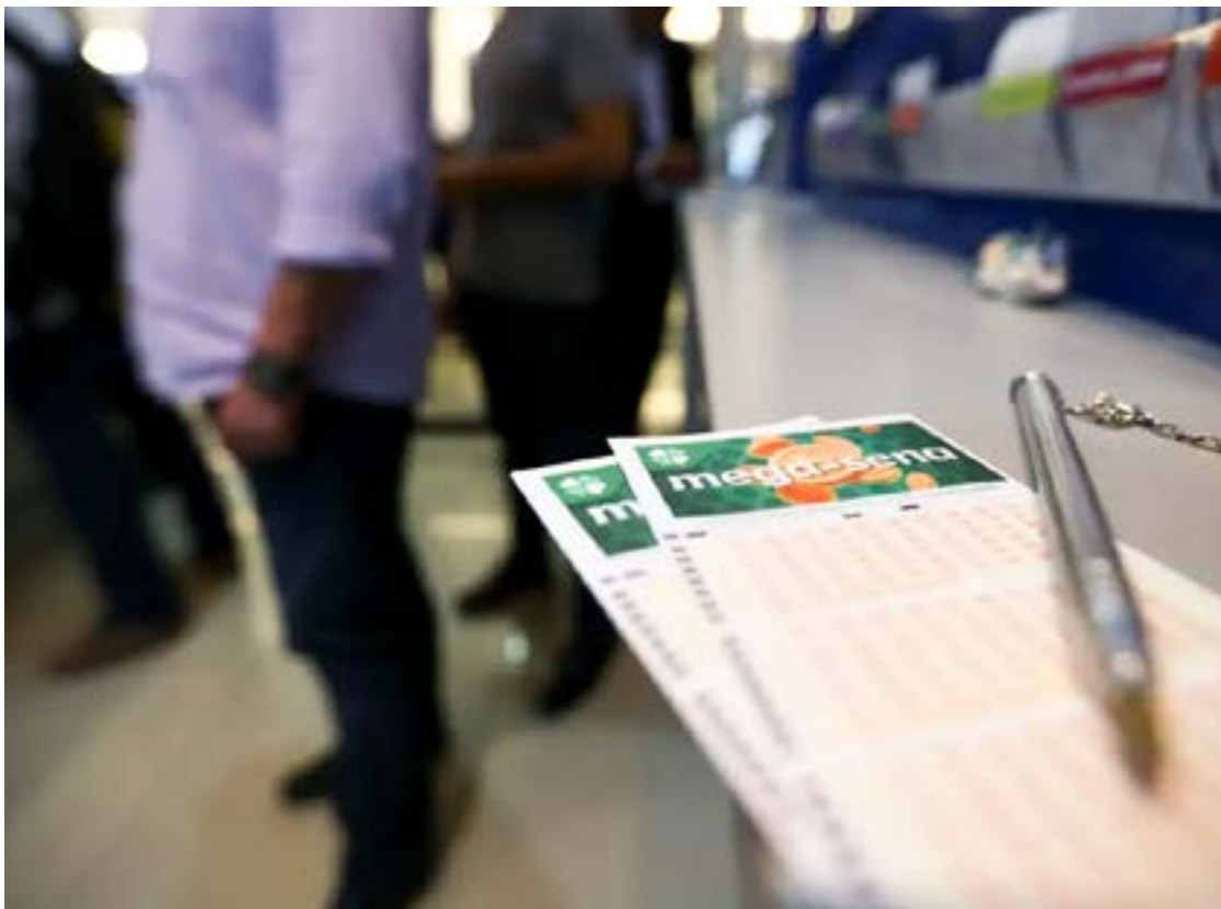
Aposta simples, de R$ 5, foi realizada na Loterias Nova Vila

Uma aposta de Goiânia acerta as seis dezenas do concurso 2.882 e o ganhador ou ganhadora vai levar o prêmio de R$ 50.722.168,24