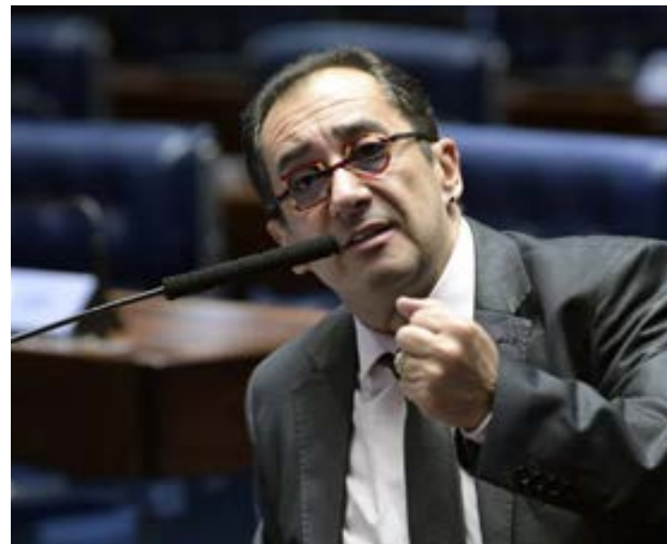
Jorge Kajuru: irritado com o presidente Lula

Senador se queixa de tratamento desigual em relação a Vanderlan e cobra prestígio do Planalto