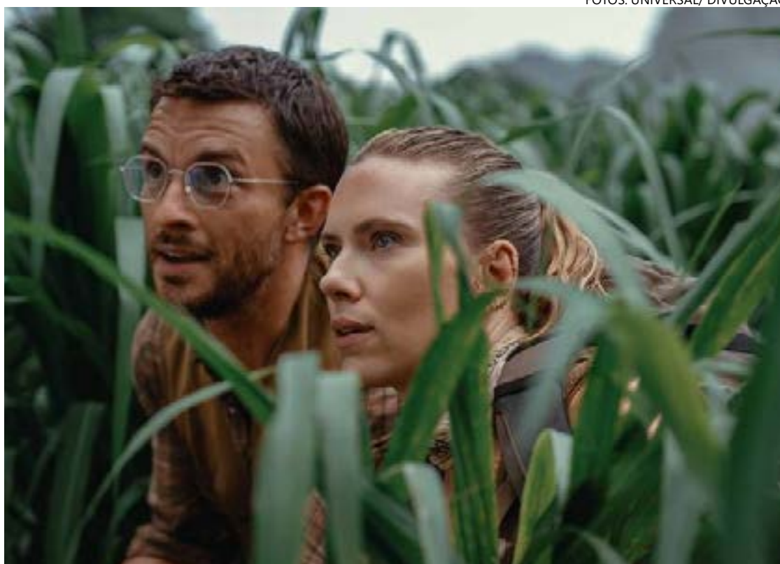
Jonathan Bailey e Scarlett Johansson dividem cena de 'Jurassic World: Recomeço'

No mundo em questão, os dinos já são história antiga. O público se cansou deles e os animais remanescentes sobrevivem