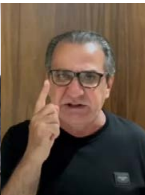
Silas Malafaia (Vitória em Cristo)