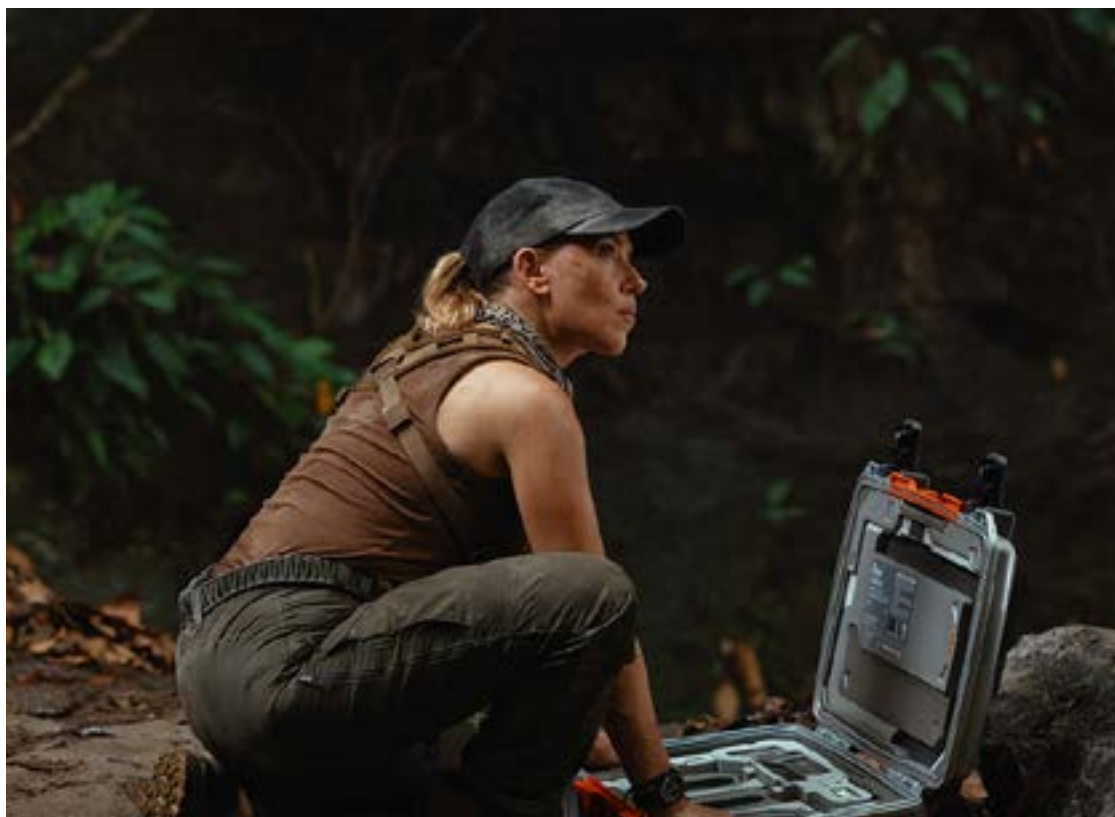
Johansson interpreta no longa agente especializada em missões ultrassecretas

perto da linha do Equador. A ex-militar Zora, papel de Johansson, lidera o time, que viaja no barco de Duncan, vivido por Ali, e tem entre seus membros um desajeitado cientista, que vai questionar o uso da patente médica, e um representante da empresa — malvado, é claro.