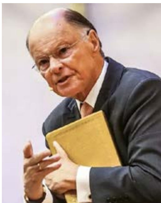
Edir Macedo (Universal)

Religiosos entram para a política com base num discurso moralista – não apenas contra os maus políticos, como o que seriam os maus costumes em geral. Apresentam-se como restauradores da ordem, infensos à corrupção e