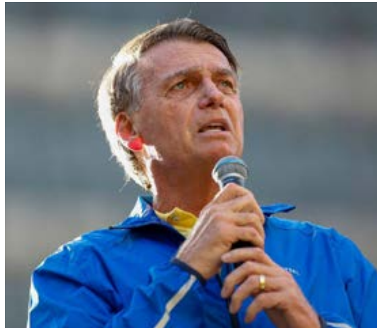
Jair Bolsonaro: agenda política suspensa pelos médicos

Médicos evitam explicações sobre o verdadeiro quadro de saúde do ex-presidente da República