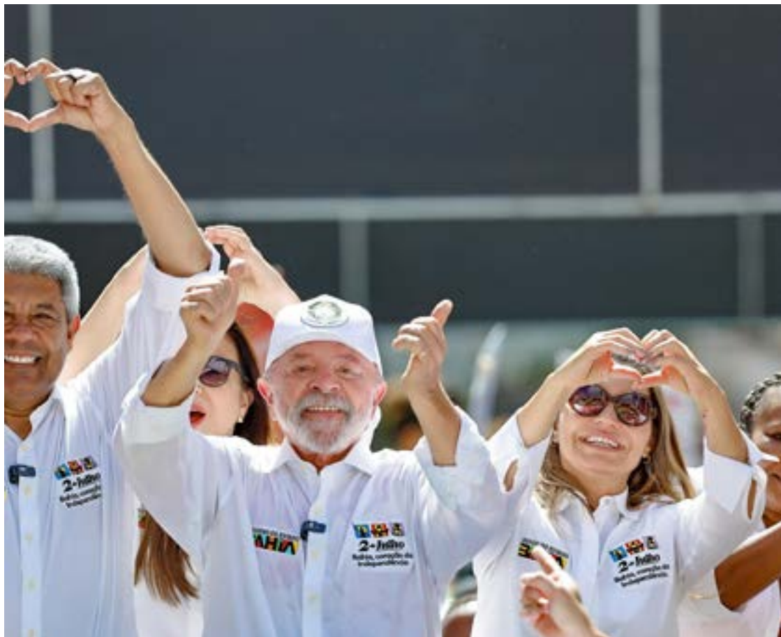
Presidente Lula durante evento na Bahia com Janja e governador Gerônimo Rodrigues

O petista também classificou como "absurda" a decisão do presidente da Câmara, Hugo Motta (Republicanos-PB), de colocar em votação a derrubada do decreto do aumento