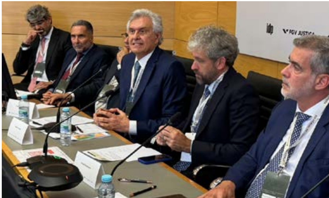
Ronaldo Caiado participa de painel sobre política de drogas em Lisboa (Portugal)

O governador citou o Rio de Janeiro e regiões da Amazônia como exemplos de áreas dominadas por facções, mas ressaltou que o problema já ultrapassou fronteiras nacionais. “Facções brasileiras estão operando na América Latina e na Europa. E onde o crime