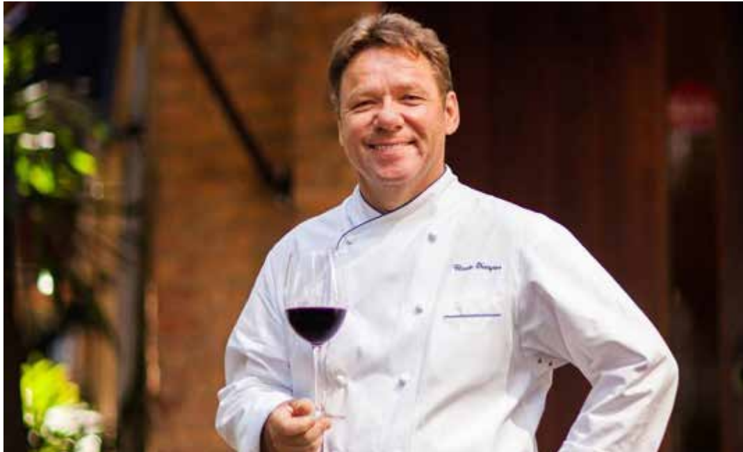
Poesia dos sabores: cozinha de Claude alimenta o corpo e abraça a alma

Cucina Mia, restaurante do renomado chef francês Claude Troisgros, elevará cenário gastronômico de Goiânia com requinte, satisfação e criatividade