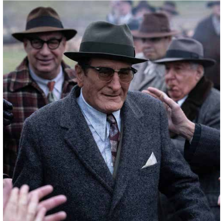
Astro do cinema: Robert de Niro interpreta dois gângsteres