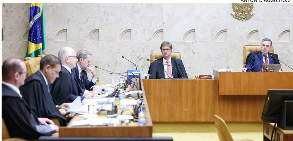
Ministros discutiram nos bastidores para reduzir discordâncias sobre detalhes da tese

Além ainda do trecho sobre entrevistas ao vivo, o terceiro ponto diz, por fim, que, quando for constatada a falsidade das declarações, deve haver remoção de ofício, ou seja, por decisão proativa da Justiça ou por notificação da vítima quando a imputação permanecer disponível em plataformas digitais, sob pena de