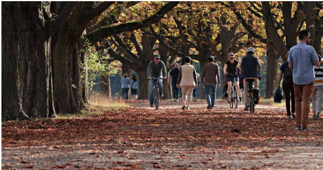
Estação teve início nesta quinta-feira e termina no dia 20 de junho

A estação é considerada de transição entre o verão quente e úmido e o inverno frio e seco, principalmente no Brasil Central