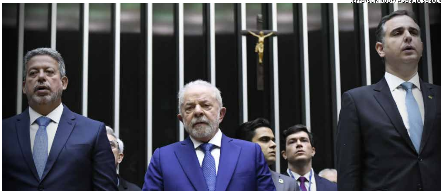
Presidente quer estreitar diálogo com cúpula tanto da Câmara quanto do Senado em crise de popularidade

do petista afirma que há também um simbolismo forte de reunir os atuais e ex-presidentes da Câmara e do Senado, num acento de unidade com o Legislativo.