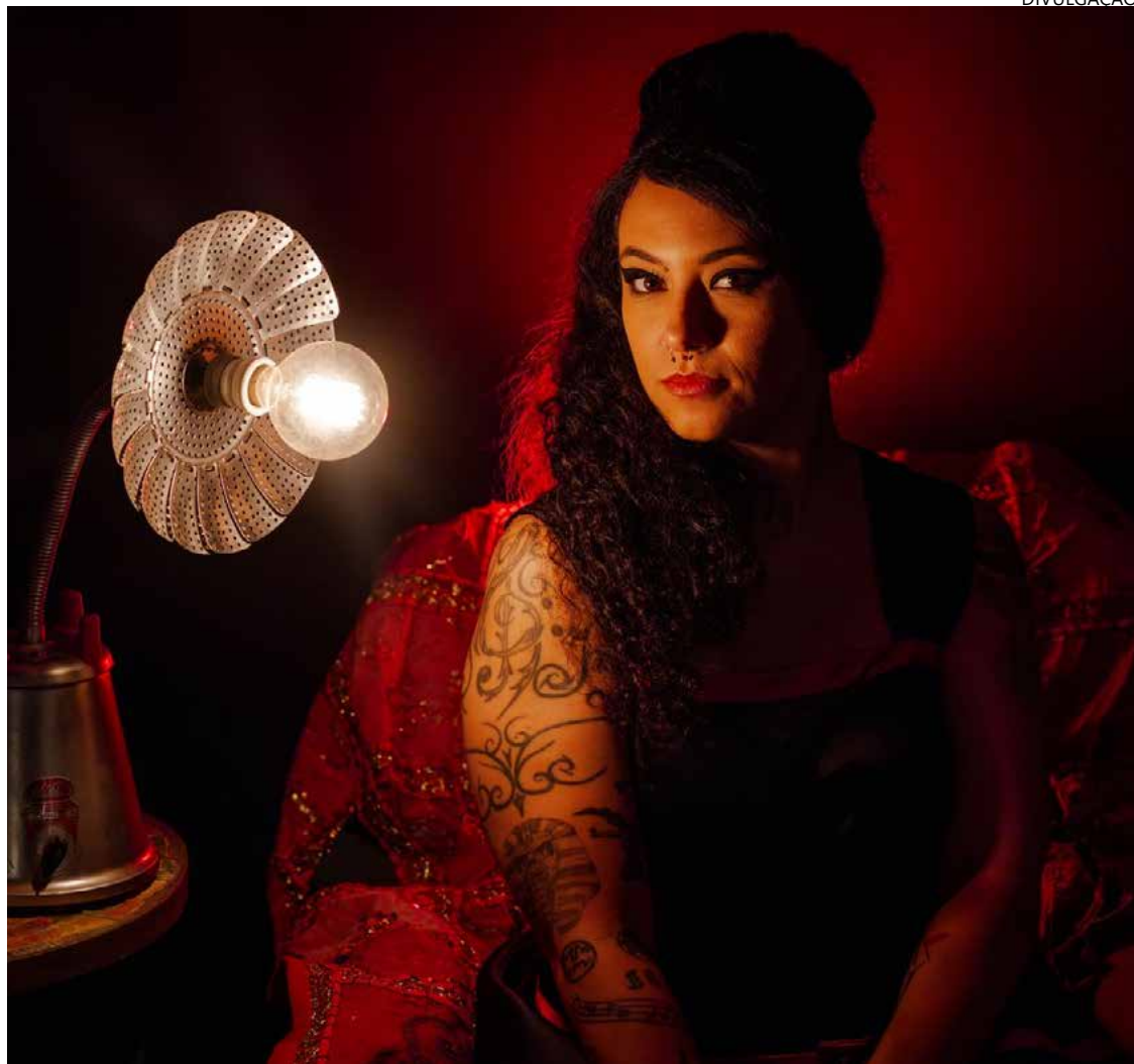
Espectáculo mostra grandiosidade do legado deixado pela artista londrina

Uma das vozes mais marcantes a surgir neste século 21, Amy Jade Winehouse nasceu em 14 de setembro de 1983. Ela teve ascensão meteórica na música, com os discos "Frank" (2003) e "Back To Black" (2006), ambos criados numa sonoridade que