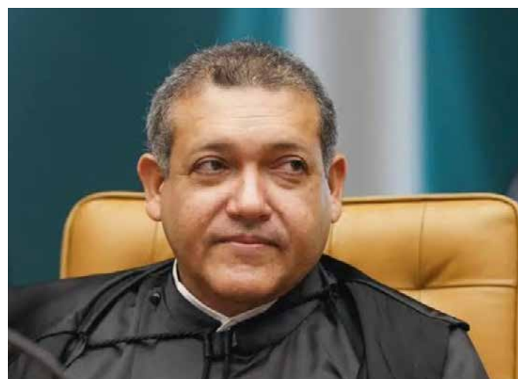
Ministro Kássio Nunes Marques: voto no Supremo já era previsível

O esquema de segurança foi coordenado pela Secretaria de Polícia Judicial, com o apoio da Secretaria de Segurança Pública do Distrito Federal e outros órgãos par-