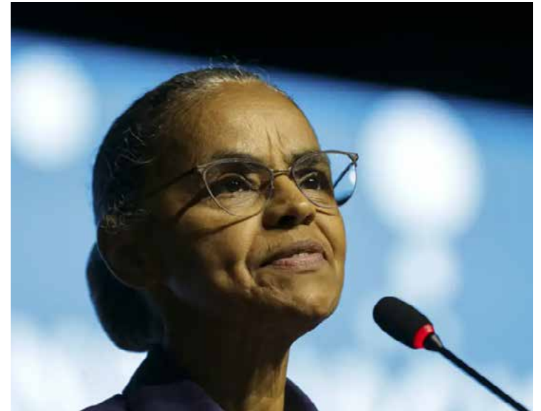
Deputadas e senadoras de diversos partidos saíram em defesa de Marina Silva

Pedido enviado ao Conselho de Ética do Senado contra Plínio Valério é assinado por parlamentares de dez partidos