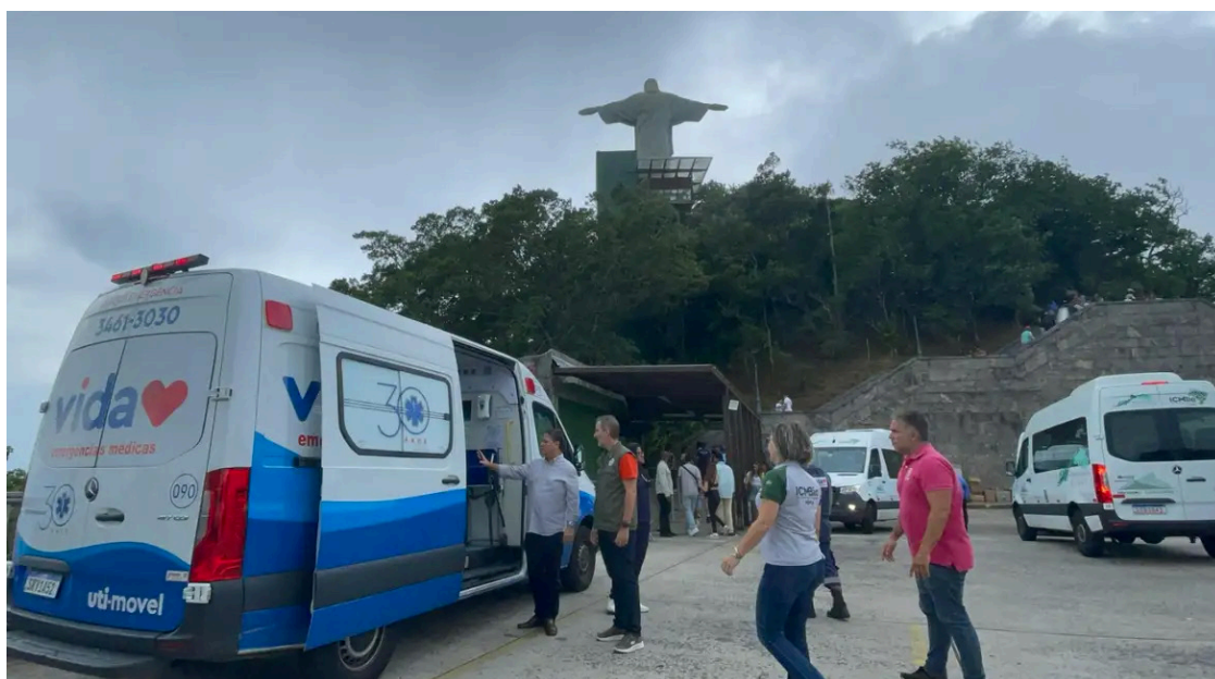
Homem de 54 anos passou mal; família diz que posto estava fechado

A revitalização e as obras de acessibilidade serão feitas em duas fases. A primei-