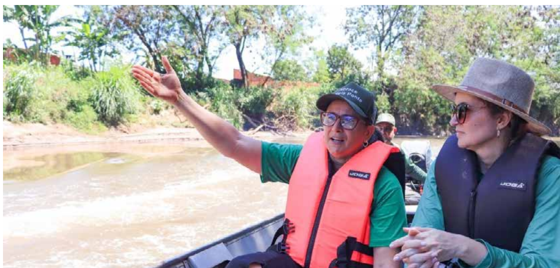
Projeto rompe com estigma de que o rio é local de descarte: pesquisadores investigam qualidade da água

A coordenadora destaca que o projeto rompe com o antigo estigma de que o rio é um local de descarte. "Existe aquela piada de que, se não presta, joga no Meia Ponte... e estamos mudando isso", afirma. Muitos moradores que participam como voluntários ou visitam as estações ambientais se surpreendem com a beleza do rio e passam a enxergá-lo de forma mais positiva. As crianças, em especial, ficam encan-