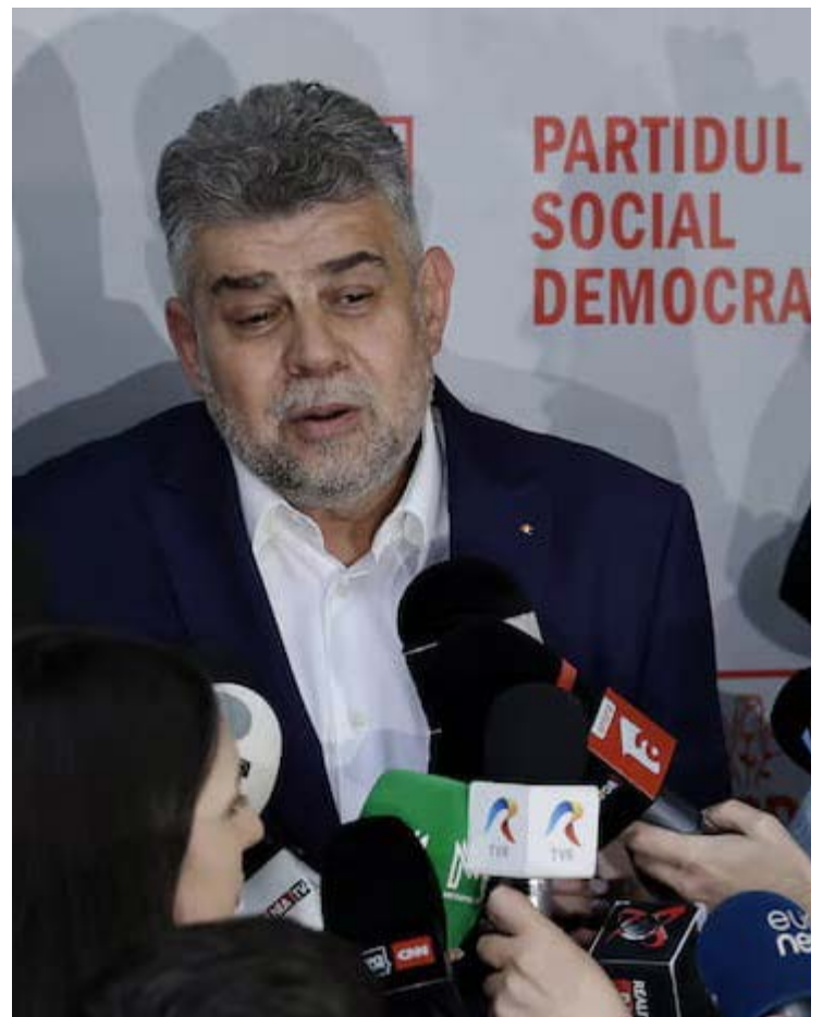
Primeiro-ministro social-democrata Marcel Ciolacu deixa cargo após vitória da extrema direita nas eleições

George Simion, o vencedor do primeiro turno, é conhecido por suas posições nacionalistas radicais e já declarou intenção de restaurar a chamada “Grande Romênia”, além de ser crítico ferrenho da União Europeia e de manter posturas alinhadas ao populismo internacional.