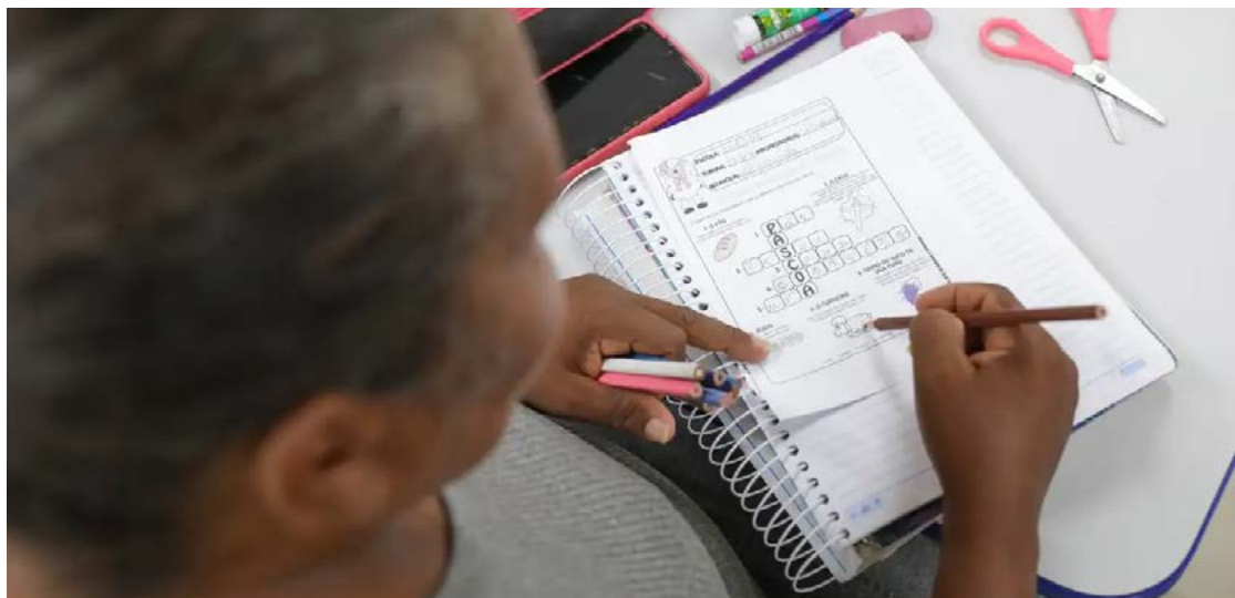
Foram pesquisadas 2.544 pessoas em todas as regiões do país

Brasil estagnou na redução do analfabetismo funcional e a condição atinge 29% da população de 15 a 64 anos