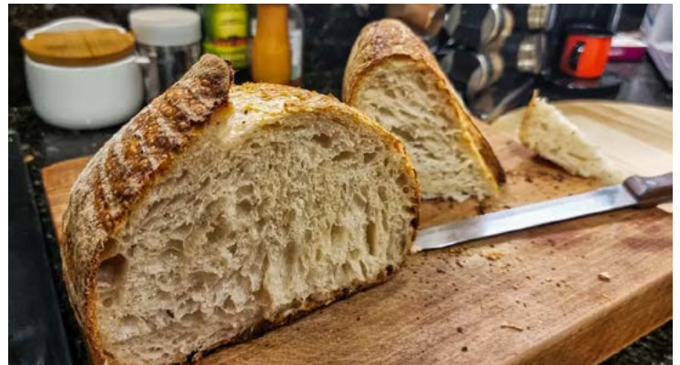
Produção tem aumento de 10,92% em relação ao ano anterior

Segundo estudo realizado pelo Instituto de Desenvolvimento das Empresas de Alimentação, o faturamento do setor alcançou R$ 153,36 bilhões em 2024