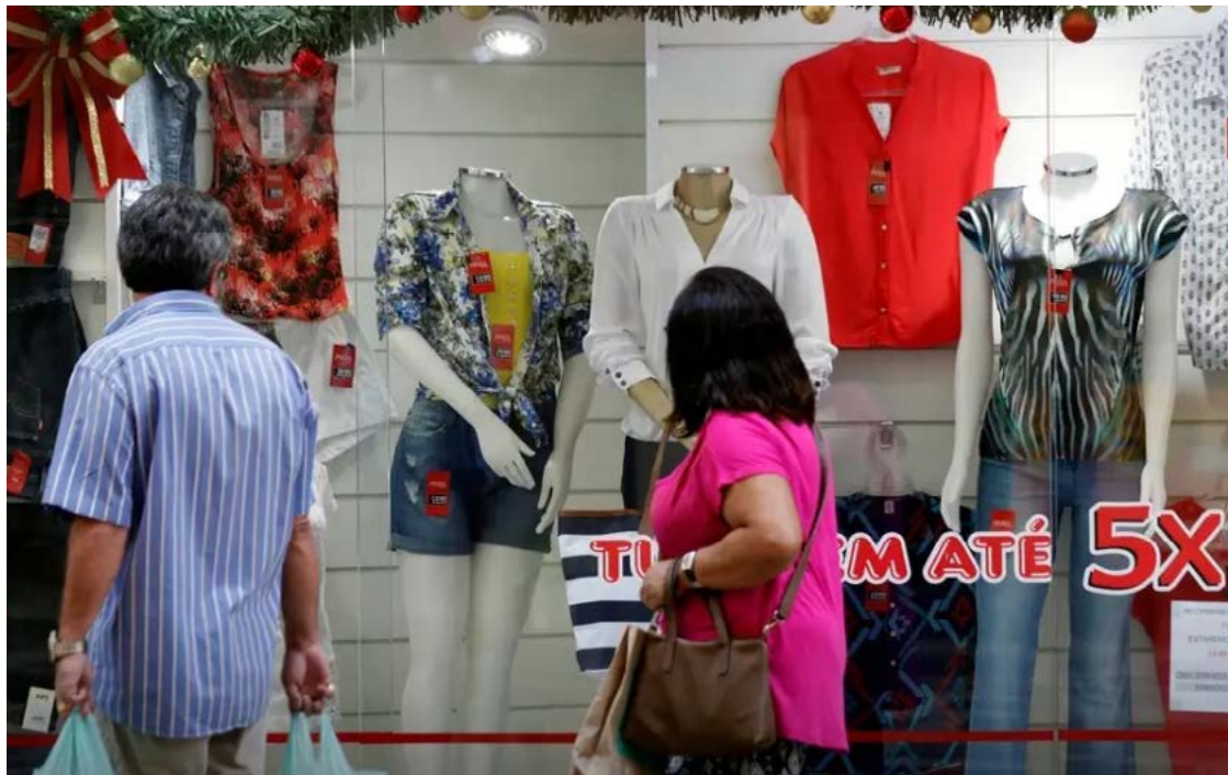
Quem deseja ofertar presentes para as mães precisa pesquisar bastante: variações de preços ultrapassam 200%

Em Goiânia, pelo Procon municipal, a maior diferença registrada foi de 205,24% na banana nanica, item da cesta básica que variou de R$ 2,29 a R$ 6,99. Já no contexto do Dia