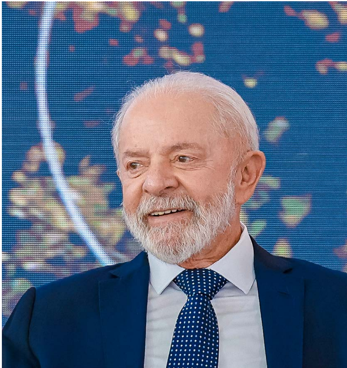
Presidente Lula da Silva promove mais uma mudança na sua equipe