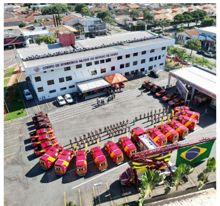
Imagem de cima das viaturas repassadas pelo governo: veículos ampliam descentralização