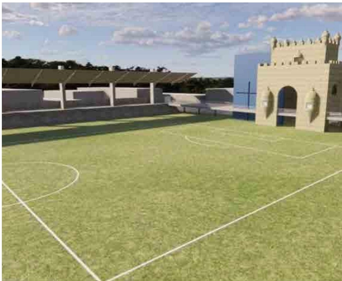
Imagens de projeto do novo cavalcódromo: atual coloca em risco população