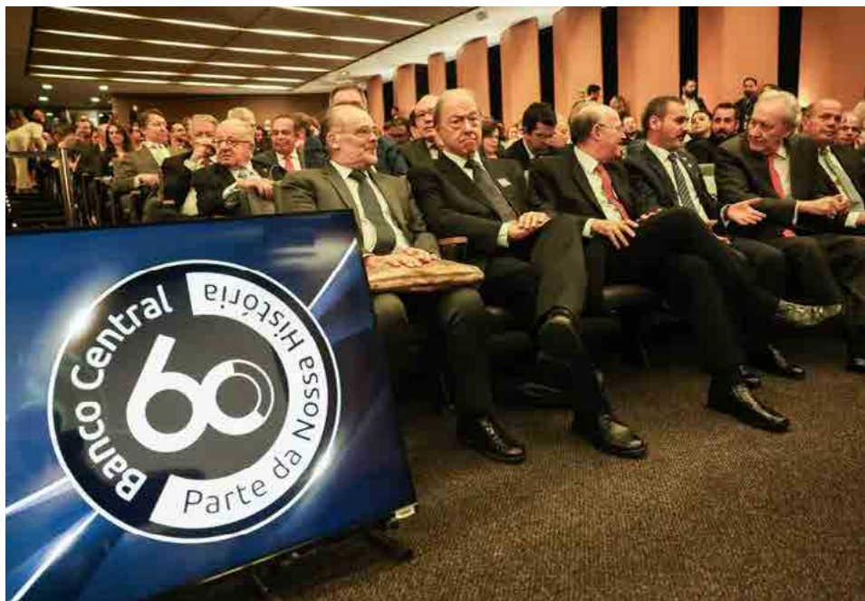
Evento em comemoração aos seus 60 Anos do Banco Central.