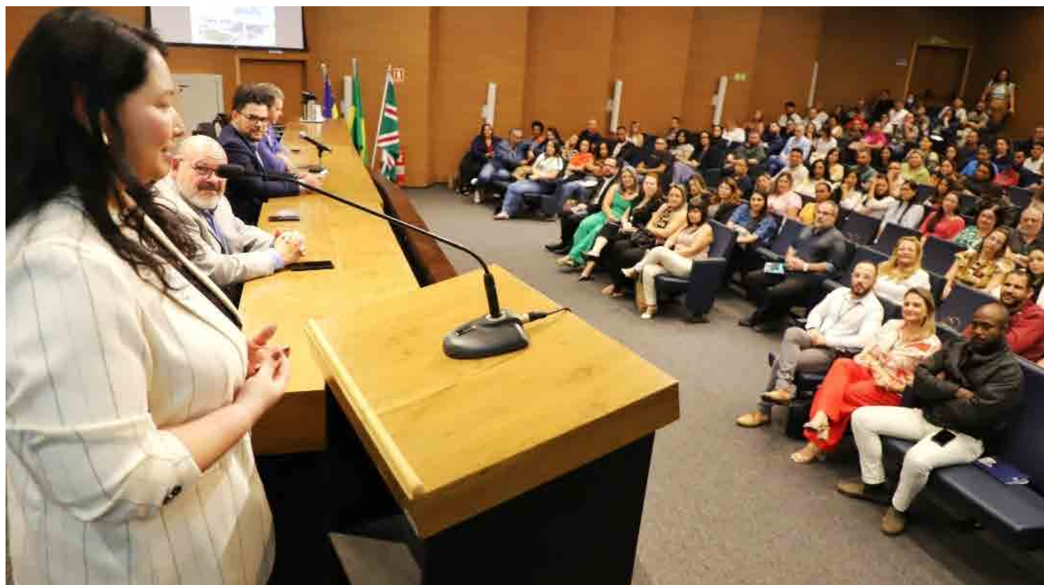
Capacitação que ocorre no auditório da Câmara Municipal é primeiro passo para eficaz funcionamento da unidade