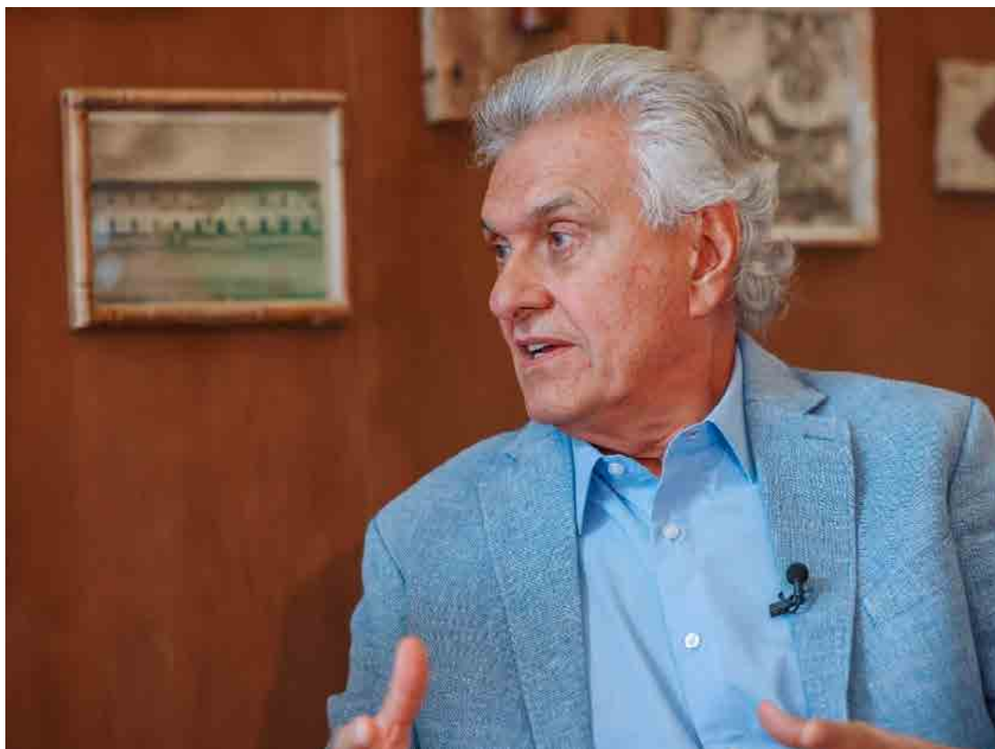
Ronaldo Caiado foi entrevistado na quarta-feira por emissora baiana: pré-candidato diz que Lula não consegue aplacar problemas de Segurança Pública

"O narcotráfico está crescendo na economia, no transporte urbano, nos postos de gasolina, nos supermercados e em vários outros