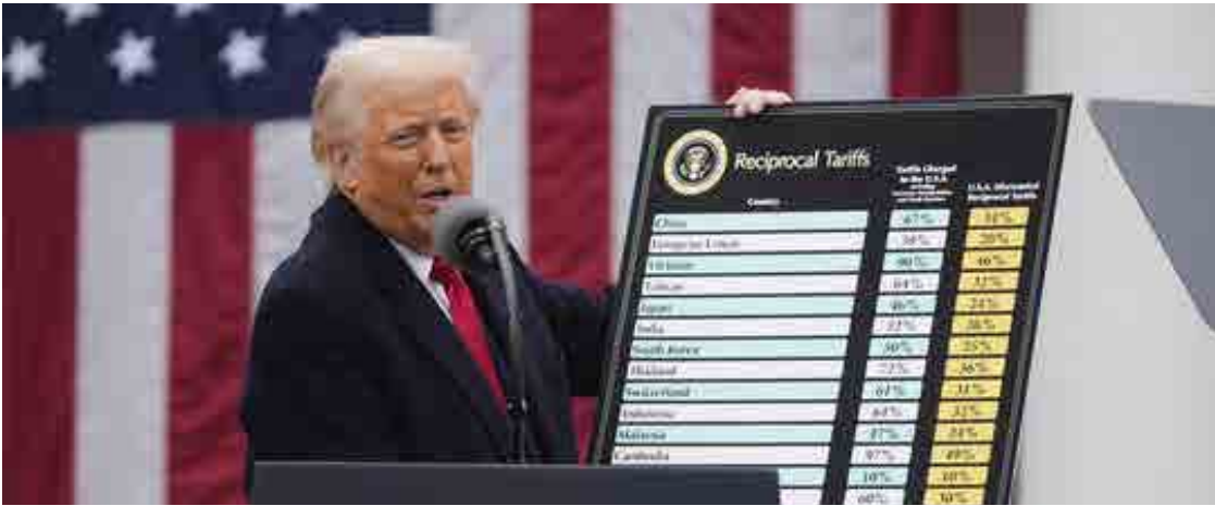
Trump justificou a medida como uma estratégia para reerguer a indústria americana

No entanto, analistas alertam que os efeitos a longo prazo das medidas protecionistas podem ser imprevisíveis. Enquanto Trump celebra o início do que chamou de "era de ouro" para os Estados Unidos, países afetados pelas tarifas começam a buscar alternativas para mitigar os danos econômicos.