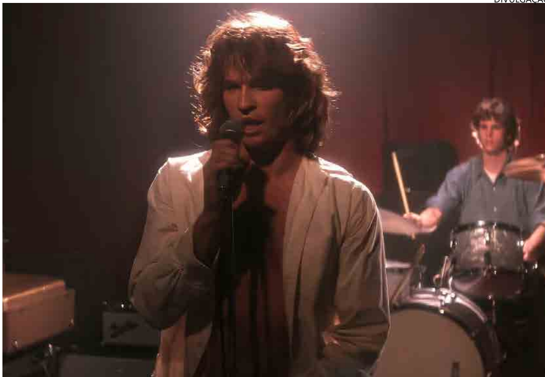
'The Doors': atuação se tornou celebrada pelos fãs do grupo californiano

Aos 17 anos, foi aceito na Juilliard School em Nova York, e se destacou como