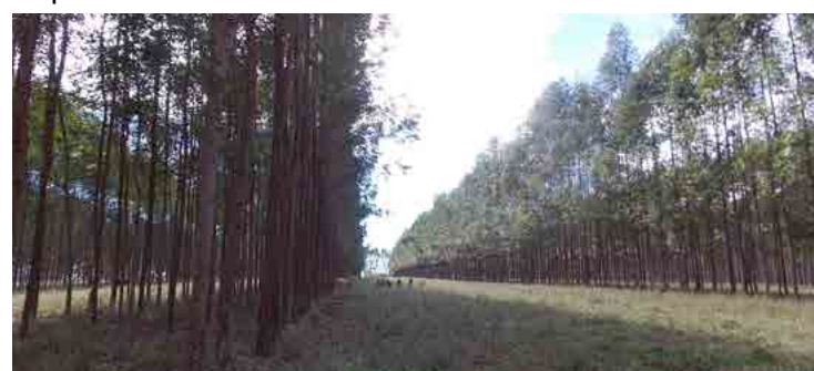
Acordo de Cooperação Técnica incentiva o estímulo à expansão do sistema sustentável

Os sistemas integrados lavoura-pecuária-floresta caracterizam-se como uma estratégia de produção sustentável que integra atividades agrícolas, pecuárias e florestais realizadas na mesma área