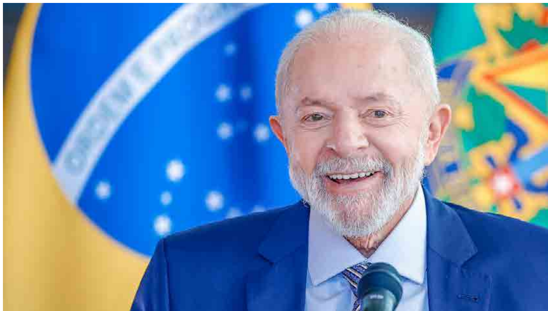
Presidente Lula vê sua aprovação derreter neste ano de 2025 com alto índice de rejeição

É a primeira vez que a taxa de desaprovação de Lula se descola da de aprovação, abrindo uma diferença de 15 pontos percentuais. Na rodada anterior, em janeiro, Lula era aprovado por